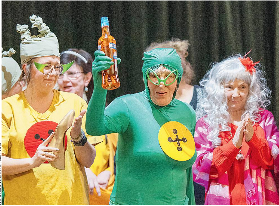
FOTOGRAFIE BISKUPIC - LUKASZ FIGA

Na świecie i w samym Zabrzu tyle się teraz dzieje, że nic nas nie jest w stanie zaskoczyć. Nawet widok kosmitek-seniorek dowodzących na teatralnej scenie domu kultury w Biskupicach podczas spektaklu Kiedy to zleciało? Czas wprawdzie pędzi jak szalony, ale z urodą aktorek-amateerek obchodzi się nadzwyczaj łagodnie, o czym na pewno niejednokrotnie słyszały w Dzień kobiet . (s)