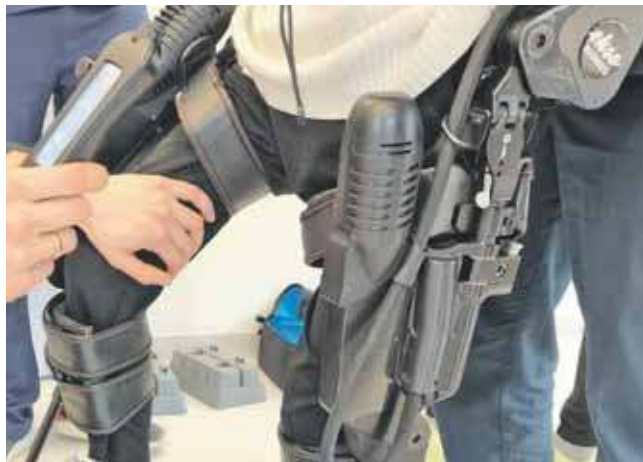
GCR wykorzystuje egzoszkielec Ekso GT firmy eksoBIONICS

Nawet jeśli przywrócenie pełnej zdolności do chodzenia nie jest możliwe, wykorzystanie egzoszkielecetu wpływa pozytywnie na organizm pacjenta – poprawia perystaltykę jelit, wspomaga kości i mięśnie, a także przyspiesza metabolizm. Dzięki temu rehabilitacja staje się bardziej kompleksowa i sku-