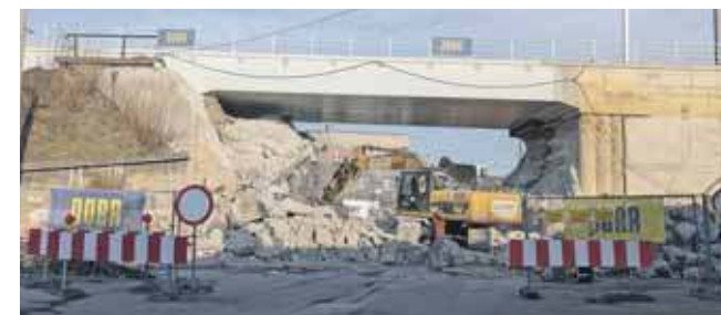
Prace przy wiadukcie mają potrwać do połowy roku