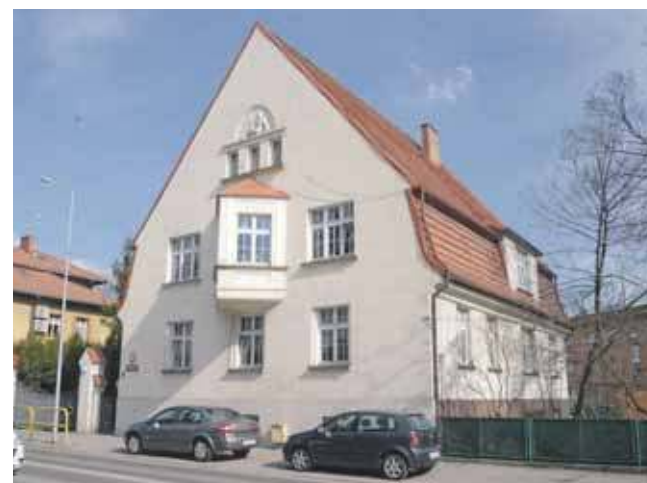
Ozdoba zgrabnie zaprojektowanej willi nawiązuje do pierwszego właściciela budynku