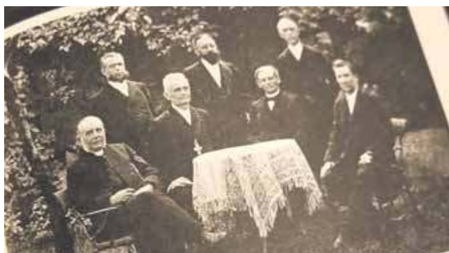
Generalna Kościelna Komisja Wizytacyjna

– Powstał tom przynoszący wiele nowego materiału