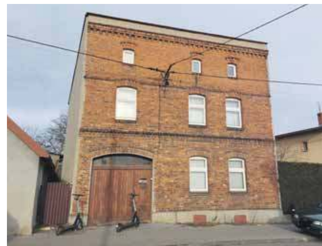
Od miasta można kupić m.in. dom przy ul. Górniczej

Data przetargu to 2 kwietnia, cena wywoławcza – 315 tys. zł (wadium: 63 tys. zł).