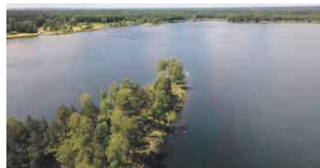
Robi się coraz cieplej i nad zalew Nakło-Chechło coraz chętniej zaglądają spacerowicze