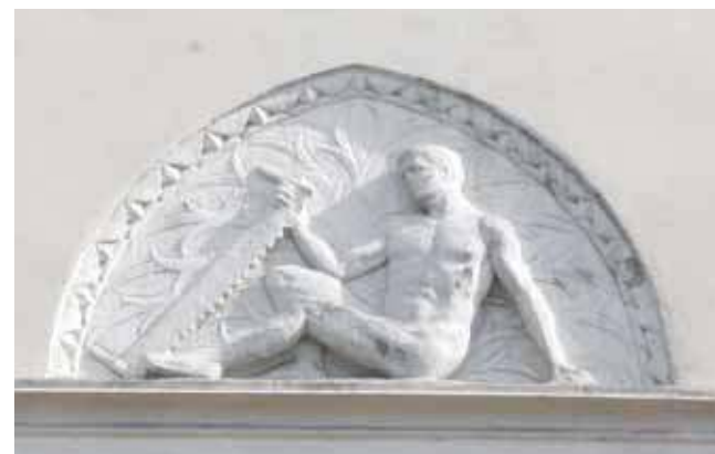
Skąd atletyczny pilarz na elewacji willi? Odpowiedź jest bardzo prosta

Obecnie w willi mieści się przedszkole. (MIR)