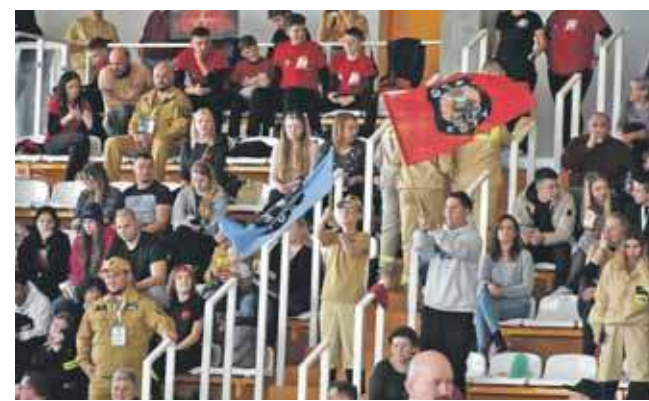
Młodzi druhowie i drużyny mogli liczyć na gorący doping