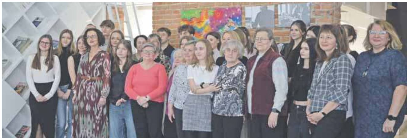
Uczestnicy projektu podczas wernisażu w bibliotece

Jednym z kluczowych elementów projektu była wizyta studyjna w Oslo, gdzie liderzy grupy – dwóch seniorów i dwoje uczniów z Tarnowskich Gór – mogli zobaczyć, jak funkcjonuje system opie-