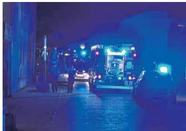
Straż pożarna została wezwana do pożaru budynku w centrum Tarnowskich Gór, gdzie składowane są meble

Straż pożarna została w poniedziałek wezwana do pożaru budynku w centrum Tarnowskich Gór, gdzie składowane są meble. Przechodzień zauważył dym wydobywający się z zakratowanego okna i wezwał pomoc.