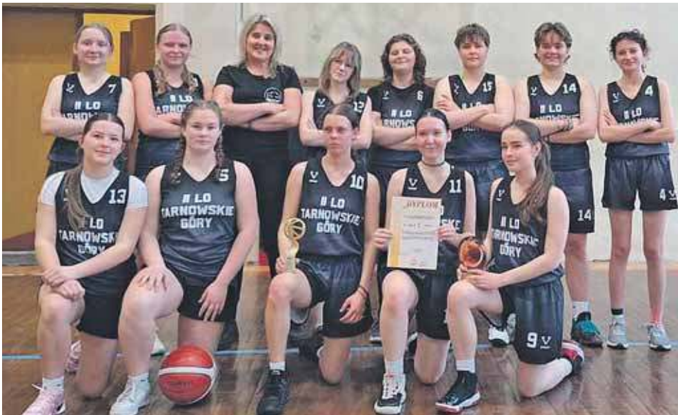
Zwycięska ekipa ze Staszica