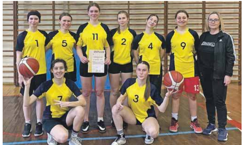
Na drugim miejscu uplasował się Chemik

Klasyfikacja końcowa: I – II LO im. S. Staszica, II – Zespół Szkół Chemiczno-