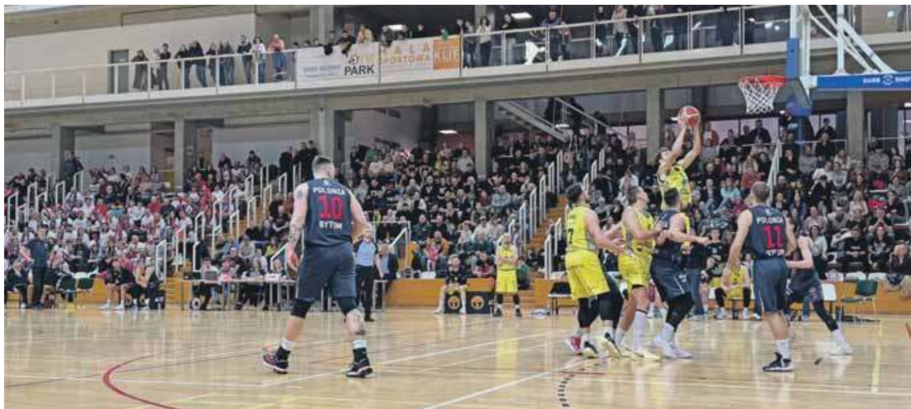
Tarnogórzanie walczyli, ale derby z Polonią Bytom jednak przegrali

Miniony tydzień dla KKS-u Tarnowskie Góry był pełen wydarzeń. O punkty grali zawodnicy II koszykarskiej ligi, gruszek w popiele nie zasypywali też młodzieżowcy.