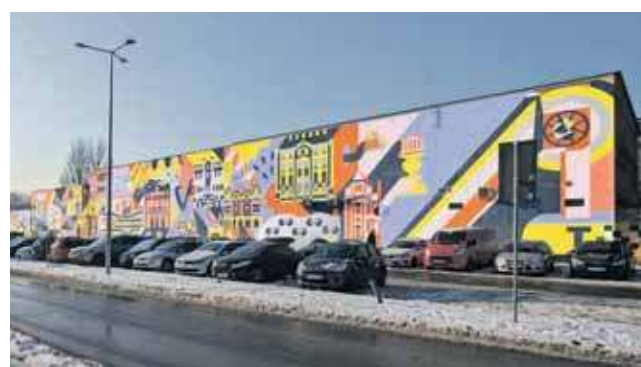
Tak ma wyglądać mural przy centrum przesiadkowym w Tarnowskich Górach