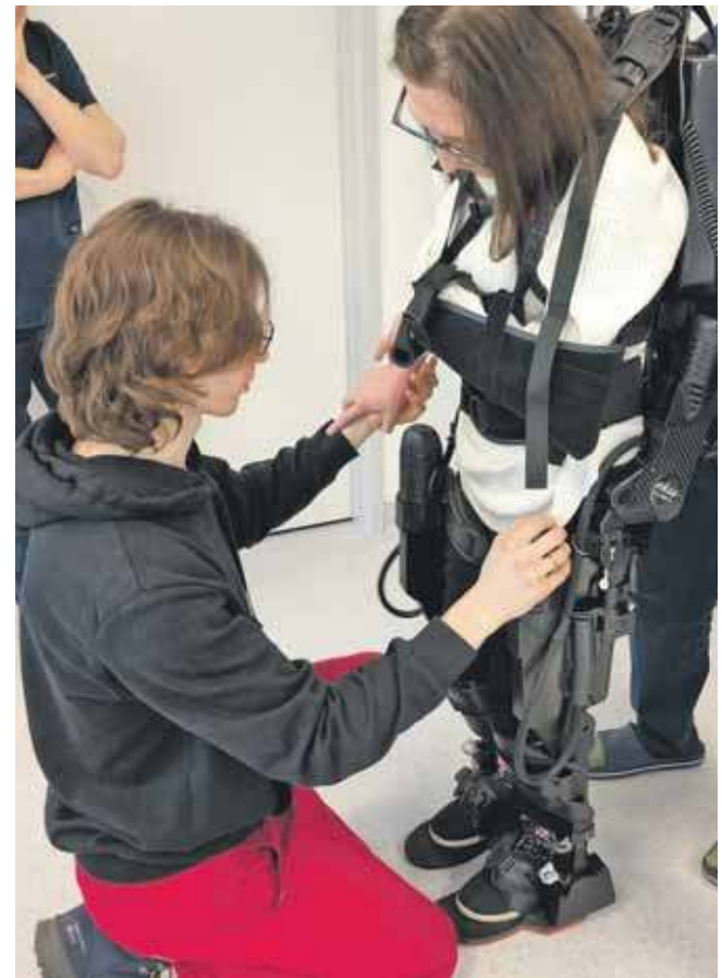
W całym kraju działa obecnie zaledwie 40 tego typu urządzeń

Przed rozpoczęciem treningów z użyciem egzoszkielecetu, fizjoterapeuci z GCR „Repty” musieli przejść odpowiednie szkolenie, aby w pełni wykorzystać jego możliwości z korzyścią dla pacjentów.