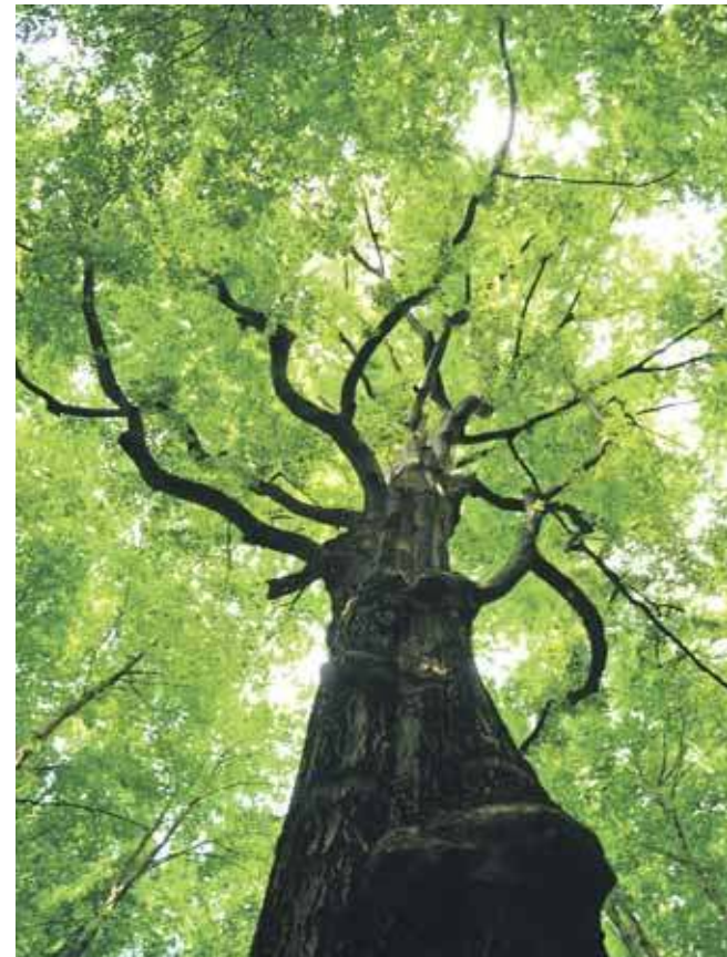
W Parku Repeckim szczególnie imponujące są sędziwe drzewa

– Chcielibyśmy wspólnie wypracować kształt i roz-