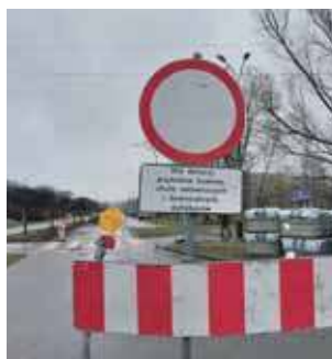
Komunikacja miejska funkcjonuje bez zmian