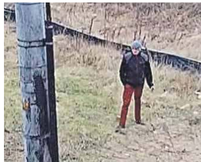
Kryminalni proszą o pomoc w ustaleniu tożsamości mężczyzny

Osoby, które go rozpoznają, proszone są o kontakt pod numerem 47 853 42 86 lub alarmowym 112. Informacje można kierować także drogą mailową na adres: kryminalny@tarnowskie-gory.ka.policja.gov.pl. (EKA)