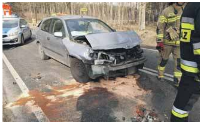
Kierowca nissana nie zachował ostrożności i wjechał w ciężarówkę