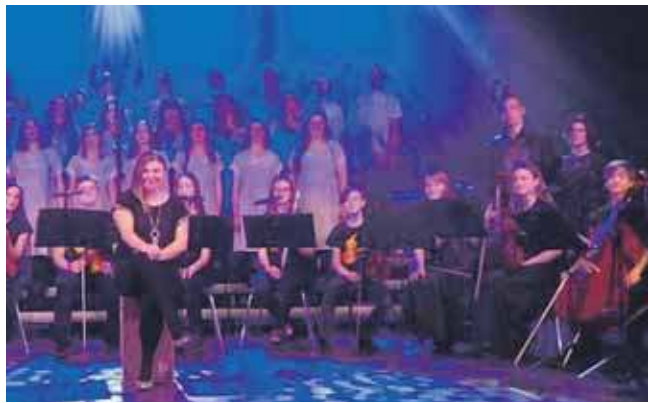
Koncert odbędzie się już w nadchodzącą niedzielę

Koncert odbędzie się w Tarnogórskim Centrum Kultury, w niedzielę, 23 marca o godz. 18. Bilety wstępu kosztują 35 zł. (EKA)