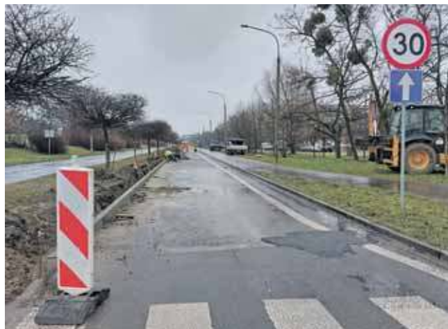
Zamknięty jest jeden pas jezdni na al. Jana Pawła II

Zakres prac remontowych: frezowanie starej nawierzchni asfaltowej na głębokość 10 cm, rozbiórka