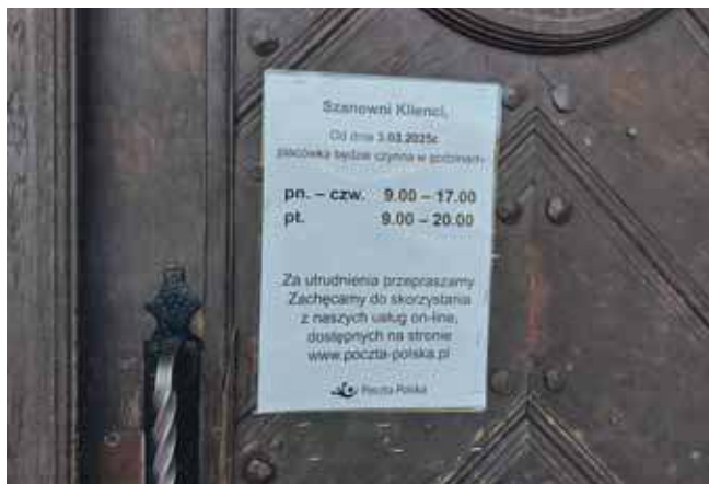
Zmiany obowiązują od marca

Inni tarnogórzanie zwracają też uwagę, że jest zbyt mało osób, które obsługują klientów, co jeszcze pogarsza