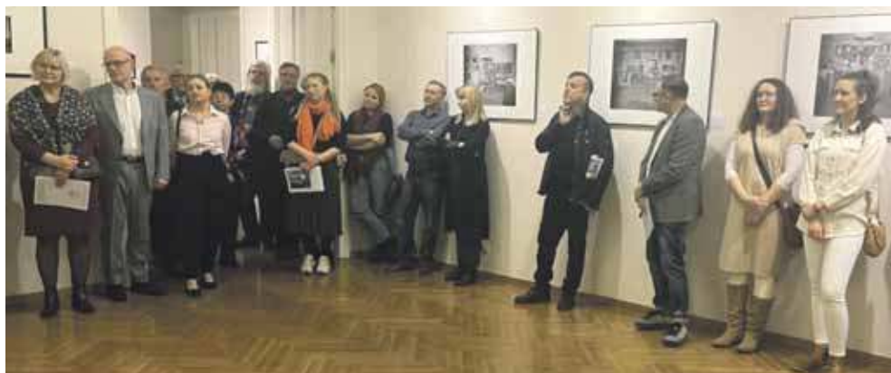
Prace jednej z najwybitniejszych polskich fotografek oglądać można do 20 kwietnia w Centrum Kultury Śląskiej w Nakle Śląskim