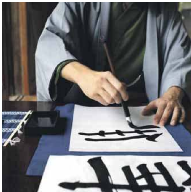
Spotkanie poprowadzi wybitny artysta Masakazu Miyanaga

„Zacniemy od krótkiego wprowadzenia do kaligrafii, potem poćwiczmy pisanie podstawowych linii, narysujemy proste znaki, a na koniec uczestnicy spróbują przelać na papier wybrane przez siebie krótkie, nie-