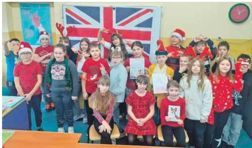
Uczniowie klasy 4a napisali list do króla Zjednoczonego Królestwa Wielkiej Brytanii i Irlandii Północnej Karola III

Do koperty listu adresowanego do pałacu Buckingham w Londynie trafiły również kartki świąteczne. Tym razem w akcję zaangażowali się młodszy uczniowie, z klas I-III, którzy je przygotowali.