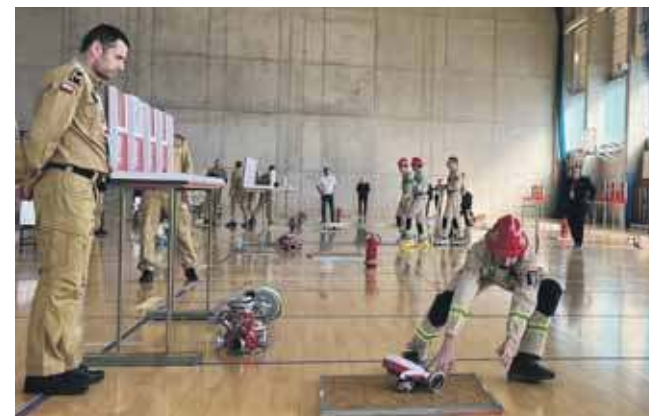
Liczyły się i precyzja, i czas

Klasyfikacja eliminacji wojewódzkich: dziewczęta – I m. OSP Woźniki, II – OSP Żeliszawice, III – OSP Niezdara, chłopcy – I OSP Niezdara 1, II – OSP Ćwiklice, III – OSP Dobieszowice.