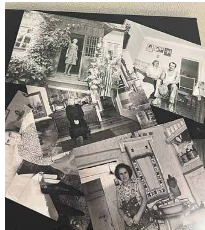
Siedzą na łóżkach lub krzesłach, w starych drewnianych chałupach...

Prace Zofii Rydet to przede wszystkim szczerść, codzienność i ulotność ludzkiej egzystencji zatrzymana na fotografii. Pokaza-