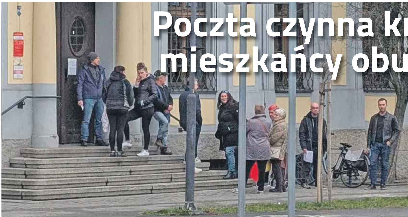
Nieraz kolejka klientów stoi nawet na zewnątrz budynku poczty