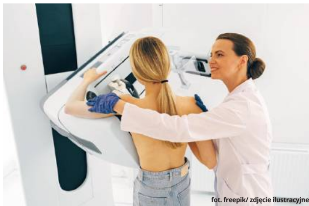
zdjęcie ilustracyjne

REGION Do Włodawy i Gorzkowa Osady przyjadą mammbusy. To doskonała okazja, by wykonać bezpłatne prześwietlenie piersi.