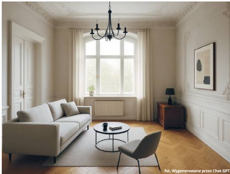
fot. Wygenerowane przez Chat GPT

pełnią funkcję mebli do przechowywania. Oświetlenie należy zaplanować warstwowo, łącząc klasyczne żyrandole, które podkreślają wysokość