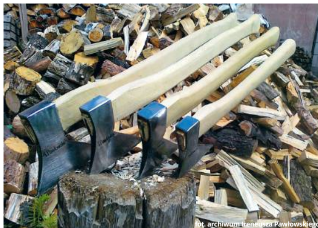
Siekierki większe i mniejsze - do różnych prac przy drewnie

- Tak... Kiedyś to był cały rytuał. Pamiętam, że do mojego dziadka przychodziło mnóstwo