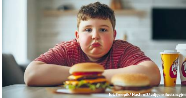
zdjęcie ilustracyjne

Tymczasem skutki są poważne: dzieci z nadwagą częściej mają problemy zdrowotne