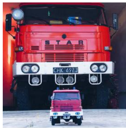
439(L)41 GBA 2.5/16 Star 244/JZS - OSP Brzeziny

- Ostatnio widzę taki mały renesans, na wystawach, konkursach pojawia się coraz więcej młodych ludzi. A papierowe modele są tanie, dostępne i idealne na początek. Można kupić coś za kilka złotych i spróbować. Wystarczy nożyk, klej, kawałek tektury. Reszta to już wyobraźnia - mówi.