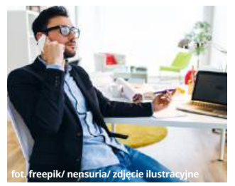
zdjęcie ilustracyjne

Z kolei 20 listopada o godz. 10:00 w Krasnymstawie i Cheł-