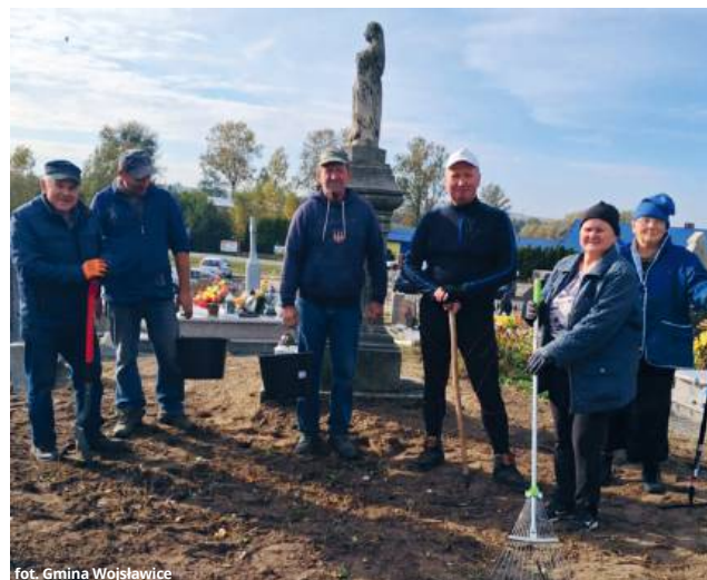
fol. Gmina Wojsławice

Zasadniczym celem przedsięwzięcia było uporządkowanie i zabezpieczenie nagrobków o znacznej wartości historycznej. Stanowią one niewątpliwie ważny element lokalnego dziedzictwa kulturowego. Wolontariusze zajęli się między innymi czyszczeniem kamiennych elementów z mchów i porostów, usunięciem zbędnej roślinności i wykonaniem podstawowych zabiegów zabezpieczających