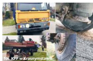
fol. KPP w Krasnymstawie

Podczas akcji funkcjonariusze Wydziału Ruchu Drogowego Komendy Powiatowej Policji w Krasnymstawie przeprowadzili 40 kontroli drogowych. W ich wyniku ujawniono aż 40 wykroczeń. - Najwięcej z nich dotyczyło