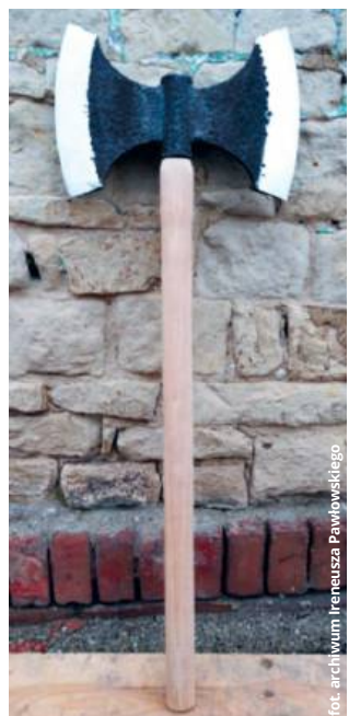
Jedno z niecodziennych zamówień - skandynawski topór