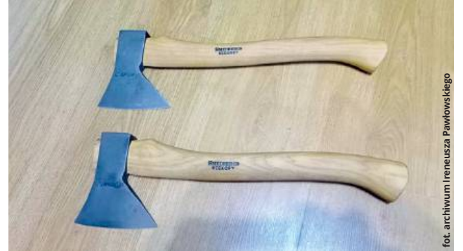
Siekierki na specjalne zamówienie - z toporzyskami wykonanymi z drewna hikorowego, które pozyskiwane jest z orzesznika. To wysoce ceniony i kosztowny materiał

Kuźnia Pawłowskiego stroni raczej od internetowych forów i popularnych dzisiaj mediów społecznościowych. Owszem, związani z branżą znawcy pole-