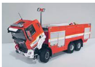
Tyła Phoenix RFA40 1:25

Renesans modelarstwa Choć wielu uważa, że mode-