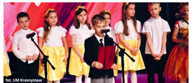
fol. UM Krasnostaw

Na scenie wystąpili uczniowie krasnostawskich szkół w tym Państwowej Szkoły Muzycznej im. Witolda Lutosławskiego. Młodzi artyści zabrali publiczność w barwną podróż przez wspomnienia i wyobraź-