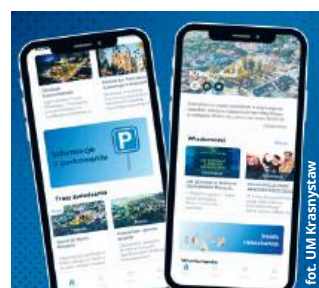
fol. UM Krasnostaw

Audioprzewodnik Tripplay przygotowano w dwóch wersjach językowych - polskiej i angielskiej - z możliwością łatwego rozszerzenia treści na inne języki. Tripplay to rozwiązanie wykorzystywane już przez 20 miast i gmin w Polsce, w tym wielu z regionu wschodniego i Lubelszczyzny. Warto dodać, że wśród miast znajdziemy także Chełm. Ta sieciowa korzyść wspiera turystykę regionalną,