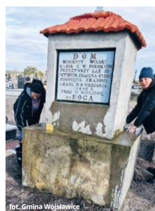
fol. Gmina Wojsławice

- Dzięki takim właśnie inicjatywom Wojsławice stają się miejscem, w którym przeszłość i pamięć o niej pozostają żywe także w codziennym życiu mieszkańców. Bez kulturowej pamięci nie można mówić o budowaniu przyszłości – uważa wójt RC .