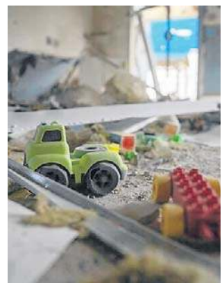
Irańskie pociski spadły na izraelskie przedszkole

Niedzielną operacją odwetową nastąpiła niespełna dobę po uderzeniu irańskiego pocisku balistycznego w miasto Arad na południu Izraela.