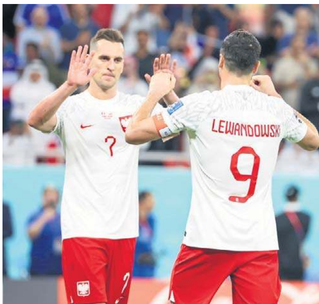
Arkadiusz Milik kontuzji, po której nie grał niemal dwa lata, doznał w meczu reprezentacji z Ukrainą

W Bundeslidze zobaczyliśmy też Kamila Grabarę. Bramkarz VfL Wolfsburg jest faworytem do pierwszego składu reprezentacji Polski 26 marca w meczu barażowym przeciwko Albanii. „Wilki” - mimo wielkich starań Grabary - walczą o utrzy-