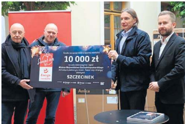
Szczecinek zajął I miejsce w internetowym plebiscyście organizowanym pod hasłem „Świeć się z Energa”

Tegoroczna, 16. już edycja plebiscytu okazała się rekordowa - do udziału w „Świeć się z Energa” przyłączyło się aż 350 miejscowości z całego kraju. Również Czytelnicy mediów grupy Polska Press wykazali się rekordową mobilizacją, oddając łącznie aż 767 940 głosów. Spory udział w tym mieli sympatycy Szczecinka, którzy właśnie na tę miejscowość oddali 11 tys. 244 głosy. To przełożyło się na I miejsce w województwie zachodniopomorskim oraz na wysokie 5. miejsce w Polsce.