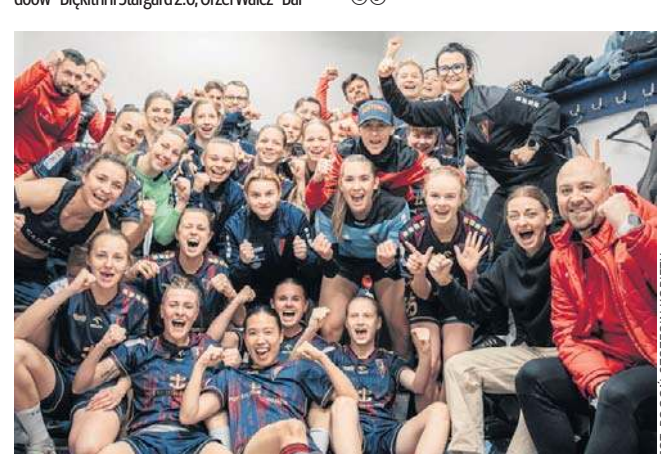
Piłkarki Pogoni mają duże szanse na zakończenie tego sezonu z podwójnym sukcesem