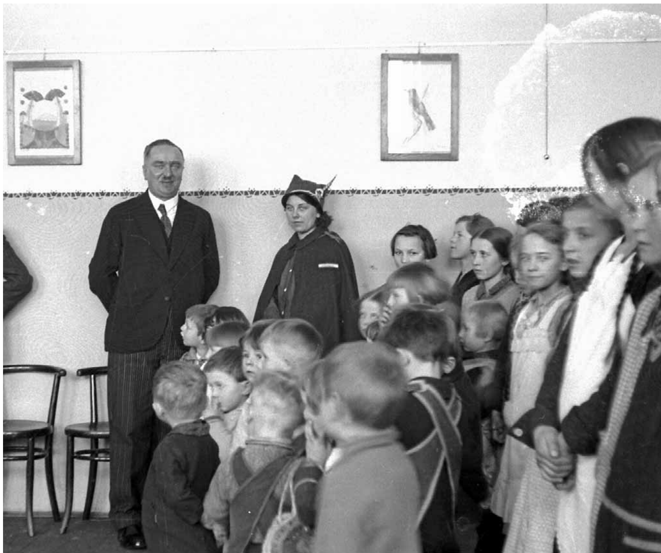
W okresie międzywojennym na Śląsku obowiązywało prawo zabraniające pracy w szkołach nauczycielkom mężatkom. Kobiety przy tablicy były niemiłe widziane

Już w marcu 1926 roku Sejm Śląski, do którego wyłącznej kompetencji na mocy ustawy autonomicznej należało m.in. ustawodawstwo w zakresie szkolnictwa, uchwalił prawo nakazujące zwalnianie z pracy nauczycielek, które wstąpiły w związek małżeński. Co takiego tu się zadziało? Skąd takie rygory wobec kobiet?