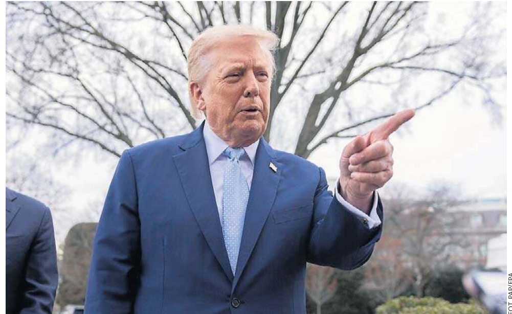
Oświadczenie Trumpa pojawiło się w sobotę wieczorem na platformie Truth Social. Ultimatum upływa tuż przed 1 w nocy czasu polskiego z poniedziałku na wtorek

Amerykański prezydent wielokrotnie wcześniej groził zniszczeniem irańskich elektrowni - w tym elektrowni jądrowej - twierdząc, że w ten sposób w ciągu godziny mógłby spowodować takie zniszczenia, że kraj nie byłby się w stanie z tego podnieść. Trump podkreślał jednak wówczas, że jest „miły” i tego nie robi.