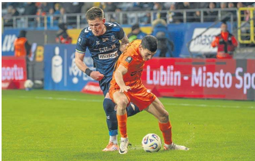
Kibice oklaskiwali zespół Motoru po wygranej nad liderującym dotąd Zagłębiem Lubin