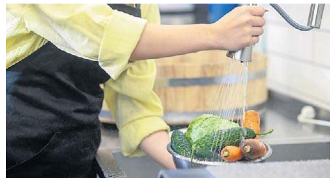
Jak zmniejszyć ilość pestycydów w jedzeniu? Jednym ze sposobów jest właściwe mycie