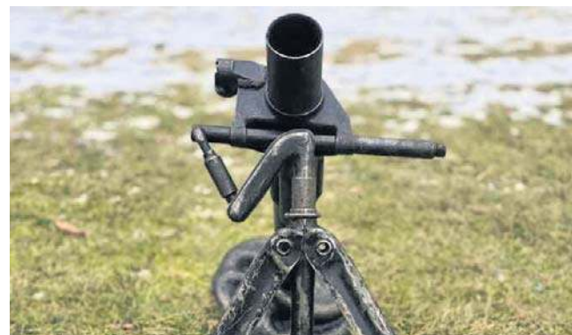
Nowy eksponat trafi do gabloty w bydgoskim Muzeum Wojsk Lądowych najprawdopodobniej w maju

Moździerze obu typów były używane w Armii Czerwonej oraz Wojsku Polskim. Po II wojnie światowej trafiły jako pomoc Związku Socjalistycznych Rpublik Radzieckich do Korei Północnej, Wietnamu, krajów Ameryki Łacińskiej oraz Afryki.