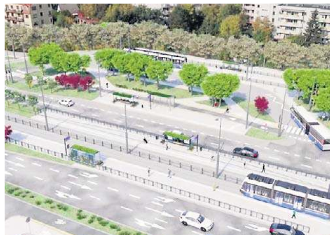
Budowa realizowana będzie w latach 2026-2028. Inwestycja kosztuje ponad 100 mln złotych

Trasa do ulicy Bielickiej to pierwszy etap ambitniejszego projektu - budowy trasy tramwajowej od ronda Kujawskiego do ronda Grunwaldzkiego. Inwestycja wymaga dostosowania ciągu ul. Solskiego do przekroju dwujezdniowego,