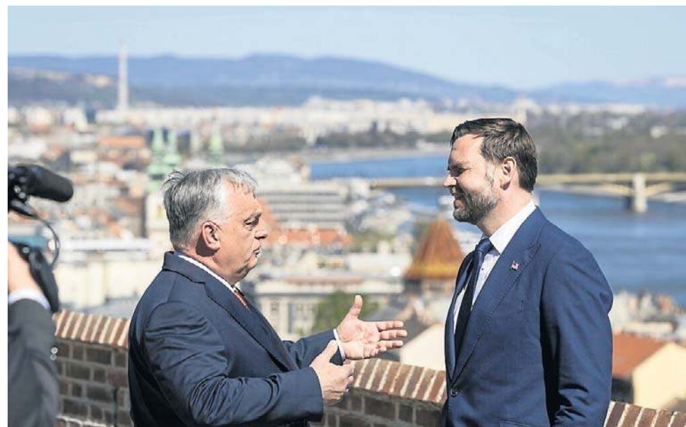
Premier Węgier Viktor Orbán wita wiceprezydenta USA J.D. Vance'a przed swoim biurem, byłym klasztorem karmelitów w Budapeszcie

- Myślę, że premier Orbán jest najbardziej wpływowym przywódcą Europy w kwestiach bezpieczeństwa energetycznego i niezależności. To