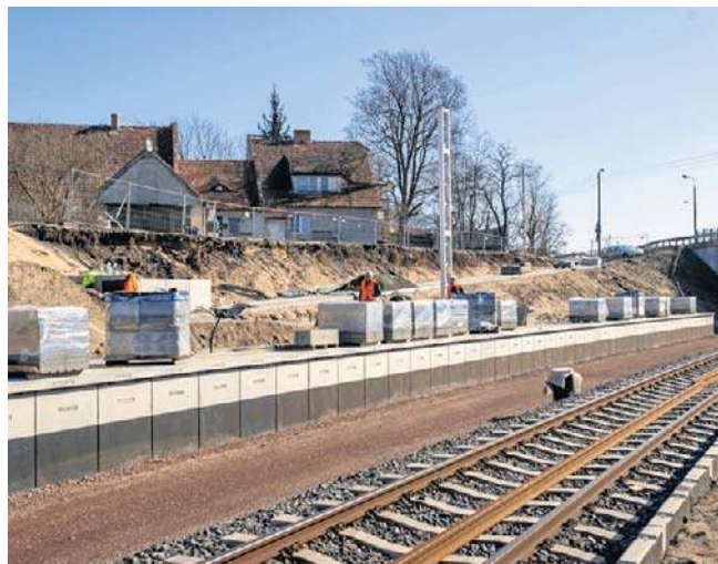
Budowa nowego przystanku Bydgoszcz Stary Fordon w ramach modernizacji linii kolejowej numer 209

Projekt finansowany jest ze środków z KPO przeznaczonych na projekt pn. „Likwidacja wąskich gardeł i zwiększenie przepustowości linii kolejowych - etap II”. ©©