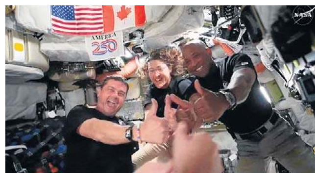
Astronauta misji kosmicznej Artemis II

Podczas przelotu nad niewidoczną stroną Srebrnego Globu, w trakcie którego łączność z NASA była całkowicie niemożliwa, załoga była świadkiem zjawiska wschodu i zachodu Ziemi.