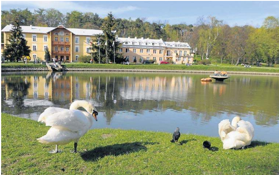
Zobacz listę najlepszych sanatoriów na NFZ

Wszystko świetnie, ale skąd wiadomo, które sanatorium rzeczywiście jest dobre czy wręcz bliskie ideałowi? Najlepiej spytać o zdanie samych pacjentów, którzy już odbyli turnusy.