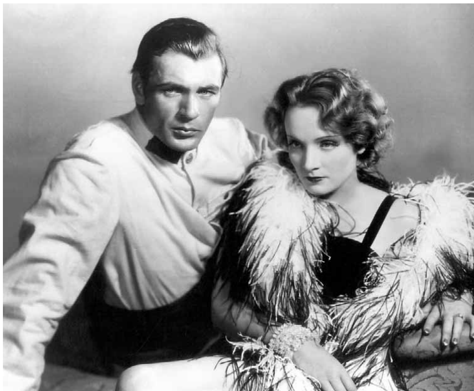
Nie wiadomo, czy William Harrison Hays widział w kinie film „Maroko” von Sternberga, choć zapewne doskonale znał jego treść

Osoba Chrystusa musiała być w filmie traktowana z szacunkiem i nie mogła być tematem szyderstw. Kodeks nakazy-