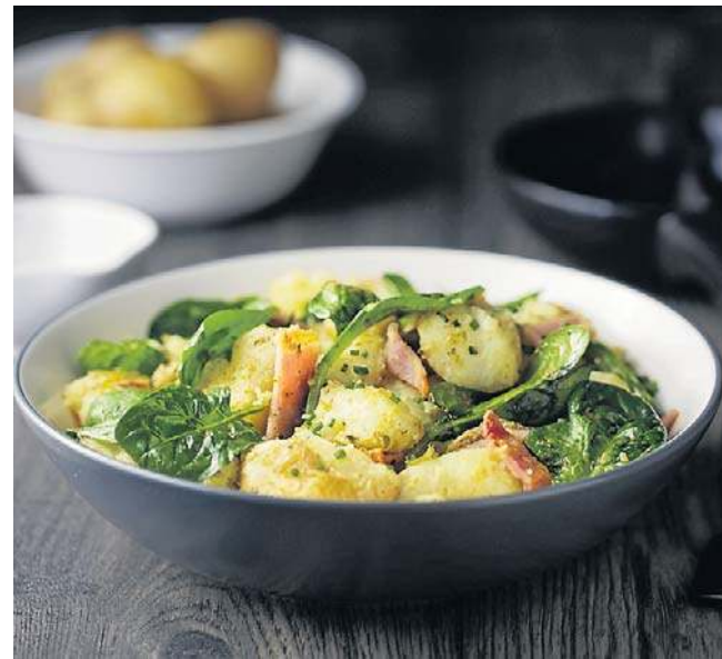
Szpinak i ziemniaki to najbardziej zanieczyszczone warzywa wg EWG