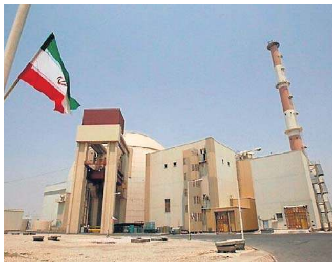
Buszehr to kluczowa irańska elektrownia jądrowa. Została uszkodzona po ataku rakietowym

Położenie na wybrzeżu Zatoki Perskiej oznacza, że zanieczyszczenia mogłyby przedostać się do wody morskiej, zwiększając ryzyko oddziaływania na ekosystemy morskie, a co ważniejsze, na zakłady odsalania wody, od których wiele państw Zatoki Perskiej jest zależnych w zakresie zaopatrzenia w wodę pitną.