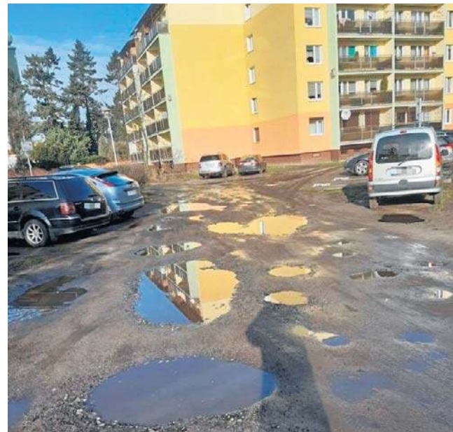
Ulica Podhalańska ma zostać utwardzona do połowy 2027 roku. Mieszkańcy na inwestycję czekają od 2008 roku

Można zatem powiedzieć, że mieszkańcy Podhalańskiej wreszcie się doczekali. O drodze gruntowej między blokami już w kwietniu 2017 roku pisała „Gazeta Pomorska”. Mieszkańcy cytowani w artykule „Sto metrów zgryzoty. Na remont czekają już 9 lat!” skarżyli się