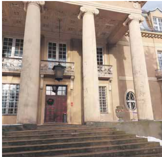
Czy obiekt w Łubiu znajdzie nabywcę?

Czy pałac w Łubiu podzieli los Miedar, czy też znajdzie się inwestor? Jak twierdzą władze powiatu, zespół pałacowo-parkowy w Łubiu jest atrakcyjniejszy niż obiekt w Miedarach, dlatego liczą na to, że znajdzie się nabywca.