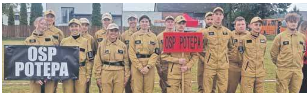
Druhowie i drużyny z OSP Potępa – wygrali wśród mężczyzn, kobiet, w miksach i kategorii OPEN