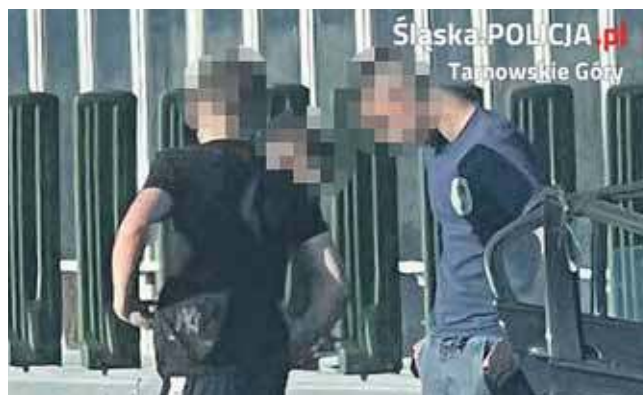
Byli poszukiwani przez policję

Od tamtej pory trwały poszukiwania sprawców kradzieży. Policji udało się namierzyć jednego z nich – to 20-letni mieszkaniec Zabrze.