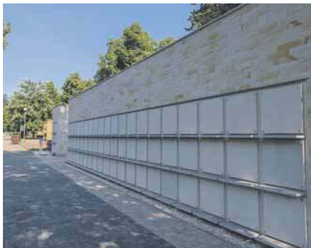
Rezerwacja i sprzedaż miejsc w nowym kolumbarium ma się rozpocząć w pierwszej połowie czerwca

jest w strefie objętej ochroną konserwatora). Do tego dnia bliscy osób zmarłych mogą rezerwować lub wykupić na cmentarzu komunalnym