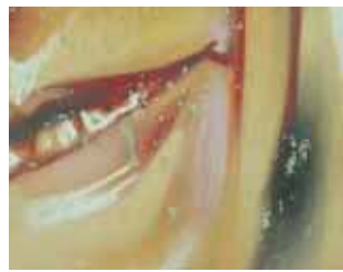
Farba się łuszczy, autor pracuje nad rozwiązaniem problemu

– Mural powstał niedawno, a już źle wygląda, łuszczy się farba – mówi nasza czytelniczka. Chodzi o mural Degi, Szyborskiej i Donnersmarcka w parku Repeckim w Tarnowskich Górach.