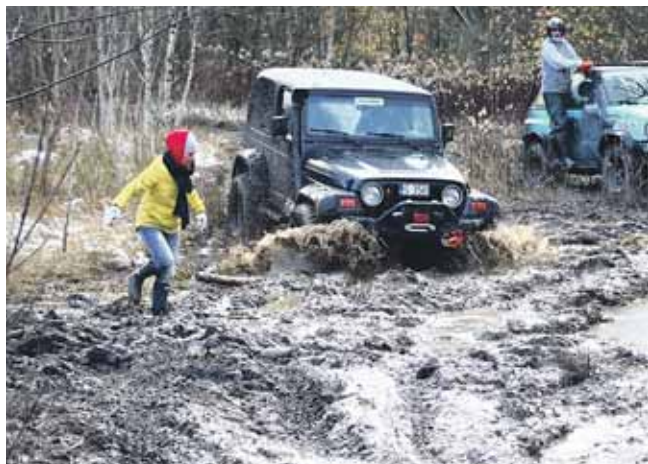
Kto nie pojechał w off-road, ten nie widział błota...

– Dużo zależy od tego, jaki teren zamierzamy pokonywać. Na łące sprawdzi się wyższy suv, trudniejsze trasy wymagają dostosowania