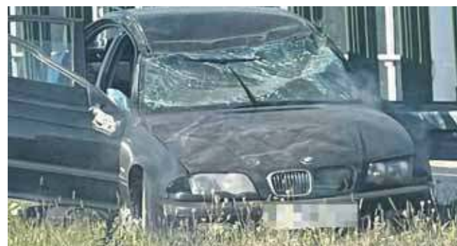
Rozbili kradzione auto na autostradzie

Policja z Tarnowskich Gór namierzyła złodziei, którzy w ubiegłym roku ukradli BMW. Przeciwko jednemu ze sprawców skierowano już akt oskarżenia do sądu.