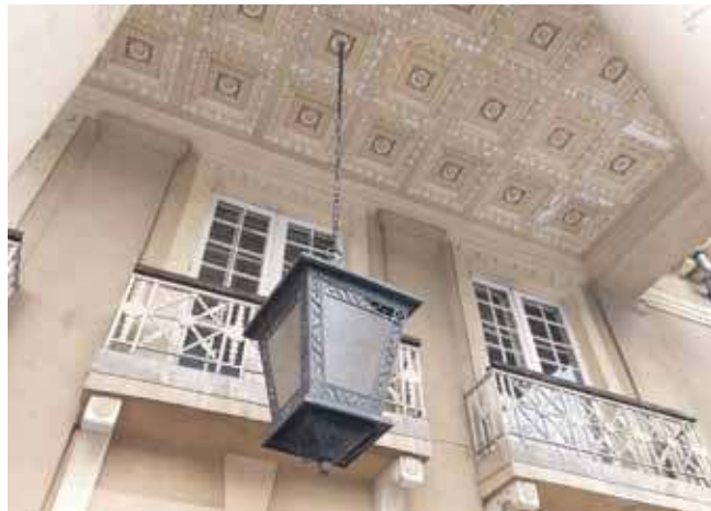
Zespół pałacowo-parkowy jest wart 10 mln zł

Pałac w Łubiu to XIX-wieczna rezydencja z bogatą historią. Został wybudowany w latach 60. XIX wieku, a na początku XX wieku przeszedł przebudowę. Wzniesiony na rzucie litery „L”, jest podpiwniczony i posiada użytkowe poddasze. Należał niegdyś do