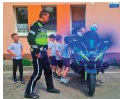
Motocykl policyjny przyjechał z KMP w Ostrołęce

Piknik był nie tylko źródłem radości dla najmłodszych, ale również doskonałą okazją do promocji zawodu policjanta. Funkcjonariusze chętnie odpowiadali na pytania dorosłych uczestników, opowiadając o pracy w różnych pionach Policji oraz zachęcali do rozważenia wstąpienia w policyjne szeregi.