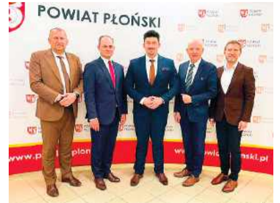
Zarząd powiatu płońskiego otrzymał wotum zaufania i absolutorium

wę funkcjonowania jednostki. Mimo, iż poprawa i stabilizacja kondycji finansowej szpitala pochłaniała wiele czasu i energii, nie zrezygnowaliśmy z realizacji projektów mających na celu poprawę infrastruktury, rozwój edukacji, ochronę zdrowia oraz pomoc społeczną. W ostatnim czasie weryfikowaliśmy i analizowaliśmy, przygotowując się do wprowadzenia usprawnień w zarządzaniu i pracy Starostwa Powiatowego w Płońsku oraz