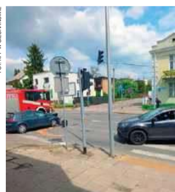
Kolizja na skrzyżowaniu

Listopada w kierunku ul. Witosa. Kierowcy pojazdów byli trzeźwi – informuje nadkom. Jolanta Bym.