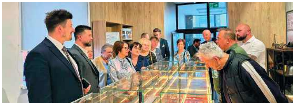
Z okazji 600 lecia praw miejskich Raciąża otwarto wystawę, na której można dotknąć historii miasta

Następne wydarzenie, związane z jubileuszem miasta to Korowód Dziejów Raciąża, który odbędzie się już 7 czerwca. KO