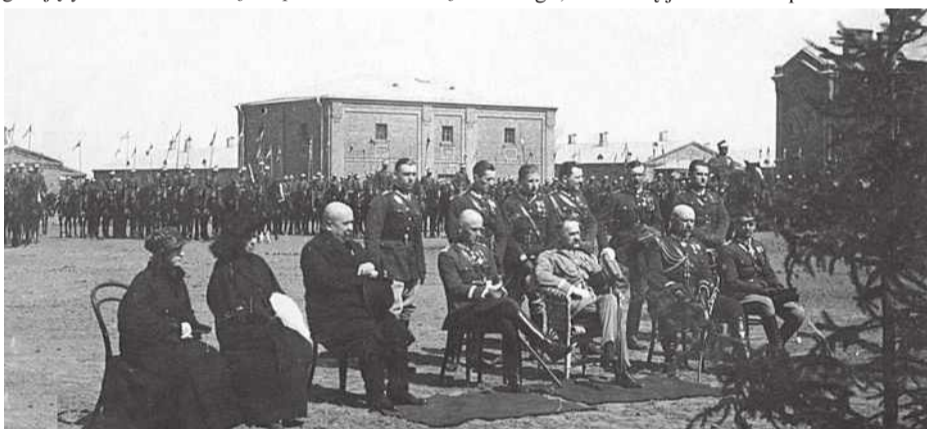
Marszałek Józef Piłsudski podczas święta pułkowego 11 p.uł., Ciechanów 26.04.1924 r.

Mimo nakazu w 1941 r. generalnego gubernatora Hansa Franka, zrównania z ziemią kopców Kościuszki i Piłsudskiego, udało się je ocalić. Kopiec J.