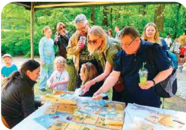
Wśród atrakcji dla dzieci było stoisko nadleśnictwa z leśnymi tatuażami