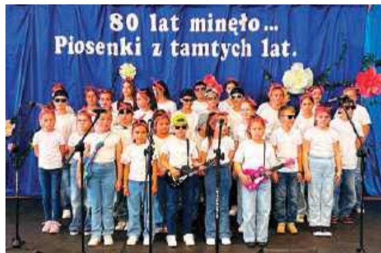
Z okazji jubileuszu zorganizowano muzyczny festiwal