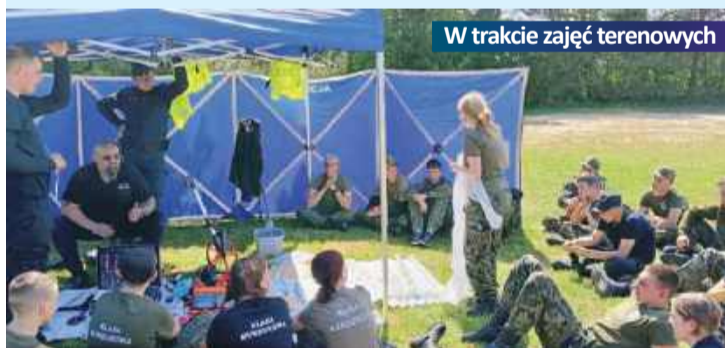
W trakcie zajęć terenowych