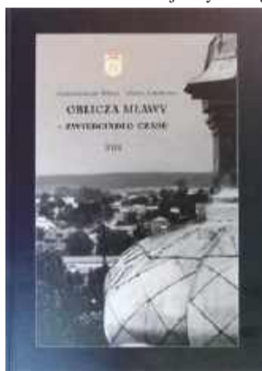
Frontowa okładka albumu