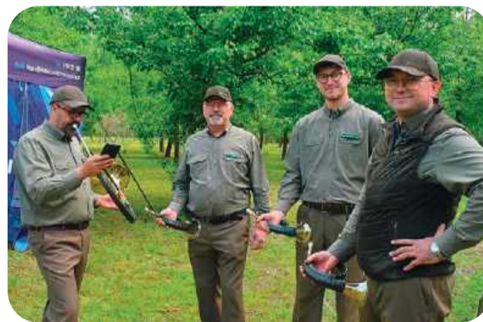
Wydarzenie uświetnił zespół sygnalistów myśliwskich Akord