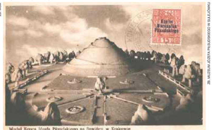
Pocztówka z serii Pamiątka Budowy Kopca Józefa Piłsudskiego, Kraków 1935