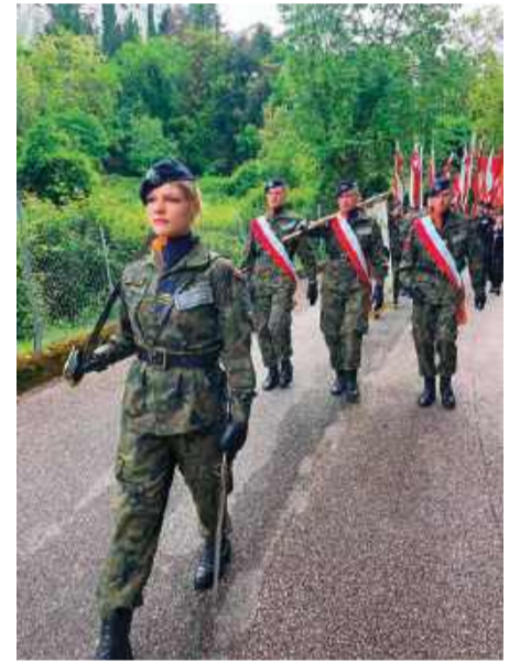
Honorowa warta kadetów