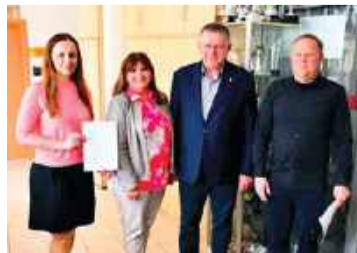
Płoński ratusz przygotowuje się do rozbudowy ulic na osiedlu Poświętne