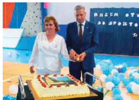
Uroczystość zwińczyła kaskada balonów i imponujący tort

Z hali korzystają już od ubiegłego roku uczniowie, a w piątek, 23 maja uroczystość oddano obiekt do użytku.