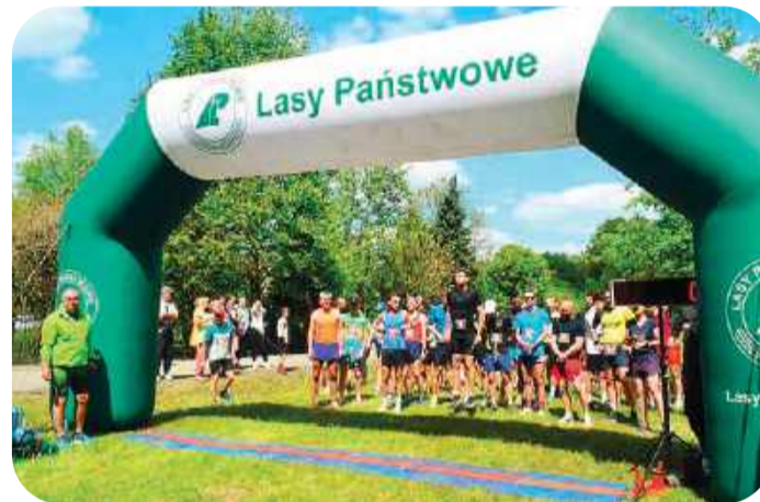
Dystans biegu głównego wynosił 10 km