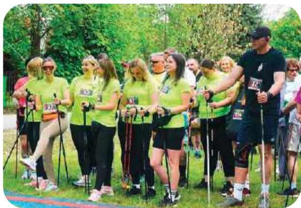
Jedną z kategorii był marsz nordic walking