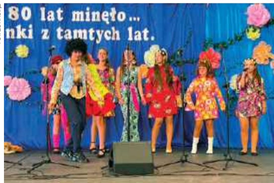
W tym roku raciąska szkoła świętuje 80-lecie