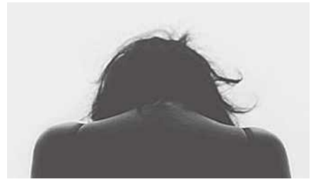
Dzięki szybkiej reakcji służb, życie 17-latk udało się uratować

Dzięki czujności funkcjonariuszy Centralnego Biura Zwalczania Cyberprzestępczości oraz błyskawicznej interwencji policjantów z Makowa Mazowieckiego udało się zapobiec tragedii. Informacja o potencjalnym zagrożeniu życia młodej dziewczyny okazała się prawdziwa.