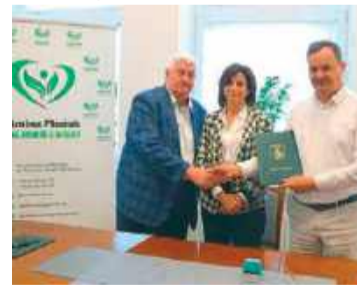
W UG w Płońsku podpisano umowę z wykonawcą modernizacji boisk

Zakres planowanych prac obejmuje m.in.: rozbiorke i utylizację istniejących kontenerów szatniowych, czyszczenie nawierzchni poliuretanowej boisk, adaptację istniejących fundamentów pod nowe kontenery, dostawę i montaż nowoczesnych kontenerów szatniowych o stalowej konstrukcji i ścianach z płyt warstwowych, wymianę piłkochwytyw, wykonanie natrysku na nawierzchni poliuretanowej oraz odtworzenie linii separujących boiska, wykonanie nowej nawierzchni poliuretanowej na boisku wielofunkcyjnym w kolorze ceglącym