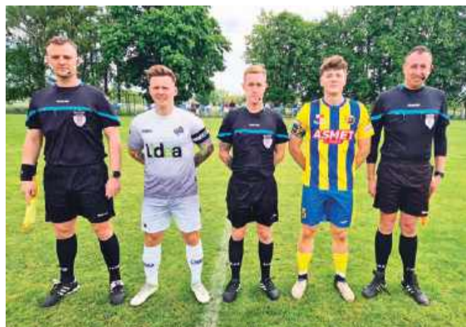
Konopianka podzieliła się punktami z Wkrą Biezuń

28. kolejka (31 maja - 1 czerwca): Rzekunianka - Korona, Kryształ - Oldaki, Gladiator - Ostrovia, Kurpik - Konopianka, Wkra B. - Wkra R., Strzegowo - Opia, Mazur - Ciechanów, Sona - Różan