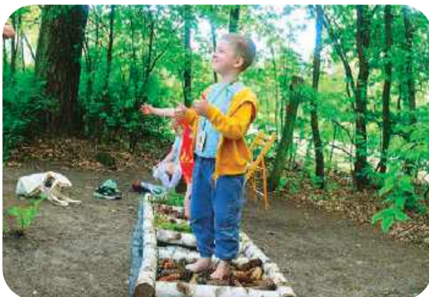
Boso, po mchu i szyszkach