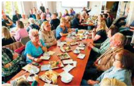
Wtorkowe spotkanie cieszyło się bardzo dużym zainteresowaniem przedstawicieli organizacji pozarządowych

Spotkanie, zorganizowane w płońskim starostwie - w sprawie nowego, rządowego programu wsparcia dla organizacji pozarządowych „Moc Małych Społeczności”, cieszyło się ogromnym zainteresowaniem.