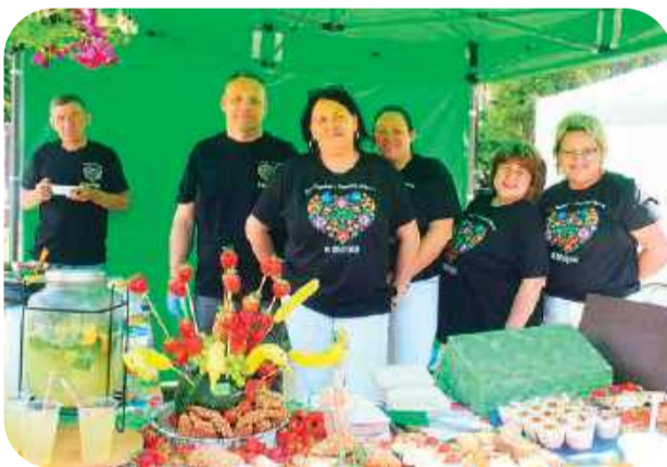
Można było zjeść coś pysznego na stoiskach kół gospodyń wiejskich