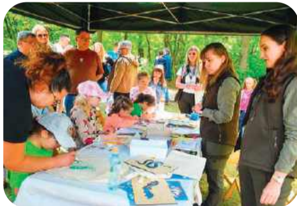
Dzieci mogły ozdobić własną ekologiczną torbę