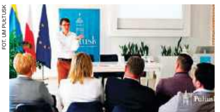
Dyskusja uczestników spotkania

Na koniec omówiono wybrane treści dokumentu.