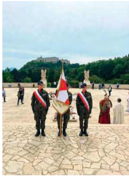
Sztandar szkoły na Monte Cassino