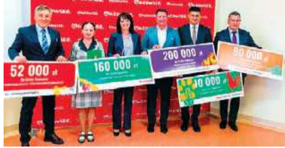
Do powiatów makowskiego i ostrołęckiego łącznie wpłynie 7,1 mln zł dofinansowania

W ramach programu „Mazowsze dla straży pożarnych” 18 gmin z powiatów ostrołęckiego i makowskiego otrzyma prawie 1,6 mln zł na modernizację remiz, zakup samochodów ratowniczo-gaśniczych, sprzętu i umundurowania.