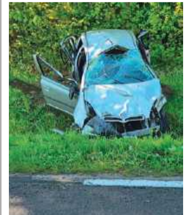
W wypadku zginął 23-letni mężczyzna

We wtorek, 20 maja, na drodze wojewódzkiej w Bołecinie (gm. Sochocin) doszło do tragicznego w skutkach wypadku. Śmierć na miejscu poniósł młody mężczyzna – mieszkaniec gminy Baboszewo).