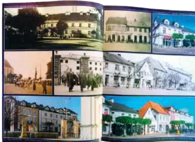
Kilka spośród ok. 150 zdjęć dawnej i dzisiejszej Mławy