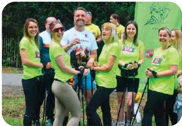
Zabawa, jak widać, była doskonała