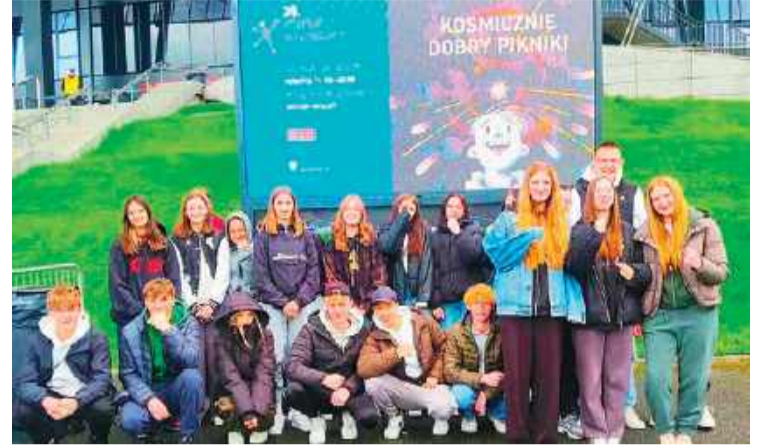
Przasnyska młodzież na pikniku

osób – dorosłych i młodzieży. Podczas pikniku odbyło się 690 pokazów w 185 namiotach przygotowanych przez 152 uczelnie, instytuty badawcze, koła naukowe, muzea, technologiczne, organizacje pozarządowe i instytucje edukacyjne z całej Polski i zagranicy. Każde stanowisko to był mały świat eksperymentów. Dzięki interaktywnym prezentacjom, pokazom i eksperymentom uczniowie z Przasnysza mogli poczuć