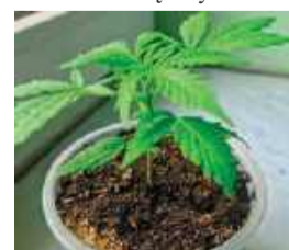
Za nietypową „sadzonkę” 25-latkowi grożą 3 lata więzienia