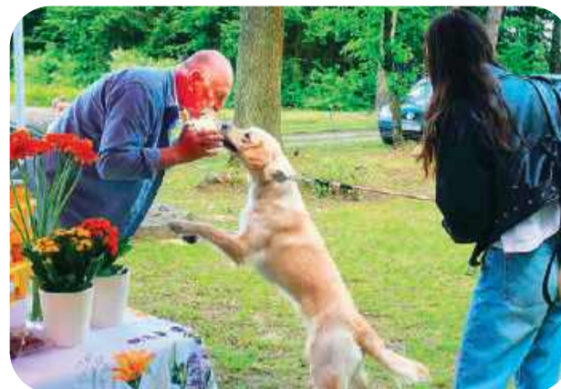
Dla każdego coś dobrego