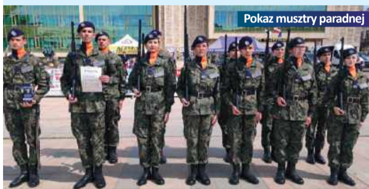
Pokaz musztry paradowej