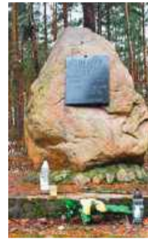
Pomnik, upamiętniający ofiary niemieckiego obozu pracy w Kucharach Żydowskich, zostanie odnowiony

Sochociński samorząd pozyskał dofinansowanie na remont pomnika upamiętniającego ofiary niemieckiego obozu pracy, który istniał w Kucharach Żydowskich podczas II wojny światowej.