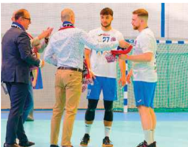
Podziękowania dla zawodników