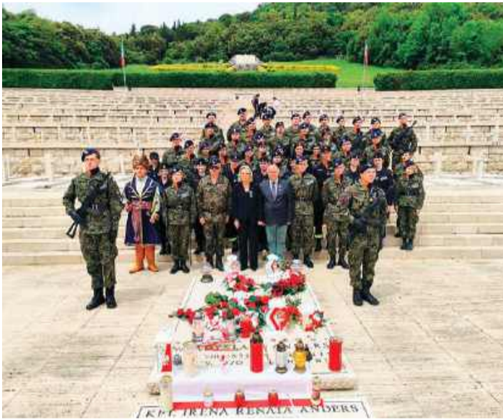
Uczniowie przy grobie gen. Władysława Andersa