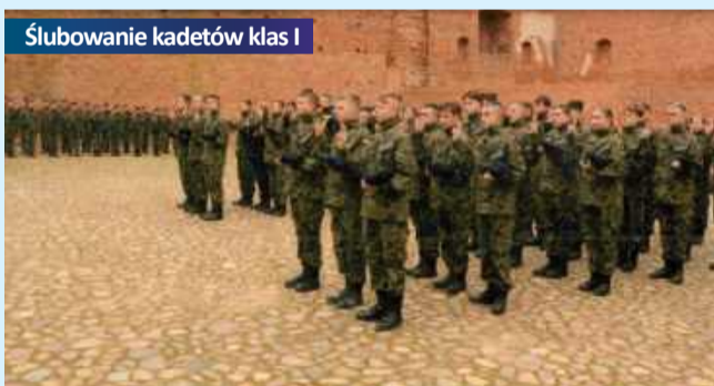
Ślubowanie kadetów klas I