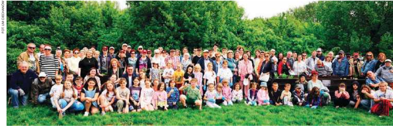
Uczestnicy inauguracji sezonu upraw

- Swoje skrzynie w ogrodzie społecznym mają: Dzienny Dom Senior +, Ciechanowska Rada Seniorów, Klub Senio-