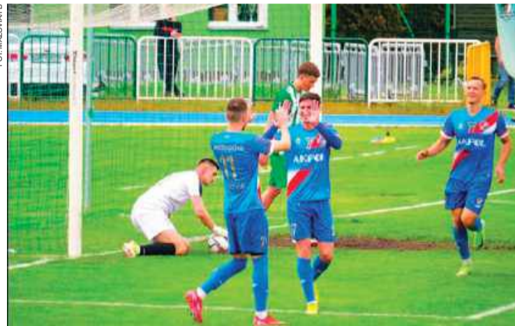
Tak padł kolejny gol dla Mazovii w Makowie Mazowieckim