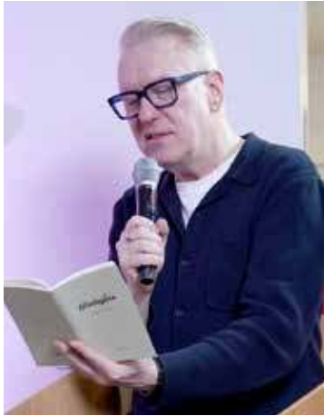
Podczas festiwalu odbyło się spotkanie z Mariuszem Szczygłem - znanym dziennikarzem, reportażystą i pisarzem