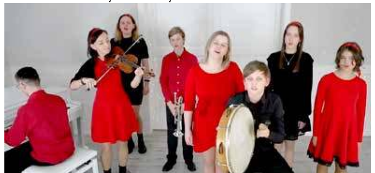
Kolęda Do Szopy zespołu Alepak