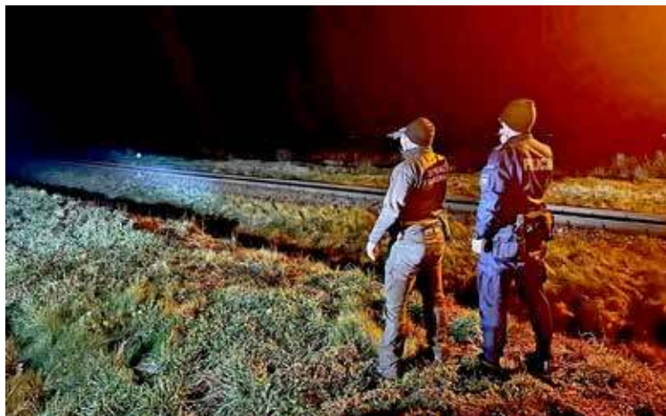
Uzbrojeni w lornetki policjanci wraz z leśnikami ruszyli w teren sprawdzać tory kolejowe

Dzięki wykorzystaniu specjalistycznego sprzętu możliwe było dokładniejsze sprawdzanie terenów, identyfikowanie potencjalnych zagrożeń oraz monitorowanie newralgicznych obszarów infrastruktury kolejowej.