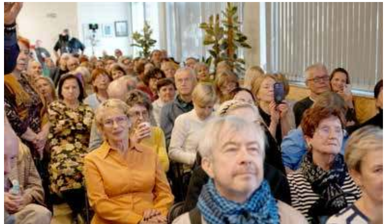
Wydarzeniu towarzyszyła wysoka frekwencja. Na spotkania przychodziły tłumy mieszkańców.