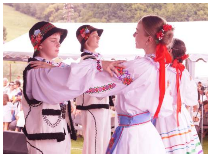
Ансамбль народного танцю «Аркан»