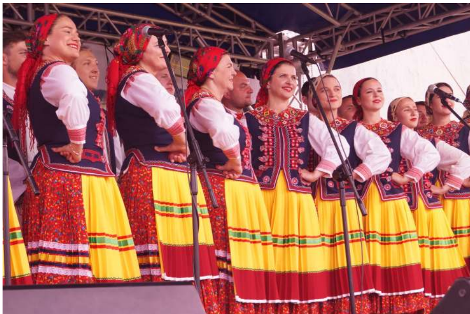
Ансамбль пісні і танцю «Ослав'яни»

Уже 33-й раз у селі Мокре Сяноцького повіту відбувся захід для шанувальників музики, ремесел та народної культури «Свято культури над Ославою». Окрім місцевих фольклорних колективів, на «Святі» виступили гості з Команчі, Сянока, Перемишля та Горлиць.