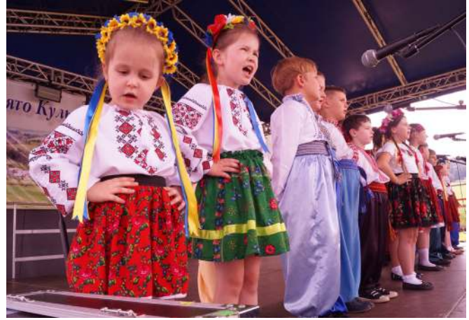
Дитячий гурт «Малинячок»

дилася ідея переобладнати стодолу під місце зустрічей. Так сталося, що колись там було сіно та солома, а сьогодні є сцена та місця для глядачів. Пізніше до стодолі почали приносити старе сільськогосподарське приладдя тощо. І так ми продовжуємо розширювати колекцію музею. Окрім зустрічей, до програми «Свята» додаємо майстер-класи зі співу та гри на народних інструментах. Дітям дуже подобається атмосфера. Цього року перед виставою в Морохові діти подарували публіці одну з пісень, яку навчилися грати та співати на майстер-класах. Минулого року наймолодші учасники демонстрували свої вміння під час «Свята» на сцені в Мокрому. Думаю: «Свято культури над Ославою» поєднує майстер-класи, світ театру та концерти.