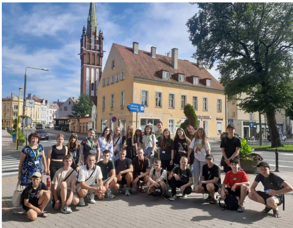
Діти з Володимира.

Про дітей українських воєнних біженців, що виїхали на Вармію та Мазури, дбають теж дорослі українські мігранти. Ольштинський фонд «Два крила UA» проводив літню акцію «Між деревами»,