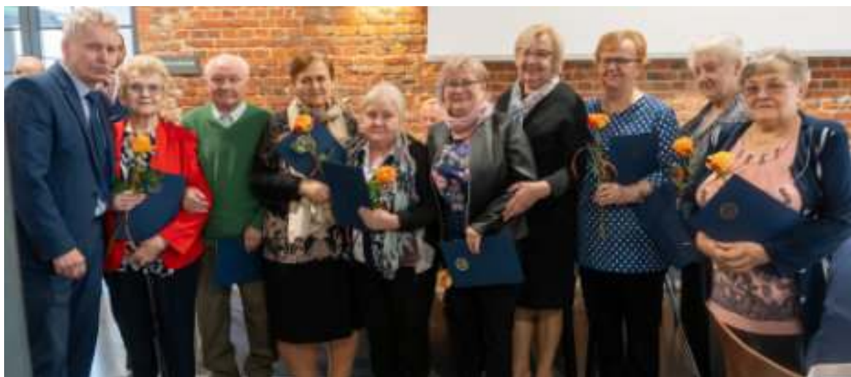
► Okolicznościowe spotkanie odbyło się w Łażni Łańcuskowej Sztolni Królowa Luiza