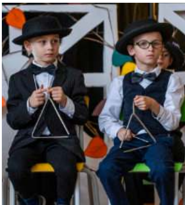
► Uczniowie zaprezentowali swoje talenty