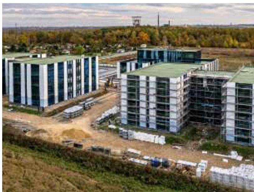
► Nowa siedziba firmy ZARYS

W ramach projektu przebudowana zostanie także ul. Bytomska. W rejonie pętli tramwajowej przy skrzyżowaniu z ul. Szyb Wschodni powstanie rondo. GOR