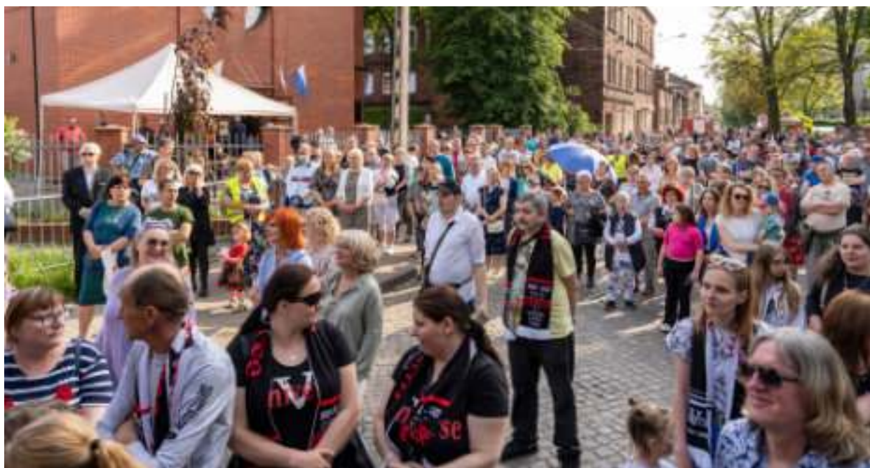
► Dzielnica tętni życiem - na zdjęciu wakacyjny festyn