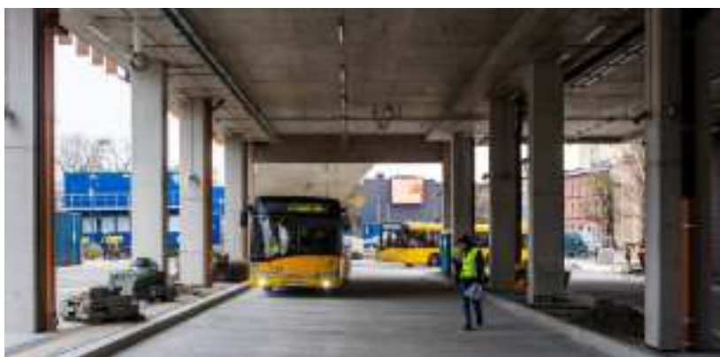
► W listopadzie odbywały się tu jazdy testowe autobusów