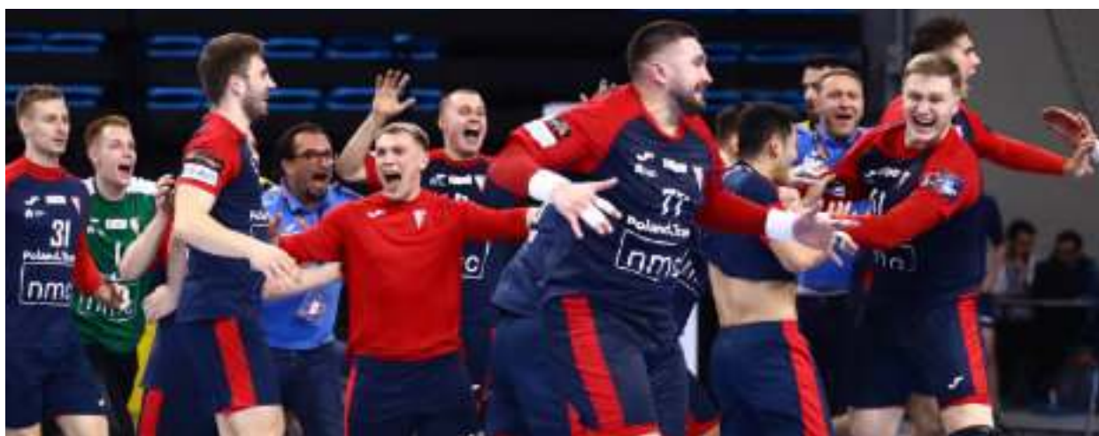
► Radość po zwycięstwie