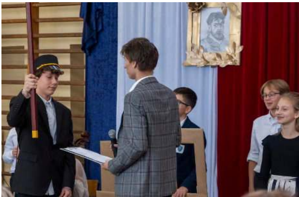
► Przygotowany przez uczniów program artystyczny

SZKOŁA PODSTAWOWA NR 7 DZIAŁA JUŻ OD 40 LAT