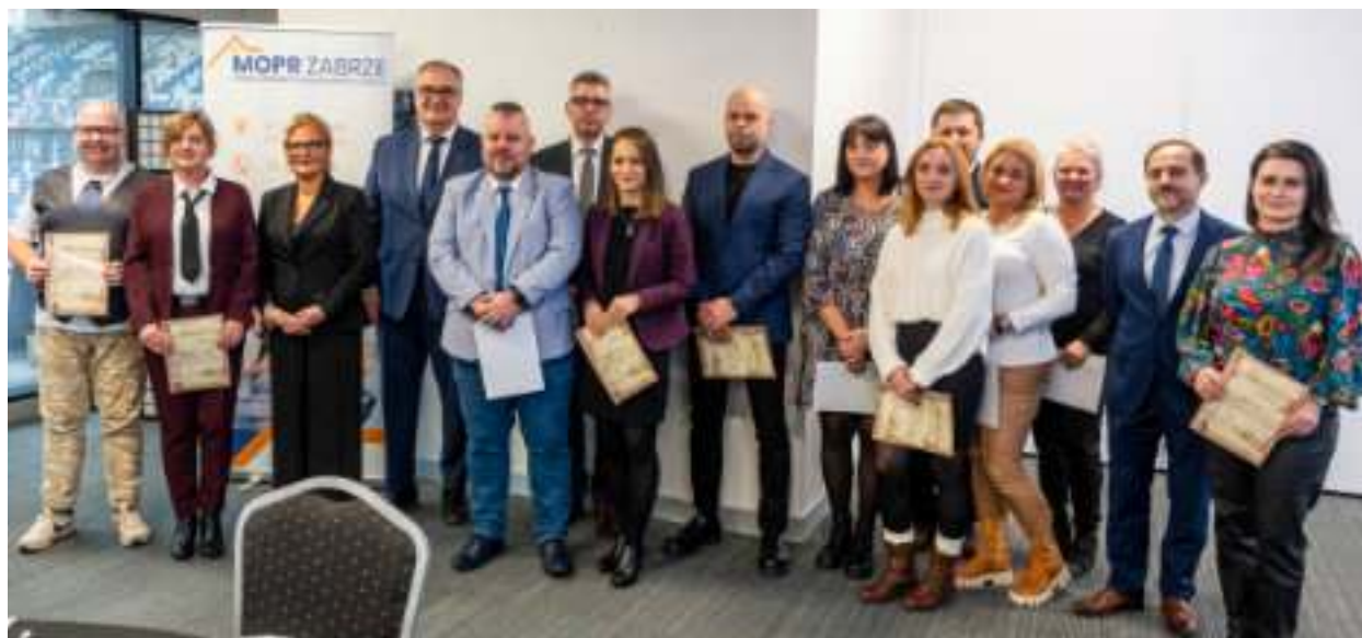
► Dzień Pracownika Socjalnego był okazją do wręczenia awansów i wyróżnień

Na co dzień otaczają opieką osoby chore, samotne, starsze, zepchnięte na margines. Wyciągają pomocną dłoń, gdy wszystko inne zawodzi. W listopadzie obchodziliśmy Dzień Pracownika Socjalnego.