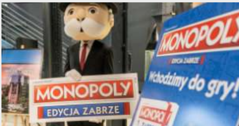
► Zabrzańska edycja gry to z pewnością ciekawy pomysł na prezent

kalnych. Na całym świecie sprzedano ponad 200 mln egzemplarzy gry. GOR