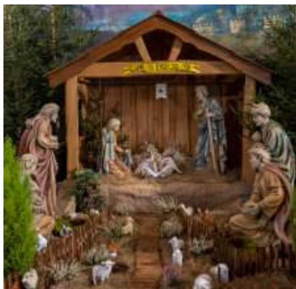
▶ Fot. UM Zabrze