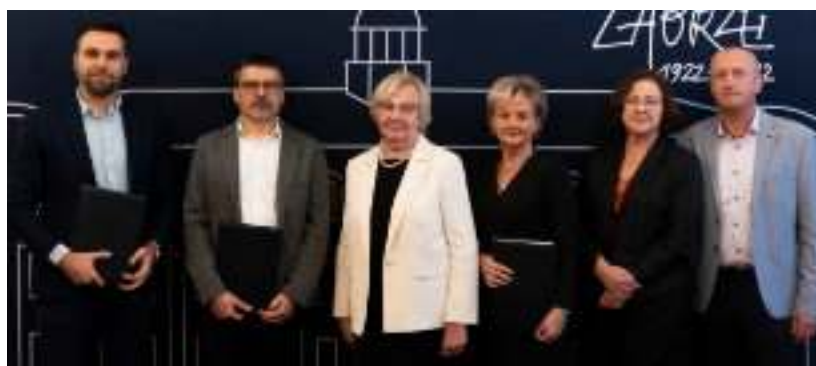
► Podpisanie umowy na remont drogi

Wartość podpisanej umowy to prawie 3 mln zł. Prace obejmą wymianę warstw bitumicznych, napra-