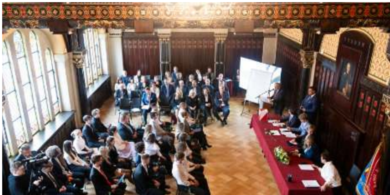
► Uroczysta sesja Młodzieżowej Rady Miasta odbyła się w odrestaurowanej sali witrażowej Muzeum Górnictwa Węglowego