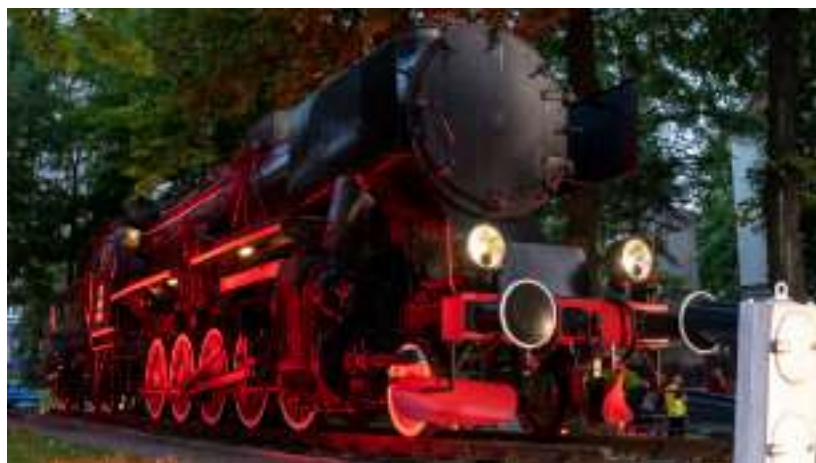
► Zabytkowa lokomotywa przed siedzibą DB Cargo Polska

Przypomnijmy, że Dzień Kolejarza przypada 25 listopada, w dniu