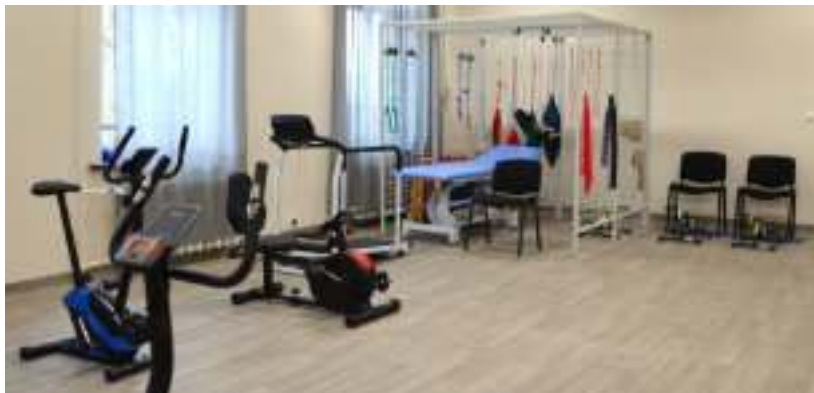
► Sala ze sprzętem do ćwiczeń i rehabilitacji

W kompleksowo wyremontowanym budynku została zamontowana m.in. winda, są tabliczki informacyj-