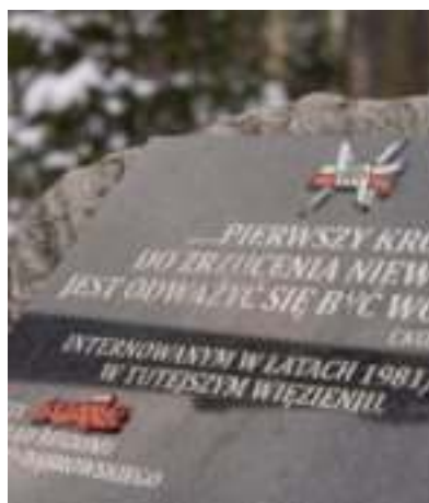
► Pamiątkowa tablica

Na terenie parafii św. Jadwigi, przy ul. Janika, mieści się zakład