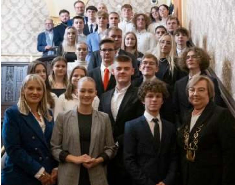
► Młodzi radni z przewodniczącą Rady Miasta i prezydentem Zabrze