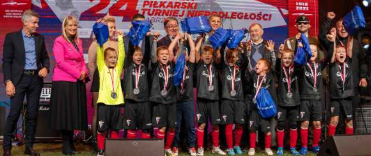
► Młodzi piłkarze nie kryli radości z sukcesu