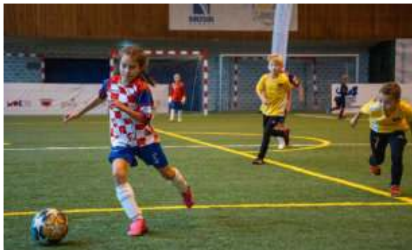
► Turniej rozegrano na profesjonalnej murawie w hali MOSiR