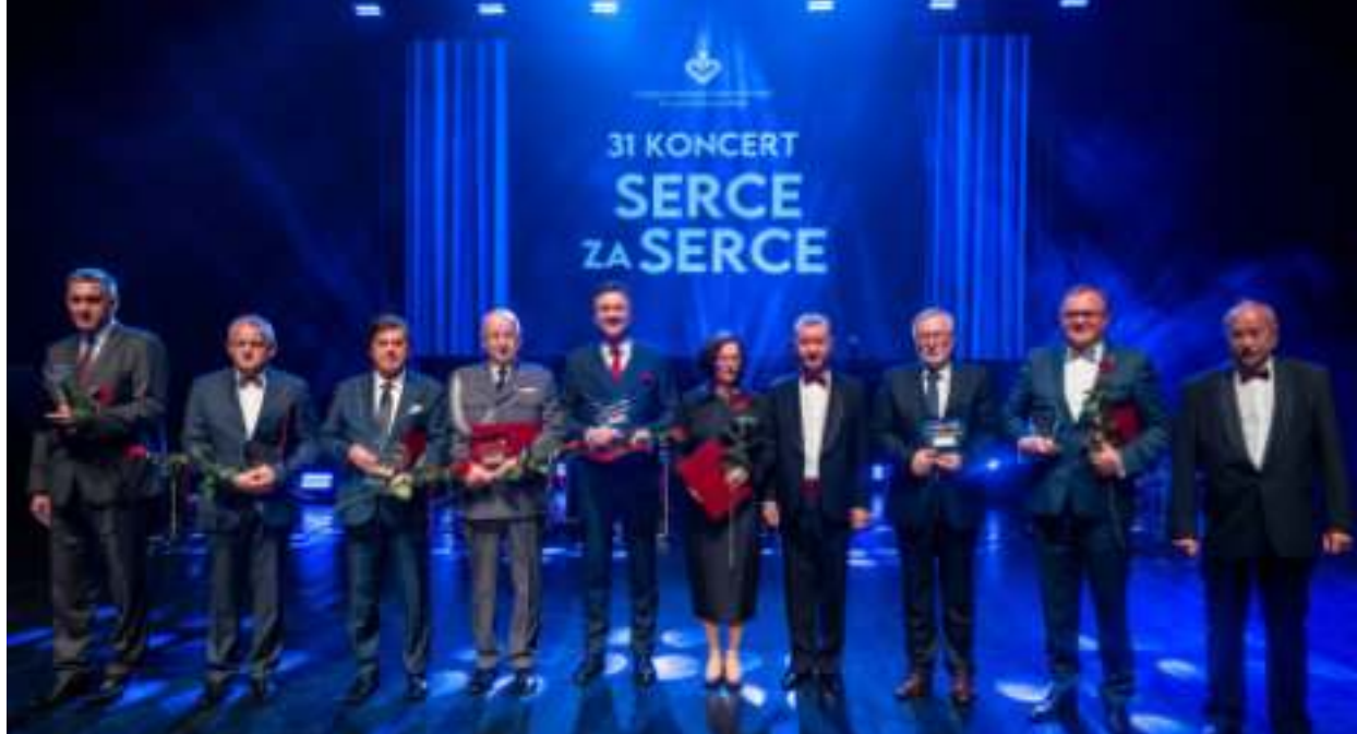
► Laureaci na scenie Domu Muzyki i Tańca