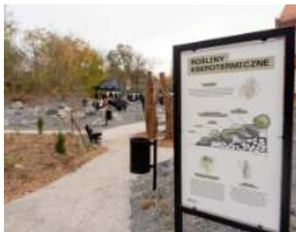
► Nowy skwer przy ul. Cmentarnej