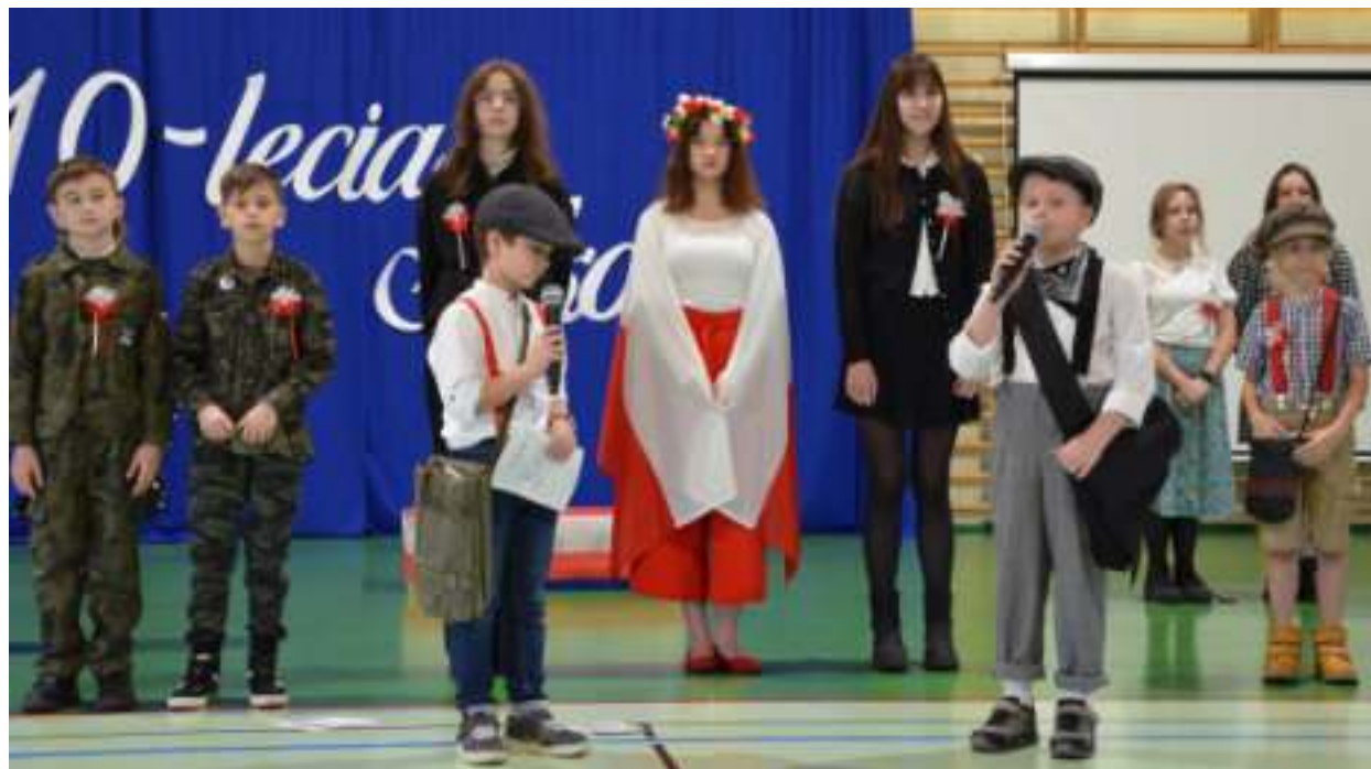
► Przygotowany przez uczniów program artystyczny