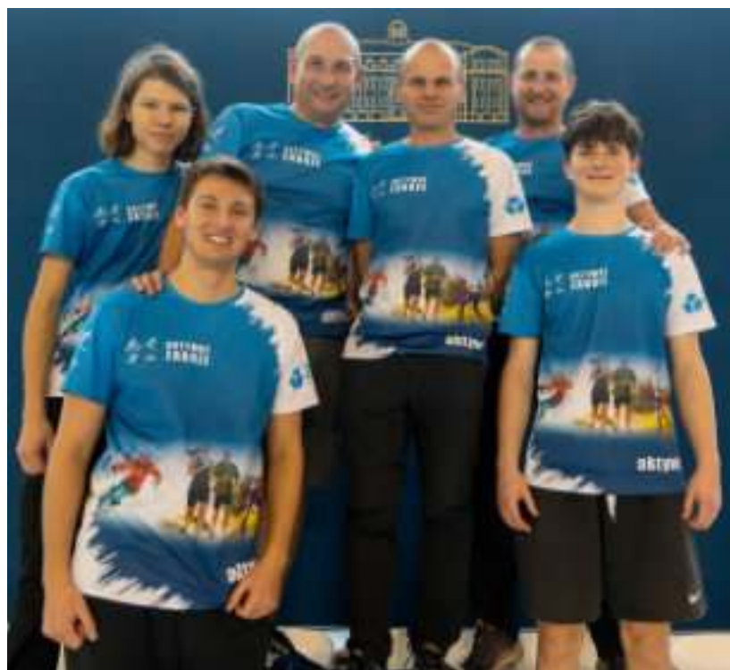
► Zawody zostały zorganizowane przez stowarzyszenie Aktywne Zabrze