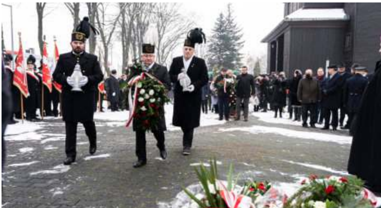
► Coroczne uroczystości w parafii św. Jadwigi