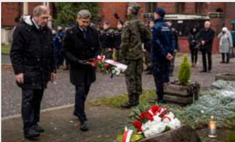
► Uczestnicy obchodów składają kwiaty

Nowego w Zabrzu. Obchody zakończył koncert lwowskich pieśni w wykonaniu kresowego barda – Andrzeja Szczepańskiego. GOR