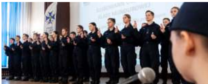
► Uroczyste ślubowanie

Profile mundurowe w ZSEU zostały utworzone po raz pierwszy