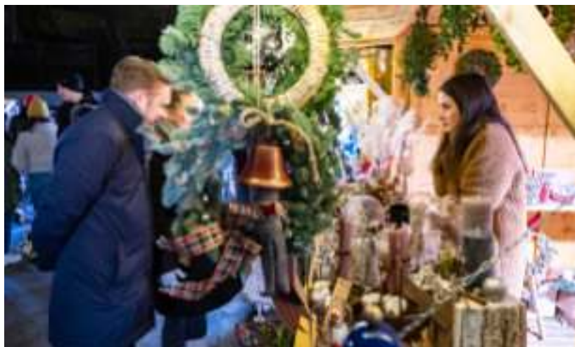
► Przedświąteczne jarmarki to już w Zabrzu tradycja

niespodzianek dla zakochanych. Iluminację będzie można odwiedzać do 14 lutego 2024 r., od wtorku do niedzieli oraz w poniedziałek 25 grudnia i 1 stycznia. Więcej informacji oraz bilety na www.parkmilionaswiatel.pl . GOR