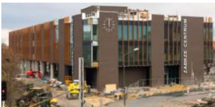
► Centrum przesiadkowe przy ul. Goethego