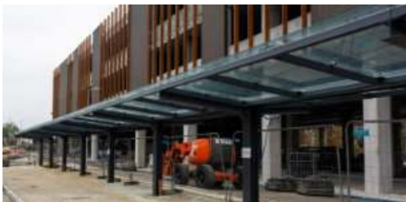
► Chroniące przed deszczem i śniegiem wiaty