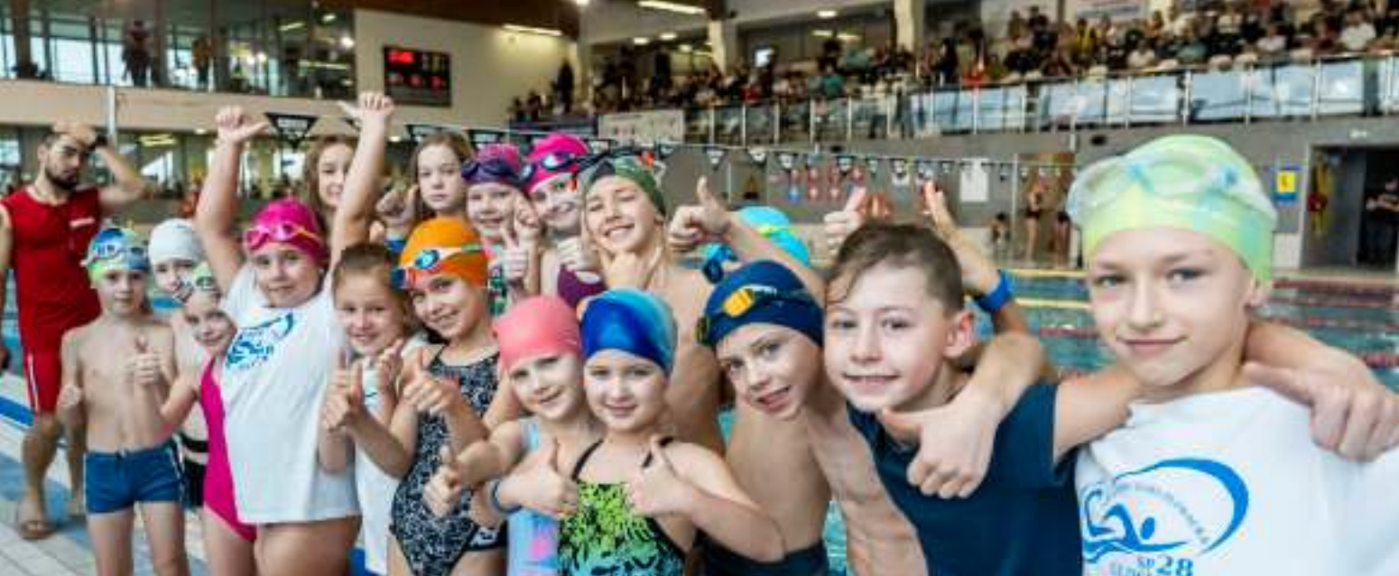
► Młodzi pływacy w kompleksie Aquarius Kopernik