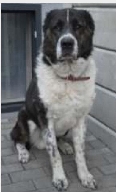
► Fot. Psitulmnie

Nie jest Ci obojętny los psów i kotów, którym zabrakło kochających właścicieli? Od kilku miesięcy nasi bezdomni czworonożni przyjaciele mogą liczyć na bezpieczny i wygodny dach nad głową w nowoczesnym schronisku, jakie miasto wybudowało w Biskupicach. Obecnie przebywa tu prawie 200 zwierząt. Zbliżająca się zima to czas, gdy każda pomoc jest mile widziana i potrzebna. Dlatego warto odwiedzić podopiecznych zabrzańskiego schroniska, by przywieźć im smakołyki, koce, środki czystości czy też zabawki. GOR