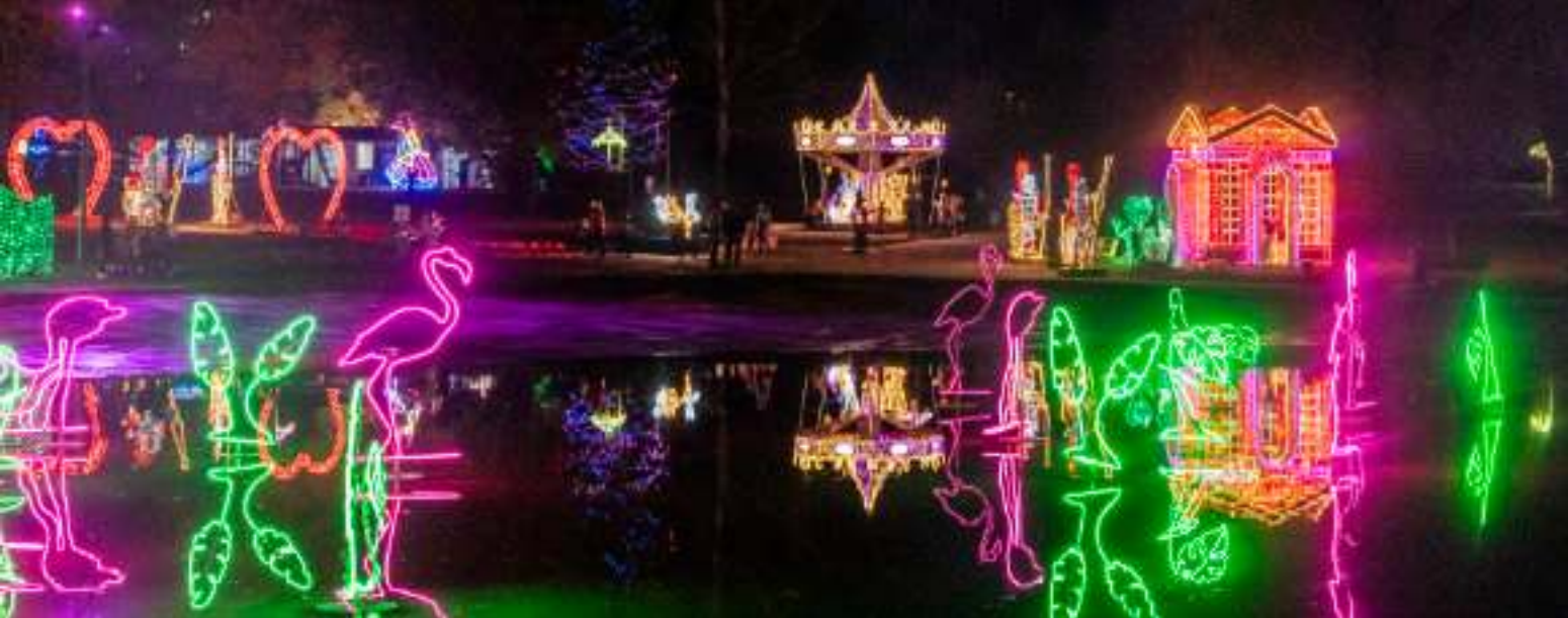
► Niezwykłe efektowne iluminacje w Parku Miliona Świąteł

TE MIEJSCA WARTO ODWIEDZIĆ Z CAŁĄ RODZINĄ