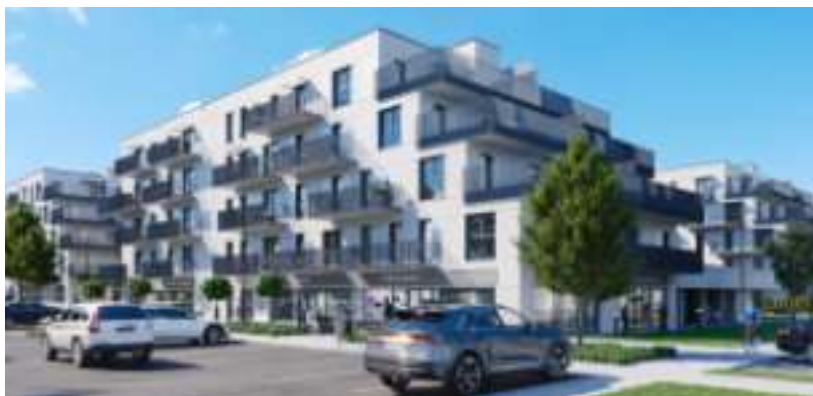
► Tak mają wyglądać gotowe budynki Wiz. TDJ Estate

– Projekt architektoniczny osiedla „Zielona Dolina” w pełni wykorzystuje atuty miejsca, w którym powstaje. Wybudowane mieszkania spełniają wymagania współczesnych nabywców. Działania spółki TDJ Estate są spójne z obowiązują-