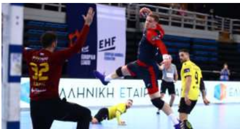
► Jedna z efektywnych akcji

Kto będzie grupowym rywalem zabrzan? Legendy! Pewnym awansu są bowiem zarówno bundesligowe Rhein-Neckar Löwen, jak i francuskie HBC Nantes. Oba zespoły są jednymi z faworytów całych rozgrywek, w końcu na swoim koncie mają udział w Final4. Choć tylko Lwy mogą pochwalić się zwycięstwem w Pucharze EHF (poprzedniku Ligi Europejskiej). Ale to odległa historia, bo do tego sukcesu doszło ponad 10 lat temu, w sezonie 2012/2013.