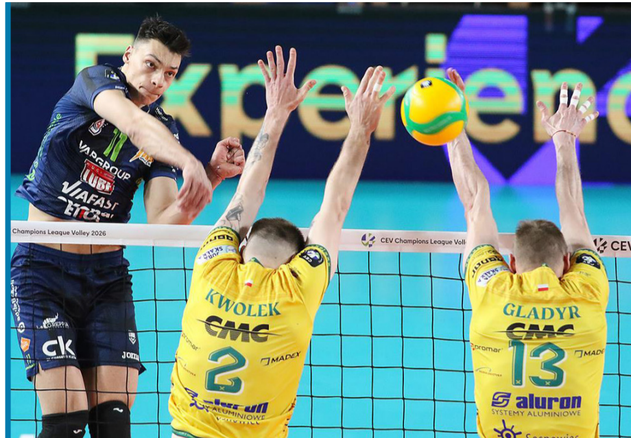
Nawet Aleksandar Nikotow, jeden z najlepszych siatkarzy na świecie, nie pomógł Cucine Lube w powstrzymaniu Zawierciańców.

Rozczarowanie za to panuje w Rzeszowie. Wydawało się, że Ziraat Bankkart Ankara jest w zasięgu Asseco Resovii. Tymczasem turecki zespół wygrał nadspodziewanie łatwo, co przed rewanżem w Ankarze stawia go w roli zdecydowane-