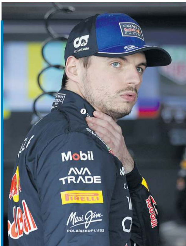
Holender z Red Bulla nie lubi „trudnych” pytań...

Nadchodzący weekend na torze Suzuka będzie ostatnią