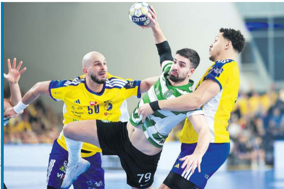
Wysitek w najbardziej elitarnych rozgrywkach na Starym Kontynencie absolutnie nie przekłada się na finansowy dobrobyt.