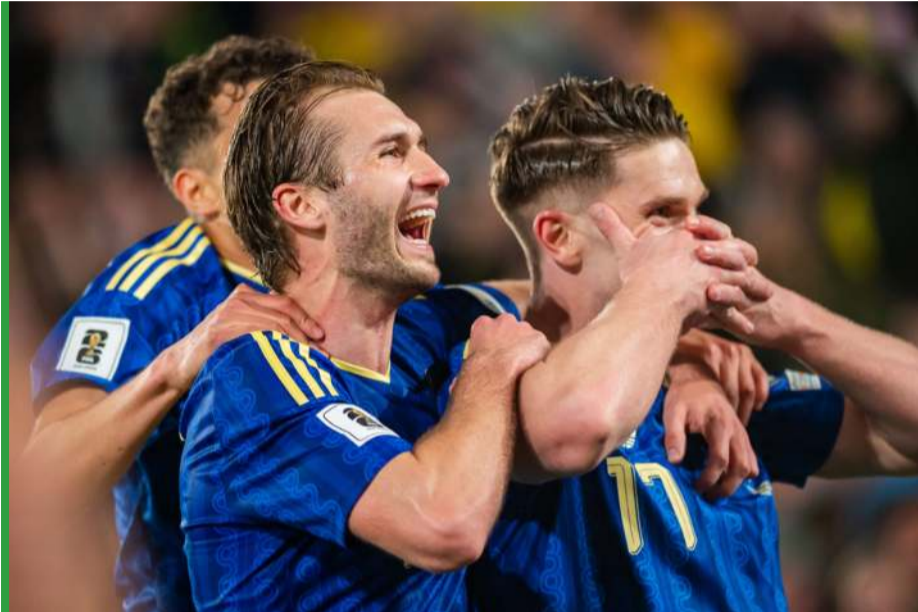
Bohater Szwecji Viktor Gyokeres celebrował z kolegami hat-tricka i awansu do finałów baraży o mundial.