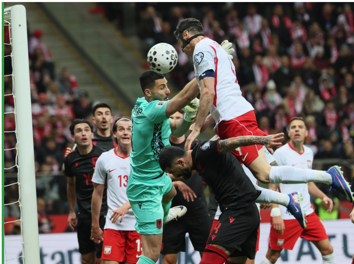
W takich okolicznościach Robert Lewandowski doprowadził wczoraj do wyrównania.