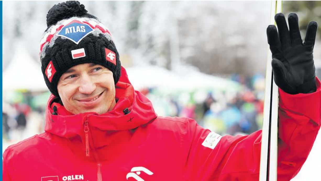
Kamil Stoch na Letalnicy odda pożegnalne skoki w swojej imponującej karierze.

To był wyjątkowy dzień dla naszego trzykrotnego mistrza olimpijskiego, który po raz ostatni w karierze startował w kwalifikacjach do konkursu Pucharu Świata. - Walczę do końca, choć głowa dawno już odmówiła posłuszeństwa. Mimo że jestem na skraju wyczerpania mentalnego, to jednak jestem tutaj - powiedział Kamil Stoch pod mamucią skocznią. - Wiem, że dużo ludzi przyjechało do Plani-