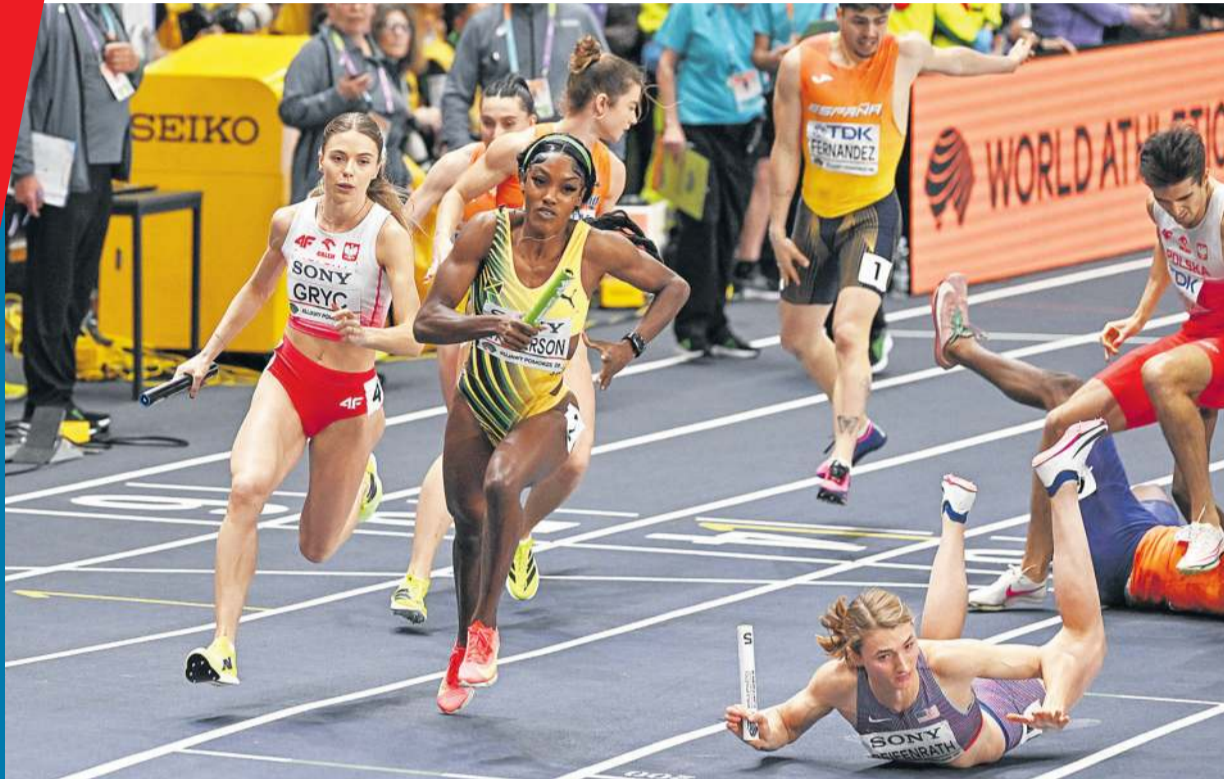
Właśnie decyduje się medal dla Polski w sztafecie mikst - sztafeta Jamajki powala Holendrów i Amerykanów...