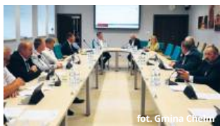
fol. Gmina Chełm

Władze gminy wychodzą z założenia, że nie mogły dłużej czekać na realizację zawartych w porozumieniu ustaleń. Ponad 400 ha gminnych terenów zostało włączonych w granice miasta ostatecznie w styczniu 2023 roku, na-