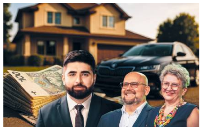
Oświadczenia pokazują, jak zarządzają prywatnym majątkiem ci, którzy zarządzają miastem

Z tytułu pracy w urzędzie miasta zarobił w 2024 roku blisko 195 tys. zł. Otrzymał też 30 tys. zł darowizny od osoby z I grupy podatkowej. Posiada dwa samochody – seata altea xl z 2012 roku (wspólnota majątkowa) oraz skodę octavię z 2011 roku (własność osobista).