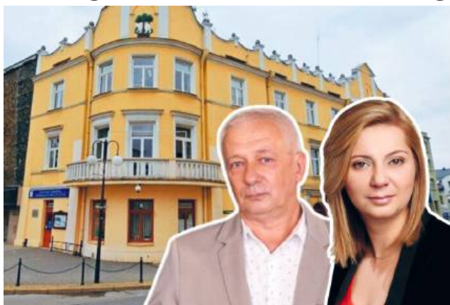
Od 1 sierpnia w Urzędzie Miasta Chełm nastąpiły istotne zmiany kadrowe w dwóch kluczowych departamentach: Komunalnym oraz Architektury, Inwestycji i Funduszy Europejskich

Od 1 sierpnia w Urzędzie Miasta Chełm obowiązują istotne zmiany kadrowe na stanowiskach kierowniczych w dwóch kluczowych departamentach: Komunalnym oraz Architektu-