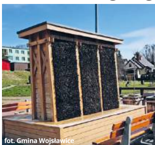
fol. Gmina Wojsławice

Wyjaśnienie tak postawionego problemu jest dosyć proste. Tężnia to drewniana konstrukcja, którą wypełniają drobne gałęzie tarniny. W jej wnętrzu montowana jest specjalna instalacja, która ma za zadanie dostarczać nasyconą solą wodę. Splywające po gałęziach strumienie wody rozpraszane są w formie niemal niewidocznej mgiełki, którą przebywający w pobliżu spacerowicze czy kuracjusze sanatoriów mogą wdychać i dzięki temu wzmacniać kondycję górnych dróg oddechowych. Wiadomo jednak, że grzyby rozwijają się zazwyczaj tam, gdzie jest nieustannie wilgotno i ciepło. Naukowcy z Uniwersytetu Rolniczego w Krakowie dowiedli niedawno, że krążąca w tężniach woda jest najczęściej zanieczyszczona mikrobiologicznie. A więc do organizmów osób, które korzystają z tego rozwiązania