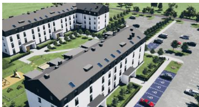
Tak mają wyglądać bloki, które zostaną wybudowane przy ul. Wiosennej w Pokrówce

Władze zapewniają, że już w najbliższym czasie odbędzie się spotkanie informacyjne dla osób, które byłyby zainteresowane tym rozwiązaniem.