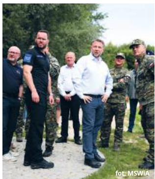
galną migracją – podkreślił minister Kierwiński.

Minister spraw wewnętrznych i administracji Marcin Kierwiński, podczas wizyty we Włodawie i Chełmie, zaprezentował zakończenie kluczowego etapu zabezpieczenia wschodniej granicy Polski. Elektroniczny system nadzoru wzdłuż Bugu domyka projekt objęcia całej granicy z Białorusią całodobowym monitoringiem. W obliczu rosnącej presji migracyjnej rząd zapowiada dalsze inwestycje i wzmacnianie kadrowe Straży Granicznej.