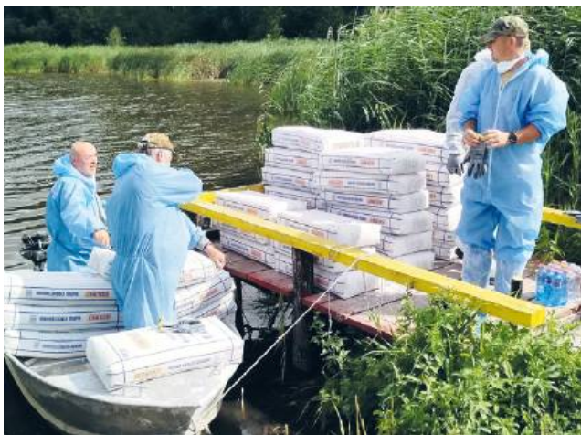
Trwa wapienie zbiornika. Prace przeprowadzają członkowie PZW

Jak czytamy w zawiadomieniu Prokuratury Rejonowej w Chełmie, 28 lipca zostało wszczęte śledztwo w sprawie „zanieczyszczenia w dniach 10-11 lipca 2025 r. w Chełmie,