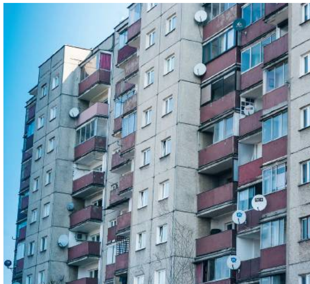
Dom z serialu „Czterdziestolatek” przypomina nam, że nieruchomości to nie tylko inwestycja, ale przede wszystkim świadectwo epoki, w której żyjemy.

Kultowy, pełen pułapek dom McCallisterów to prawdziwa willa w stylu georgiańskim, położona na przedmieściach Chicago. W filmie wydawał się