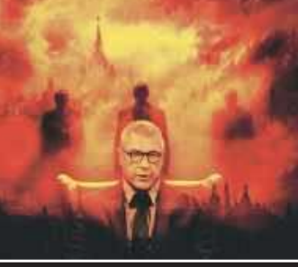
Tajemnica Giertycha / 4