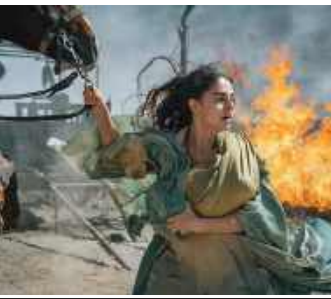
Maryja. Bohaterka, która jest / 60