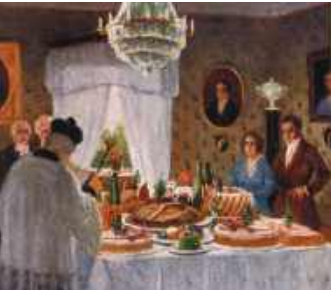
„Jelenie nadziewane, ciasta sążniste, okrutne baby...” / 14