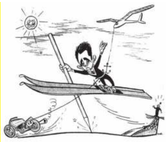
Szaleniec z Estonii. Jak skoczek narciarski wywołał bunt ... / 30