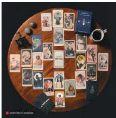
Everything is Recorded, RICHARD RUSSELL TEMPORARY, XL Recordings

Warto regularnie wracać do tych nagrań, bo wielością inspiracji i bogactwem dźwięków zaskoczą po wielokroć. ■