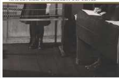
Piotr Gołdyn, „Życie codzienne nauczycieli w II Rzeczypospolitej”, Państwowy Instytut Wydawniczy, Warszawa 2024