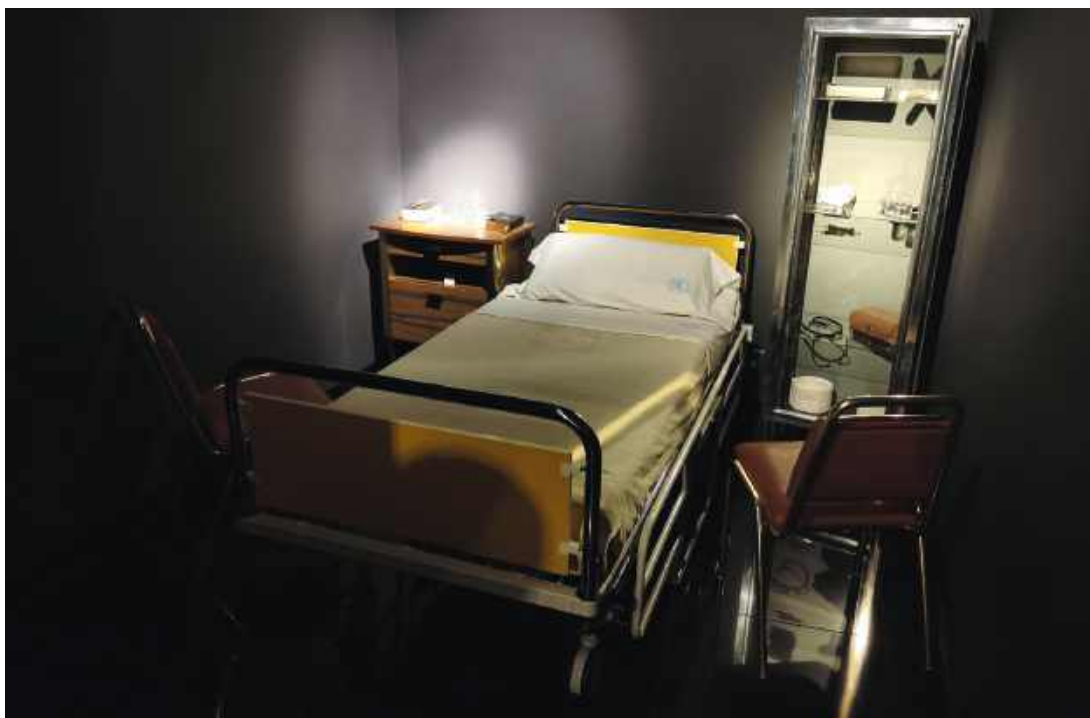
Odwzorowana w wadowickim muzeum Dom Rodzinny Jana Pawła II sala szpitalna, w której papież dochodził do siebie po zamachu i operacji.

Pawła II. Nie wiedząc, że Ojciec Święty już od niespełna dwóch lat nie przywdziewa kamizelki kuloodpornej, celuje w brzuch papieża. I rzeczywiście jedna z wystrzelonych z odległości trzech metrów kul sięga celu. Papież osuwa się na podłogę swojego papamobile. Rana obficie krwawi.