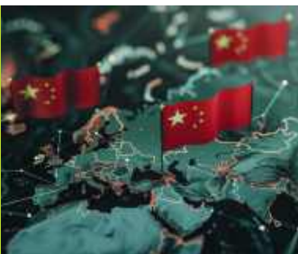
Trump rozmontowuje Nowy Jedwabny Szlak / 76