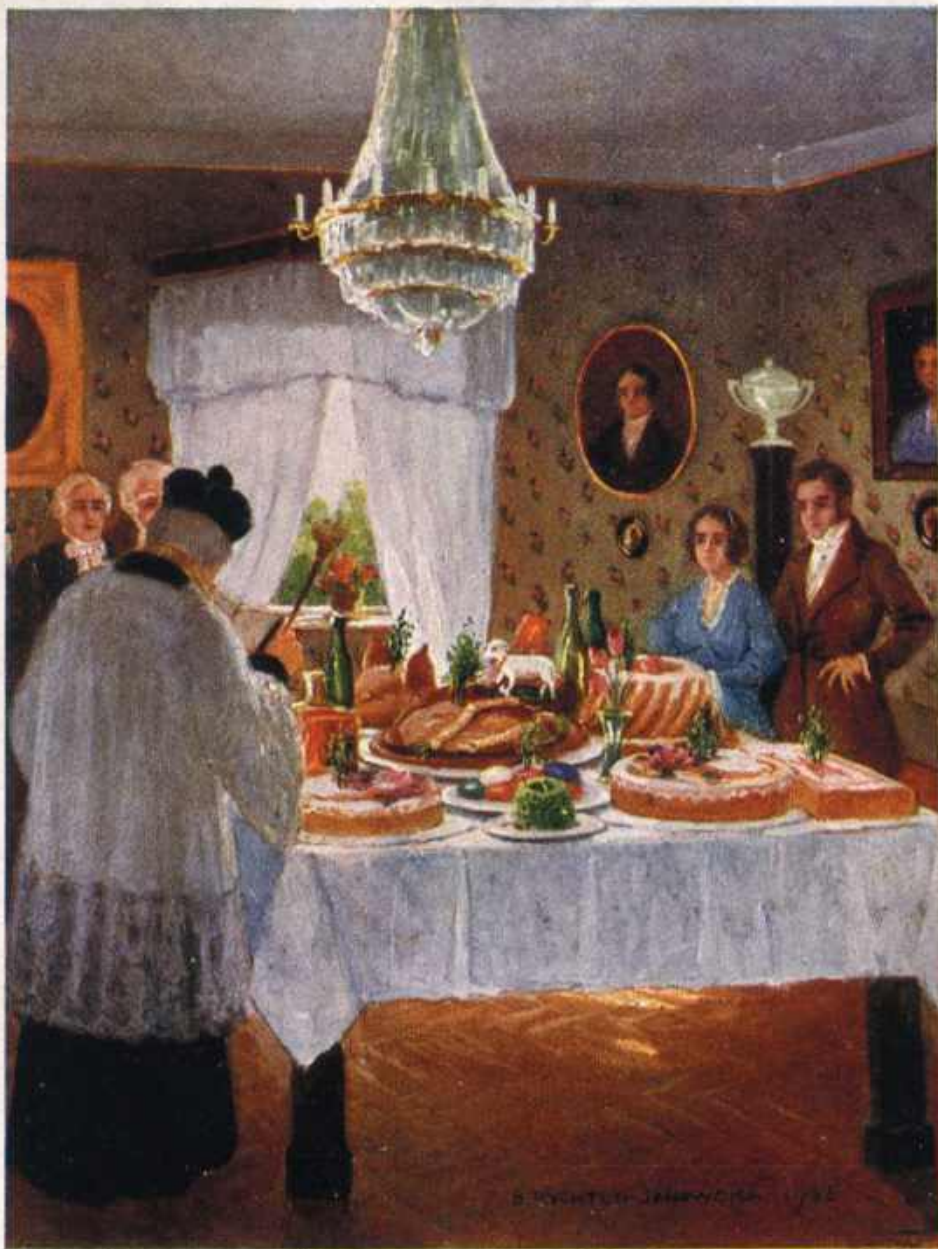
Br. Rychter-Janowska mal.