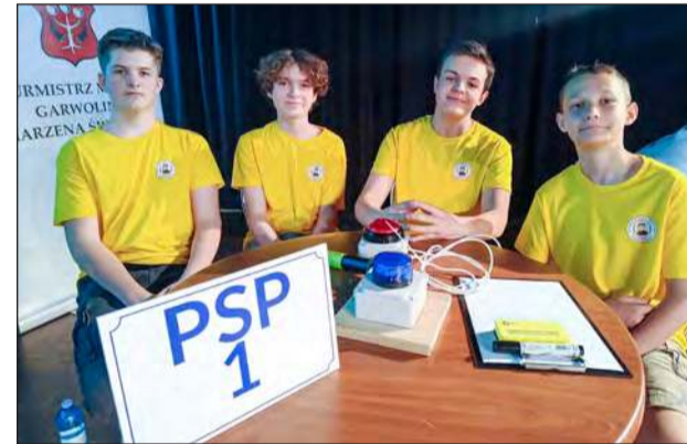
➤ Oto Giganci historii Garwolina! Drużyna PSP nr 1 w Garwolinie zdeklasowała przeciwników i zwyciężyła w historycznym quizie