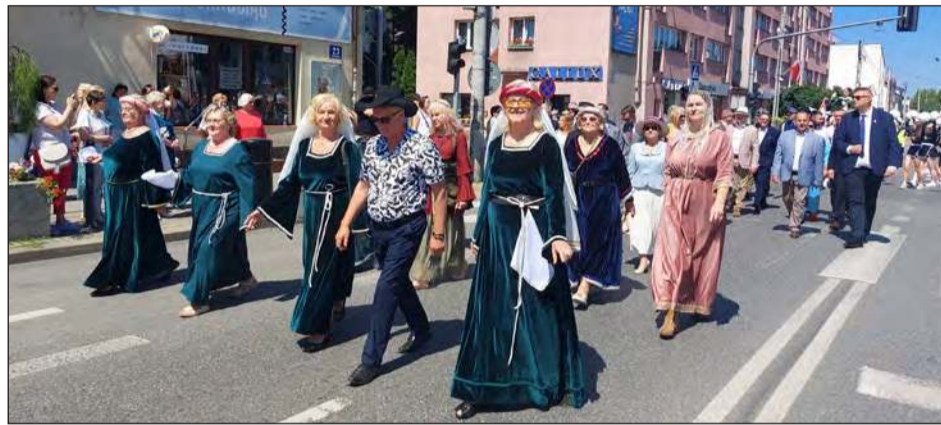
➤ Po mszy odprawionej w garwolińskiej kolegiacie ulicami miasta przeszedł barwny i radosny korowód

Garwolin tętnił życiem! Od uroczystej akademii, przez koncerty gwiazd, aż po szczytny bieg charytatywny - Garwolin po raz kolejny udowodnił, że potrafi świętować z rozmachem