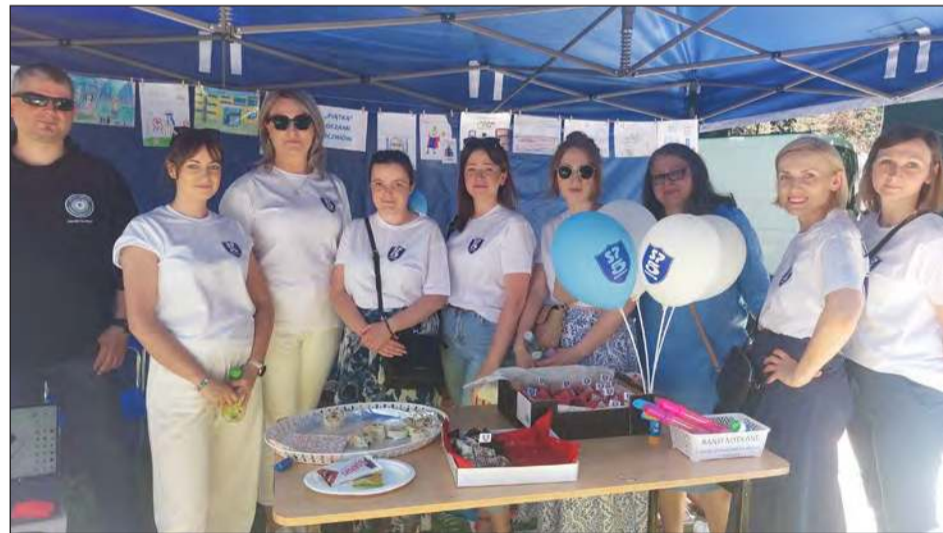
➤ W parku miejskim na wszystkich czekały liczne stoiska, wystawy rękodzieła, a także wesołe miasteczko i bogata strefa gastronomiczna.