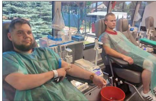
➤ Tradycyjnie do wspólnego świętowania dołączył Oddział regionalny PCK w Garwolinie, organizując akcję honorowego krwiodawstwa