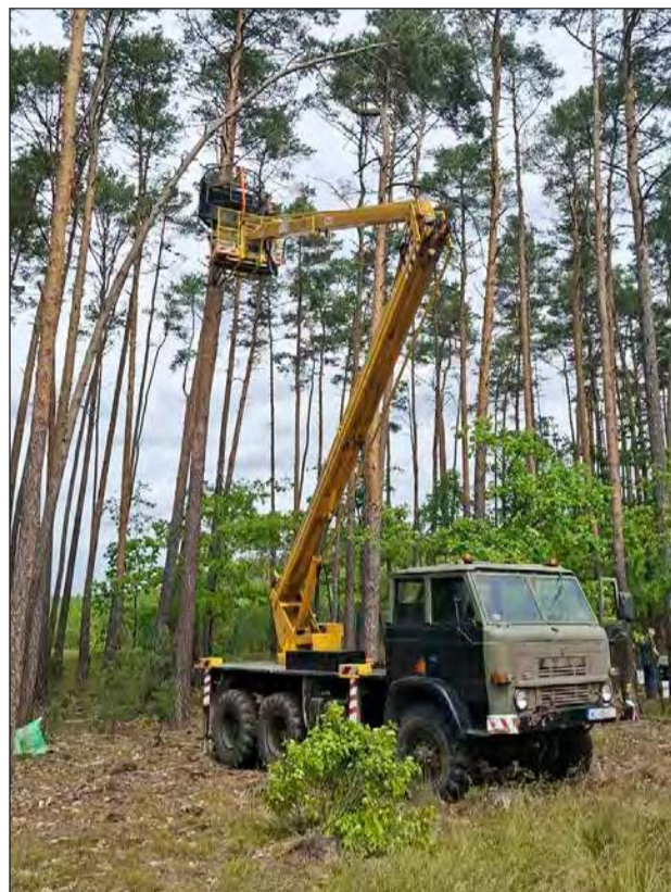
W naszych lasach zawieszono specjalne gniazda na drzewach, które czekają na swoich nowych lokatorów. Nadleśnictwo Garwolin dołączyło do ogólnopolskiego programu, który ma przywrócić sokoła wędrownego do polskich lasów

Do przygotowanych gniazd trafią młode, około pięcioletnie sokoły. Pochodzą one z hodowli. Przez około dwa tygodnie gniazda będą zamknięte. W tym czasie młode ptaki poznają okolicę gniazda. To zwiększa szan-