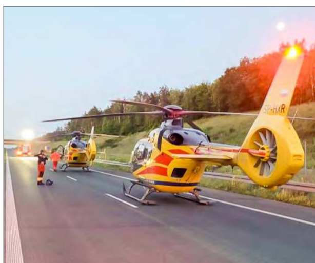
Na miejsce wezwano dwa śmigłowce Lotniczego Pogotowia Ratunkowego

Zgłoszenie o zderzeniu wpłynęło do służb ratunkowych w niedzielę, 15 czerwca, o godzinie 2:25. - Ze wstępnych ustaleń wynika, że 19-letni kierowca citroena uderzył w tył peugeot, którym kierował również 19-latek. peugeot wytrącony z toru jazdy wjechał w barierę, po czym wrócił na pas ru-