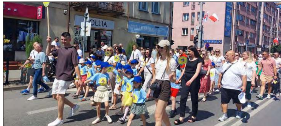
➤ W korowodzie maszerowali przedstawiciele garwolińskich klubów, szkół, przedszkoli, harcerzy, stowarzyszeń oraz mieszkańcy miasta