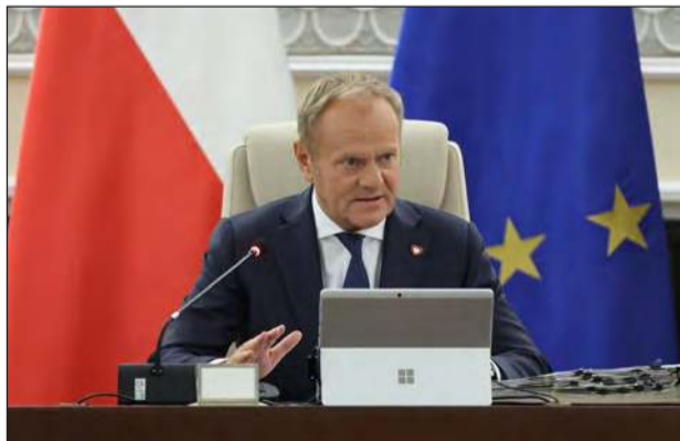
Premier Donald Tusk poddał swój gabinet pod ocenę Sejmu po tym, jak wybory prezydenckie wygrał Karol Nawrocki , popierany przez Prawo i Sprawiedliwość

Sejm Rzeczypospolitej Polskiej udzielił wotum zaufania Radzie Ministrów. Decyzja zapadła po debacie i niedawnych wyborach prezydenckich, w których zwyciężył Karol Nawrocki