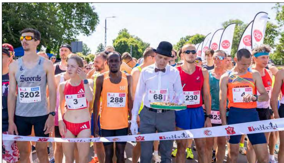
➤ Od wczesnych godzin porannych, począwszy od startu na moście na rzece Wildze, biegacze w każdym wieku wypełnili ulice miasta. Niezależnie od wybranego dystansu - czy to rodzinne 2 km, popularne 5 km, czy wymagające 10 km - wszyscy uczestnicy mieli jeden wspólny cel: wsparcie osób dotkniętych problemem przemocy