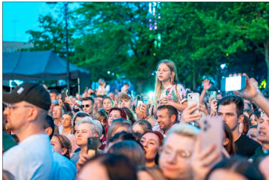
☛ Na koncert gwiazdy przybyły tłumy