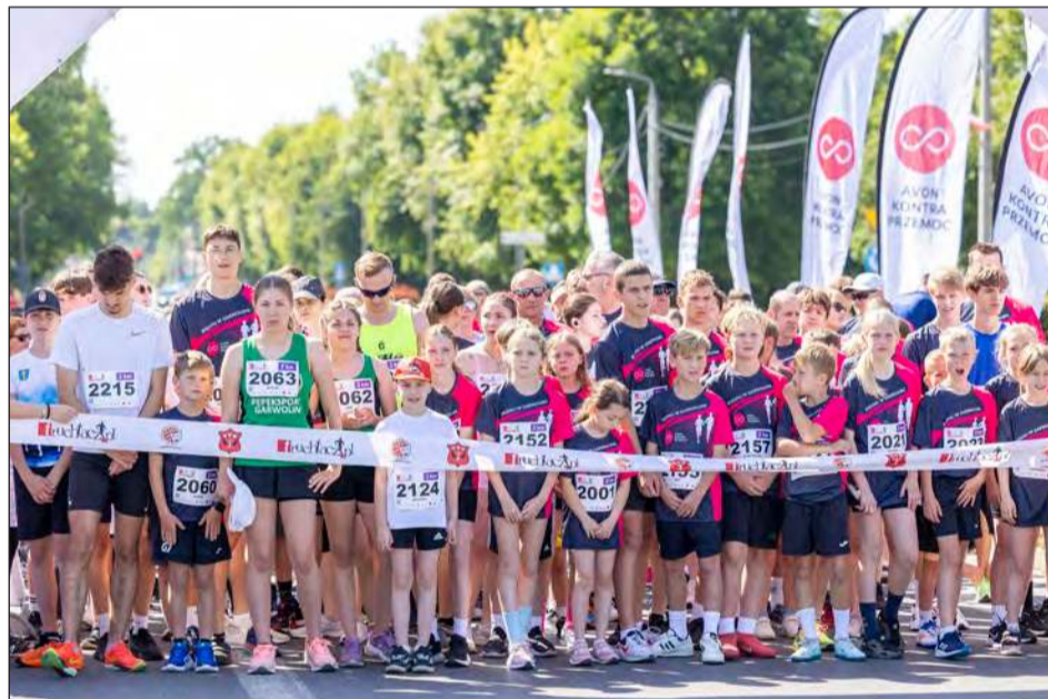
☛ Na starcie biegu „Avon Kontra Przemoc - biegnij w Garwolinie” stanęło blisko 700 zawodników