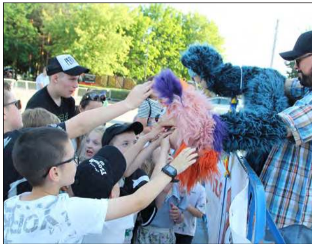
☛ W sobotnie popołudnie stwór Głodomór spotkał się z najmłodszymi mieszkańcami