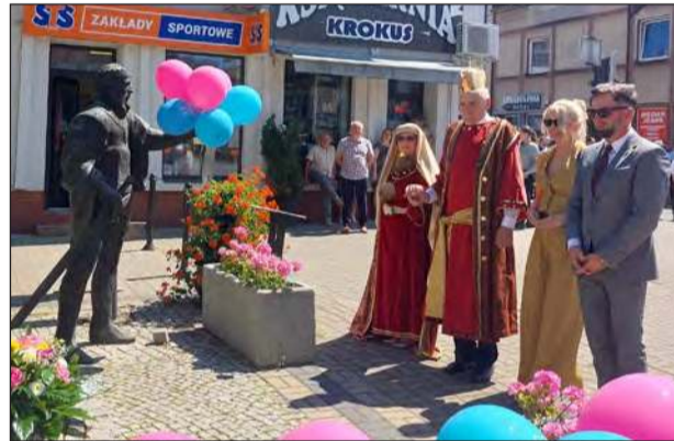
➤ Podczas korowodu złożono kwiaty przy pomniku księcia Janusza I