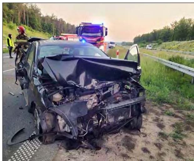
W zdarzeniu uczestniczyło łącznie osiem osób, z czego trzy z obrażeniami ciała trafiły do szpitala

Na drodze ekspresowej S17, na wysokości Górzna, doszło do wypadku z udziałem trzech samochodów osobowych. W zdarzeniu uczestniczyło łącznie osiem osób, z czego trzy z obrażeniami ciała trafiły do szpitala. Na miejsce wezwano dwa śmigłowce Lotniczego Pogotowia Ratunkowego