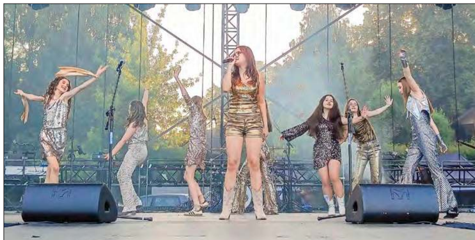
☛ W gronie występujących w sobotę znalazła się grupa Best Vocal Studio, która zaprezentowała przeboje zespołu ABBA