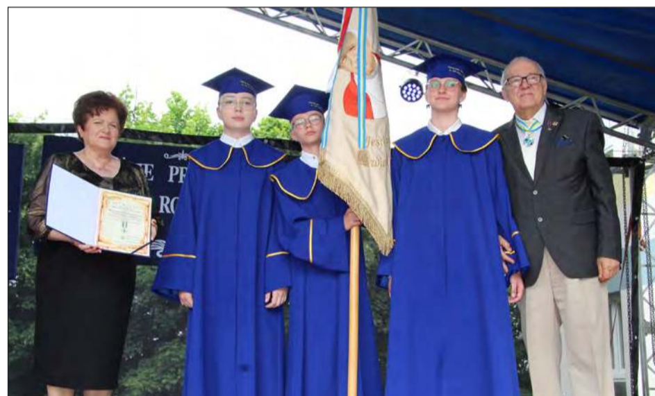
❖ Szkoła w Brzegach jest trzecią placówką w Polsce, która otrzymała Krzyż Świętego Jana Pawła II

nauczania i wychowania młodych ludzi. Tyle pokoleń przewinęło się przez szkolne mury, tyle wspomnień, wzruszeń i sukcesów - mówiła wzruszona dyrektor, składając podziękowania.