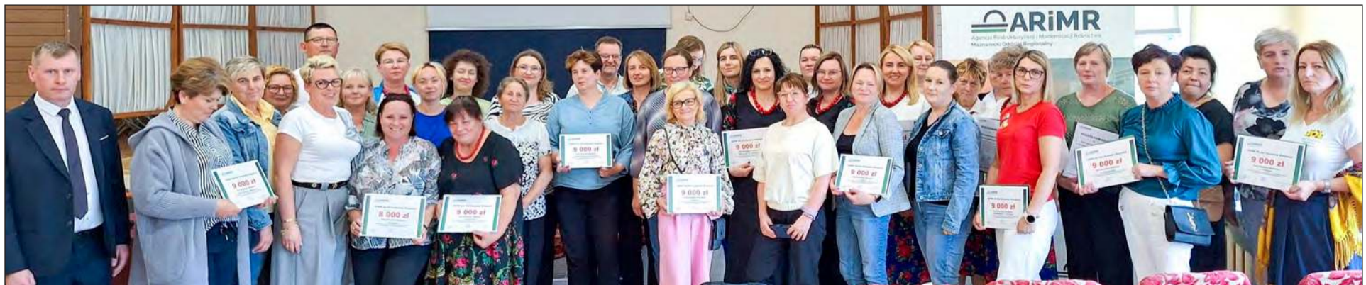
W powiecie odbyło się już pierwsze z trzech zaplanowanych szkoleń dla Kół Gospodyń Wiejskich. Tym razem spotkanie było przeznaczone dla KGW z gmin: Borowie, Miastków Kościelny, Parysów i Pilawa.

Powiat garwoliński może pochwalić się największą liczbą Kół Gospodyń Wiejskich na całym Mazowszu! Jest ich aż 138, a większość z nich już skorzystała ze wsparcia finansowego, które pozwoli im działać jeszcze prężniej na rzecz lokalnych społeczności.