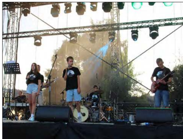
☛ Dużo energetycznej muzyki zaserwowała Szkolna Banda Muzyczna z Publicznej Szkoły Podstawowej nr 2 w Garwolinie