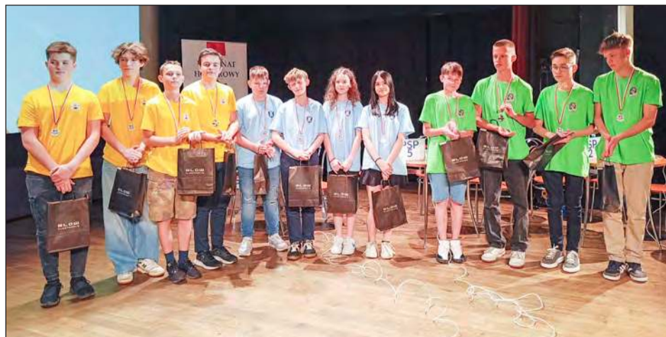
☛ Drużyny z garwolińskich szkół - Jedynki, Dwójki i Piątki - otrzymały upominki od sponsorów. Ich wiedza historyczna o Garwolinie zaskoczyła nawet komisję konkursową