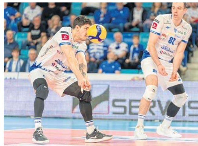
Siatkarze Ślepska Malow Suwałki w poniedziałek, 2 marca zagrają na wyjeździe z InPost ChKS Chełm

Ich poniedziałkowy rywal z Chełma nie jest jeszcze pewny