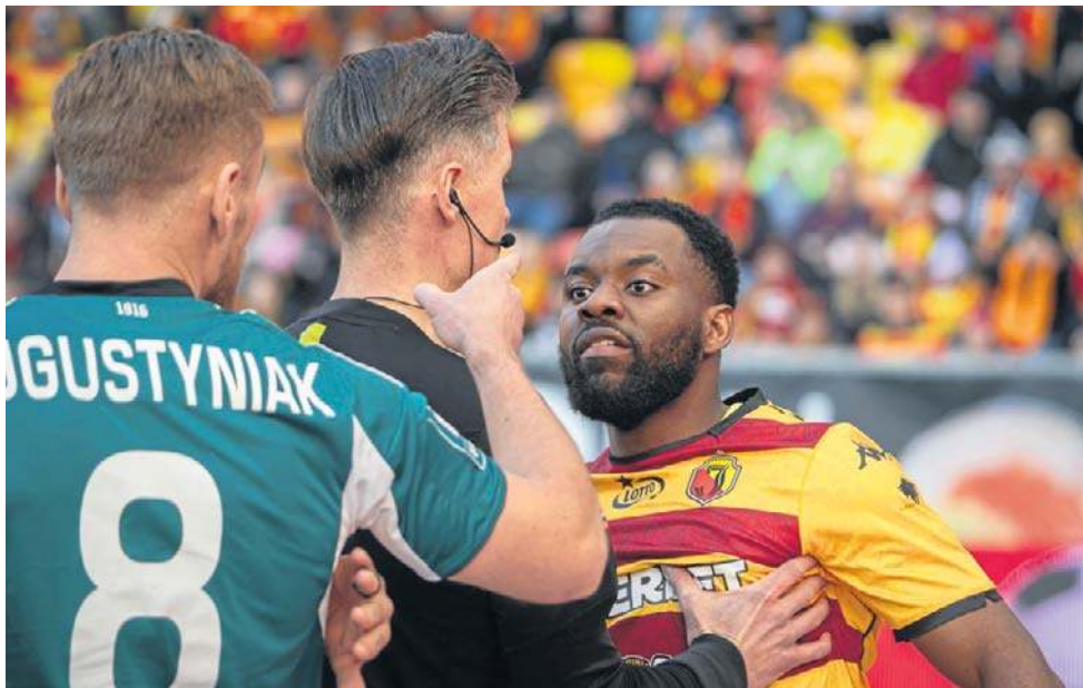
W meczu Jagiellonii z Legią były emocje, nerwy, sporo goli. Słowem: widowisko.

Potyczka zaczęła się od mocnego uderzenia, bo już w 4. minucie w polu karnym