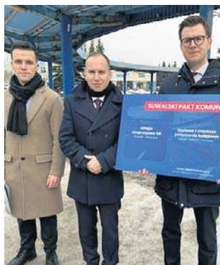
Konferencja dotycząca paktu odbyła się w piątek