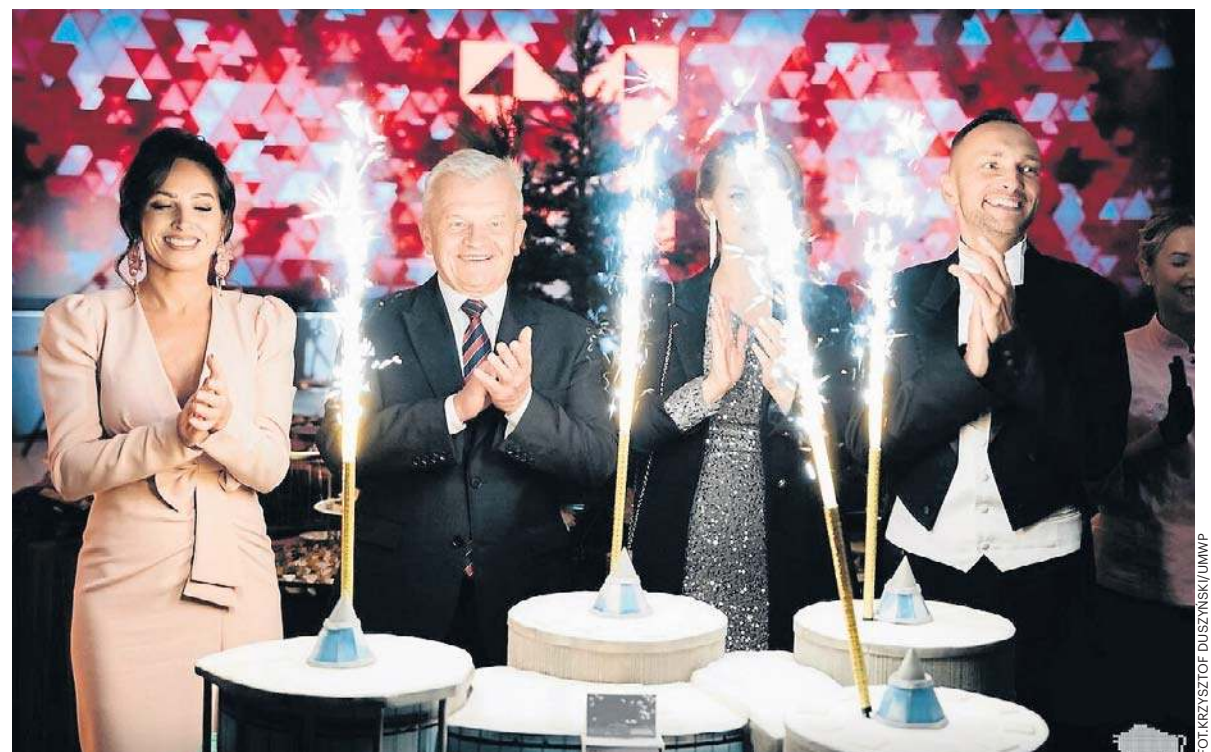
Remont kultowej budowli trwał dwa lata. Podczas oficjalnego otwarcia na gości czekał m.in. tort w kształcie... Spodków.