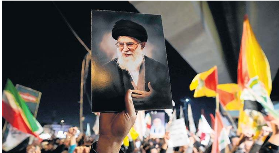
Tysiące osób wyszły na ulice po ogłoszeniu informacji o śmierci najwyższego przywódcy duchowo-politycznego Iranu, ajatollaha Alego Chameneia

Proces przekazania władzy w Iranie po śmierci ajatollaha Alego Chameneia rozpoczął się wczoraj. – Wkrótce zostanie sformowana tymczasowa rada przywódcza. Do czasu wyboru przyszłego przywódcy kraju odpowiedzialność przejmą prezydent Masoud Pezeszkian, szef władzy sądowniczej Golamhosejn Mohseni Edżei oraz jeden z prawników Rady Strażników – oznajmił sekretarz irańskiej Najwyższej Rady Bezpieczeń-