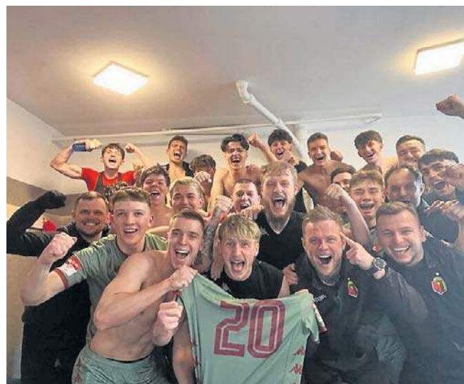
Radość piłkarzy rezerw Jagiellonii ze zwycięstwa w meczu z GKS Wiekielec 2:0

Koszykówka Żubry Abakus Okna pokonały kandydata do awansu