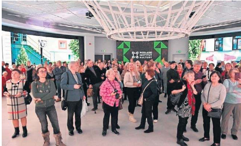
Dzień otwarty zorganizowany przez Podlaski Instytut Kultury - gospodarza Spodków - okazał się być strzałem w dziesiątkę. Przyszły tłumy Białostoczanie

- Pamiętam Spodki z czasów, gdy była tu kawiarnia Elida. Jest bardzo fajnie. Spodki zwiedza dużo ludzi. To dowód na to, że białostoczanie potrzebują takich akcji. Cieszę się bardzo