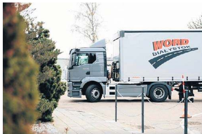
Wszystkie egzaminy praktyczne w kategorii C+E odbywać się będą wyłącznie na tym nowym pojeździe

Kategoria C+E uprawnia do kierowania zespołem pojazdów składającym się z samochodu ciężarowego oraz przyczepy lub naczępy. Egzamin praktyczny obejmuje zarówno zadania na placu manewrowym, jak i jazdę w ruchu drogowym.