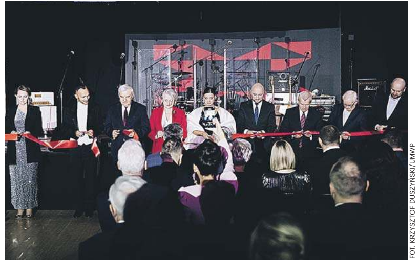
Wyremontowane Spodki oficjalnie zostały otwarte w piątek. Było przecięcie wstęgi, był też m.in. tort w kształcie Spodków czy koncert

- Budowano szybko, ale akurat Spodki - choć miały być tymczasowe - zbudowano w taki sposób, że będą trwały długo. Wiecznik. Chciałbym też podkreślić, że ta inwestycja ma dobrą prasę. Nie zdarza się to co dzień. Ale jeśli zrobi się coś dobrze, każdy może to docenić. Jest niewiele takich rzeczy, które nie budzą kontrowersji, protestów - podnosił prezydent.