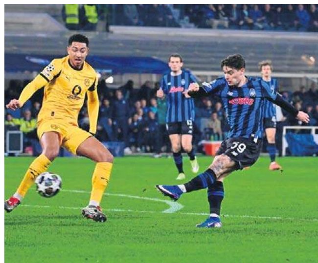
Nicola Zalewski w 1/8 finału Champions League sprawdził wraz z kolegami z Atalanty - formę Bayernu Monachium

1/8 finału: 12 i 19 marca (losowanie 27 lutego); 1/4 finału: 9 i 16 kwietnia; 1/2 finału: 30 kwietnia i 7 maja; finał: 20 maja 2026 r. w Stambule. ©