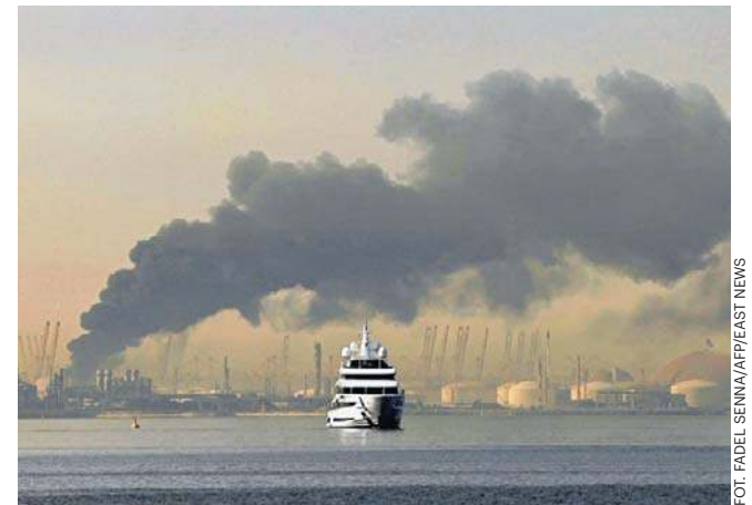
W niedzielny poranek w miastach Zatoki Perskiej: Dubaju, Dosze i Manamie, słychać było wybuchy

Ministerstwo spraw wewnętrznych Omanu podało, że podjęto działania w związku z niewielkim pożarem, do którego doszło w strefie przemysłowej po upadku fragmentów straconej rakiety. W ataku na tankowiec Skylight płynący pod banderą Palau rannych zostało czterech marynarzy. Całą 20-osobową załogę składającą się z Indusów i Irańczyków ewakuowano. Nie jest na razie jasne, kto zaatakował tankowiec, ale – jak przypominała agencja AP – Iran zagroził wcześniej, że uderzy w statki płynące przez Cieśninę Ormuz.