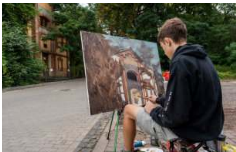
► Fot. UM Zabrze