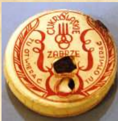
► Papierowe pudełko po cukierkach. Z kolekcji Dariusza Guza.

Na tej samej kondygnacji, stoisko nr 25 przygotowało Państwowe Zjednoczenie Przemysłu Cukierniczego w Zabrzu. Podobnie jak w przypadku Zjednoczenia Przemysłu Piwowarsko-Słodowniczego, jego siedziba mieściła się przy ul. H. Sienkiewicza 28. Laboratorium oraz dział gospodarczy znajdował się kilka budynków dalej, pod numerem 36, a centrala zbytu oraz jeden z punktów sprzedaży w kamienicy przy ul. Wolności 293. Jak informował cytowany powyżej Śląski Informator Przemysłowy, „stoisko cukiernicze olśniewa masą różnorodnych cukrów, barwnie i efektownie rozłożonych”. Na ladach, w 18 szklanych