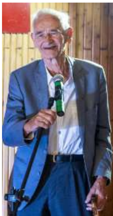
► Syn rotmistrza Andrzej Pilecki

wrześniowej, następnie rozpoczął konspiracyjną działalność w Warszawie, tworząc wraz z innymi oficerami Tajną Armię Polską. W 1940 r. przedostał się do KL Auschwitz, by zbadać możliwości uwolnienia