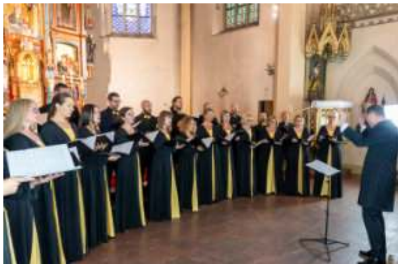
► O oprawę wydarzenia zadbał również chórzyści

konkursów organowych, który wystąpił podczas tegorocznej edycji w kościele NMP Matki Kościoła. - Muzyka organowa do najłatwiejszych nie należy, tym bardziej należy się cieszyć, że tak szeroka publiczność korzysta z takich możliwości, które oferuje im festiwal – dodaje. MM