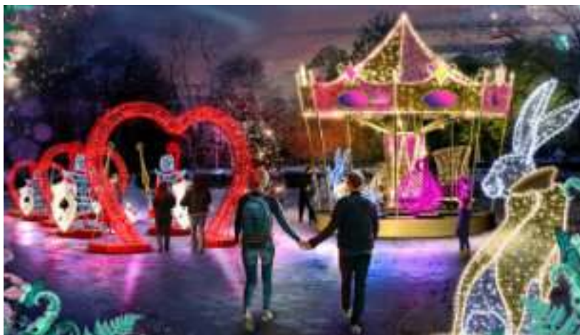
► Już wkrótce Kąpielisko Leśne ponownie zachwyci po zmroku Wiz. Multidekor

stały zaprojektowane z myślą o rodzinach z dziećmi oraz seniorach spędzających czas z wnukami. Przygotowano także wiele świetlistych niespodzianek dla zakochanych.