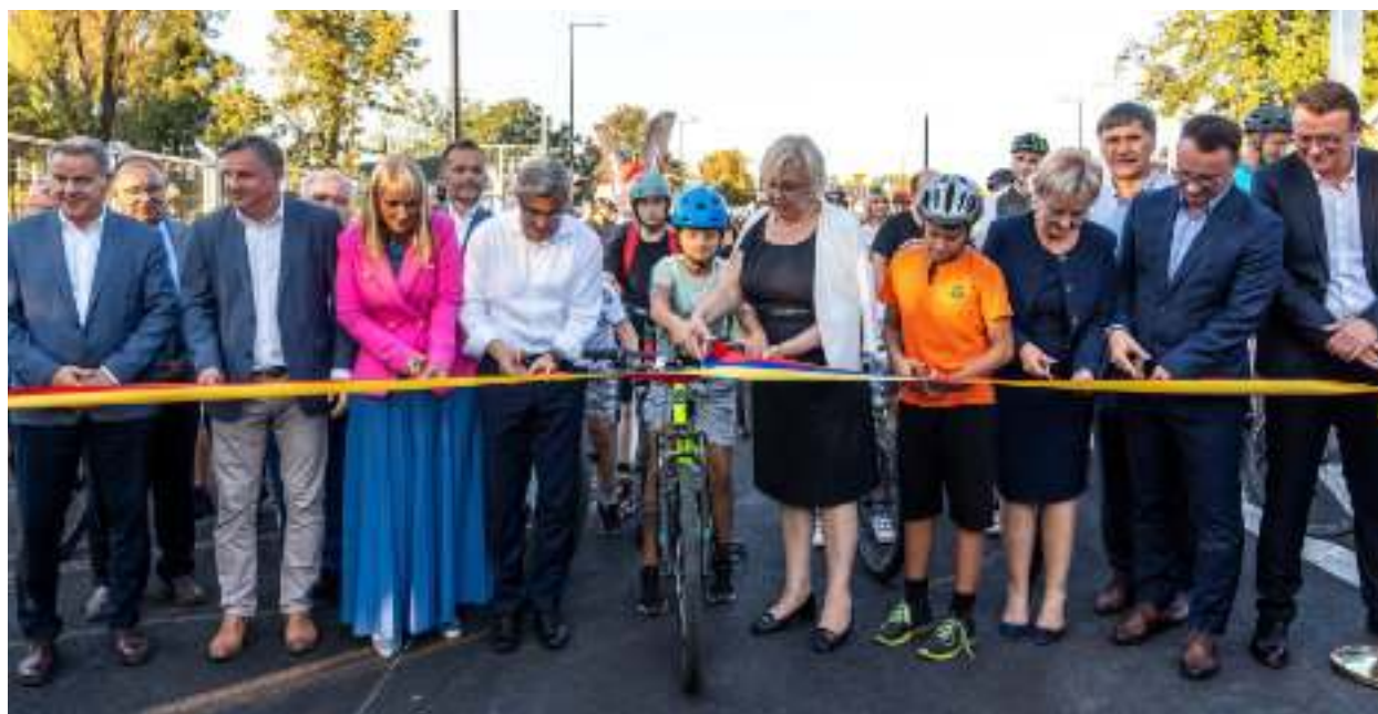
► Symboliczne przecięcie wstęgi