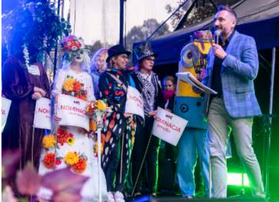
► Tradycyjnie już nagrodzeni zostali autorzy najbardziej efektownych strojów