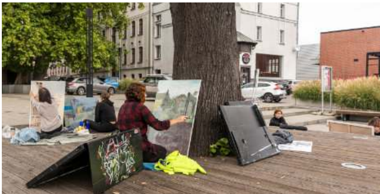
► Fot. UM Zabrze