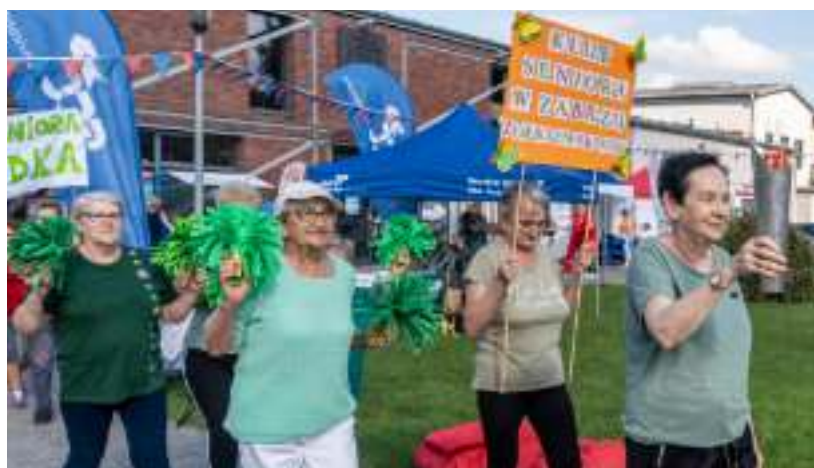
► Seniorada odbyła się w Parku 12C Sztolni Królowa Luiza

nie chcemy ich aktywizować. Niedobrze, kiedy starsze osoby zamykają się w swoich domach, nie chcą uczestniczyć w różnych spotkaniach, bo wówczas proces starzenia się postępuje szybko. A wiemy przecież z doświadczenia, że aktywny senior to zdrowy senior, cieszący się życiem. Cieszę się, że taka kolejna inicjatywa w Zabrzu powstała – podsumowuje wiceprezydent Zabrze Krzysztof Lewandowski. MM