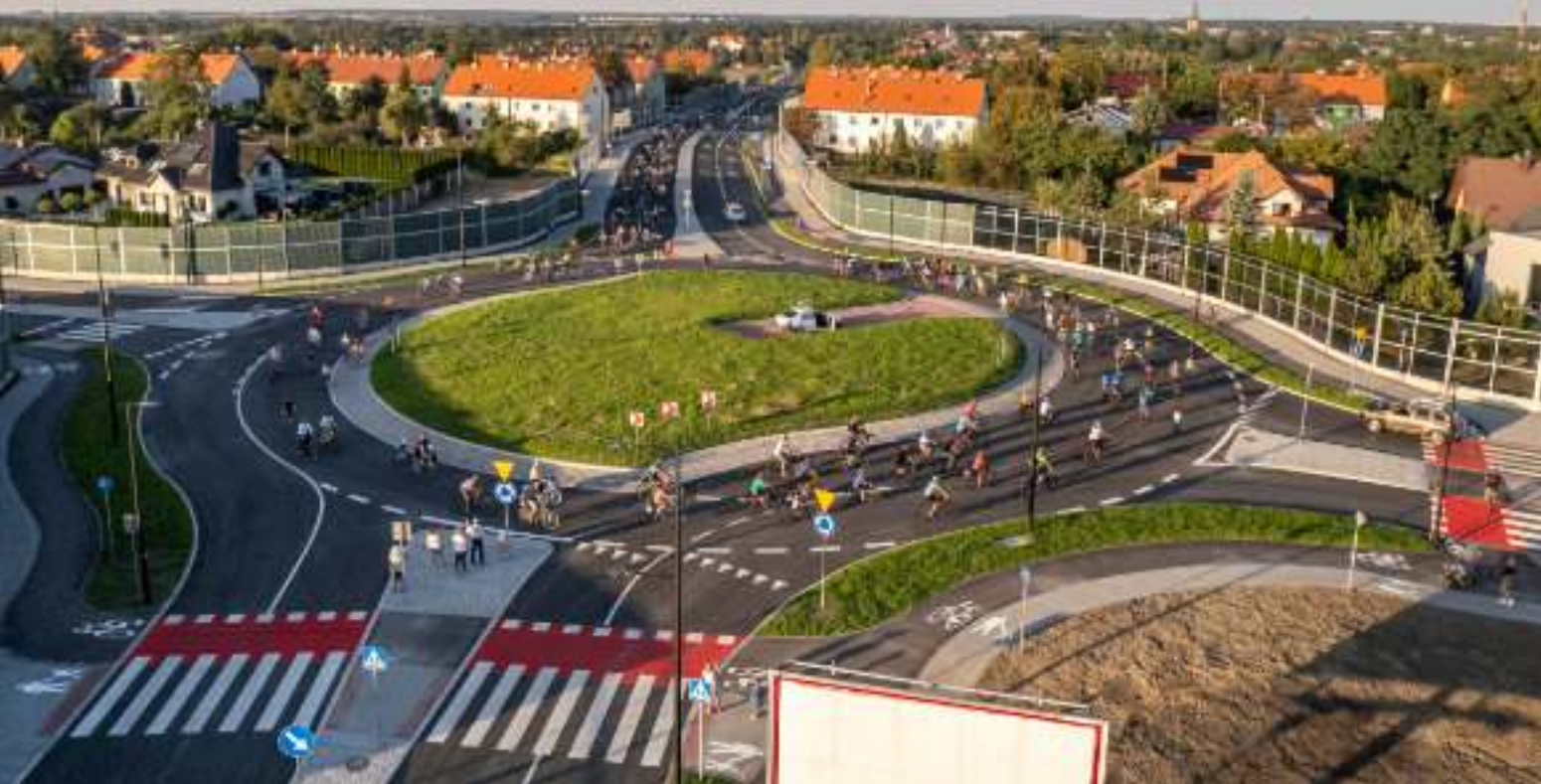
► W ramach inwestycji powstało m.in. rondo

NOWY ODCINEK DROGI JAKO PIERWSI PRZETESTOWALI ROWERZYŚCI