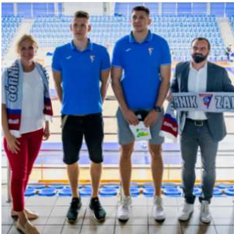
► Nasi szczypiorniści odwiedzili już dąbrowską halę

- Kiedy Górnik zwrócił się do nas z pytaniem o dostępność hali, nie mieliśmy wątpliwości, że to doskonale pomysł. Nigdy nie było u nas piłki ręcznej na bardzo wysokim poziomie, a Górnik to klub, który od dekad jest najlepszy nie tylko na Śląsku, ale w całej południowej Polsce. Nasze miasto i jego mieszkańcy lubią sport. Dla nich to świetna informacja, na