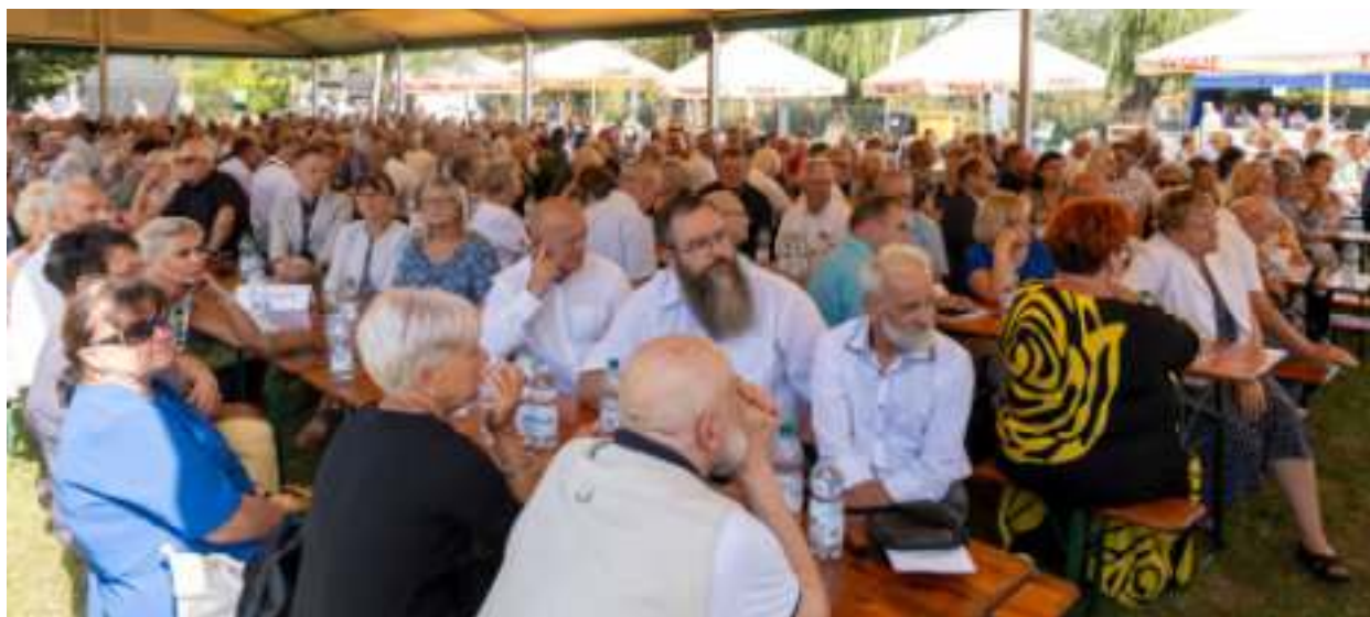
► Impreza przyciągnęła liczne grono działkowców