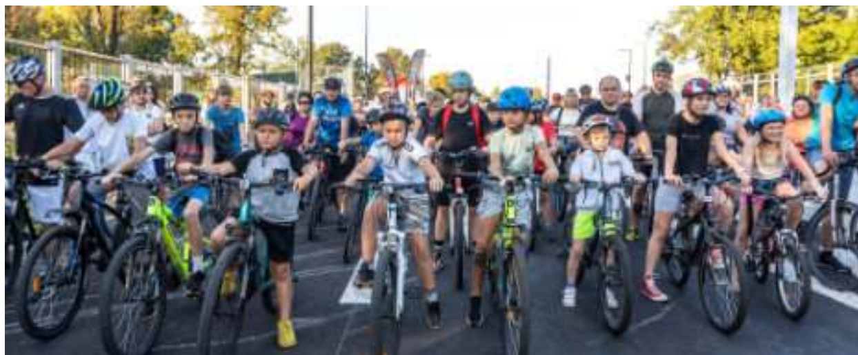
► Jako pierwsi na nowiutki asfalt wyjechali rowerzyści