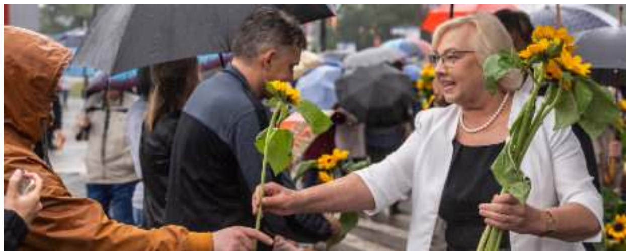
► Prezydent Zabrze Małgorzata Mańka-Szulik wręcza kwiaty mieszkańcom