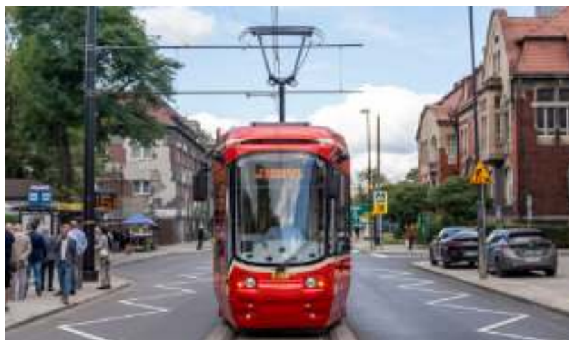
► Modernizacji torowisk towarzyszyła wymiana nawierzchni