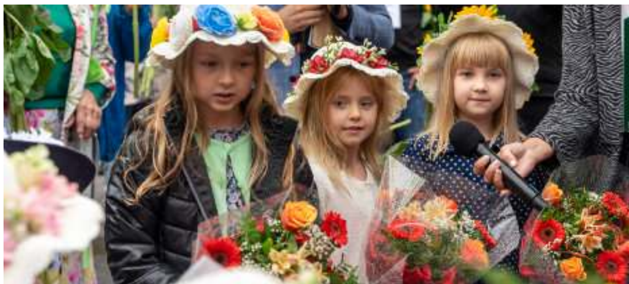
► W urodzinowej paradzie nie mogło zabraknąć przedszkolaków