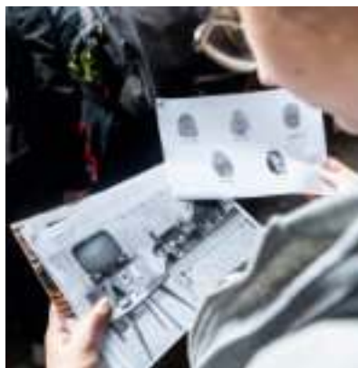
► Fot. UM Zabrze