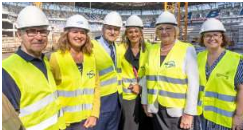
► W uroczystości uczestniczyli m.in. przedstawiciele samorządu, spółki Stadion w Zabrzu oraz legendarni piłkarze Górnika

Przypomnijmy, że wykonawcą inwestycji, której wartość sięga 45 mln zł, jest Mostostal Zabrze GPBP S.A. Zgodnie z umową podpisaną w czerwcu tego roku, spółka ma na realizację zadania dwanaście miesięcy. Przypomnijmy, że w I etapie przebudowy stadionu Mostostal Zabrze odpowiadał za wykonanie robót budowlanych na poziomie „0” oraz instalacyjnych i elektrycznych na poziomach „0” i „-1” garażu podziemnego. Spółka ma rów-