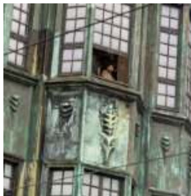
► Fot. UM Zabrze