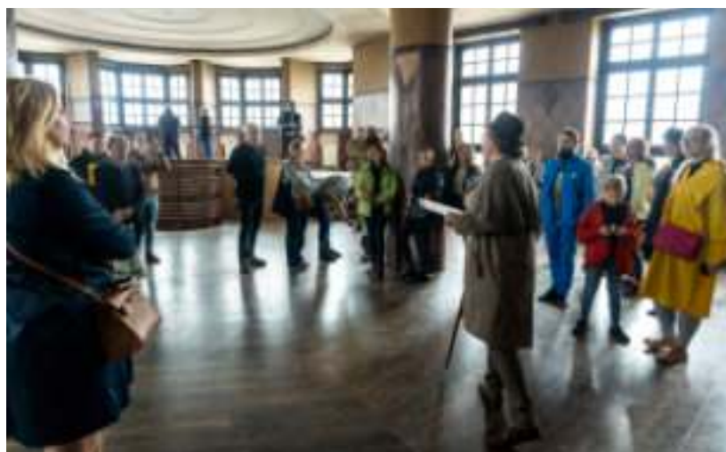
► Klimatyczne wnętrza zapewniły niezwykłą atmosferę rozgrywki

Zadaniem graczy było rozwiązanie sprawy tajemniczej śmierci