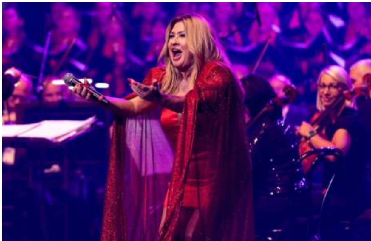
► Gwiazdą wieczoru była Beata Kozidrak