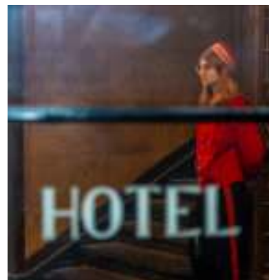
► Fot. UM Zabrze