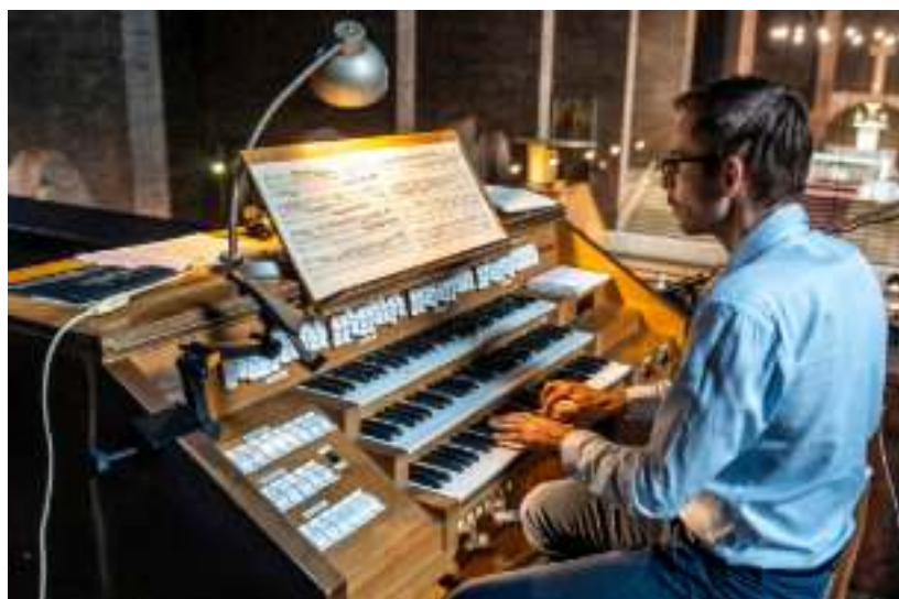
► Każdy z koncertów odbywał się w innym kościele