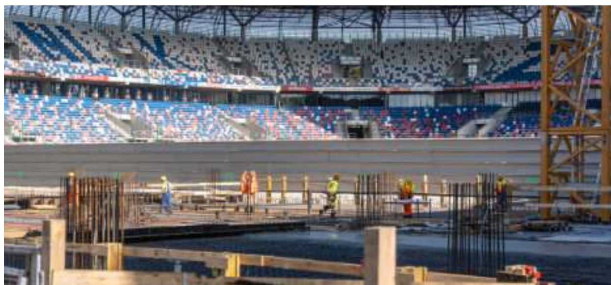
► Wykonawca zwraca uwagę, że prace wyprzedzają już nieco przyjęty harmonogram