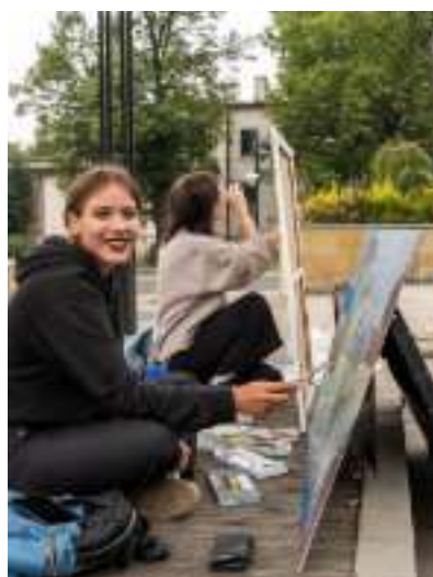
► Fot. UM Zabrze