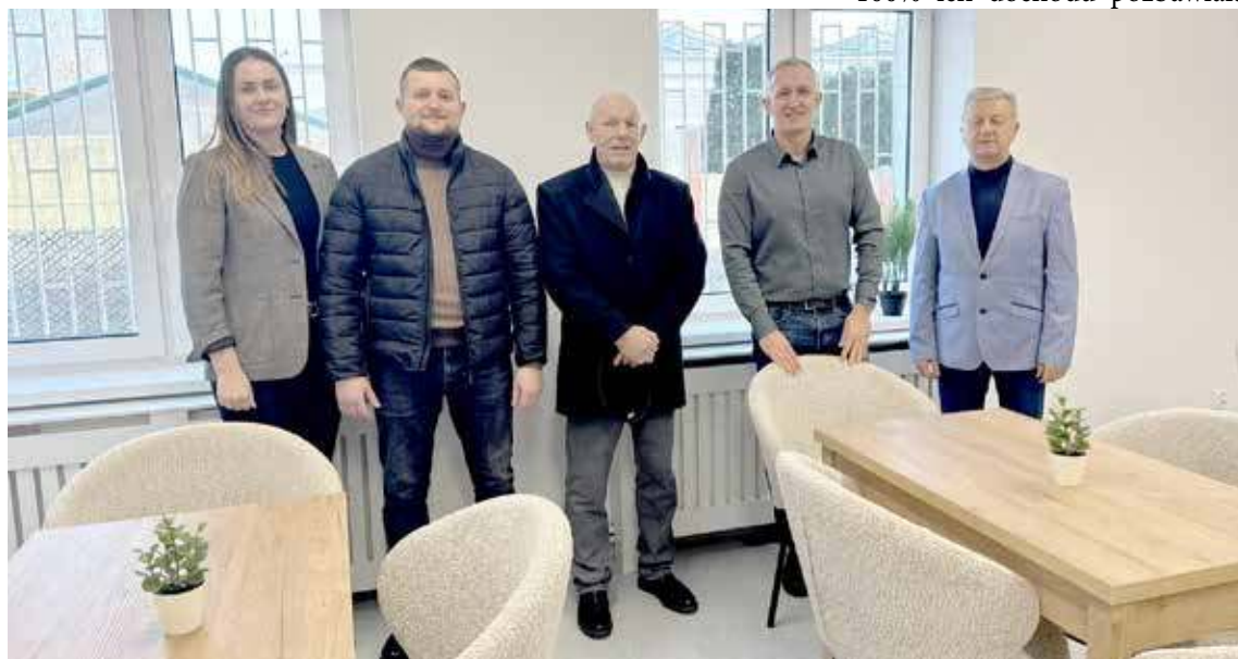
Wizytacja „specjalistów” w Dziennym Domu Pobytu Seniora w styczniu br. Niestety nawet dziś nie wiadomo, kiedy w ośrodku pojawią się pierwsi potrzebujący