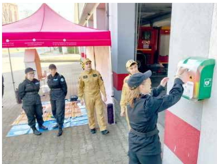
Próba generalna funkcjonalności urządzenia AED

W środę, 11 marca doszło do uruchomienia i oficjalnej prezentacji defibrylatora AED zamontowanego na ścianie nowogardzkiej jednostki PSP przy ul. kard. Stefana Wyszyńskiego. Wszystko zbiegło się w czasie z akcją profilaktyczną dot. profilaktyki wczesnego ostrzegania przed zagrożeniem w miejscu zamieszkania.