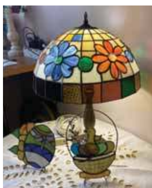
Lampa robiona na zamówienie i ozdoby wielkanocne

Po powrocie przerobił jeden z pokoi w domu na niewielką pracownię. Kupił podstawowe narzędzia i szlifierkę. Od tego czasu