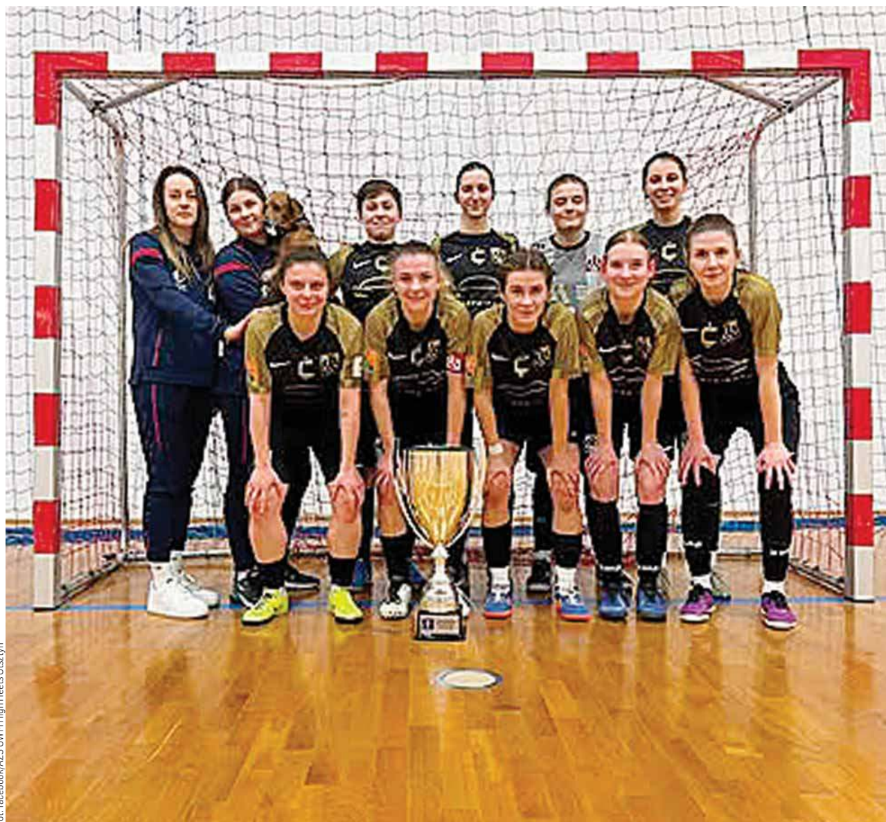
Pierwszoligowy bilans Olsztynianek to 14 zwycięstw (w tym dwa w barażach) oraz dwa remisy

• Chemik Bydgoszcz - AZS UWM High Heels Olsztyn 0:3 (0:1) 0:1 - Golubska (8), 0:2, 0:3 - Cwalińska (28, 33)