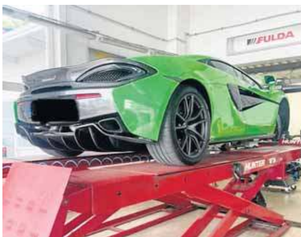
Bosch Car Service MultiCar, Olsztyn, Płoskiego 3

Bosch Car Service MultiCar walczy w naszym plebiscycie o wyjątkowy tytuł Warsztatu Roku.