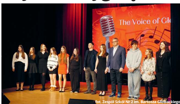
fol. Zespół Szkół Nr 2 im. Bartosza Głowackiego

● POW. KRASNOSTAWSKI 20 stycznia odbyły się „Bitwy” w ramach The Voice of Głowacki IX, podczas których 16 uczestników rywalizowało w duetach i solowych występach, walcząc o miejsce w wielkim finale. Jurorzy mieli twarde orzechy do zgryzienia.