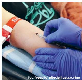
fot. freepik/ zdjęcie ilustracyjne

W pozostałe dni tygodnia (od poniedziałku do piątku)