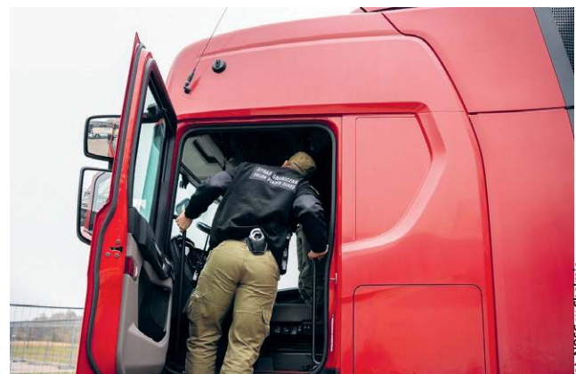
fol. NOSP w Chełmie

Prowadzenie pojazdu mechanicznego w stanie nietrzeźwości jest przestępstwem, za które grozi wysoka grzywna, a nawet kara pozbawienia wolności do lat 3. W przypadku kierowców zawodowych wiąże się to również z bezpowrotną utratą uprawnień do wykonywania zawodu. (apm)