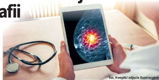
zdjęcie ilustracyjne

♦ Wtorek, 3 lutego, w godz. 8:30-14:30 - Wola Uhruska , ul. Parkowa 5, mammobus przy urzędzie gminy, nr tel.: 723 351 002, 723 351 003