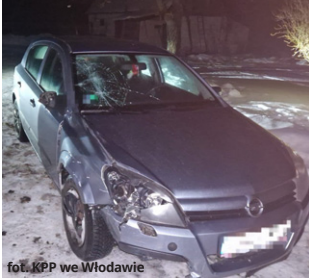
fol. KPP we Włodawie

Tragiczna śmierć 54-letniego rowerzysty na drodze w gminie Hańsk. Mężczyzna został potrącony przez sanochód osobowy w miejscowości Kulczyn-Kolonia. Kierowca nie udzielił mu pomocy i odjechał z miejsca zdarzenia. Policja szybko zatrzymała dwóch pijanych mężczyzn, którzy mogą mieć związek z tym wypadkiem.