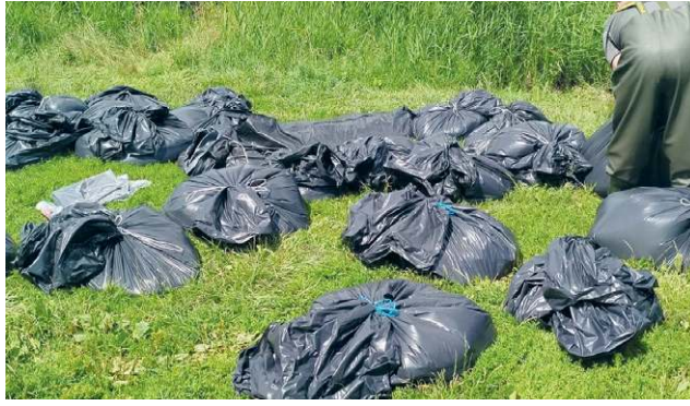
Ze zbiornika Stańków wyłowiono ok. 3,5 tony martwych ryb. Specjaliści szacują jednak, że skala zniszczeń była prawie dwukrotnie większa

skiego oraz mieszkańiec gminy Chełm, w sprawie katastrofy ekologicznej na rzece Uherce i zbiorniku wodnym Stańków, która miała miejsce w lipcu 2025 roku, a której skutki do dziś nie zostały w pełni rozliczone. W wyniku zrzutu silnie zanieczyszczonych ścieków rzeką płynął czarny, cuchnący szlam, prowadząc w krótkim czasie do