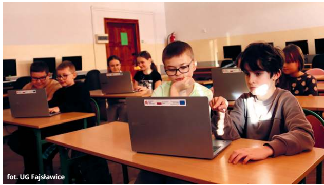
fol. UG Fajslawice

● GM. FAJSŁAWICE Dzięki kolejnemu wsparciu z Krajowego Planu Odbudowy do Szkoły Podstawowej im. bł. Jana Pawła II w Siedliskach Drugich trafi nowoczesne laboratorium sztucznej inteligencji, które ma pomóc uczniom rozwijać kompetencje cyfrowe i przygotować ich do wyzwań współczesnego świata.