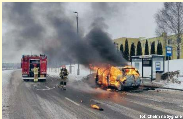
fol. Chełm na Sygnale

● CHEŁM Chwile grozy przeżył kierowca osobowego auta, które w niedzielne przedpołudnie nagle stanęło w ogniu. Mężczyzna zdążył uciec, zanim płomienie objęły cały pojazd. Mimo błyskawicznej akcji strażaków, z samochodu niewiele zostało.