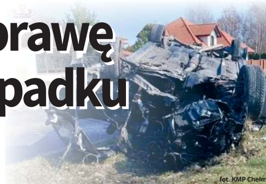
fol. KMP Chełm

Rozpoczął się proces 20-latka oskarżonego o spowodowanie śmiertelnej katastrofy drogowej. Młody kierowca był pod wpływem alkoholu i wioził w samochodzie 9 osób. Zginęło dwóch 18-latków.