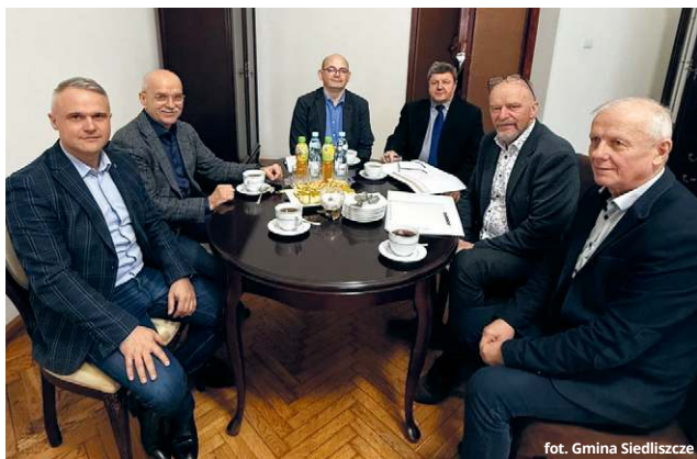
fol. Gmina Siedliszcze

Pod koniec października minionego roku powołano do życia kolejną już w naszym regionie spółdzielnię energetyczną - „Oksza-Godziemba”. W proces tworzenia nowej struktury włączyli się władarze dwóch gmin - Siedliszcza i Rejowca oraz osoby odpowiedzialne za kilka gminnych jednostek. Kolejne spotkanie dotyczące działania tej struktury miało natomiast miejsce w połowie stycznia. Dlaczego ta inicjatywa jest tak ważna?