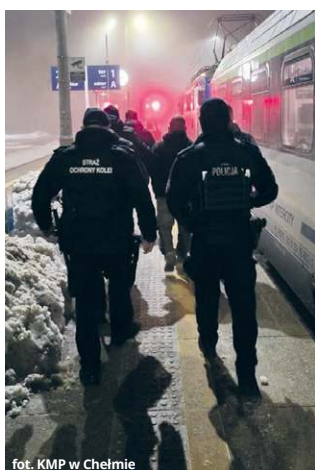
fol. KMP w Chełmie

Błyskawiczne zatrzymanie Kryminalni nie zwlekali