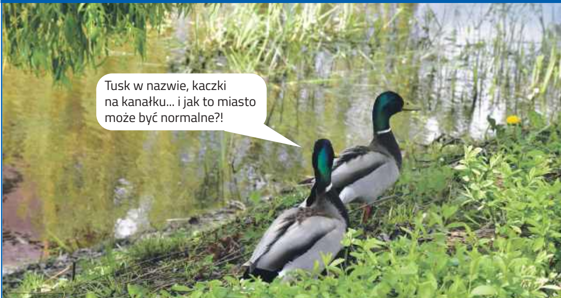
FOTO NA WESOŁO

Tusk w nazwie, kaczki na kanałku... i jak to miasto może być normalne?!