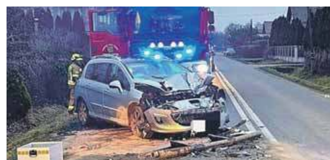
Wjechała w ciężarówkę