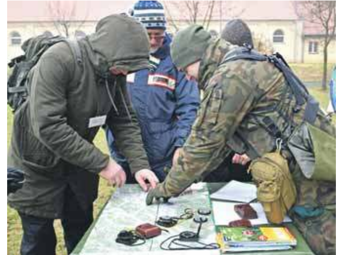
W trudnej sytuacji orientacja w terenie na pewno się przyda

Potem wybrać termin, miejsce i rodzaj szkolenia (bezpieczeństwo, pierwsza pomoc, przetrwanie, cyberhygiena), kliknąć „Zapisz się” i potwierdzić.