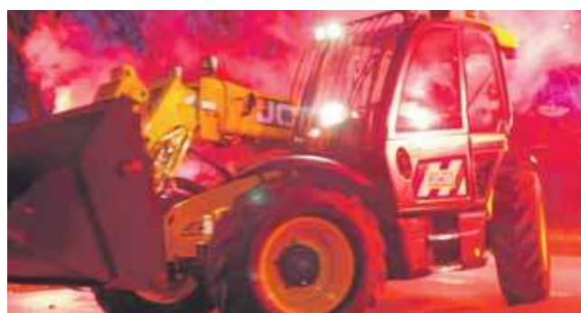
Zbrostawicka OSP wzbogaciła się o ładowarkę teleskopową

Ładowarka niebawem zostanie wprowadzona do podziału bojowego jednostki i zwiększy jej możliwości ratownicze. Zakup był możliwy dzięki wsparciu gminy Zbrostawice i pozyskaniu środków z obrony cywilnej. (ESP)