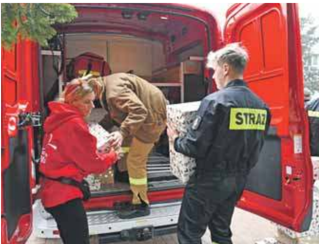
Za chwilę paczki ruszą do potrzebujących rodzin

W drugi weekend grudnia odbył się finał akcji Szlachetna Paczka. 13 grudnia świąteczne prezenty zaczęły trafiać do potrzebujących rodzin. Baza tarnogórskiej ekipy Szlachetnej Paczki znajdowała się w Szkole Podstawowej nr 8 na osiedlu Przyjaźń w Tarnowskich Górach.