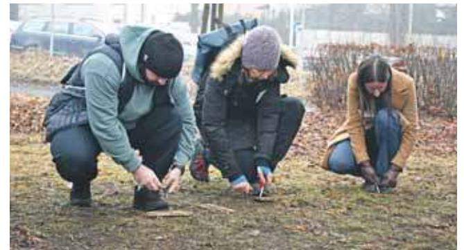
Jak rozpałić ogień za pomocą krzesiwa?