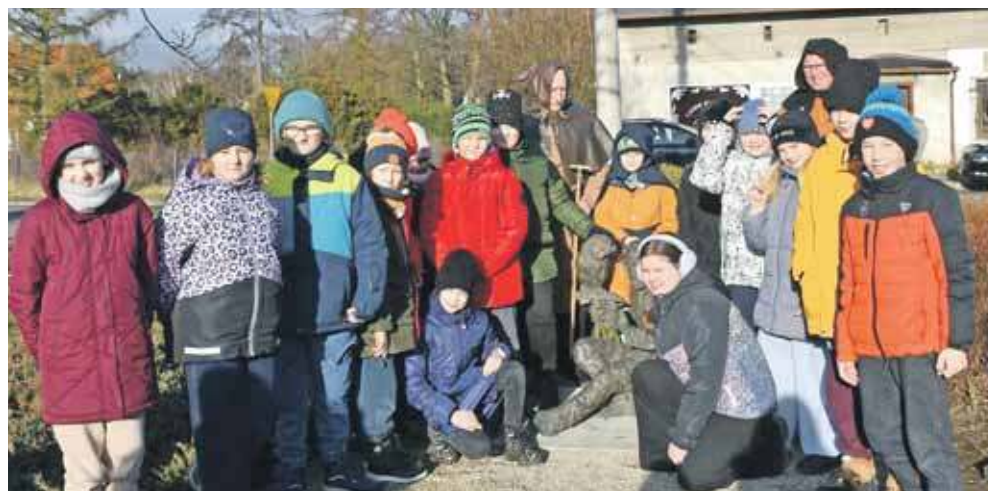
Rzeźba stoi na skwerze przy skrzyżowaniu ul. Słowackiego i Grodzkiej w Sowicach