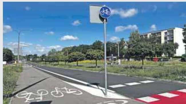
Aleja Jana Pawła II w Tarnobrzegskich Górach