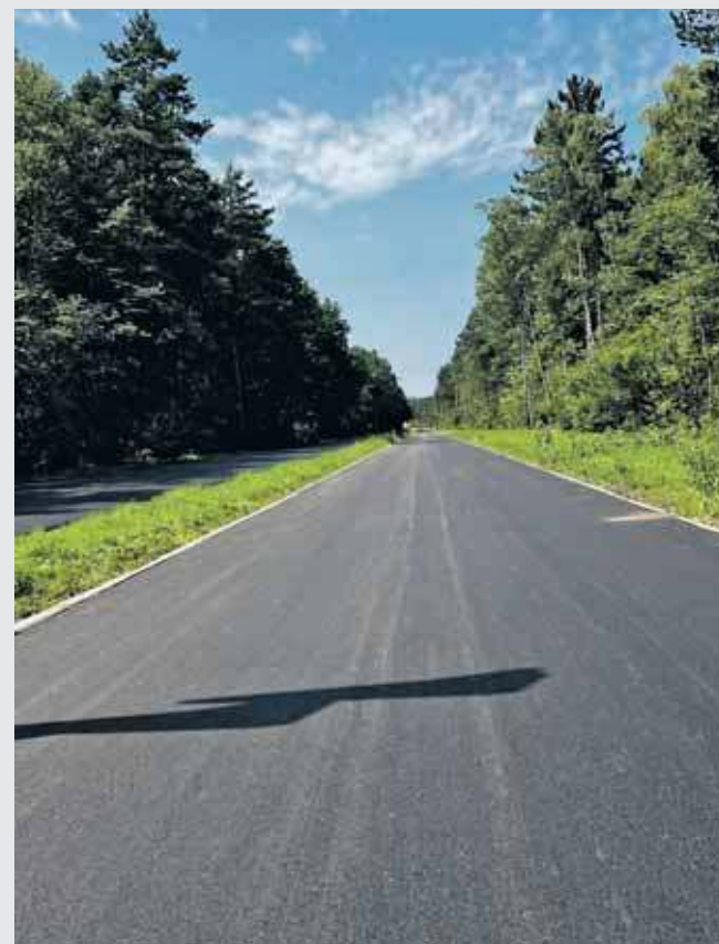
Ulica Grzybowa w Tarnobrzegskich Górach