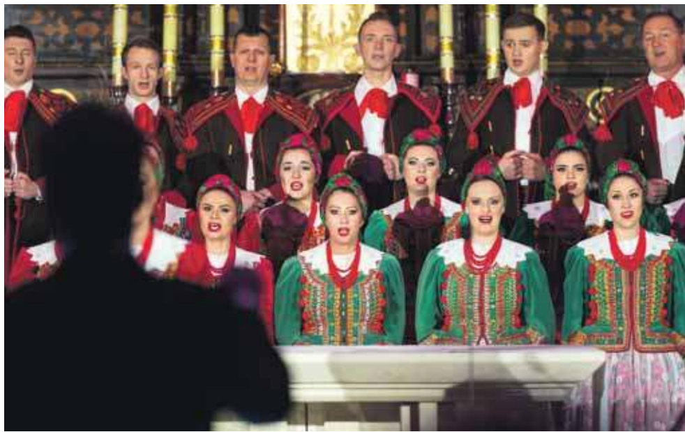
Na koncert zespołu Śląsk można się wybrać 5 stycznia