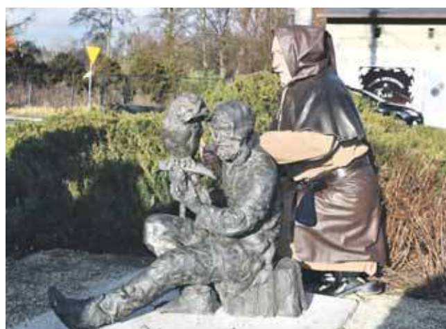
Gwarek ma sowę, co jest nawiązaniem do nazwy dzielnicy

W uroczystości odsłonięcia gwarka uczestniczyli m.in. dzieci z pobliskiej szkoły oraz przedstawiciele władz miasta, powiatu, rady dzielnicy i Stowarzyszenia Miłośników Ziemi Tarnogórskiej. (ESP)