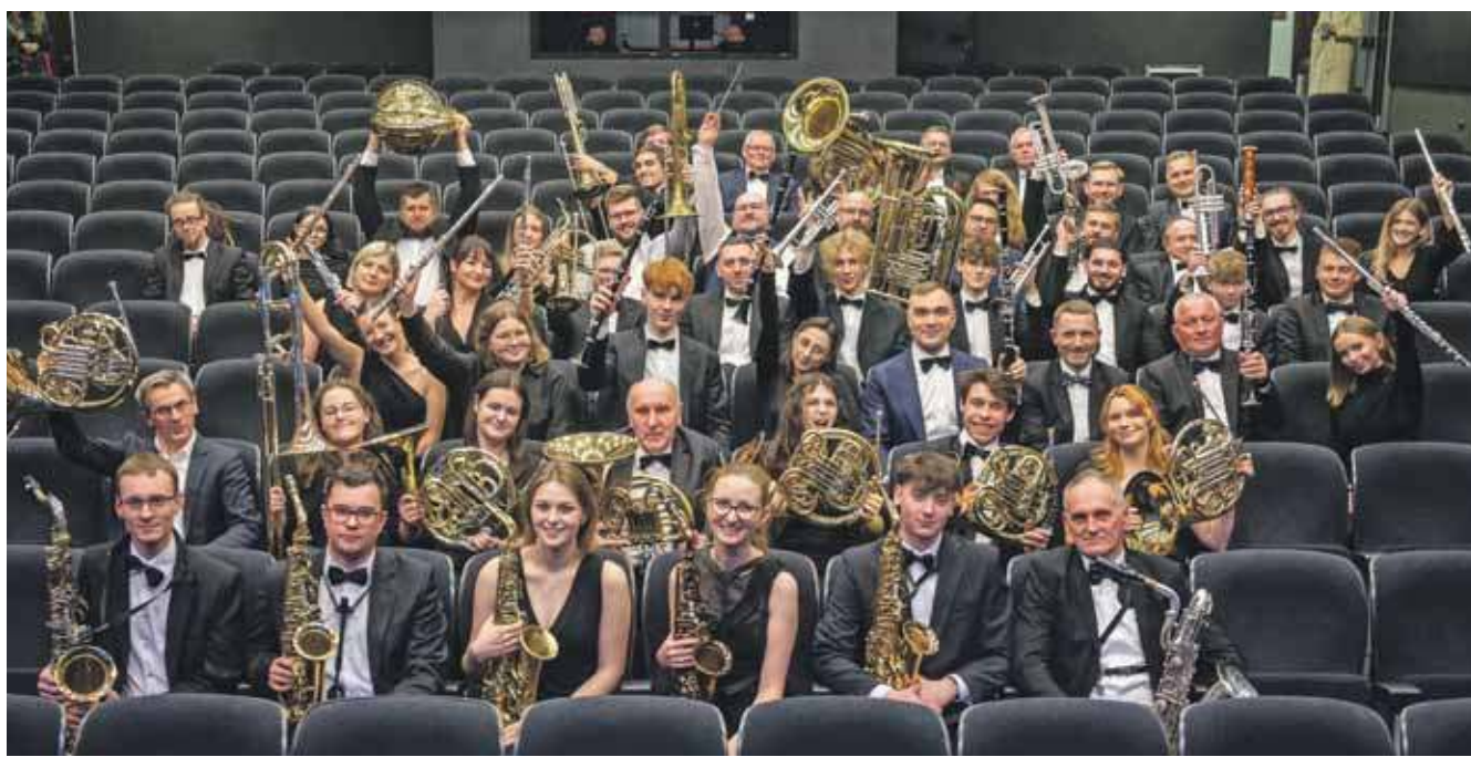
Parafialna Kamiliańska Orkiestra Dęta, muzyczna wizytówka Tarnowskich Gór

Orkiestra wykonuje szeroki repertuar obejmujący muzykę sakralną, klasyczną, filmową, rockową, folkową,