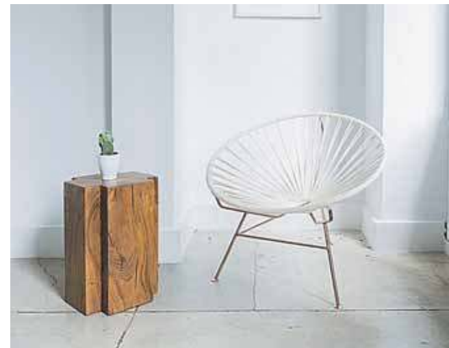
Tym razem będzie o krzesła w historii i sztuce