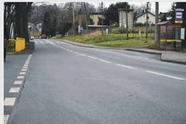
Ulica Wolności w Zbrosławicach