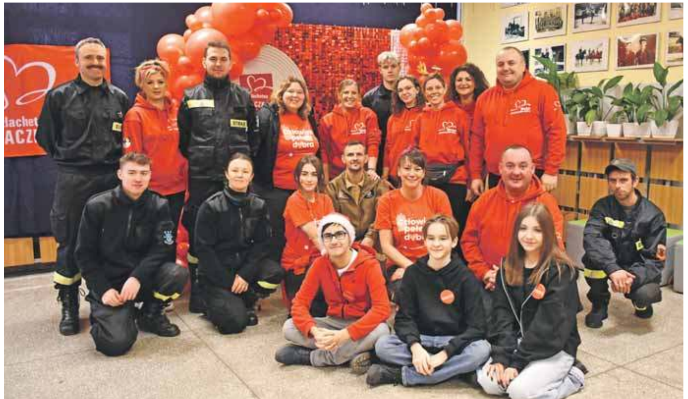
Ekipa Szlachetnej Paczki zaraża pozytywną energią

Do tego dochodzą żywność czy artykuły chemiczne – to z kolei duże obciążenie dla rodzin. Mogą w ten sposób