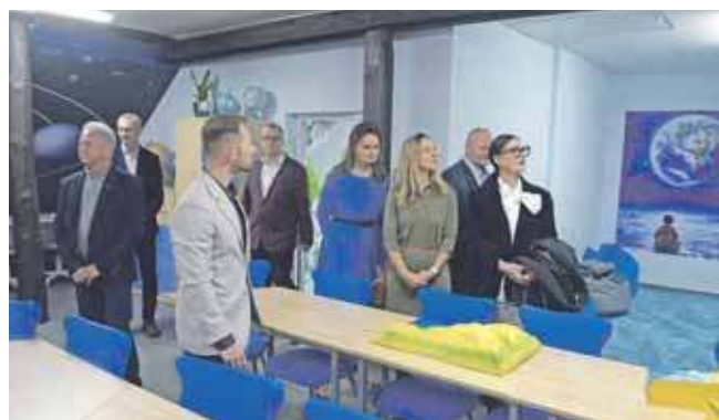
W tym roku oddano Zieloną Pracownię Podniebne Laboratorium w Szkole Podstawowej im. Królowej Jadwigi w Nowym Chechle