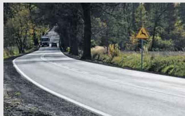
Ulica Gliwicka w Boniowicach