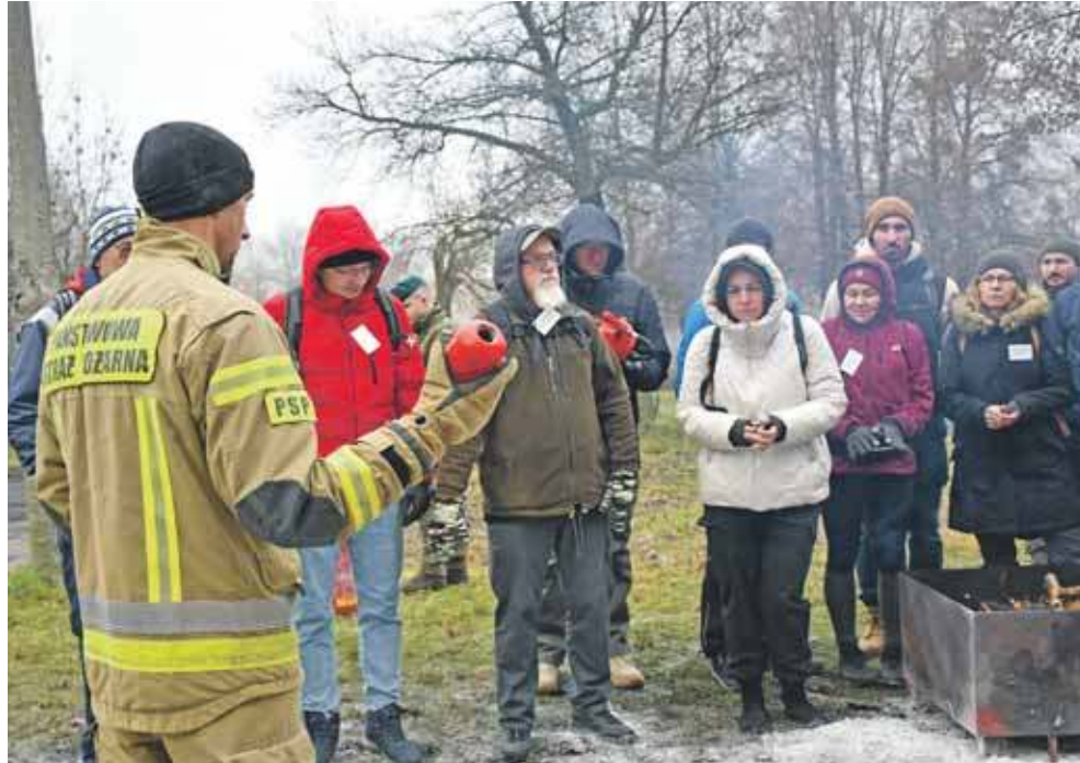
W wydarzeniu uczestniczą również strażacy

Potem uczestnicy szkolenia pojechali na teren wojskowy w Lasowicach, gdzie otrzymali certyfikaty, nie