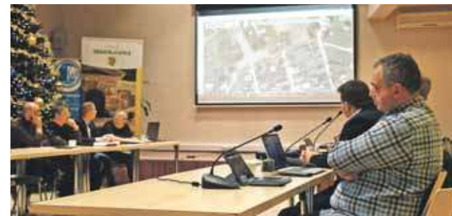
W czwartek, 18 grudnia, odbyło się posiedzenie komisji budżetu, gospodarki i rozwoju rady gminy w Zbrosławicach. Tematem był projekt budowy ul. Spokojnej

Mieszkańcy poczuli się urażeni tym, że niejako zrzuca się na nich odpowiedzialność za wyrzucenie w błoto kilkudziesięciu tysięcy złotych na projekt. – Nikt z nami nie rozmawiał, nikt nie zapytał,