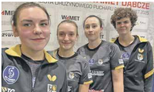
Zawodniczki MKS Skarbek Tarnowskie Góry

W pierwszej lidze kobiet zawodniczki MKS Skarbek Tarnowskie Góry rozegrały wyjazdowe spotkanie z Wamet KS Dąbcze. Był to ostatni mecz ligowy w tym roku, a jego stawka oraz przebieg dostarczyły kibicom ogromnych emocji. Obie drużyny wystąpiły w najmocniejszych składach, co przełożyło się na zaciętą rywalizację.