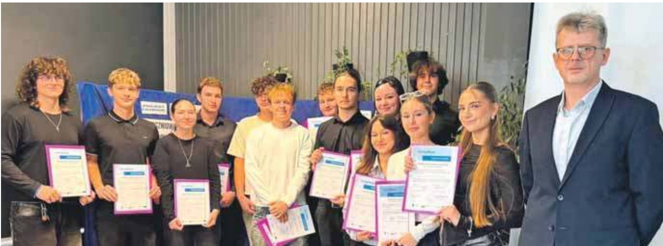
Wyjazdy umożliwiły młodzieży zdobywanie doświadczenia w realnym środowisku pracy, zgodnie z europejskimi standardami branżowymi