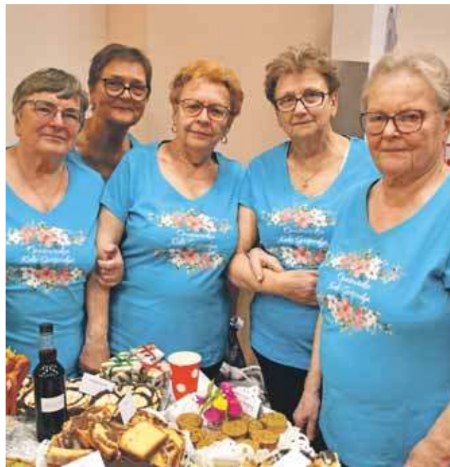
Podczas konkursu kulinarnego w Tapkowicach, listopad 2025

Panie zapraszają wszystkich zainteresowanych na spotkanie do filii TCK w Opatowicach 16 stycznia o godz. 17. (EKA)