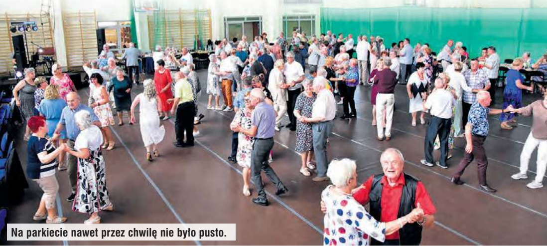
Na parkiecie nawet przez chwilę nie było pusto.

Osoby 60+ potwierdzają, że wiek to zdecydowanie tylko liczba i niejednym młody mógłby im pozazdrościć werwy oraz umiejętności tanecznych. Kolejną okazją do zabawy była Taneczna Biesiada Seniora w Cekcynie. Parkiet od pierwszych taktów muzyki dosłownie płonął.