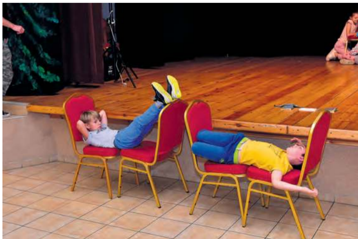
Przebieg zajęć „Lata w teatrze” można zobaczyć też w fotorelacji na naszym portalu tygodnik.pl.