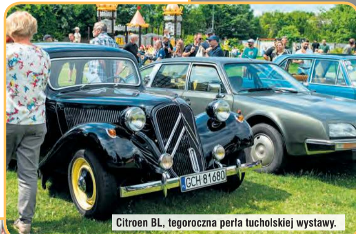
Citroën BL, tegoroczna perła tucholskiej wystawy.