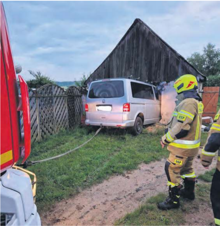
Podróżnych, którzy jechali tym samochodem, służby nie zastały na miejscu zdarzenia.