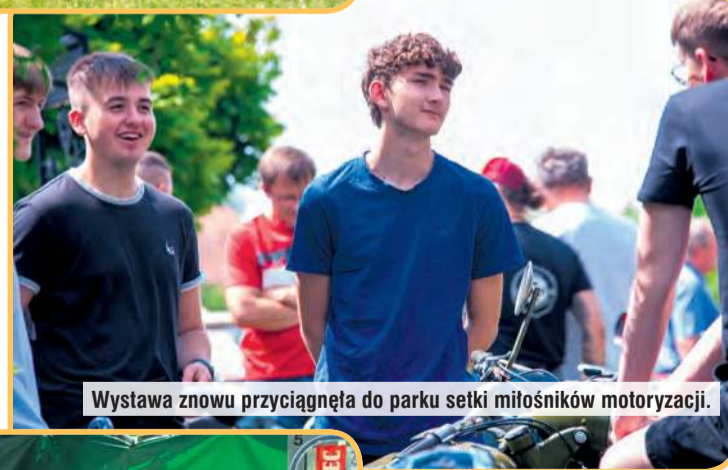
Wystawa znowu przyciągnęła do parku setki miłośników motoryzacji.

botę była bardzo wymagająca. Pamiętajmy też, że w trasę ruszyły kilkudziesięcioletnie pojazdy. Łatwo na pewno nie było, co potwierdzali sami kierowcy, ale idea wyścigu bardzo się spodobała i wydarzenie zebrało pozytywne opinie. Ciekawe same w sobie były zasady. Niekoniecznie wygrywał bowiem ten, kto pojawił się na mecie jako pierwszy. Rajdowcy retro musieli trafić jak najbliżej czasu określonego przez or-