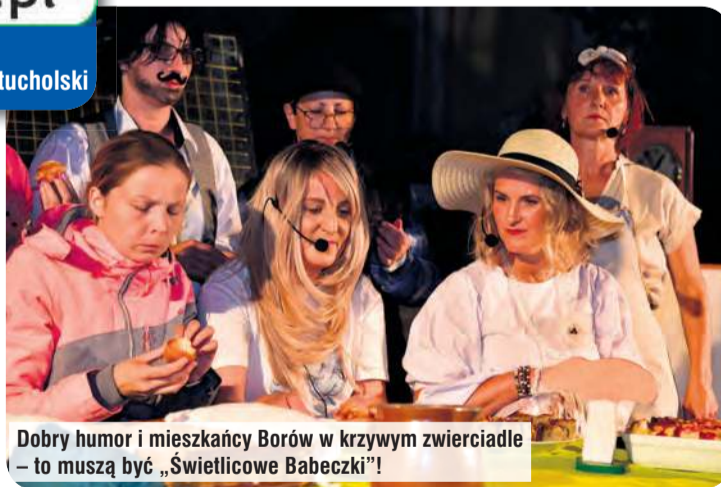
Dobry humor i mieszkańcy Borów w krzywym zwierciadle – to muszą być „Świetlicowe Babeczki”!