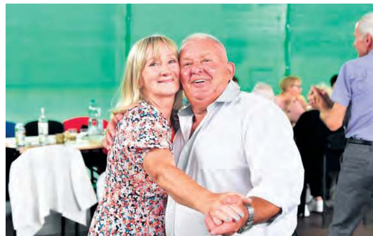
Nie brakowało romantycznych gestów przy utworach o miłości.