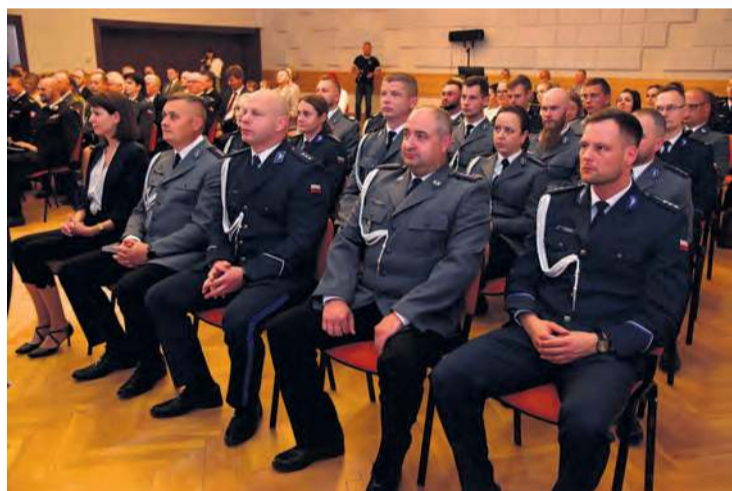
W tym roku mianowanie na wyższy stopień służbowy otrzymało 27 policjantów.