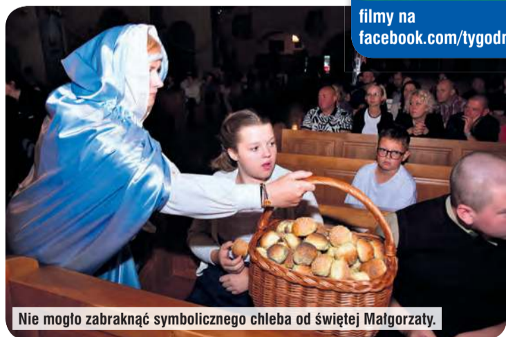
Nie mogło zabraknąć symbolicznego chleba od świętej Małgorzaty.