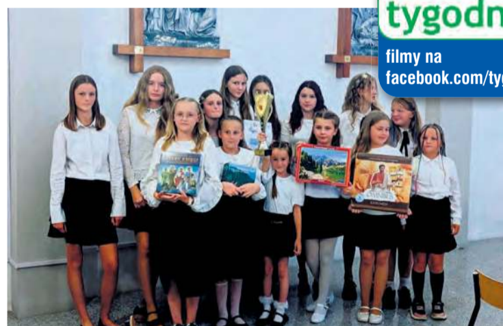
W kategorii zespołów zwyciężyła Schola Jakubowe Nutki z parafii pw. św. Jakuba Apostoła w Tucholi.