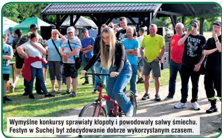
Wymyślne konkursy sprawiały kłopoty i powodowały salwy śmiechu. Festyn w Suchej był zdecydowanie dobrze wykorzystanym czasem.

Nie zabrakło „kupałowych” akcentów – wianków i ogniska z tańcem rusalek. Z kolei od 20:00 do wczesnych godzin porannych zabawę taneczną poprowadził DJ Zenas.