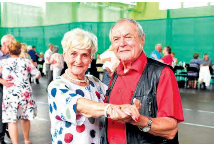
Wiek zdecydowanie jest tylko liczbą, co potwierdzili seniorzy w miniony czwartek (10 lipca).

go swoje taneczne wydarzenia nazywają biesiadami.