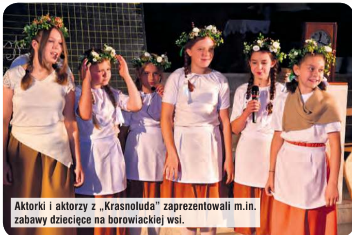
Aktorki i aktorzy z „Krasnoluda” zaprezentowali m.in. zabawę dziecięcą na borowiackiej wsi.