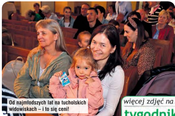
Od najmłodszych lat na tucholskich widowiskach – i to się ceni!