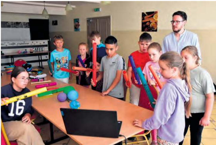
Finał zaplanowano na 17 lipca (czwartek) o godzinie 17:00 w B-CKiP Gminy Lubiewo.