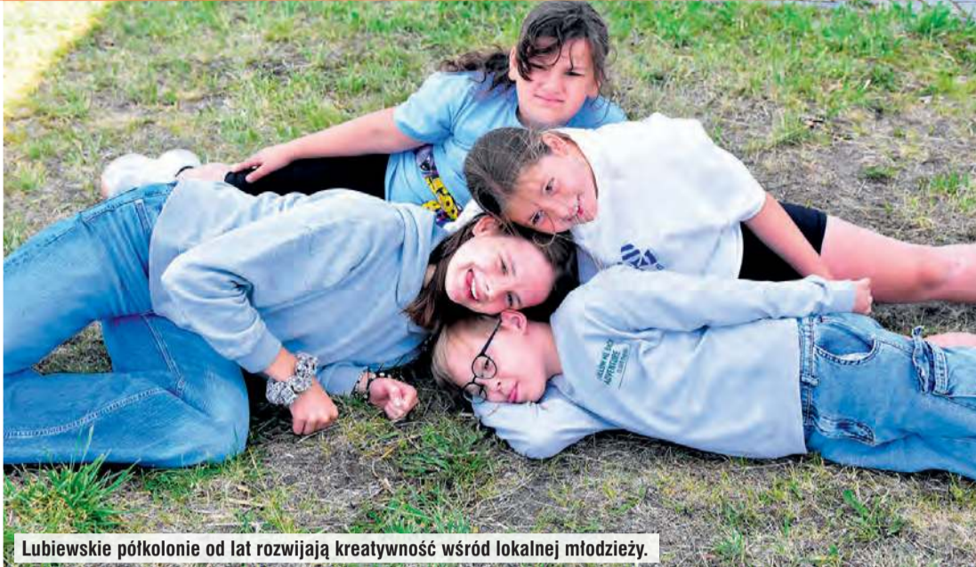
Lubiewskie półkolonie od lat rozwijają kreatywność wśród lokalnej młodzieży.

– W codziennej pracy świadomie sięgamy po tę metodę. Pomysły młodych są tu traktowane poważnie i zawsze próbujemy je wkomponować w efekt końcowy naszych działań. Z naszej perspektywy to działa, w Lubiewie mamy przecież już szóste „Lato w teatrze”. Naszą