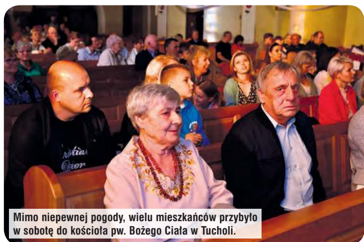
Mimo niepewnej pogody, wielu mieszkańców przybyło w sobotę do kościoła pw. Bożego Ciała w Tucholi.