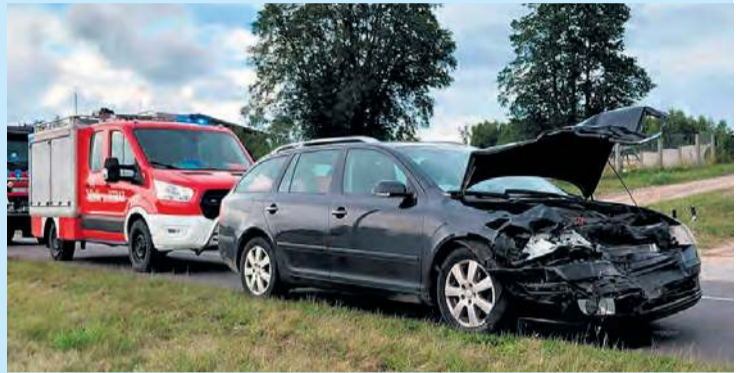
W poniedziałek (14 lipca) na trasie Lińsk – Śliwice doszło do zderzenia dwóch skód octavii. Więcej informacji w kronikach.

gowej kierujący renault w trakcie cofania uderzył w zaparkowany pojazd tej samej marki. 27-letni mieszkaniec Brzezin przyjął mandat. Szkody poniósł 56-latek z woj. wielkopolskiego.