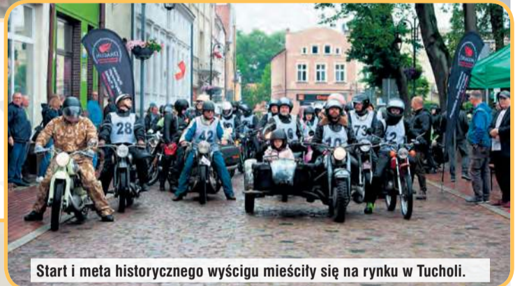
Start i meta historycznego wyścigu mieściły się na rynku w Tucholi.

Niedziela (13 lipca) to już crème de la crème czyli XXIII Wystawa Pojazdów Zabytko-