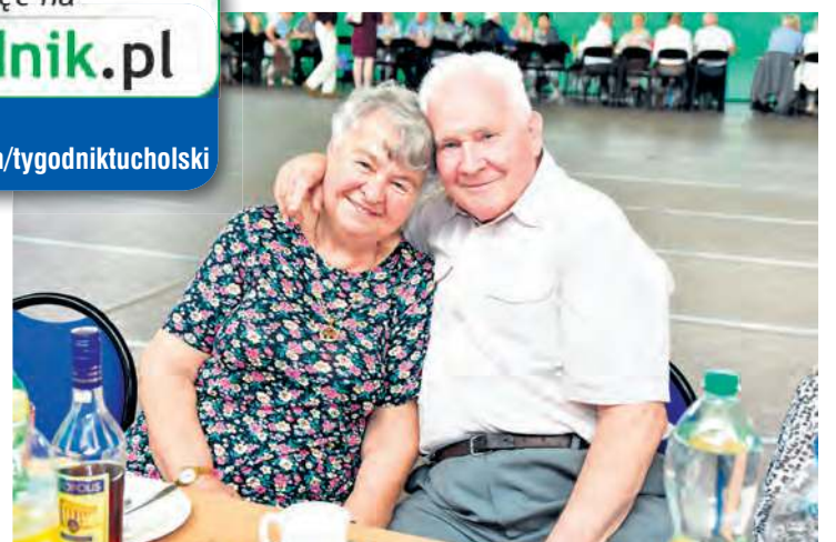
Nie zabrakło pamiątkowych fotografii.

więcej zdjęć na tygodnik.pl filmy na facebook.com/tygodniktucholski