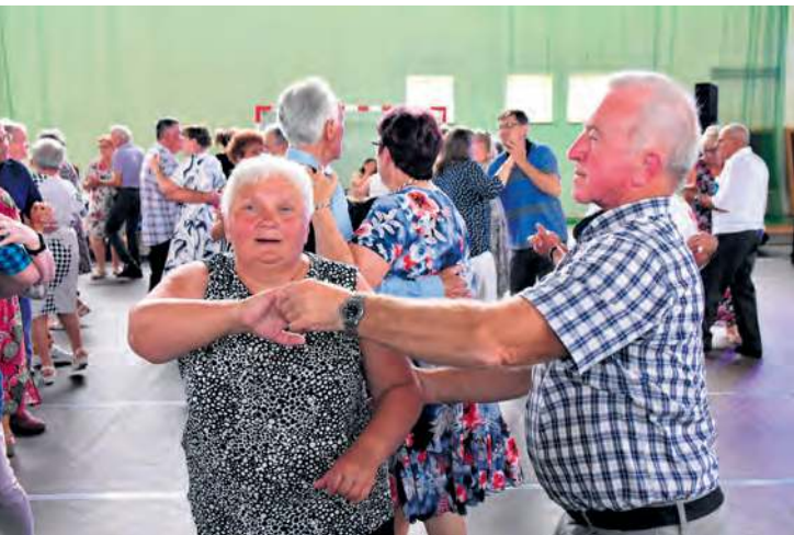
W imprezie wzięło udział około 160 osób.