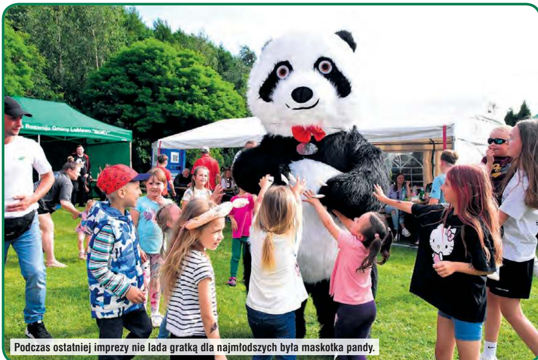
Podczas ostatniej imprezy nie lada gratką dla najmłodszych była maskotka pandy.