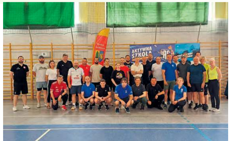
LASP to przedsięwzięcie finansowane przez państwo. W każdym województwie powstała jedna akademia. Jej centrum w woj. kujawsko-pomorskim to Łochowo. Tu uczestnicy projektu w bysławskiej sali gimnastycznej.