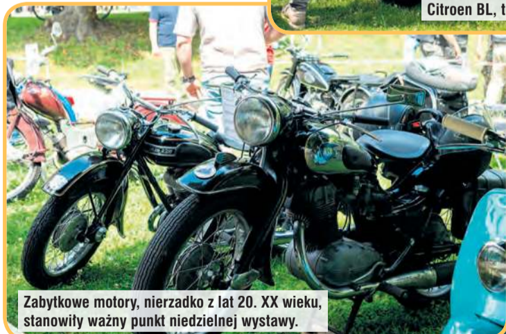
Zabytkowe motocykle, nierzadko z lat 20. XX wieku, stanowiły ważny punkt niedzielnej wystawy.