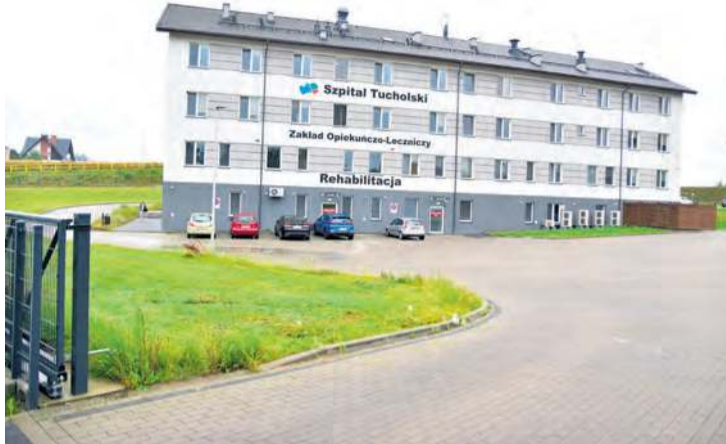
Wjazd na teren ZOL-u został wykonany od strony ul. Wiejskiej i tak też pozostanie.

Spółka, której prezesuje Jarosław Katulski , złożyła 2 czerwca w tucholskim ratuszu wniosek o wydanie warunków zabudowy. Parametry zabudowy zostały w nim określone między 600 a 850 m 2 , wysokość zabudowy do 11 metrów. Jak słyszymy, sam kierunek rozbudowy został