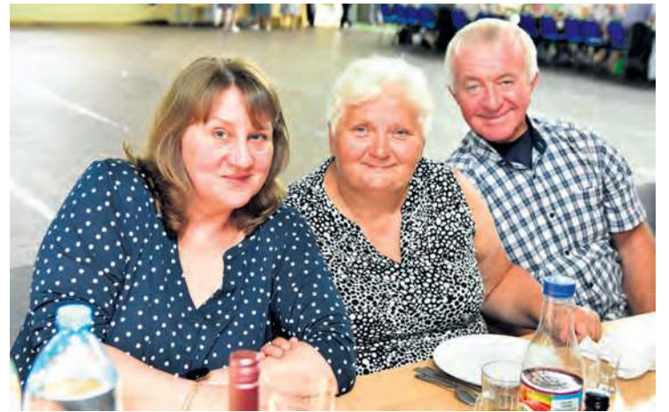
Podczas takich biesiad dla uczestników bardzo ważna jest integracja i wspólne spędzanie czasu.