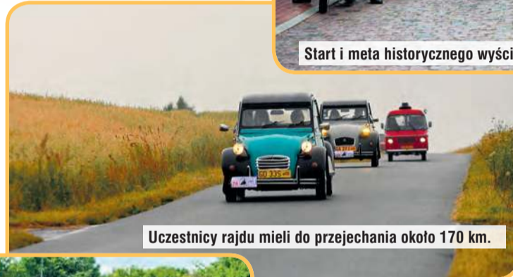
Uczestnicy rajdu mieli do przejechania około 170 km.