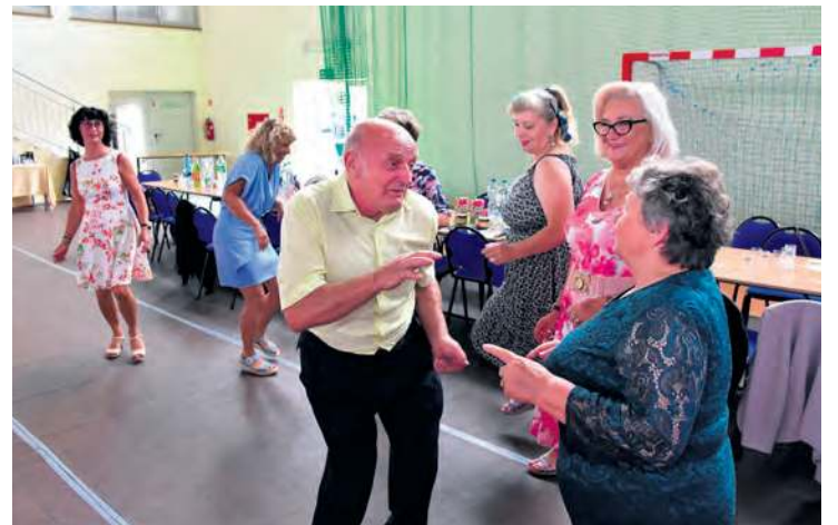
Spędzanie czasu w samotności lub przed telewizorem? Oni wybrali wymianią zabawę!