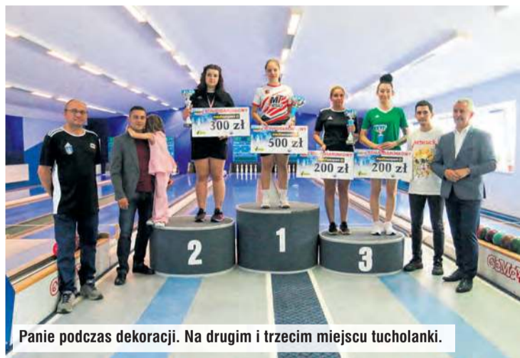
Panie podczas dekoracji. Na drugim i trzecim miejscu tucholanki.