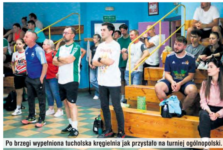
Po brzegi wypełniona tucholska kręgielnia jak przystało na turniej ogólnopolski.

sto rzutów na dwóch torach, po 25 do pełnych i tyle samo do zbieranych na każdym z nich. Na marginesie: stanowiło to duże wyzwanie dla sportowców, którzy specjalizują się wyłącznie w kulaniu do pełnych dziewiątek. Z kolei finały były niezwykle emocjonujące, ponieważ zastosowano system podobny do sprintów – każdy, rywalizując w parze, oddawał po 10 rzutów do pełnych. W przypadku remisu na torach jak zwykle miały miejsce tzw.