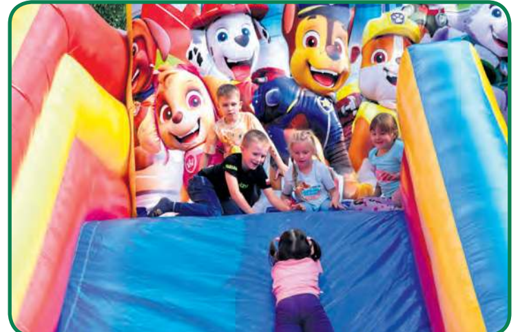
Podczas nocy Kupały świetna pogoda sprzyjała zabawom pod gołym niebem.

– Nasze zabawy i imprezy wiejskie przeszły prawdziwą metamorfozę. Można śmiało powiedzieć, że zmieniły się o 180 stopni. Cieszą się ogromnym zainteresowaniem. Każdorazowo po wystawieniu plakatu z zapowiedzią wydarzenia, lista uczestników zapełnia się dosłownie w ciągu kilku godzin. Doskonale to widać na naszym profilu na Facebooku, gdzie publikujemy relacje i zdjęcia z ostatnich zabaw. Pokazują one, jak bardzo nasze wydarzenia ożywiły życie społeczne w sołectwie. Organizacja odbywa się we współpracy z radą sołeczną, ale ogromne znaczenie ma też zaangażowanie mieszkańców. Wspólnie dba-