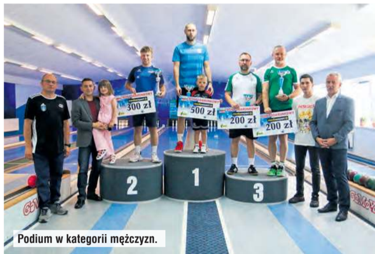
Podium w kategorii mężczyzn.

żej grupy sportowców, solidną organizacją i aktywną, szeroką widownią udowodnił, że duch w narodzie nie ginie. Kręglarze z całej Polski byli jak jedna rodzina, co widzieliśmy nie tylko na sześciu torach tucholskiego obiektu. Do rywalizacji zgłosiło się mnóstwo sportowców z całego kraju, którzy nie byli tu po raz pierwszy. Dlatego przyjazna atmosfera i wzajemny doping były dostrzegalne każdego dnia zawodów.