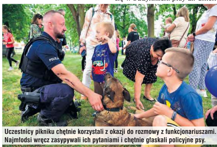
Uczestnicy pikniku chętnie korzystali z okazji do rozmowy z funkcjonariuszami. Najmłodszy wręcz zasypywał ich pytaniami i chętnie głaskał policyjne psy.

– Święto Policji jest dniem szczególnym dla każdego policjanta. To czas awansów, wyróżnień, ale też podziękowań dla osób, które każdego dnia poświęcają niejednokrotnie swoje życie i zdrowie po to, żebyśmy mogli żyć bezpiecznie. Dziękuję policjantkom i policjantom, pracowniczkom i pracownikom policji, bo to dzięki wam każdy, kto przyjeżdża do Tucholi, w Bory Tucholskie, kto mieszka w tym regionie, może czuć się bezpiecznie. Każdy z osobna i wszyscy razem jesteście nam