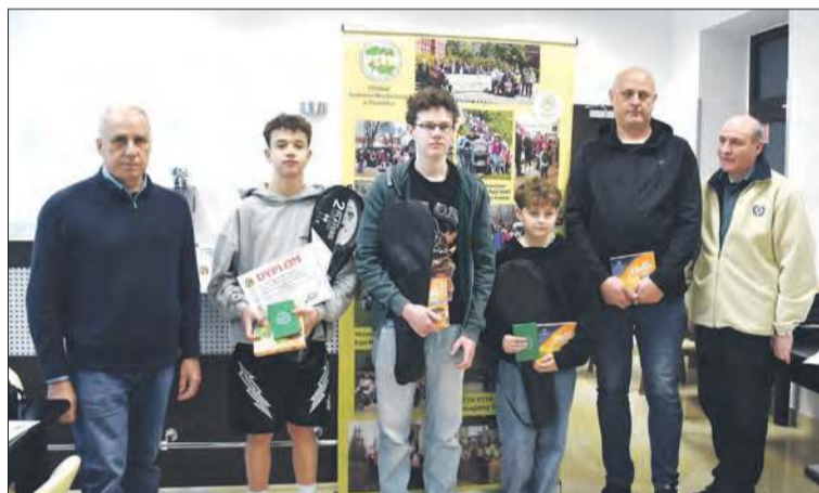
IV miejsce – ZSP Szybowice – drużyna III (szkoły podstawowe)