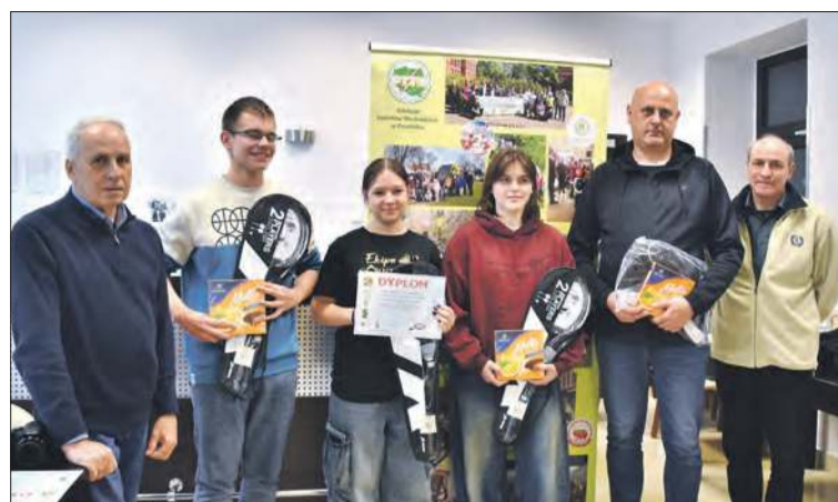
I miejsce – Tuptusie Starsze (szkoły średnie)