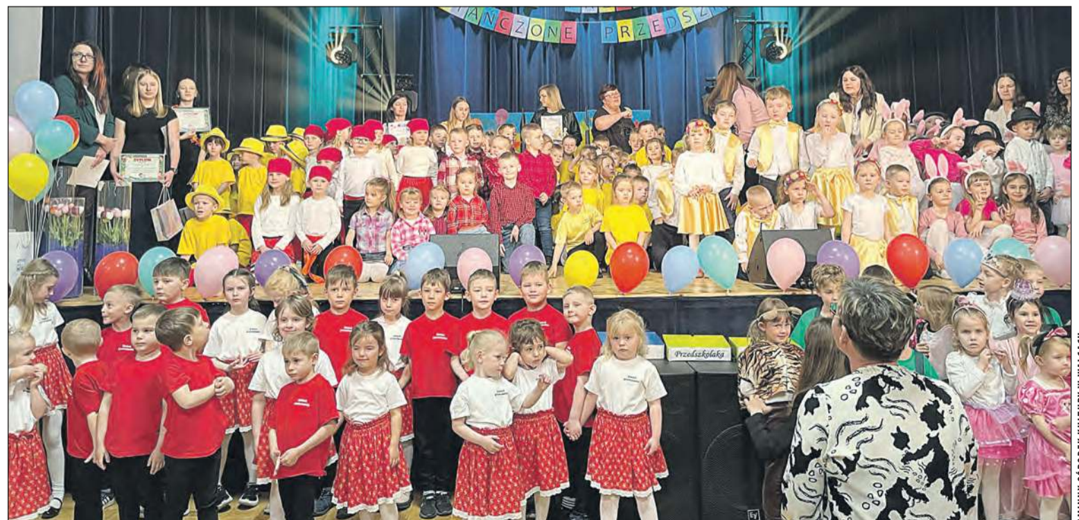
GMINNY OŚRODEK KULTURY W WALCACH

9 kwietnia scena Gminnego Ośrodka Kultury w Walcach rozbrzmiewała muzyką, śmiechem i dziecięcą energią. Dzieci zaprezentowały piękne tańce w ramach Festiwalu Przedszkolaka pn. „Roztańczone Przedszkole”.