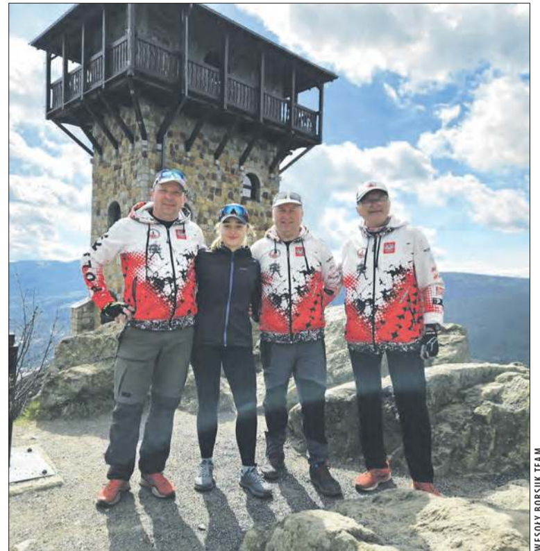
WESOLY BORSUK TEAM

Członkowie Stowarzyszenia Wesoły Borsuk Team z Prudnika przemierzają podczas jeden wyprawy liczący blisko 450 km Główny Szlak Sudecki ze Świeradowa-Zdroju do Prudnika. Pokonali już połowę trasy.