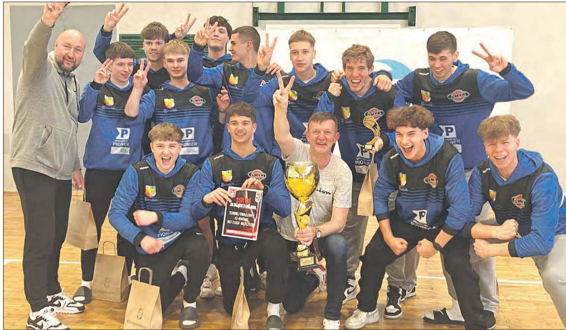
Ekipa Smyka zameldowała się w szeregach drugiej ligi

Turniej finałowy w dalekim Sochaczewie Smyk rozpoczął od pojedynku z rezerwami Żaka Koszalin i prowadzenia 28:17 w 12. minucie. Rywal zdołał jednak „wrócić do gry” i wyszarpać wiktoryę w zaciętej końcówce (73:70). Nazajutrz prudniczanie mierzyli się z gospodarzami zawodów. Do przerwy wygrywali z faworyzowanymi Rysiami 29:26, a w połowie czwartej kwarty wynik oscylował wokół remisu. Ostatecznie górą okazał się Sochaczew - 73:61. Smyk zachował szansę na awans dzięki zwycięstwu Siarki Tarnobrzeg nad Żakiem II. Rezultat 78:67 sprawił, że w niedzielę ekipa z grodu Woka musiała ograć tarnobrzezań różnicą co najmniej ośmiu punktów. Smyk wszedł w spotkanie znakomicie, odskakując momentalnie na 10:3. Później sześciokrotnie notowano