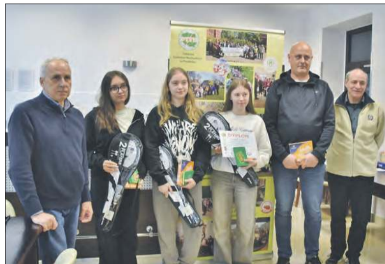
I miejsce – ZSP Szybowice – drużyna II (szkoły podstawowe)