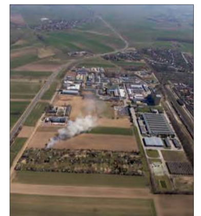
...i w roku 2018

Już teraz w prudnickiej strefie działają nowoczesne zakłady, jak producent oświetlenia Furnika czy firma Moretto, specjalizująca się w automatyce przemysłowej. Od marca ubiegłego roku trwa budowa nowej fabryki firmy Wood of