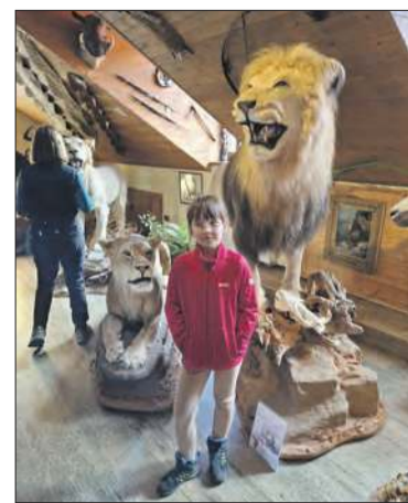
KG ŚWISTAK (2)

Skaly – poszukując wśród wzgórz i lasów - czeskich umocnień z lat 30. XX wieku, których w okolicy jest dość sporo. Po kilku godzinach marszu ŚWISTAKI dotarły pod Moravsky Kopec, u podnóża którego znajduje się ciekawa wieża widokowa „Na Skalce”, z której rozpościerała się wspaniała panorama na Hruba i Nizky Jesenik. Nie był to jeszcze koniec atrakcji, ponieważ głównym punktem kończącym całodzienną 16-kilometrową wędrowkę, było zwiedzenie Muzeum Afrykańskiego (Africke muzeum Safari) w miejscowości Holčovice, gdzie po-