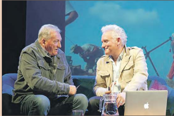
GMINNY OŚRODEK KULTURY W LUBRZY

9 kwietnia Gminny Ośrodek Kultury i Biblioteka w Lubrzy zaprosiły na spotkanie z Jarosławem Kretem, znanym prezydentem pogody, dziennikarzem telewizyjnym, fotoreporterem i podróżnikiem.