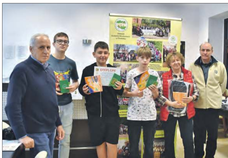
III miejsce – NSP Dytmarów (szkoły podstawowe)