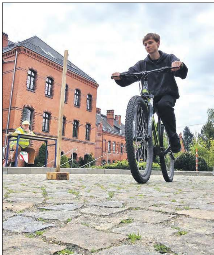
Na rowerowym torze przeszkód

Impreza została dofinansowana ze środków samorządu Województwa Opolskiego.