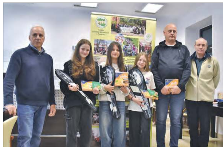
II miejsce – ZSP Szybowice – drużyna I (szkoły podstawowe)