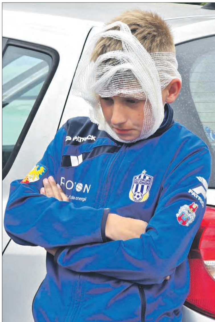
Spokojnie, to tylko symulowana ofiara wypadku samochodowego