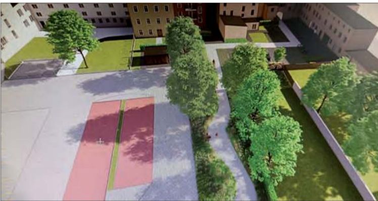
Podwórko przy ul. Piastowskiej, przy parkingu Biedronki

Władze Prudnika podkreślają, że inwestycja jest odpowiedzią na oczekiwania mieszkańców śródmieścia, którzy od lat sygnalizowali potrzebę modernizacji tych terenów. Efektem prac ma być nie tylko poprawa wizerunku miasta, ale przede wszystkim zwiększenie komfortu codziennego życia mieszkańców. ■