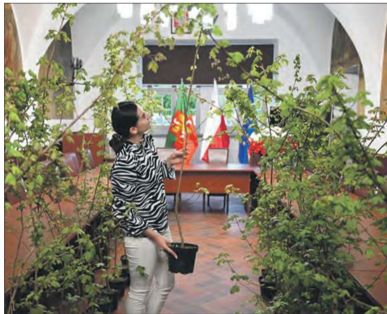
Zielone wnętrze sali obrad głogóweckiego ratusza

W ostatnich dniach z inicjatywy Gminy Głogówek mieszkańcy mogli odebrać w ratuszu darmowe sadzonki klonu polnego, świerka, sosny oraz buka. Drzewka rozdawane były w ramach akcji „800 drzew na 800-lecie Głogówka”. - Wszystkie sadzonki mają już nowych właścicieli. Dziękujemy za udział w akcji i niech się drzewka dobrze przyjmą! – informował głogówecki magistrat w poniedziałkowe przedpołudnie (28 kwietnia). Sadzonki ofiarowali właściciele Ogrodnictwa Mika z Nowych Kotkowic oraz członkowie Koła Lowieckiego „Tur” z Bielska-Białej. (d) ■