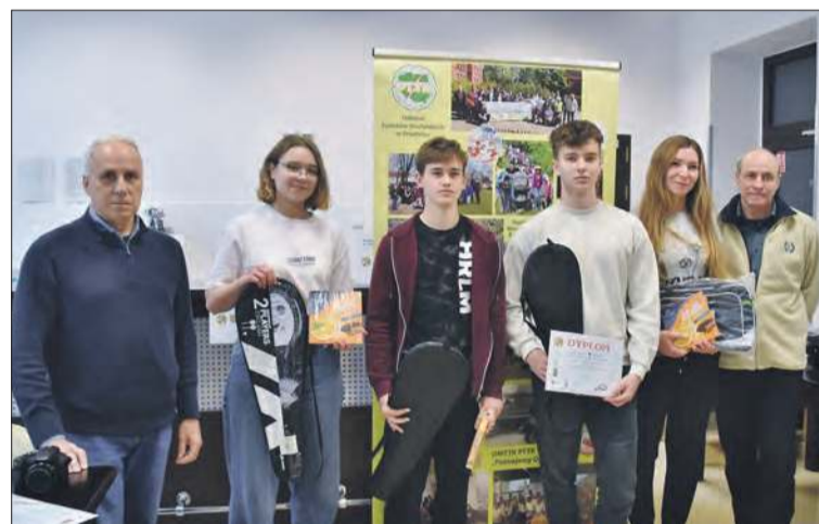
II miejsce – I LO Prudnik – drużyna II (szkoły średnie)