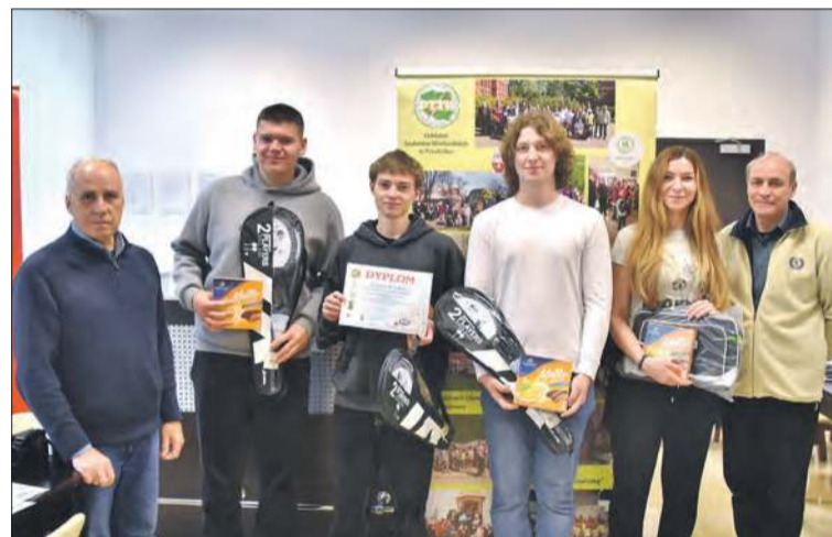
III miejsce – I LO Prudnik – drużyna I (szkoły średnie)