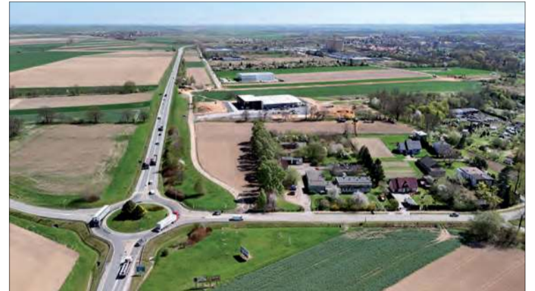
Strefa przemysłowa dzisiaj...

Z kolei Spółdzielnia Pionier, jeden z największych pracodawców w regionie, zamierza przenieść całą swoją produkcję do strefy. Ma to poprawić bezpieczeństwo i efektywność ich działalności.