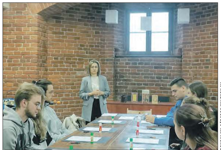
PRUDNICKI OŚRODEK KULTURY (3)