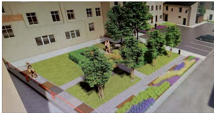
Podwórko przy ul. Klasztornej

Zakres inwestycji obejmuje kilka lokalizacji, dobrze znanych mieszkańcom miasta. Największe zmiany czekają plac zabaw przy ul. Szpitalnej, gdzie pojawią się nowe urządzenia do zabawy, bezpieczna nawierzchnia oraz elementy małej architektury. To miejsce po modernizacji ma stać się przyjazną przestrzenią zarówno dla najmłodszych, jak i ich opiekunów.