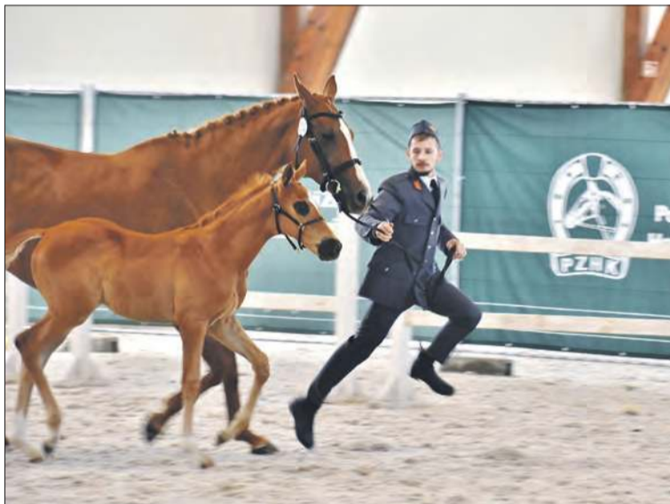
Konkurencja źrebiąt pod matkami

Czempionat koni to zawody hodowlane, w których ocenia się urodę, budowę i ruch koni, a także ich predyspozycje sportowe. Jego celem jest wyróżnienie najlepszych osobników danej rasy, promowanie hodowli oraz pomoc w selekcji koni do sportu. Konie rasy małopolskiej to konie półkrwi angloarabskiej i arabskiej hodowane pierwotnie w Małopolsce. Przedstawiciele tej rasy odznaczają się urodą, zgrabnością ruchów, wytrzymałością i dzielnością w pracy.