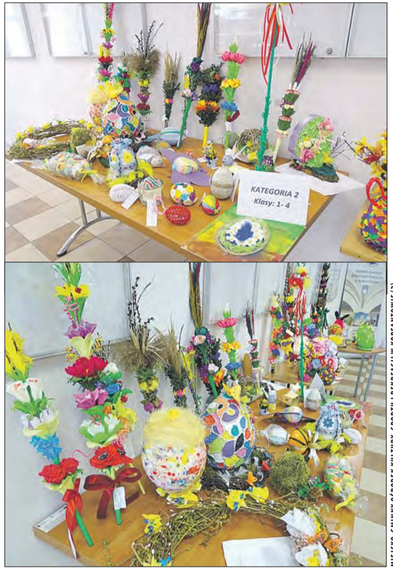
Piękna galeria prac w Miejskim Domu Kultury w Korfantowie