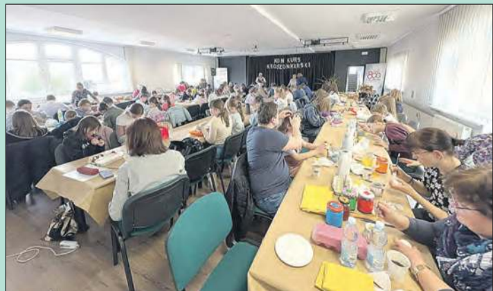
GMINNE CENTRUM KULTURY BIAŁA

11 kwietnia w GCK w Białej odbył się Czwarty Konkurs Zdobienia Jaj Wielkanocnych „Piękno Tradycji”