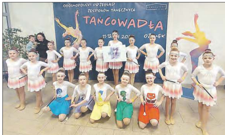
GMINNE CENTRUM KULTURY BIAŁA

Bialskie Mażoretki wystąpiły w dwóch kategoriach: Inne formy tańca do lat 11 w choreografii „W głowie się nie mieści” oraz Mini formacje kategoria Inne formy tańca do lat 11 w choreografii „Żyrafki”. W kategorii Mini formacje Bialskie Mażoretki Blanco zajęły 1 miejsce.