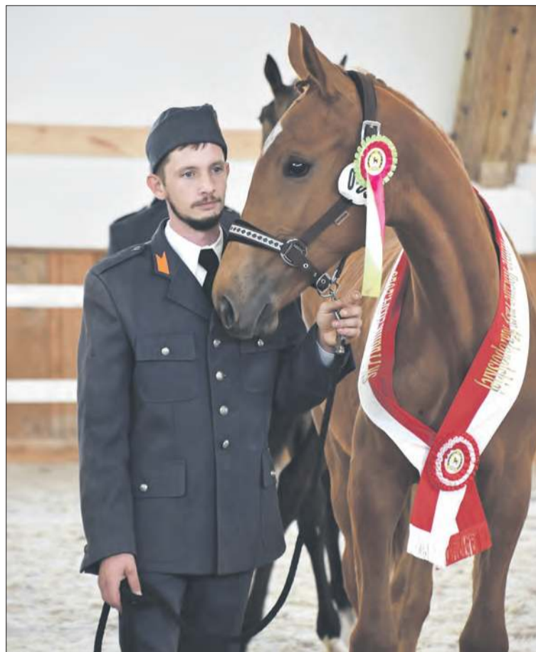
W czempionacie wyróżniono trzy konie z hodowli Stadniny Koni Prudnik

W programie zawodów w Chocimiu były prezentacje – użyjmy tu profesjonalnych określeń – stawki koni na kole: źrebiąt pod matkami, koni rocznych rasy małopolskiej, koni dwuletnich ras szlacheckich oraz koni