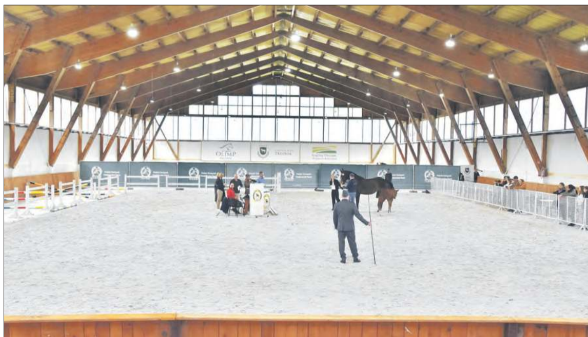
Czempionat odbył się w ponownie udostępnionej do użytku w celach hippicznych krytej ujeżdżalni

Wydarzenie zorganizowały wspólnie Stadnina Koni Prudnik oraz Śląsko-Opolski Związek Hodowców Koni w Katowicach. ■