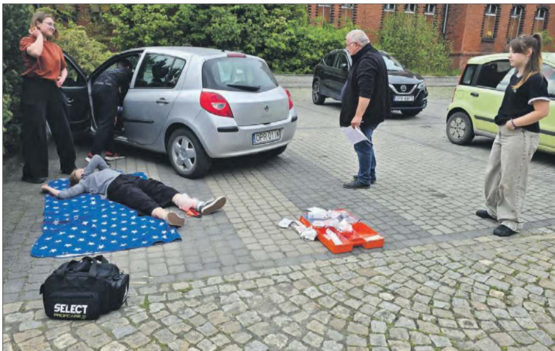
Jednym z turniejowych zadań było udzielenie pomocy przedmedycznej w ramach symulowanego wypadku samochodowego

Turniej ma charakter interdyscyplinarny i wymaga od uczestników szerokiej wiedzy geograficznej, przyrodniczej, topograficznej, krajoznawczej, turystycznej, przepisów ruchu drogowego oraz pomocy przedmedycznej. Ponadto trzeba wykazać się dobrą umiejętnością jazdy rowerze (z przeszkodami) oraz marszu na orientację.