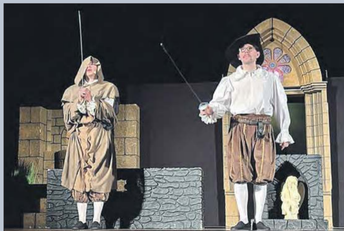
CENTRUM KULTURY W GŁUCHOŁAZACH

Z okazji obchodzonego 27 marca Międzynarodowego Dnia Teatru na scenie Centrum Kultury w Głuchołazach odbył się spektakl „Trzej muskietierowie”