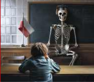
Anatomia katastrofy polskiej oświaty... / 4