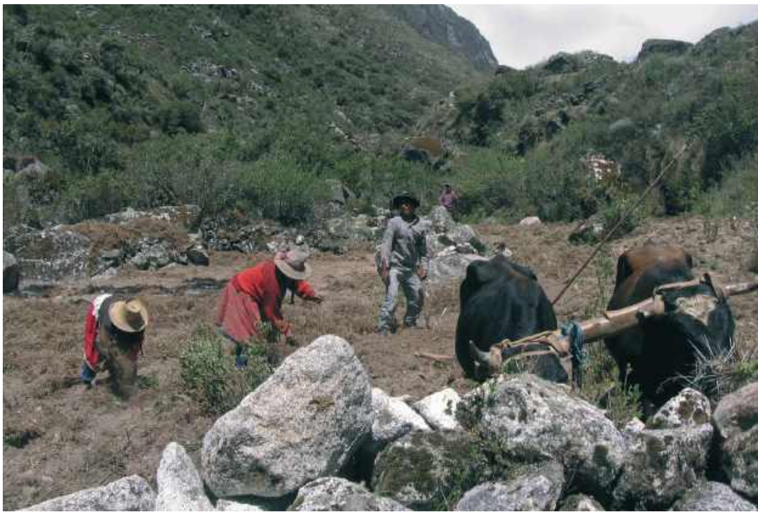
Peruwiańska rodzina górali zamieszkująca stoki Doliny Santa Cruz. Kobieta prosi o proszki na ból głowy. Kolejne napotkane rodziny czynią podobnie.