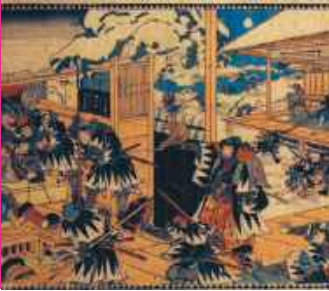
Legendarni ronini / 50