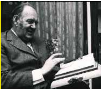
Wykupił syna Sienkiewicza z rąk Niemców... / 30