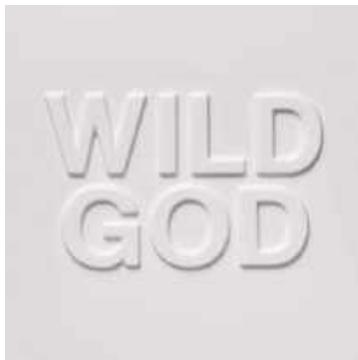
Nick Cave & The Bad Seeds, WILD GOD, PIAS Recordings