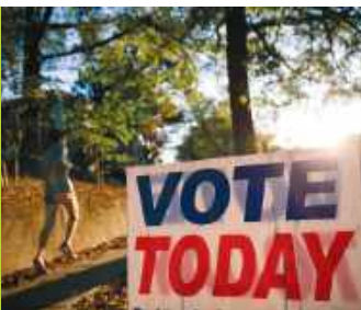
Przed wyborami. Chińczycy ostrzegają USA przed marksizmem / 70