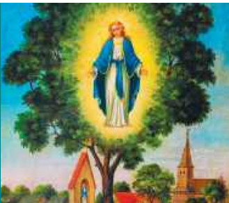
„Idź do źródła i napij się wody!” / 14

Redakcja zastrzega sobie prawo do skracania i redagowania tekstów. ISSN 1895-4960