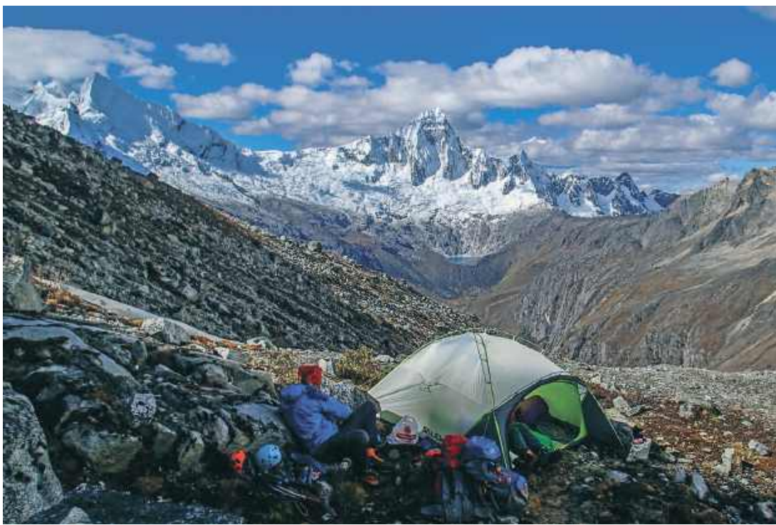
Huascarán, czyli peruwiański Wielki Grabarz.

tywny płóg. Kobiety coś sadzą. Widząc nas, na moment przerywają.