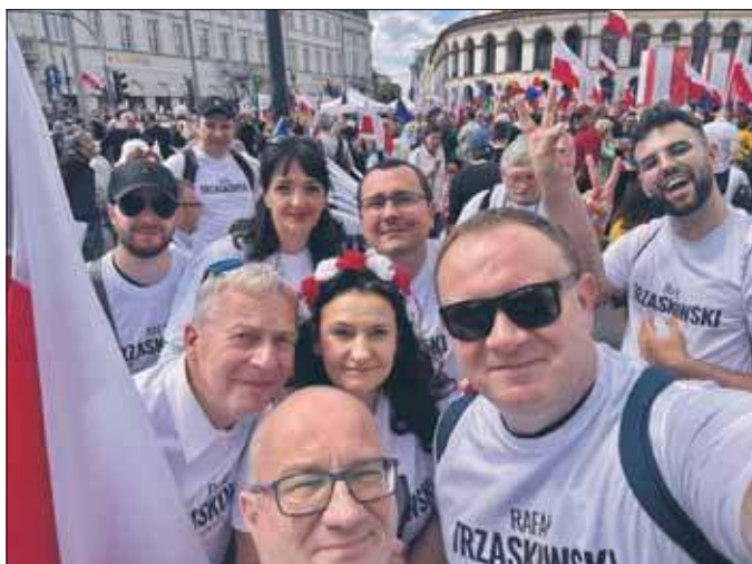
„Wielki Marsz Patriotów”, wspierający Rafała Trzaskowskiego

Jaworznianie podkreślają, że udział w marszu