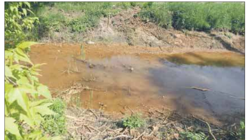
Miejsce po tamie

Idąc z biegiem rzeki zauważyliśmy, że poziom wody wyraźnie opadł. Wyraźnie widać to po rdzawym osadzie na przybrzeżnej roślinności. Tam wciąż brak roślinności. Znaczący się, pojawiają się pierwsze siewki i nic ponadto. To mogłoby świadczyć o tym, że do likwidacji tamy doszło w okresie wegetacji. Największa w tej okolicy zapora znajdowała się tuż przed wielką wierzbą kruchą, która samot-