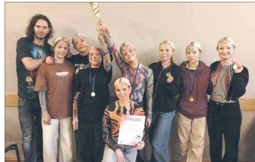
Dyemotion na Ogólnopolskim Festiwalu Tańca Taki Taniec