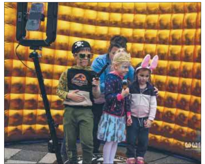
Fotobudka – jaka frajda