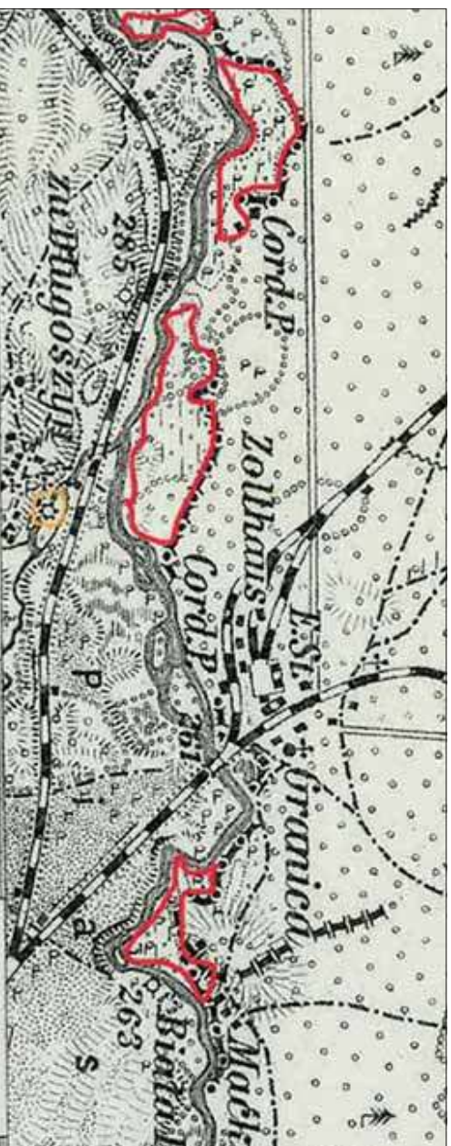
Na czerwono – zaznaczono tytułowe przyczółki (Wikipedia)

Jaworzno co prawda nie leży nad żadną większą rzeką, położone jest jednak w widłach rzek średnich, a mianowicie Białej Przemszy oraz Przemszy. Obydwie rzeki miały w przeszłości charakter graniczny. Zachowały taki zresztą do dziś. Przemsza jest bowiem na znacznym odcinku zachodnią granicą naszego miasta, Przemsza Biała natomiast jest na pewnym odcinku północną granicą Jaworzna.