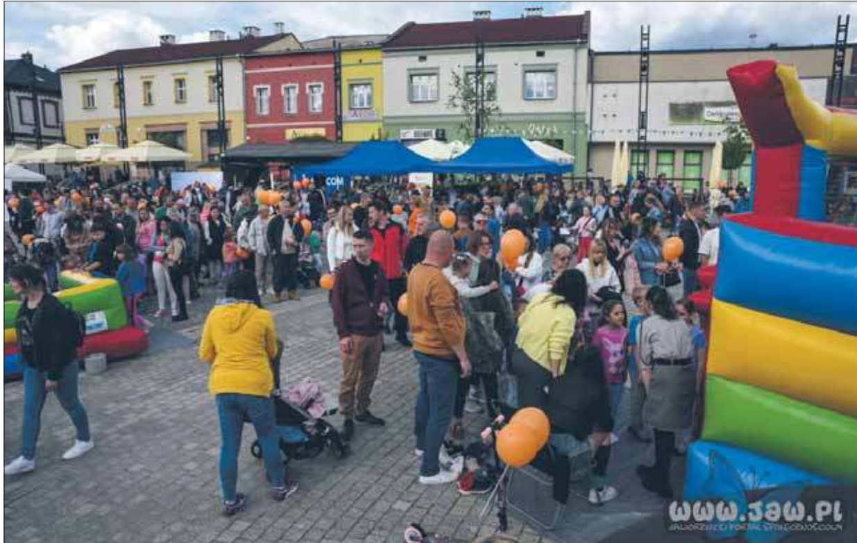
Jaworznianie lubią pikniki

W prawdzie Dzień Dziecka dopiero za tydzień, ale na świętowanie dobra jest każda pora. Tak więc Stowarzyszenie Jaworzno Moje Miasto zaprosiło milusińskich na Dzień Dziecka na jaworznicki rynek główny. Pogoda dopisała, licznie więc pojawili się i mali i duzi. Wszyscy w świetnych nastrojach, zabawa była przednia. Rynek ożył, było barwnie i radośnie, atrakcji mnóstwo.