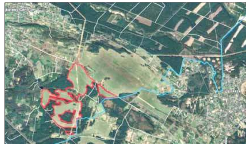
Tereny w Ciężkowicach