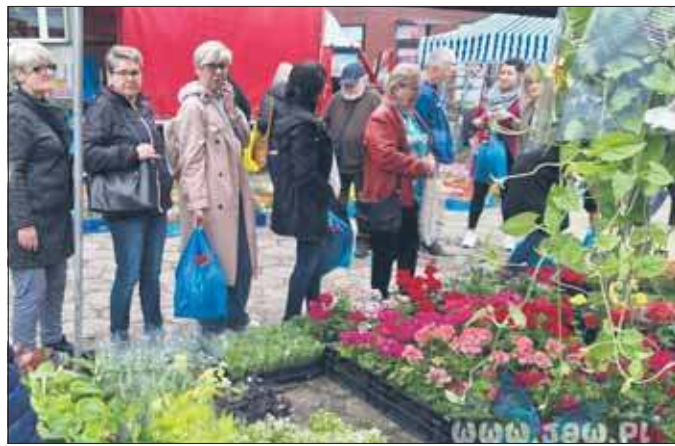
Na małym rynku ruch, pora na sadzenie i sianie