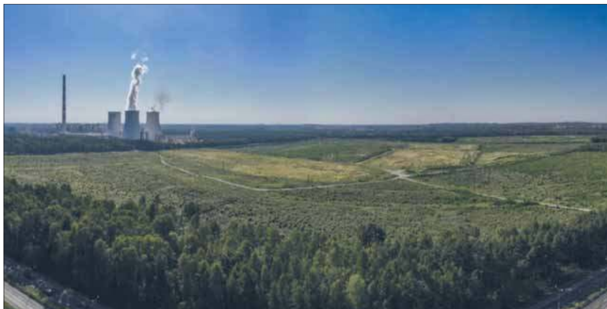
JOG Jaworzno, Jaworzniński Obszar Gospodarczy

N arodowy Fundusz Ochrony Środowiska i Gospodarki Wodnej ogłosił nabór wniosków do programu „Instrument wsparcia dla gospodarki niskoemisyjnej”, który może przynieść duże inwestycje również w Jaworznie. W ramach naboru możliwe będzie uzyskanie dofinansowania kapitałowego m.in. na budowę fabryki i instalacji służących produkcji pojazdów zeroemisyjnych, baterii, stacji ładowania, turbin wiatrowych, a także komponentów i infrastruktury związanej z elektromobilnością. Budżet programu ze środków Krajowego Planu Odbudowy i Zwiększenia Odporności (KPO) wynosi aż 4,78 mld zł. ElectroMobility Poland SA zapowiada złożenie wniosku.