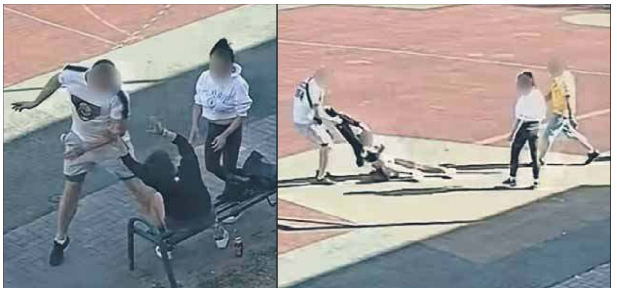
Brutalne i szokujące sceny rozegrały się na boisku szkolnym w obecności dzieci

Jak wynika z relacji poszkodowanej, siedziała z koleżanką na ławce, gdy z sąsiedniej grupy osób podszedł do niej agresywny mężczyzna. Podczas zarejestrowanego ataku sprawca był ubrany w koszulkę klubu GKS Katowice. Zażądał od kobiety, aby ta oddała bluzę i czapkę z emblematami krakowskiego klubu sportowego – Wisły Kraków. Kobieta odmówiła, tłumacząc, że pod bluzą ma jedynie bieliznę. To jednak tylko rozwścieczyło napastnika. Uderzył ją w głowę i próbował zdebrać z niej ubra-