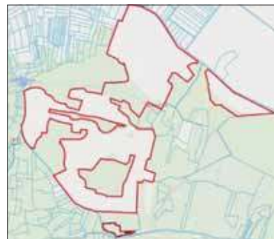
Działki pod inwestycje

Budowa farmy fotowoltaicznej planowana jest tuż przy granicy z województwem małopolskim. Inwestycja o nazwie „Budowa elektrowni fotowoltaicznej o mocy do 52 MW wraz z infrastrukturą towarzyszącą” miałyby objąć działki nr 3081, 3068 i 3074.