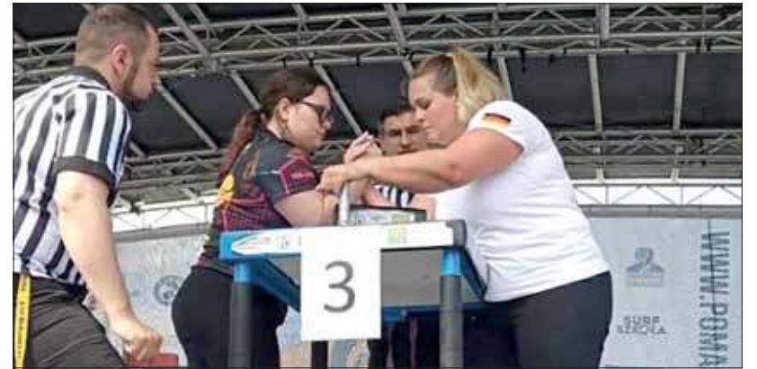
XIV Międzynarodowe Mistrzostwa Helu w Armwrestlingu.

Prawdziwy pokaz siły Julia dała jednak w zmaganiach na prawą