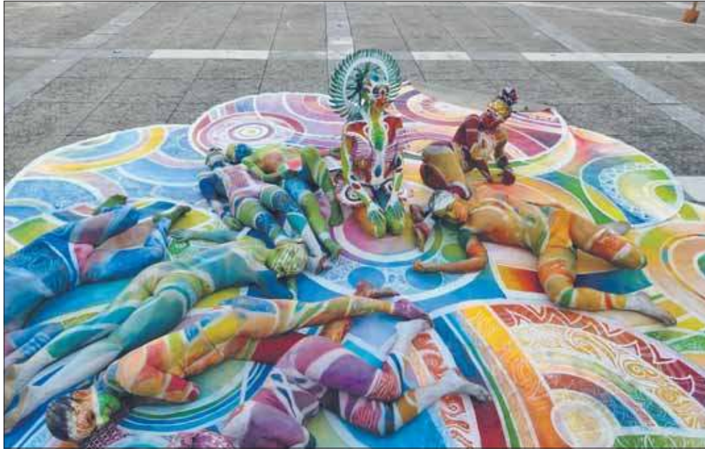
AgitÁgueda Art Festival

M arian Folga wziął udział w wyjątkowym festiwalu organizowanym w małym miasteczku w Portugalii. AgitÁgueda – Art Festival co roku przyciąga artystów, a także turystów z całego świata.