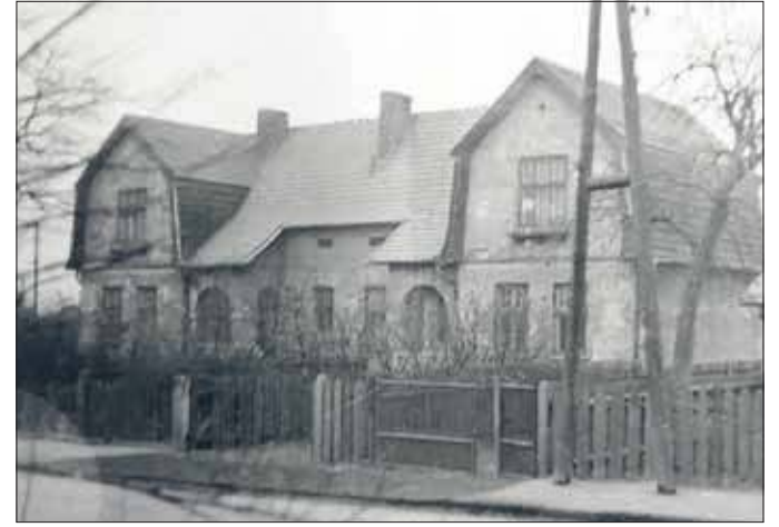
Dom na Chrustach, w którym moi dziadkowie mieszkali przez wiele lat, do początku lat 80. XX wieku (MMJ)

Z jakiegoś jednak powodu owe przestarzałe garnki i naczynia wracają znów do mody. Kubki i kubeczki, garnki, sagany, rondle i rondelki. Niekiedy są rzeczywiście imitacją naczyń emaliowanych. Sam mam w domu dwa kubki na kawę, które dosłownie wyglądają na takie, a nie inne, w rzeczywistości są jednak kubkami glinianymi; wyprofilowanymi i pomalowanymi tak, że emalię przypominają. Coraz więcej jest wszak naczyń emaliowanych sensu stricto. Nie tylko zresztą dlatego, że wiele osób przez ostatnie dekady nie przekonało się do nowinek w temacie, zachowując wierność dawnemu stylowi. Są przecież tacy, którzy do płyt indukcyjnych nie przekonują się nigdy, nie brakuje też takich, którzy gotują nadal na piecach opalanych drewnem i węglem, choć niewąt-