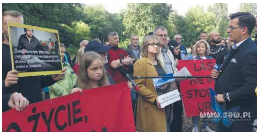
TVP3 w Dąbrowie Narodowej

Sprawa dotyczy procedowania nowego planu zagospodarowania przestrzennego „Dąbrowa Narodowa II”, czyli obszaru obejmującego 8-hektarowy las przy ulicy Katowickiej. W projekcie przedstawionym przez urząd część tego terenu ma zostać przeznaczona pod zabudowę mieszkaniową wielorodzinną do 5 kondygnacji. Jednocześnie plan zakłada pozostawienie około 3,5 hektarów terenów zielonych, w tym m.in. zieleni urządzonej czy izolacyjnej.