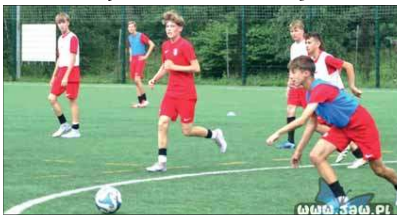
Football Camp Atletico Madryt w Jaworznie

Na stadionie miejskim zapanowała prawdziwie hiszpańska atmosfera. Wszystko za sprawą wyjątkowego obozu piłkarskiego, który prowadzą szkoleniowcy jednej z najsłynniejszych drużyn świata – Atletico Madryt. Pięciodniowy Football Camp przyciągnął na murawę dzieci i młodzież w wieku od 8 do 16 lat, które chcą poczuć smak wielkiego futbolu i uczyć się od najlepszych.