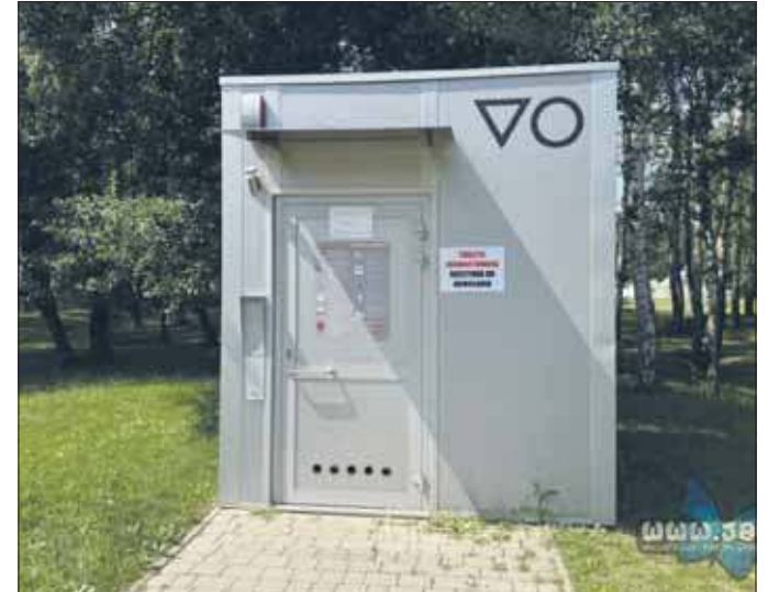
Toaleta w Parku Podłęże zdewastowana

Nieznany sprawca zdewastował znajdującą się w Parku Podłęże toaletę. Uszkodził jej całe wewnętrzne wyposażenie. To jedyna toaleta w parku, dlatego jej zamknięcie będzie szczególnie odczuwalne. Pozostaje ona nieczynna aż do odwołania.