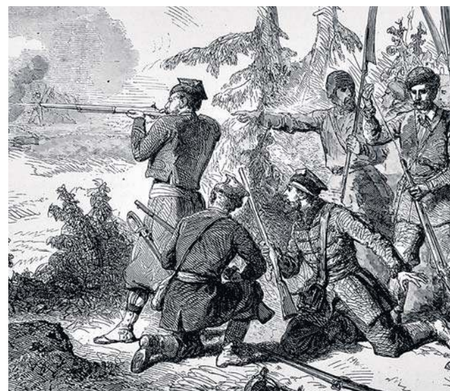
Gdy „Kurjer” drukował swój tekst, trwała bitwa powstańcza pod Bodzechowem w powiecie ostrowieckim