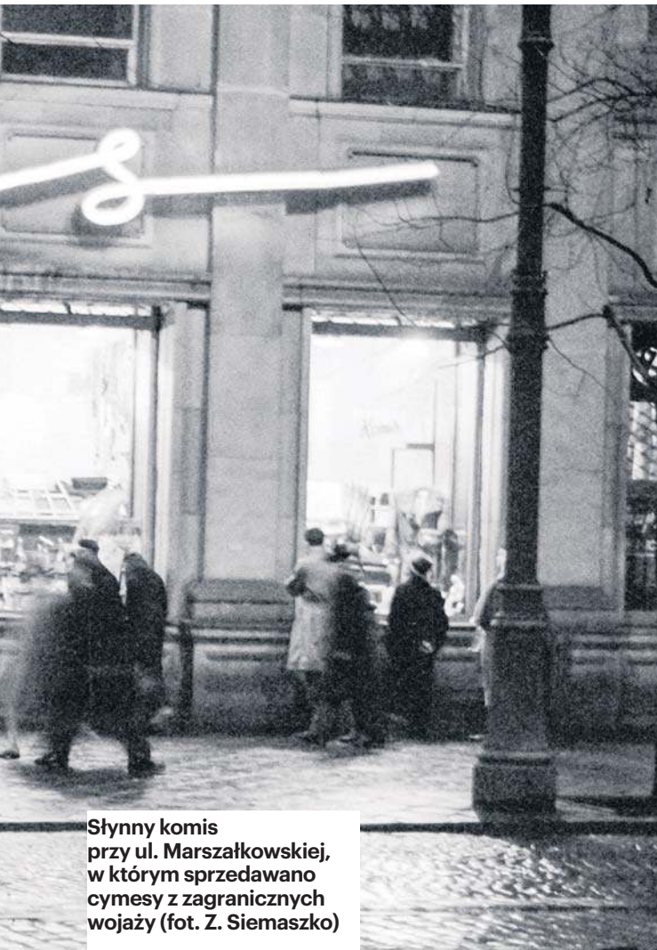
Słynny komis przy ul. Marszałkowskiej, w którym sprzedawano cymesy z zagranicznych wojaży

wstwiało się do komis na Nowym Świecie przy Chmielnej za dwieście pięćdziesiąt złotych”.