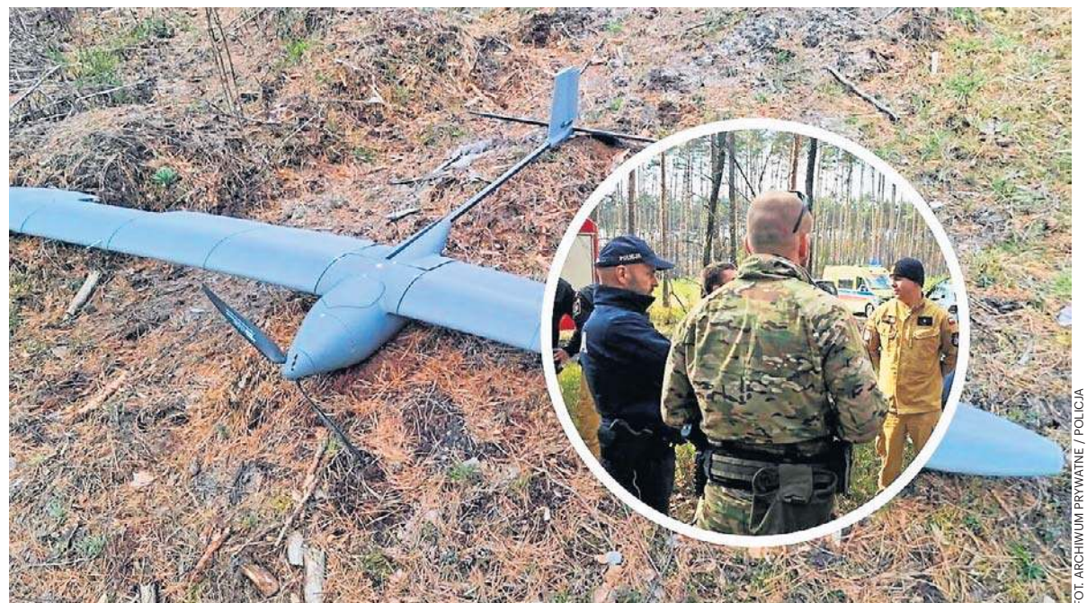
Dron leżał w podstrzeleckich lasach od sierpnia, a właściciel uważał go za bezpowrotnie straconego.

Świat: Rozejm w Zatoce Perskiej. Pakistan pośredniczył. Kto wygrał tę wojnę na razie nie wiadomo str. 8