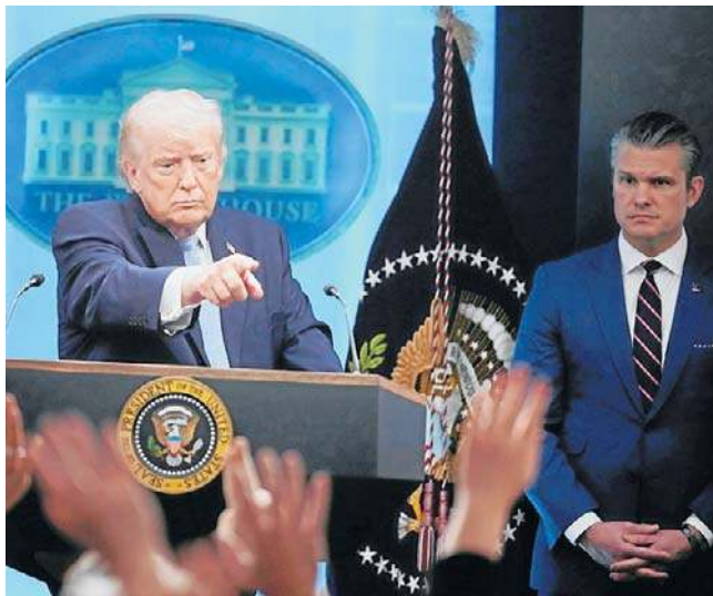
Waszyngton i Teheran osiągnęły porozumienie, które ma zapobiec eskalacji konfliktu na Bliskim Wschodzie

Około godziny po oświadczeniu Trumpa minister spraw zagranicznych Iranu Abbas Aragczy, a także osobno irańska Najwyższa Rada Bezpieczeństwa Narodowego ogłosiły, że Teheran zgadza się na dwutygodniowe zawieszenie broni i wznowienie żeglugi przez Cieśninę Ormuz. Aragczy zaznaczył, że żegluga będzie możliwa „w porozumieniu z irańskimi siłami