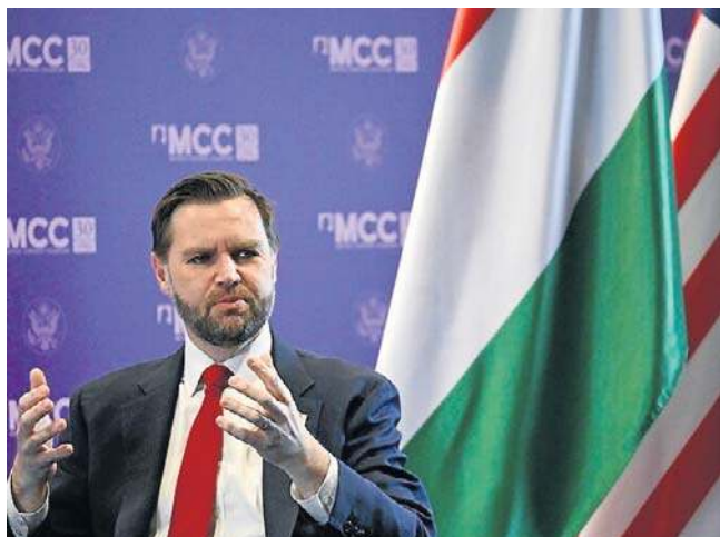
J.D. Vance przebywał z dwudniową wizytą na Węgrzech. Udzielił w tym czasie poparcia dla Viktora Orbána

Polityk odniósł się też do wypowiedzi prezydenta Ukrainy Wołodymyra Zelenskigo, który zasugerował, że mógłby przekazać adres Orbána żołnierzom ukraińskiej armii. Przyznał, że nie znał tych słów i dopiero premier Orbán powiedział mu o nich. Dodał, że nie mógł uwierzyć, że przywódca Ukrainy „powiedział coś takiego”.