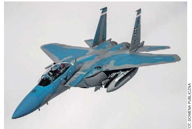
Amykański pilot zestrzelonego myśliwca spędził ponad dobę w górach, ukrywając się przed wrogiem

Technologię pomyślnie przetestowano na śmigłowcach Black Hawk pod kątem potencjalnego wykorzystania w myśliwcach F-35.