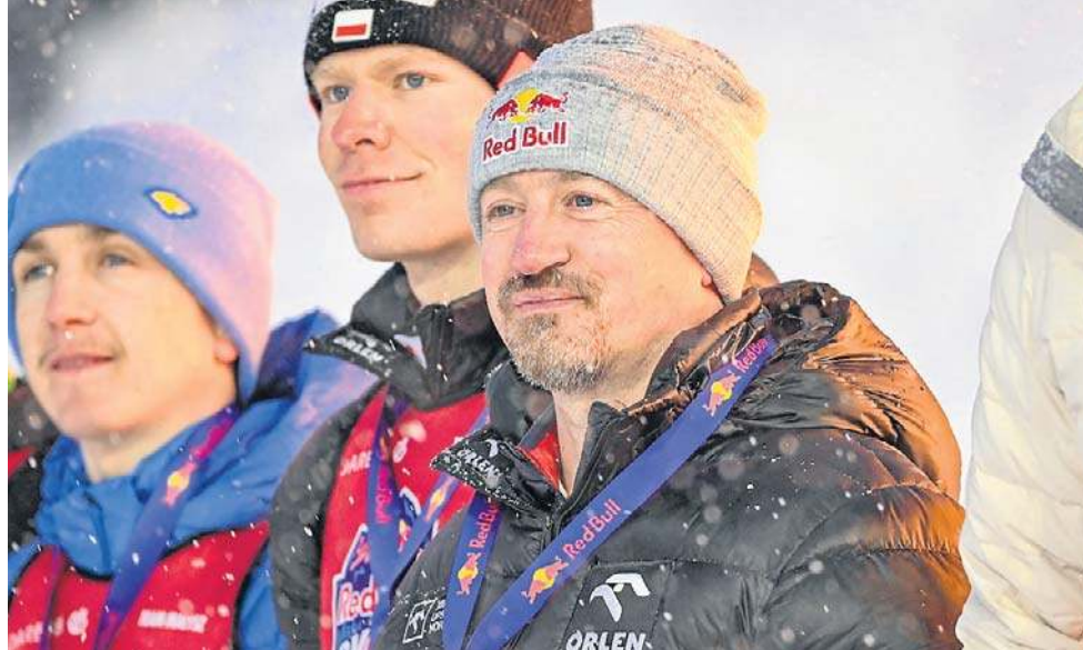
Adam Małysz był kapitanem drużyny, która w zawodach Red Bull Skoki w Punkt była druga. Były one rozgrywane w zdecydowanie innej formule niż Puchar Świata

To była zabawa, a za nami też jak najbardziej poważny sezon w skokach narciarskich. Podsumowując: trzy medale olimpijskie Kacpra Tomasiaka i bardzo słaby Puchar Świata. Jak by Pan to wszystko skomentował? Myślę, że ogólnie sezon trudno jednoznacznie ocenić. To nie tak, że był w stu procentach udany lub nieudany. Były takie