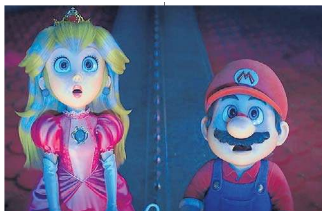
„Super Mario Galaxy Film” w kinie Helios

Wydzieńczony przez swoją bajecznie bogatą rodzinę Becket Redfellow postanawia odzyskać należną mu fortunę. Na drodze do celu stoi jednak „tylko” jedna przeszkoda - musi po kolei wyeliminować siedmioro krewnych. Seanse: C.H. Solaris: piątek: 15:50, 18:15,