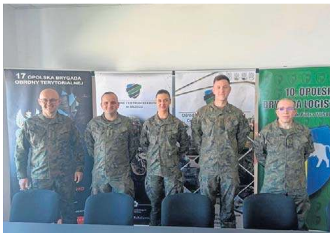
Wydarzenie ma charakter rodzinny i edukacyjny. Przewidziano występy artystyczne i pokazy.