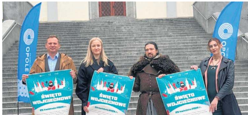
Zamek Górny będzie dostępny w godz. 13:00 - 18:00 bez konieczności rezerwacji.