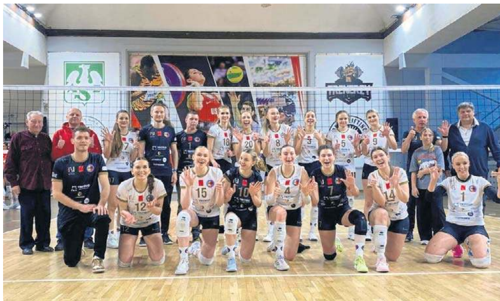
Zajęcie 6. miejsca w 1 lidze zgodnie zostało przyjęte w nyskim klubie za sukces. Tak prezentowała się drużyna NTSK PANS Komunalnik Nysa po ostatnim meczu sezonu

Szczególnie ta pierwsza odegrała ogromną rolę w tym, że w drugiej części sezonu NTSK się odbudował. I to na tyle mocno, że fazę zasadniczą zakończył na 6. pozycji, oznaczającej zarazem awans do play-off.