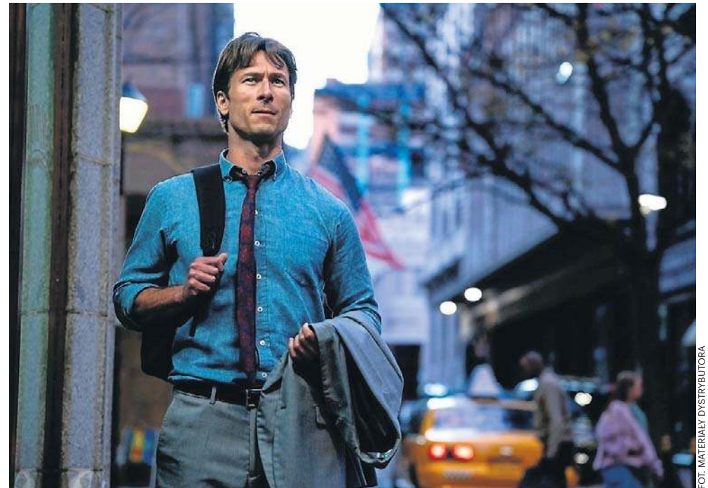
„Przepis na morderstwo” w kinie Helios

W bezwzględnej grze o pieniądze nie ma miejsca na skrupuły, a każdy krok Becketa wciąga go coraz głębiej w niebezpieczną spiralę intryg i manipulacji.