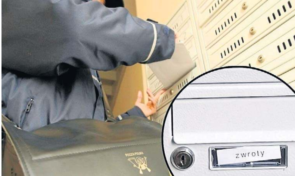
Prywatna korespondencja objęta jest tajemnicą i jej naruszenie mogłoby się spotkać z zarzutem naruszenia dóbr osobistych.

Spółka Turhand-Ret, która jest administratorem nieruchomości przy ul. Nysy Łużyckiej 15, poinformowała nas, że na podstawie umowy zawartej ze wspólnotą wykonuje na jej rzecz ściśle określone czynności zwykłego zarządu nieruchomością wspólną.