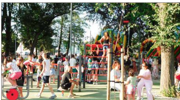
Park Słoneczny w końcu doczekał się otwarcia.