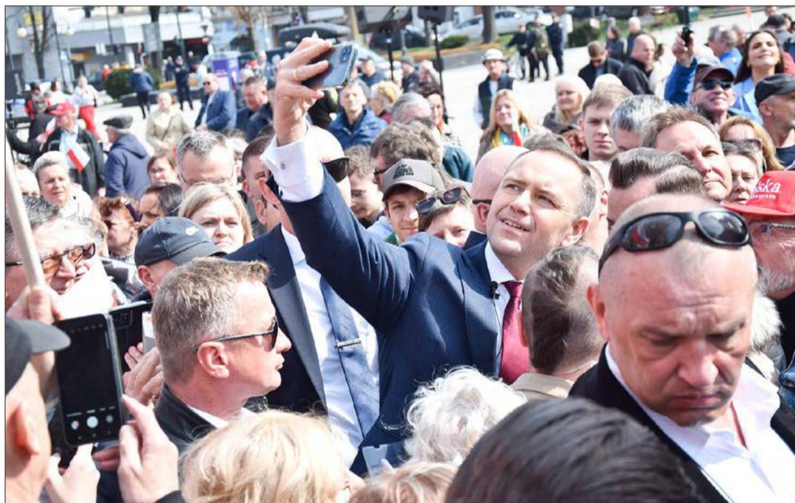
Karol Nawrocki, jeszcze jako kandydat na prezydenta RP, spotkał się z mieszkańcami Dębicy i Jodłowej.