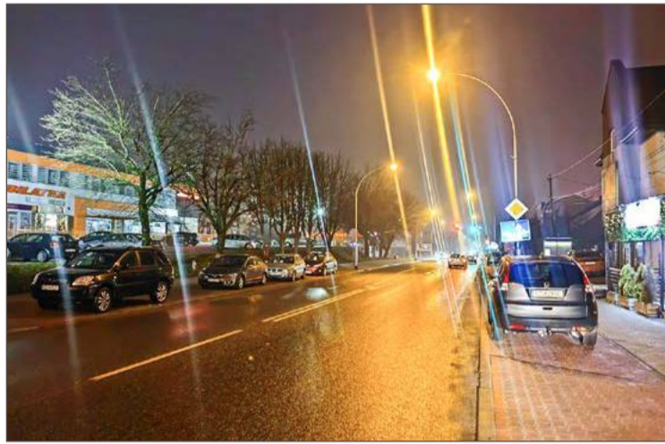
Od 19 grudnia w Dębicy nocą nie jest już ciemno.

- Nie ma znaczenia, czy to droga gminna, powiatowa, czy krajowa -