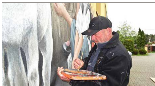
Mural na szkole w Łękach Górnych stworzył Ryszard Paprocki.