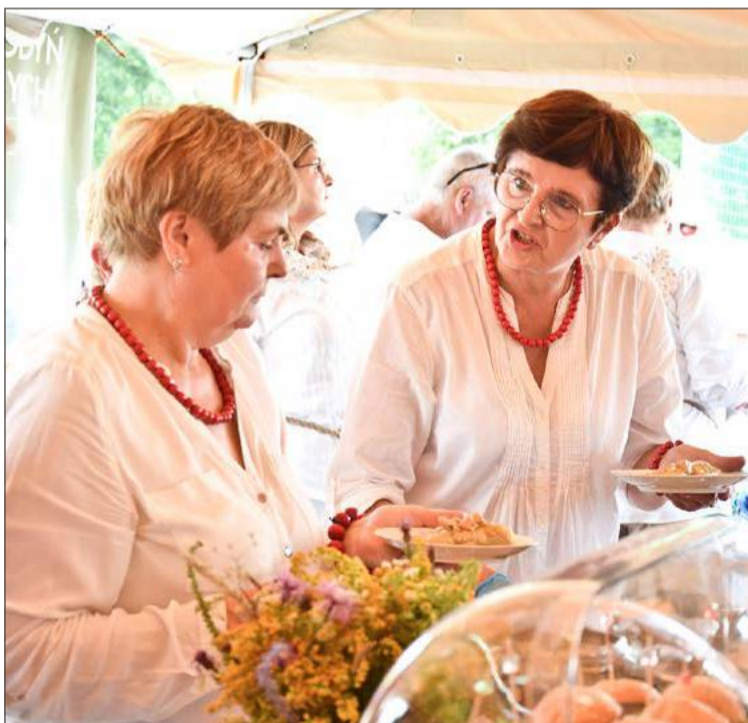
Jużyna w Dzwonowej to święto gospodyń z całego powiatu.