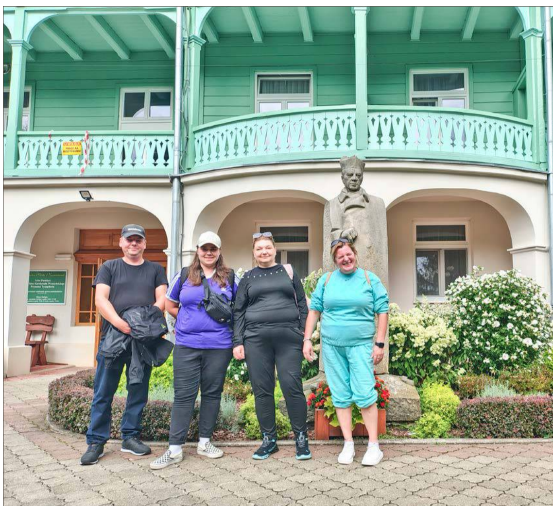
Zwiedzanie uzdrowiska w Iwoniczu-Zdroju.