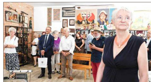
Muzeum Lalek mieści się już nie w Pilźnie, ale w Lipinach.