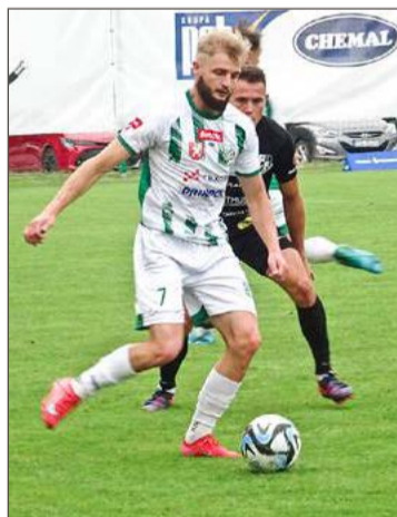
Wisłoka już za kilka dni rozpocznie przygotowania do wiosny.