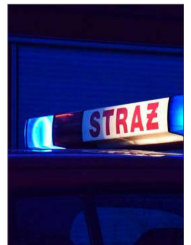
Strażacy ruszyli na pomoc 35-latkowi z Bobrowej Woli.