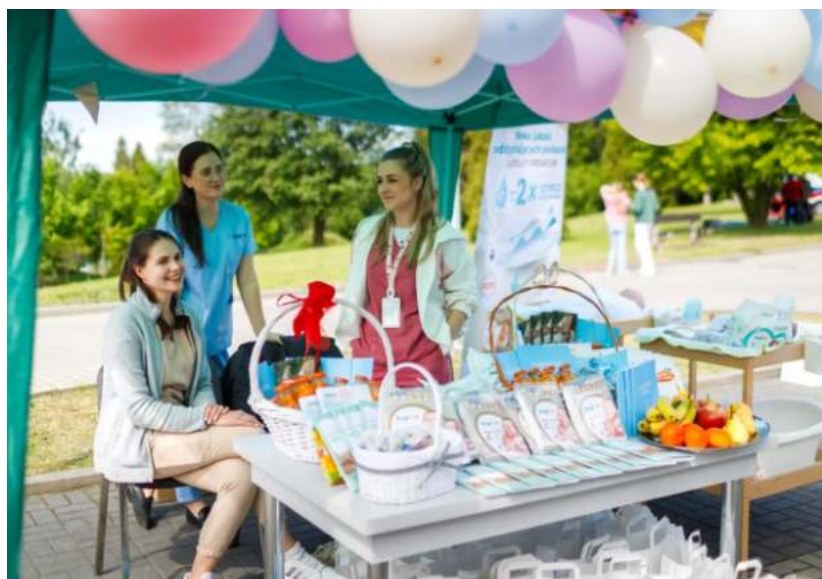
Fot. Szpital Miejski w Zabrzu(2)

- Dzień Pacjenta Szpitali Powiatowych był doskonałą okazją do promowania zdrowia, aktywności i profilaktyki zdrowotnej – podkreśla dr Ewa Weber, pełniąca funkcję prezydenta Zabrza. - Cieszę się, że mieszkańcy Zabrza skorzystali z możliwości zadbania o swoje zdrowie. Gratuluję organizatorom i personelowi szpitala, a wszystkim pacjentom składam najserdeczniejsze życzenia zdrowia – dodaje. GOR