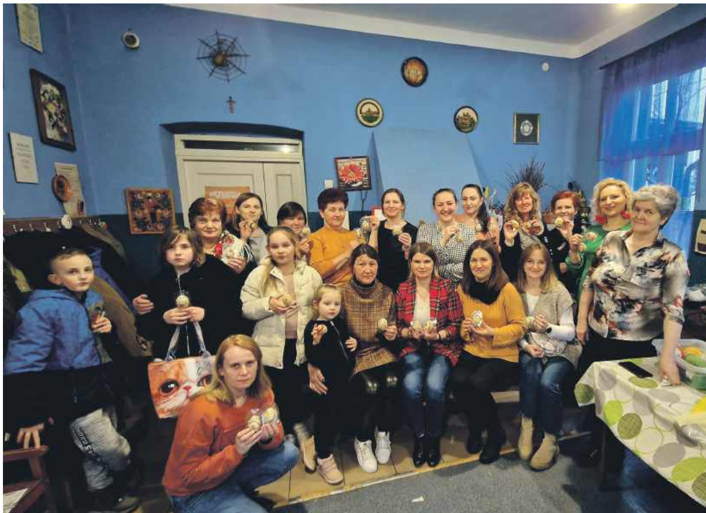
Uczestnicy warsztatów wielkanocnych z oklejanek w Kuźni w 2023 roku - warsztaty zorganizowane przez Koło w Dębinach

brakuje też mięsiwa – szynki, kiełbasy, boczku czy kaszanki. Gospodarz jeszcze w czasie postu zabijał świnia, aby przygotować zapasy na święta. Prawdziwym rarytasem była przyzucha – kawałek mięsa wieprzowego, który po leżakowaniu w solance suszył się nad kuchnią. Odkrawano z niego niewielkie kawałki, a reszta dojrzewała dalej. Na stołach pojawiał się również żurek lub barszcz biały na naturalnym zakwasie.