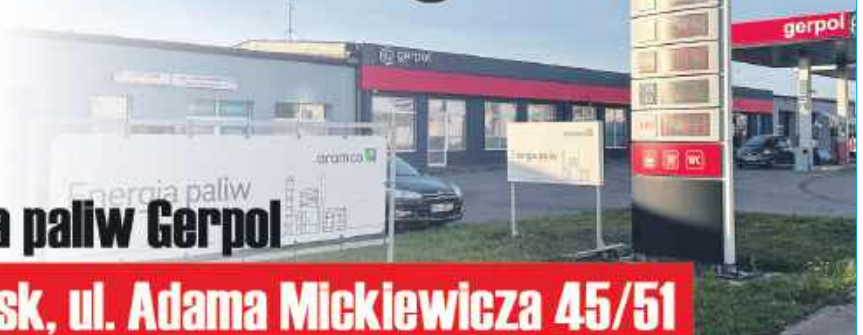
FOTO NA WESOŁO