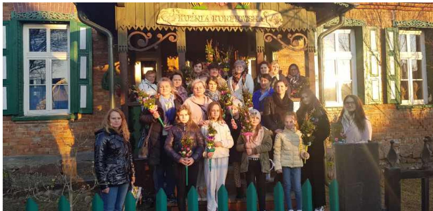
Uczestnicy warsztatów wielkanocnych zorganizowanych w Kuźni w 2022 roku przez KGW w Dębinach