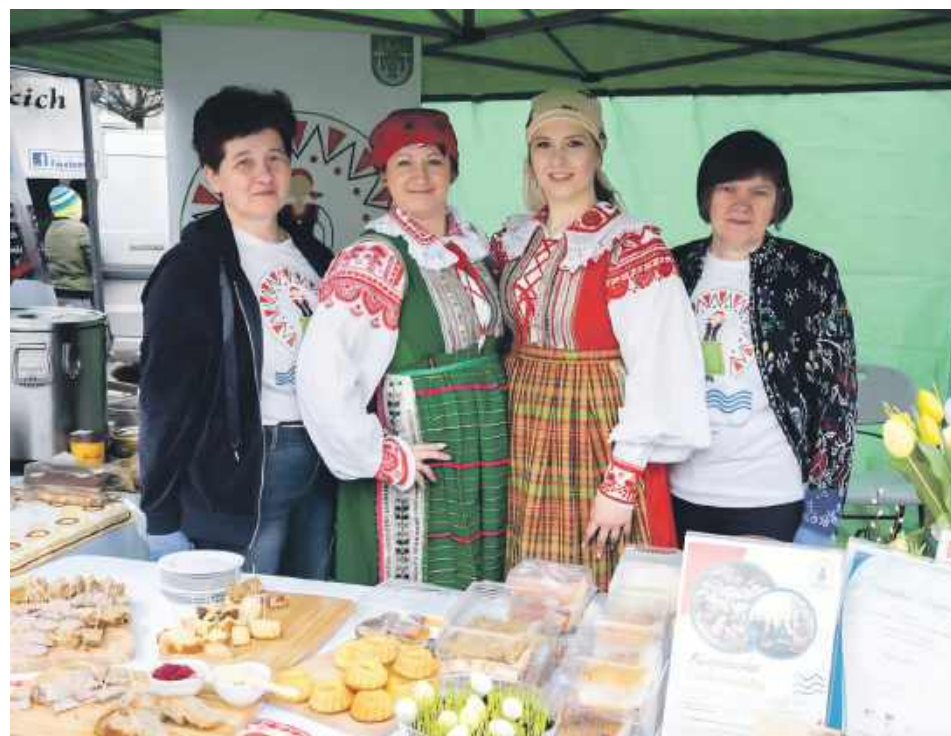
Członkinie Koła podczas Jarmarku Wielkanocnego w Pułtusku w 2023 roku

Z rezurekcją wiąże się także pewna lokalna opowieść. W parafii Zatory przez lata panował zwyczaj, że który gospodarz pierwszy wróci z rezurekcji do domu – ten będzie miał najlepsze