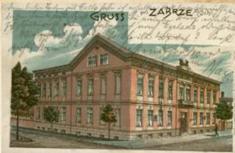
► Budynek Starostwa Powiatowego w Zabrzu, z dobudowanym (1892-1894) skrzydłem południowym, mieszczącym na pierwszym piętrze mieszkanie starosty.

1894: zakończenie rozbudowy siedziby starostwa powiatowego o skrzydło południowe (od strony obecnej ul. Bohaterów Warszawskich), mieszczące biura urzędu oraz mieszkanie służbowe dla starosty