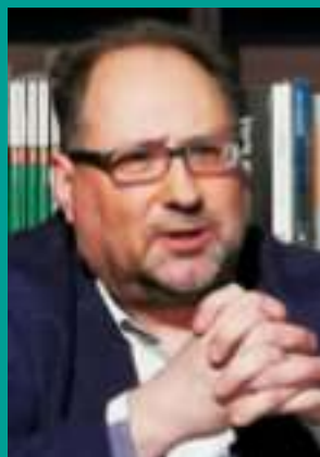
► Fot. Tomasz Jodłowski