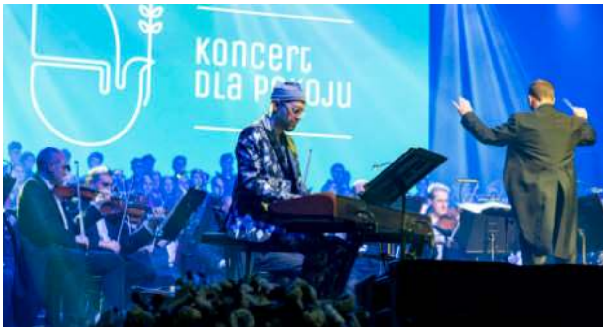
► Podczas koncertu wystąpili m.in. artyści Orkiestry Symfonicznej Filharmonii Zabrzeńskiej pod dykcją Sławomira Chrzanowskiego

dant miejski Państwowej Straży Pożarnej w Zabrzu.