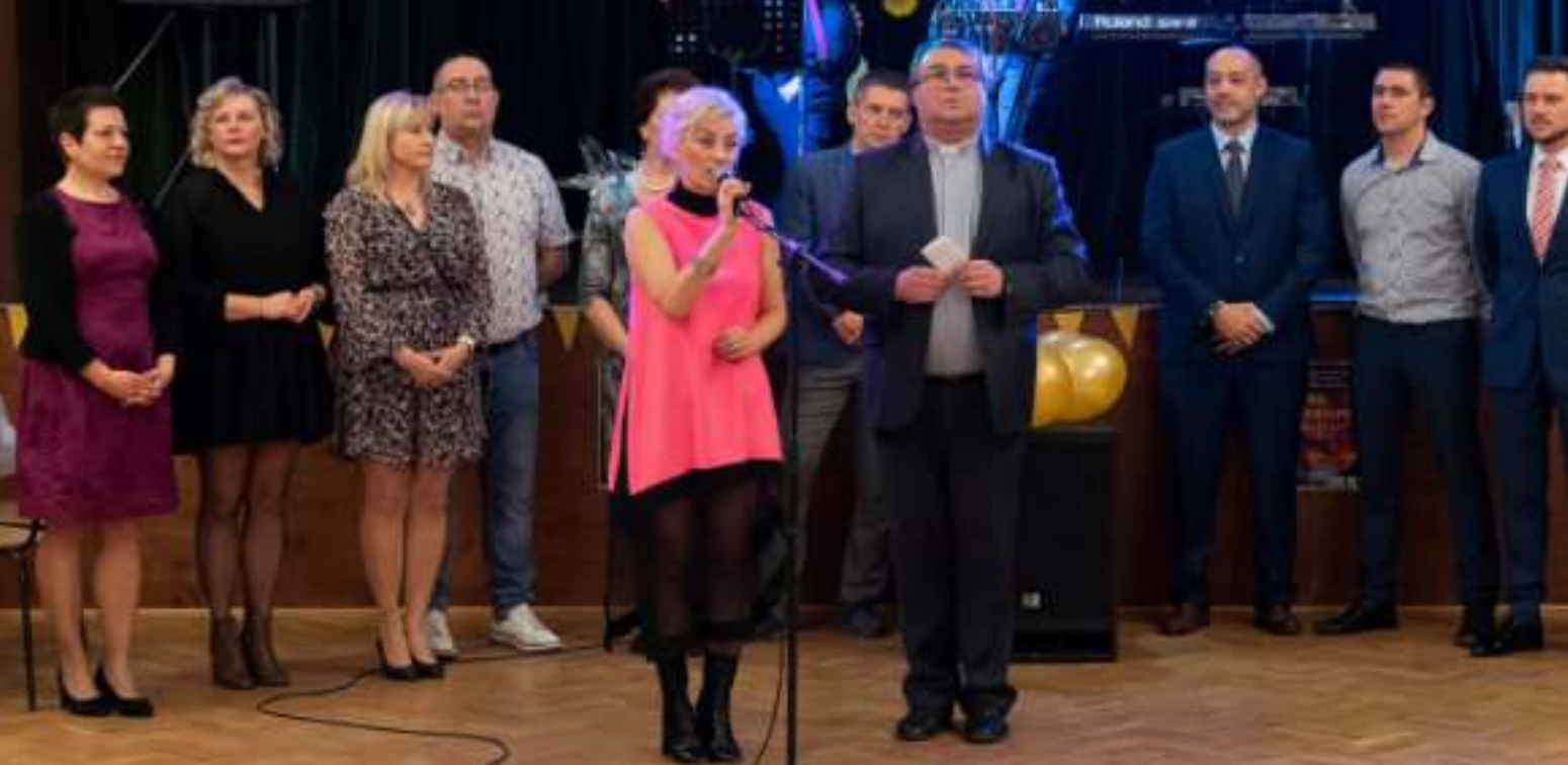
► Bal został zorganizowany przez Radę Dzielnicy Biskupice oraz parafię św. Jana Chrzciciela

W LUTYM ZAINAUGUROWANO CYKL WYDARZEŃ WPISUJĄCYCH SIĘ W OBCHODY JUBILEUSZU NAJSTARSZEJ DZIELNICY ZABRZA