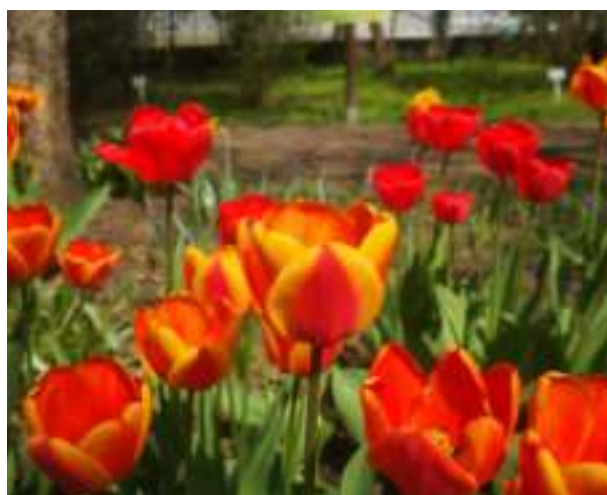
► Fot. UM Zabrze (4)

JUŻ W TYM MIESIĄCU POŻEGNAMY KALENDARZOWĄ ZIMĘ