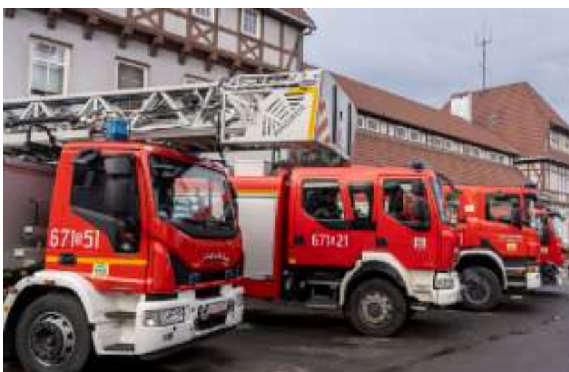
► W ubiegłym roku wyremontowane zostały garaże zabrzańskiej komendy PSP

Zorganizowana w lutym uroczysta narada roczna była okazją do podsumowania działalności Komendy Miejskiej Państwowej Straży Pożarnej w Zabrze w minionym roku oraz rozmowy o bezpieczeństwie mieszkańców. Poza strażakami zawodowymi i pracownikami cywilnymi jednostki wzięli w niej udział także przedstawiciele innych służb mundurowych oraz samorządu.