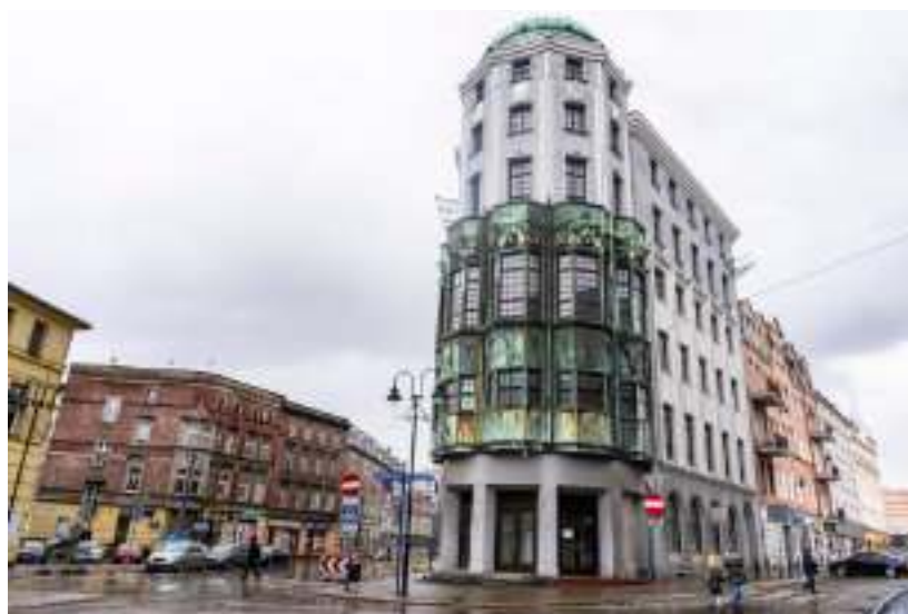
► Charakterystyczny budynek przy ul. Wolności