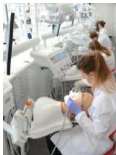
► Centrum Symulacji Medycznej SUM

GÓRNOŚLĄSKO-ZAGŁĘBIOWSKA METROPOLIA PRZYJĘŁA STRATEGIĘ ROZWOJU NA LATA 2022-2027