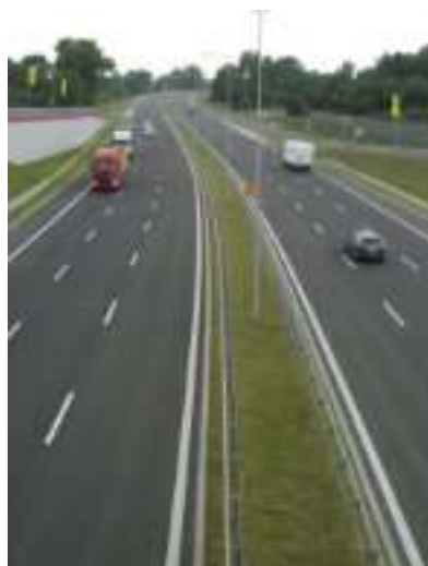
► Drogowa Trasa Średnicowa