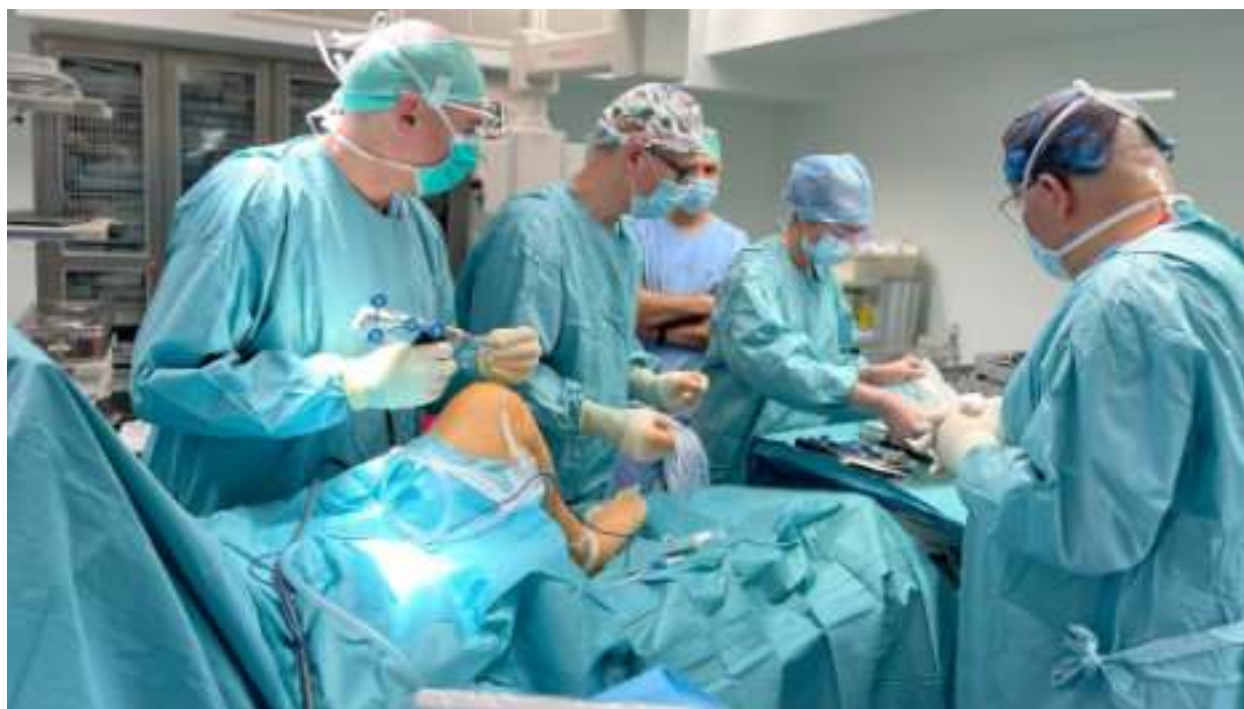
► Operacja z wykorzystaniem robota

CORI nie jest póki co własnością Szpitala Miejskiego w Zabrzu, jest jednak szansa, że trafi tam na dłużej. Wszystko zależy od tego, czy zabrzańska lecznica znajdzie środki na wypożyczenie lub zakup robota. Wartość urządzenia to ok. 2 mln. zł. GOR