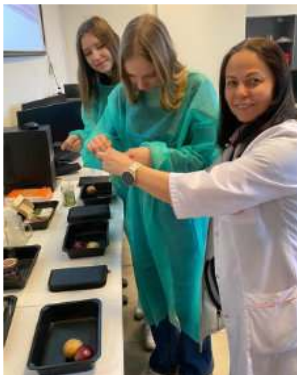
► Zajęcia odbywały się w laboratorium biologii

A dam Matysek urodził się 19 lipca 1968 r. w Piekarach Śląskich. Podczas bogatej kariery piłkarskiej dał się poznać jako świetny bramkarz. Poważną przygodę z piłką rozpoczął w Zagłębiu Wałbrzych. Jego kolejnym klubem był Śląsk Wrocław. Począwszy od sezonu 1993/94 swoją karierę z powodzeniem kontynuował na niemieckich boiskach. W reprezentacji zaliczył 35. meczów. Znalazł się w kadrze trenera Jerzego Engela na mistrzostwa świata w Korei i Japonii.