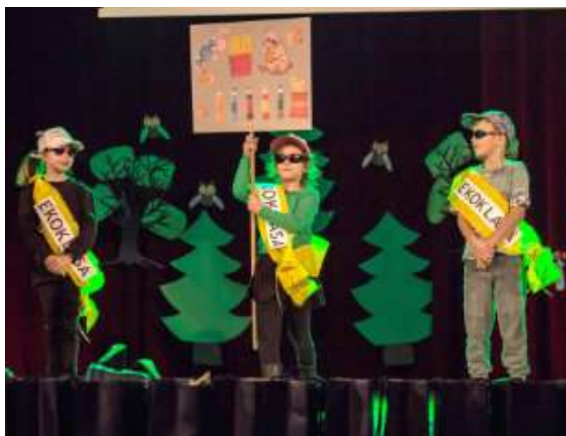
► Przygotowany przez najmłodszych program artystyczny

Najnowszą odsłonę akcji podsumowano w Miejskim Ośrodku Kultury. W programie wydarzenia znalazła się konferencja z udziałem