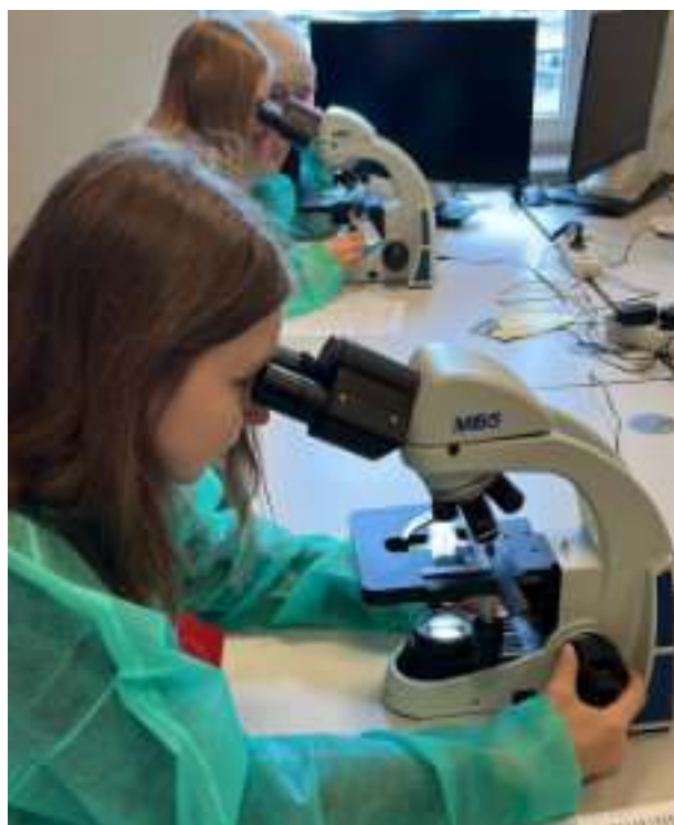
► Była okazja do poznania niewidocznych gołym okiem mikroorganizmów

Kolejna odsłona zajęć w ramach Akademii Dziecięco-Młodzieżowej już trwa. W lutym mali naukowcy mogli wziąć udział w warsztatach i doskonalić swoją znajomość języka angielskiego.