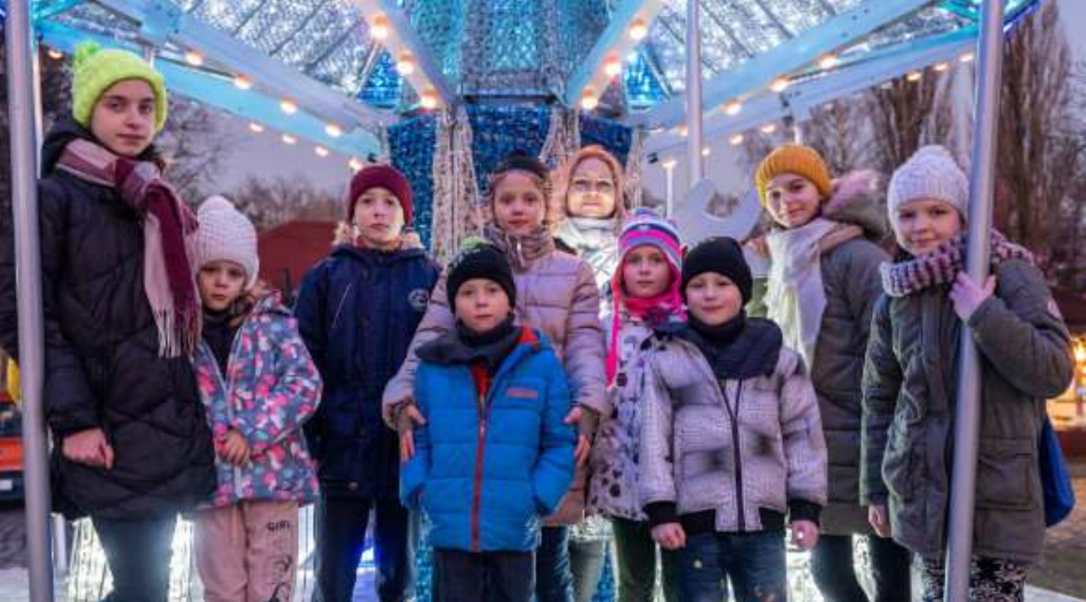
► Spotkanie było okazją do poznania atrakcji Parku Miliona Świąteł

W PARKU MILIONA ŚWIATEŁ SPOTKAŁY SIĘ ZABRZAŃSKIE RODZINY ZASTĘPCZE