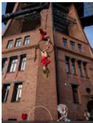
► Wieża ciśnień