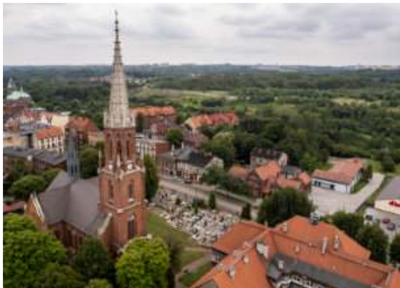
► Panorama historycznej dzielnicy Zabrza