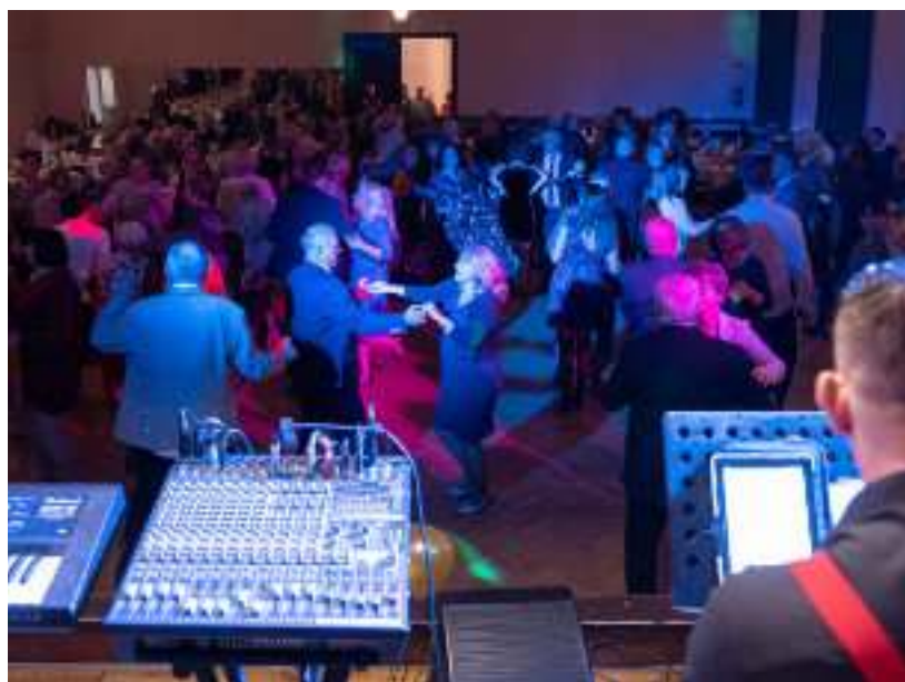
► Zabawa była znakomita

a to z kolei wymusiło potrzebę budowy zaplecza socjalnego. Dla pracowników koncernu z administracji, nadzoru technicznego oraz robotników w latach 1863-1871 wybudowano jedną z pierwszych zabrskich kolonii robotniczych Borsigwerk. Na jej terenie powstały nie tylko domy mieszkalne, ale również budynki i obiekty użyteczności publicznej: szkoła i poczta oraz kaplica ewangelicka z cmentarzem. Czynna była oczyszczalnia ścieków.