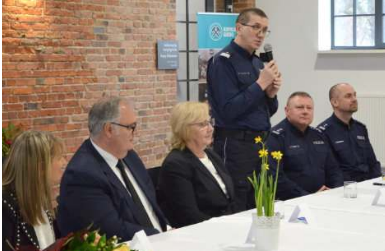
► Wśród gości lutowej odprawy był gen. Roman Rabsztyń, śląski komendant wojewódzki policji