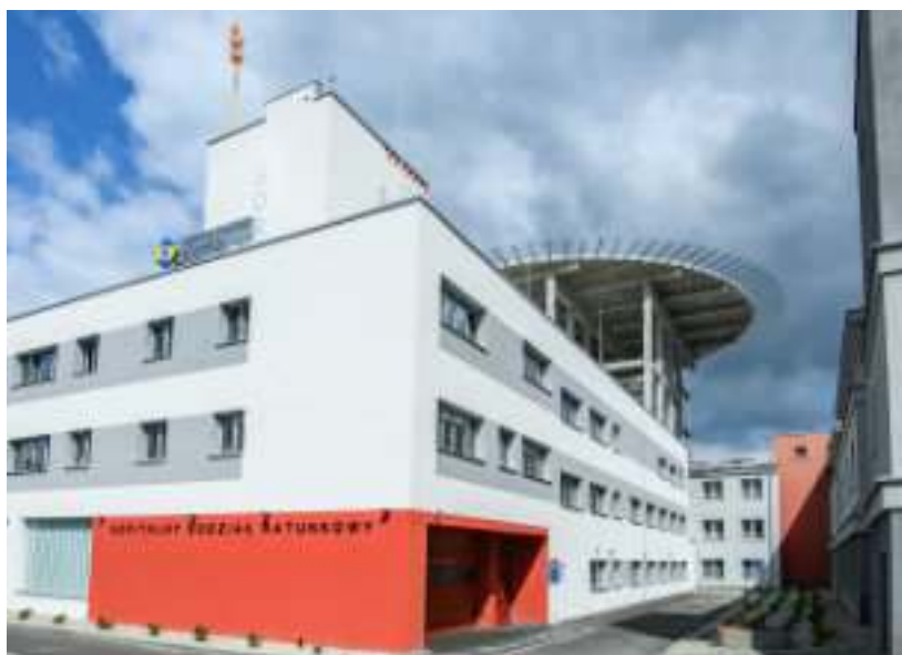
► Szpitalny Oddział Ratunkowy w Szpitalu Miejskim

Biskupice to również Zakład Górniczy SILTECH, czyli założona przez Jana Chojnackiego pierwsza w Polsce prywatna kopalnia węgla kamiennego i jednocześnie jedyna fedrująca dziś kopalnia w Zabrzu, która pomimo dekonstrukcji w branży wydobywczej realizuje swoje plany biznesowe. GOR