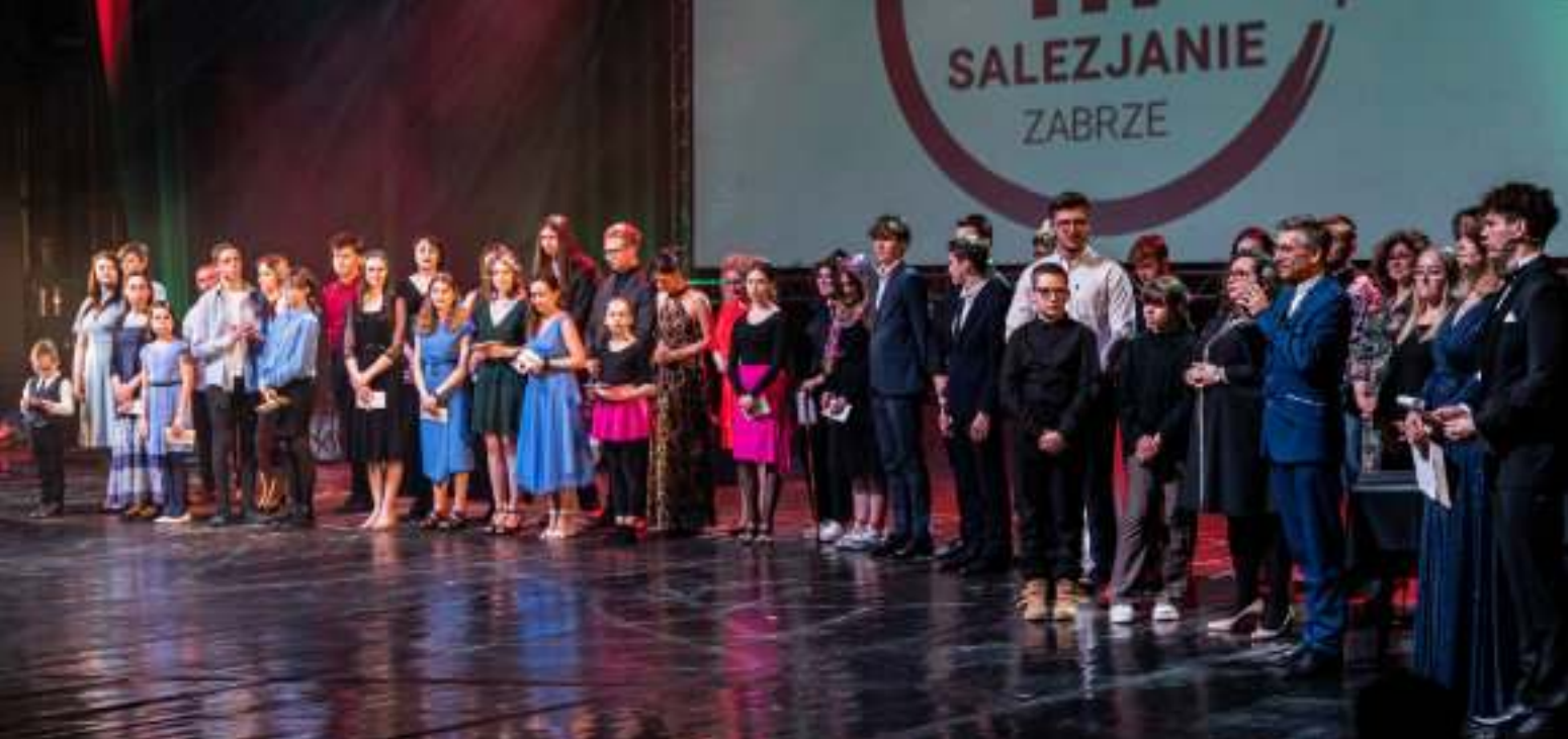
► W uroczystej gali uczestniczyli m.in. uczniowie i pedagodzy