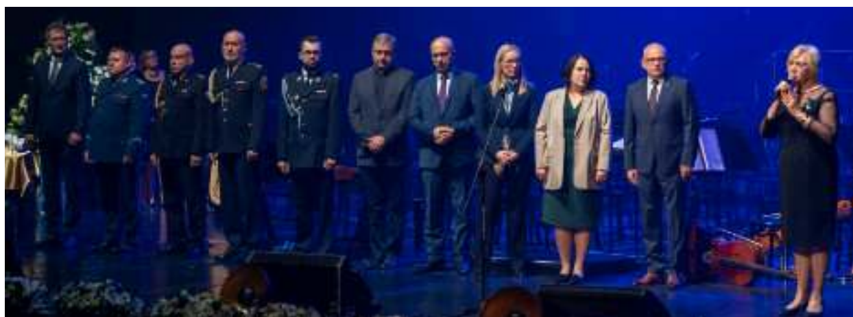
► Koncert był okazją do uhonorowania osób najbardziej zaangażowanych w pomoc dla Ukrainy