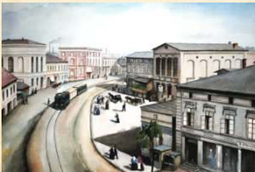
► Tramwaj o napędzie parowym w Zabrzu, uwieczniony na obrazie Alfreda Brolla Fot. Akwarela ze zbiorów Muzeum Miejskiego w Zabrzu

Oboje państwo Scheche byli ewangelikami, jednak w aktach zabrzańskiej parafii nie zachowały się żadne dane świadczące o tej sferze życia, w tym o narodzinach, bądź zgonie ich dzieci. Jednak Adolf Scheche uczestniczył dosyć aktywnie w życiu samej parafii. W latach 1896-1901 sprawował funkcję przewodniczącego