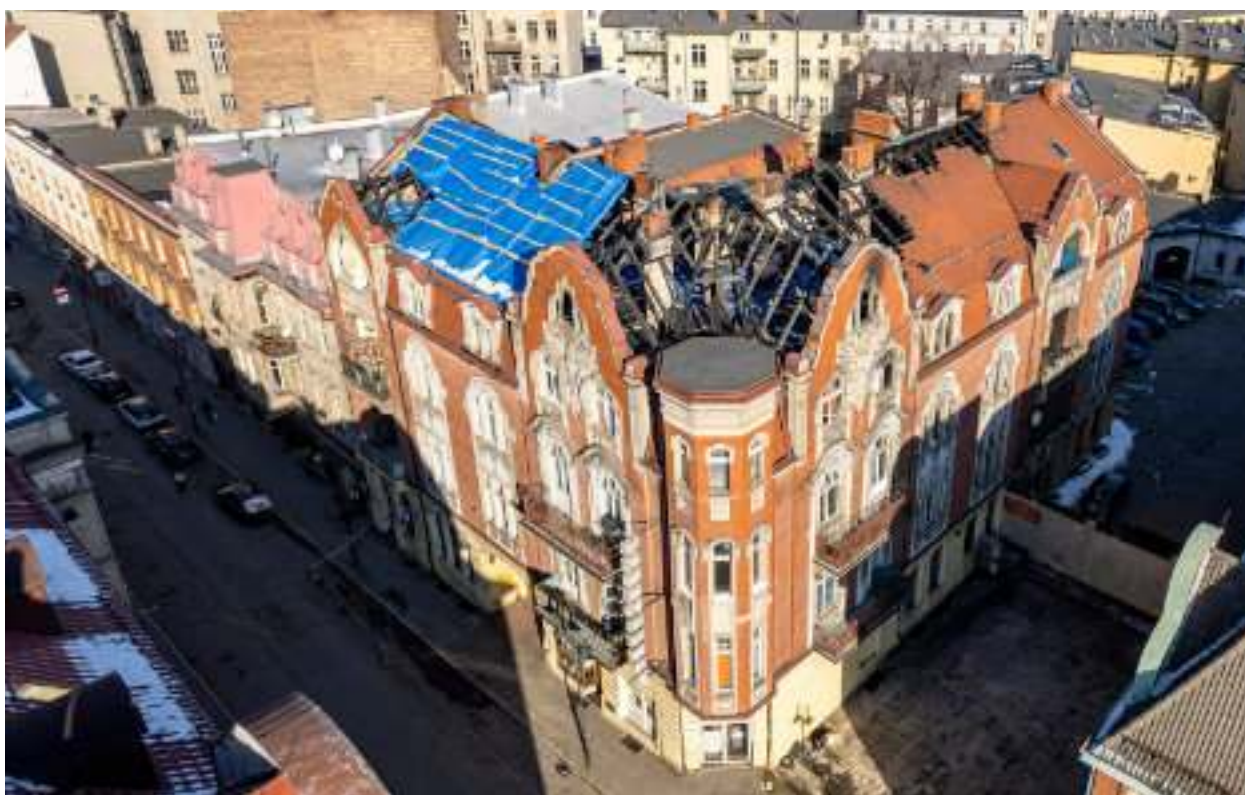
► Uszkodzona w pożarze kamienica pochodzi z początku XX w.

Takiej kamienicy nie powstydziliby się Kraków czy Wrocław. „Kamienica pod Orłem” przy ul. Dworcowej to jeden z najbardziej reprezentacyjnych budynków Zabrze. Po styczniowym pożarze czeka ją teraz niezbędny remont.