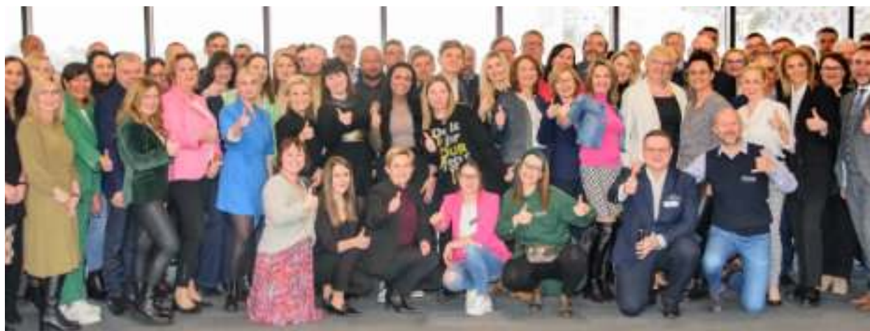
► Uczestnicy zorganizowanego w lutym spotkania