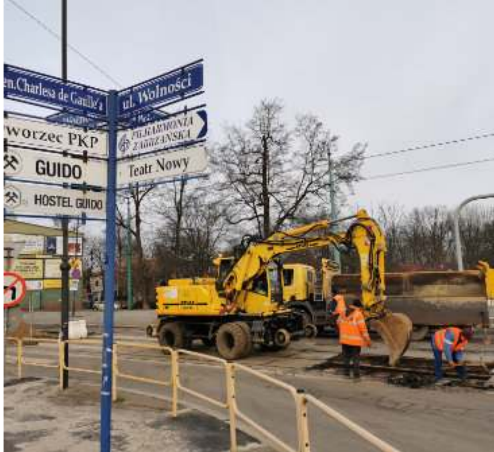
► Remontowany odcinek ul. Wolności

TRWA OCZEKIWANA PRZEZ MIESZKAŃCÓW INWESTYCJA