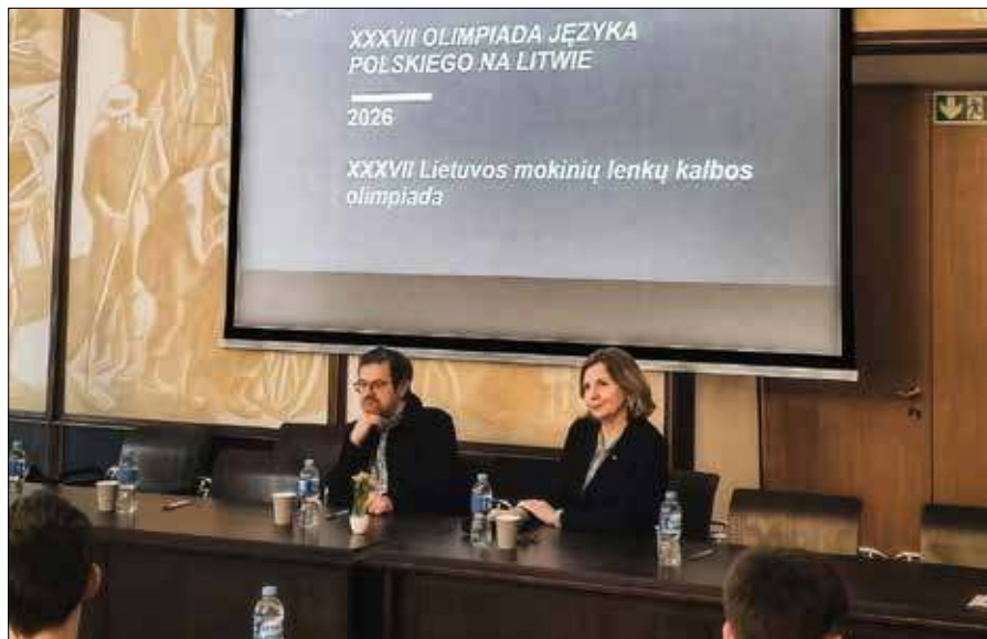
W dniach 24-25 lutego na Uniwersytecie Wileńskim odbył się finałowy etap XXXVII Olimpiady Języka Polskiego na Litwie

W dniach 24-25 lutego na Uniwersytecie Wileńskim odbył się finałowy etap XXXVII Olimpiady Języka Polskiego na Litwie.