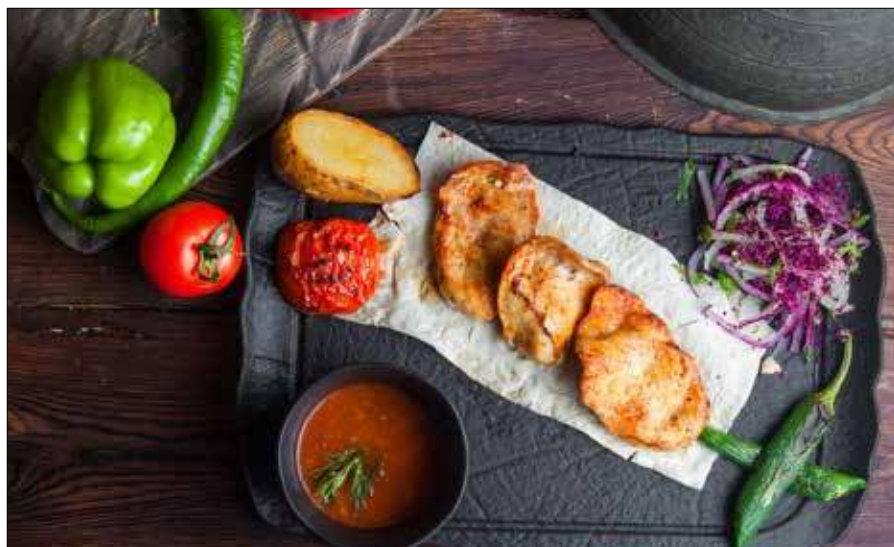
■ Fot. Freepik

Piersi z kurczaka oczyścić z błonek, przekroić wzdłuż na cieńsze płyty i delikatnie rozbić tłuczkiem przez