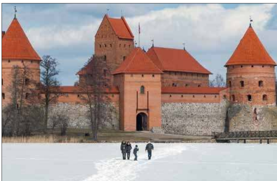
Dla jednej osoby stosunkowo bezpieczny jest lód o grubości 7-10 cm, natomiast dla grupy ludzi — od 12 cm

Trzeba szeroko opierać ręce o krawędź lodu, czołgać się poziomo i używać kolców. Po wydostaniu się nie należy wstawać od razu — bezpieczniej jest sturlać się lub przesunąć kilka metrów od przerębli, a dopiero potem wstać i wracać tą samą drogą. Po zdarzeniu należy jak najszybciej się ogrzać, zmienić mokre ubrania, a w przypadku drżenia, osłabienia, dezorientacji lub senności — wezwać pomoc. ■