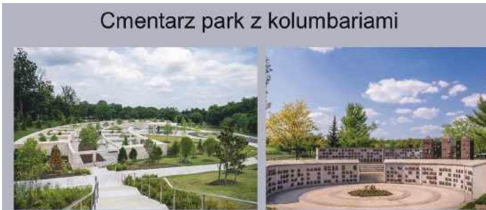
Cmentarz park z kolumbariami