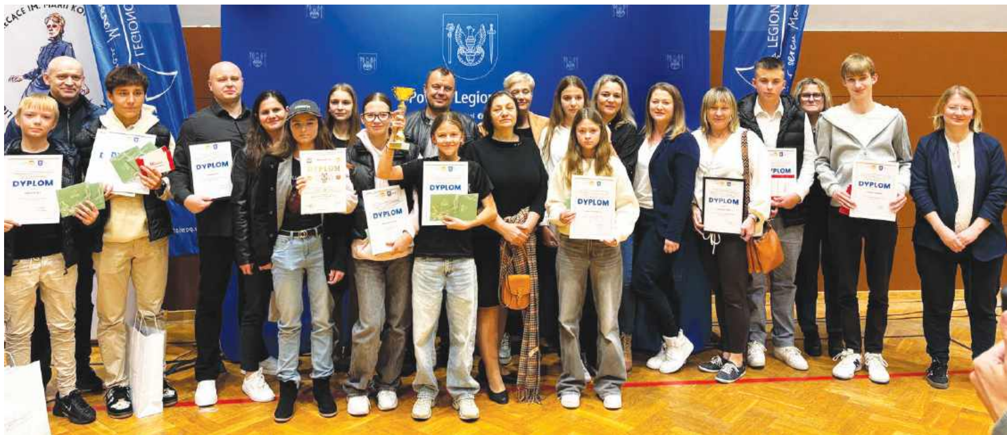
Laureaci 3. miejsca w klasyfikacji generalnej szkół podstawowych województwa mazowieckiego w kategorii Młodzież

SEROCK. Trzecie miejsce w Mazowieckich Igrzyskach Młodzieży Szkolnej!