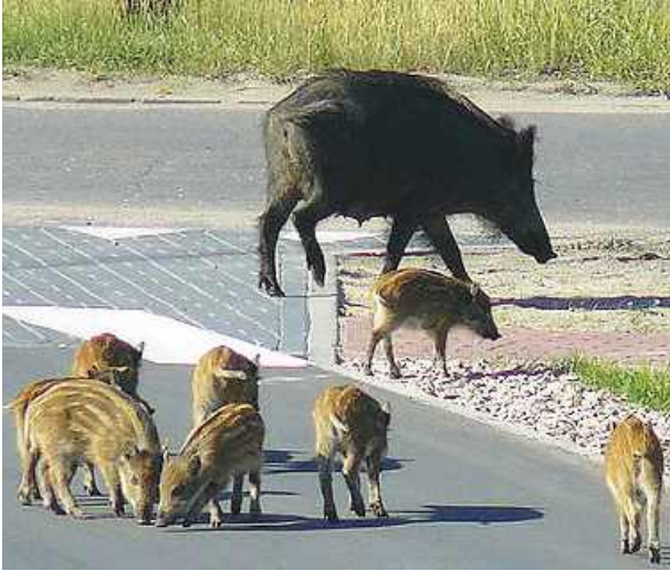
WIELISZEW. Redukcja populacji dzikich zwierząt