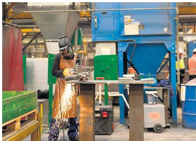
Stalowe elementy fundamentów dla morskiej farmy wiatrowej Baltica 2 powstają w zakładach produkcyjnych w Polsce.

Local content oznacza, że część wydatków na inwestycje w energetyce zostaje w kraju, trafiając do rodzimych przedsiębiorstw, które biorą udział w realizacji projektów. PGE dostrzega wśród polskich firm kompetencje, wykwalifikowaną kadrę oraz odpowiedni potencjał produkcyjny niezbędne do rozwoju morskiej energetyki wiatrowej na Bałtyku. Na każdym etapie rozwoju projektów offshore wind PGE korzysta z potencjału krajowych przedsiębiorstw, instytucji badawczych oraz wiedzy rodzimych specjalistów. W projektach morskich farm wiatrowych Grupy PGE udział polskich podmiotów już dziś mieści się w przedziale 20-30%, a celem jest jego systematyczne zwiększanie. Jest to też cel strategiczny Grupy PGE – do 2035 roku wartość zamówień realizowanych przez krajowe podmioty w ramach wszystkich inwestycji, w tym w OZE, może przekroczyć aż 150 mld zł. Obejmuje to zarówno kontrakty na usługi budowlane i montażowe, dostawy technologii i komponentów, jak i długoterminową obsługę serwisową.