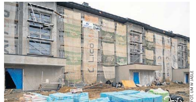
Blok za ponad 19 milionów złotych powstaje przy ulicy Krasińskiego w Jaśle

W pięcioklatkowym bloku będzie 47 mieszkań na wynajem i 23 garaże (jednostanowiskowe). Budowa powoli dobiega końca. Budynek został ocieplony. Tynk elewacyjny zostanie wykonany przy sprzyjających warunkach pogodowych. Trwa zagospodarowanie terenu wokół budynku. W łazienkach montowane są grzejniki. W mieszkaniach trwają prace malarskie oraz układane są posadzki. Na poddaszu wykonywane są wylewki. Niebawem rozpoczną się prace przy balkonach (wylewki, układanie płytek, montaż balu-