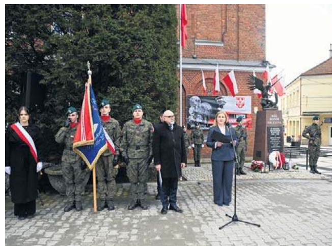
Przed pomnikiem Żołnierzów Wyklętych oddano hołd Niezłomnym