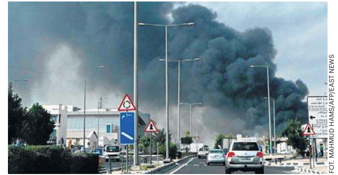
Irańskie pociski spadły także na Dohę, stolicę Kataru. W poniedziałek rano w całym mieście słychać było serię głośnych wybuchów

Kraje Zatoki Perskiej oświadczyły, że mają pełne prawo na militarną odpowiedź względem Iranu. Choć na razie przyjmują ciosy, to ta cierpliwość może się niebawem skończyć. Istnieje coraz większe prawdopodobieństwo, że Zjednoczone Emiraty Arabskie, Katar czy Arabia Saudyjska dołą-