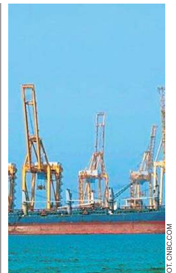
Blokada Cieśniny Ormuz wpływa na ceny ropy