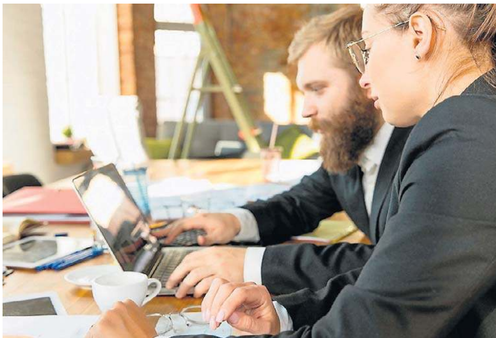
Kobiety czują się nieco bardziej przywiązane do firmy niż mężczyźni (60,9 proc. vs 55,4 proc.)

Z perspektywy pracowników lojalność to przede wszyst-