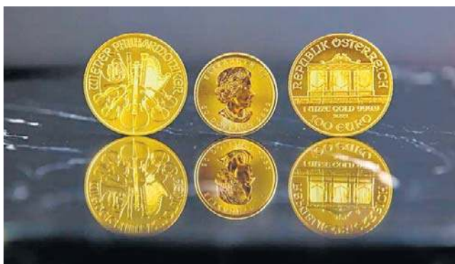
Zdaniem spółki pomimo realizacji zysków przez niektórych inwestorów to napływ nowych klientów jest bardzo silny

- W naszych oddziałach stacjonarnych, ale także w sklepie on-line obserwujemy, ogromny popyt na złoto. Mimo wysokich wahań cen, jakie ostatnio notowaliśmy, złoto pozostaje bezpieczną przystanią, bo to inwestycja na dekady. Wszyscy, którzy porównują złoto do rynku akcji czy kryptowalut, mylą rodzaje aktywów. Złoto nie jest instrumentem do krótkoterminowej spekulacji, lecz narzędziem do ochrony majątku i stabilizowania portfela w długim horyzoncie czasu. Ponad 200-procentowy wzrost sprzedaży, jaki zanotowaliśmy w styczniu, potwierdza, że Polacy coraz częściej myślą o złocie w kategoriach strategicznych - powiedział Adam Stroniawski, dyrektor zarządzający Mennicy Skarbowej w informacyjnej przesłanej Strefie Biznesu.