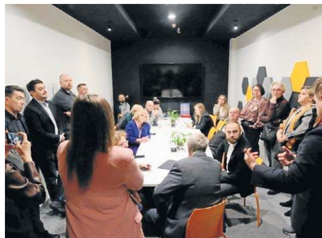
Na spotkanie przedstawicieli rzeszowskich rad osiedli w Urban Labie przyszło ok. 60 osób