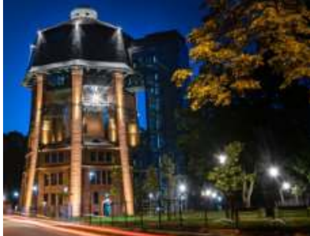
► Wieża ciśnień przy ul. Zamoyskiego