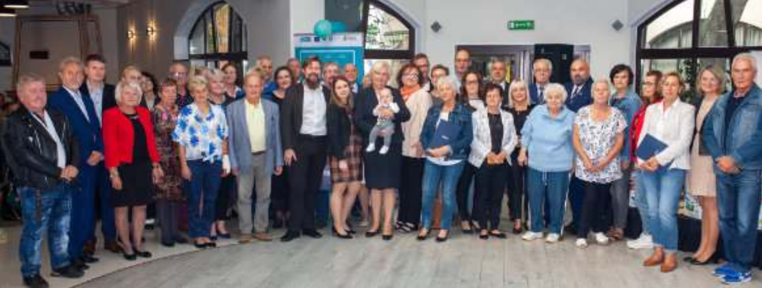
► Laureaci tegorocznej edycji konkursu