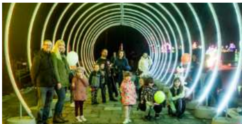
► Fot. UM Zabrze