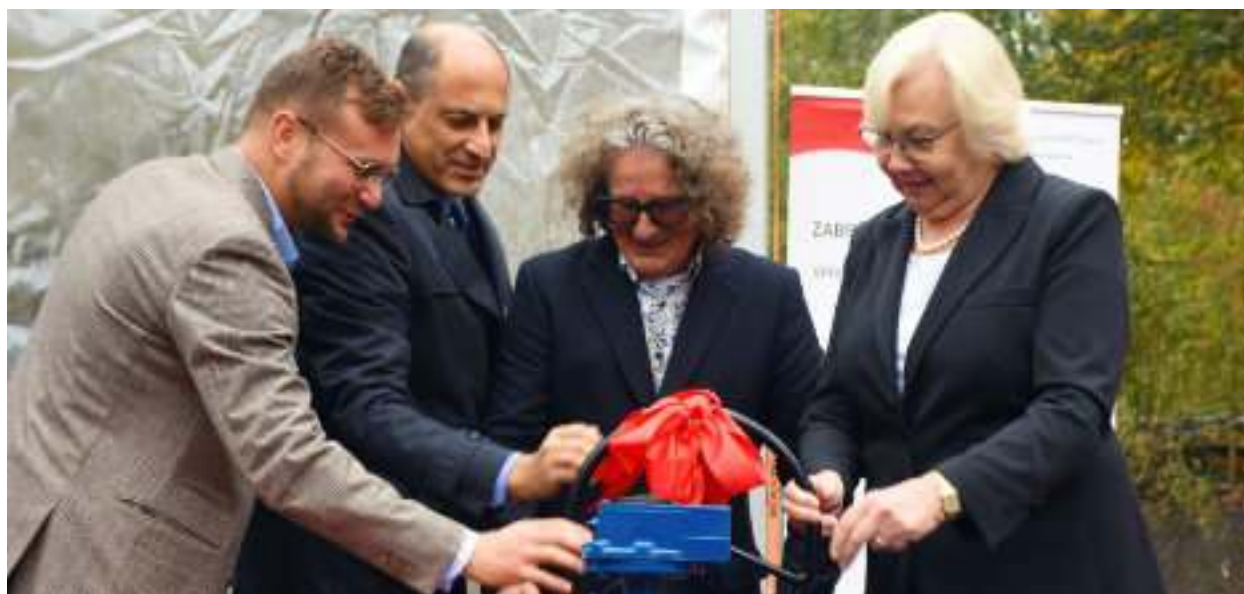
► Symboliczne zwieńczenie trwającej od kilku lat inwestycji