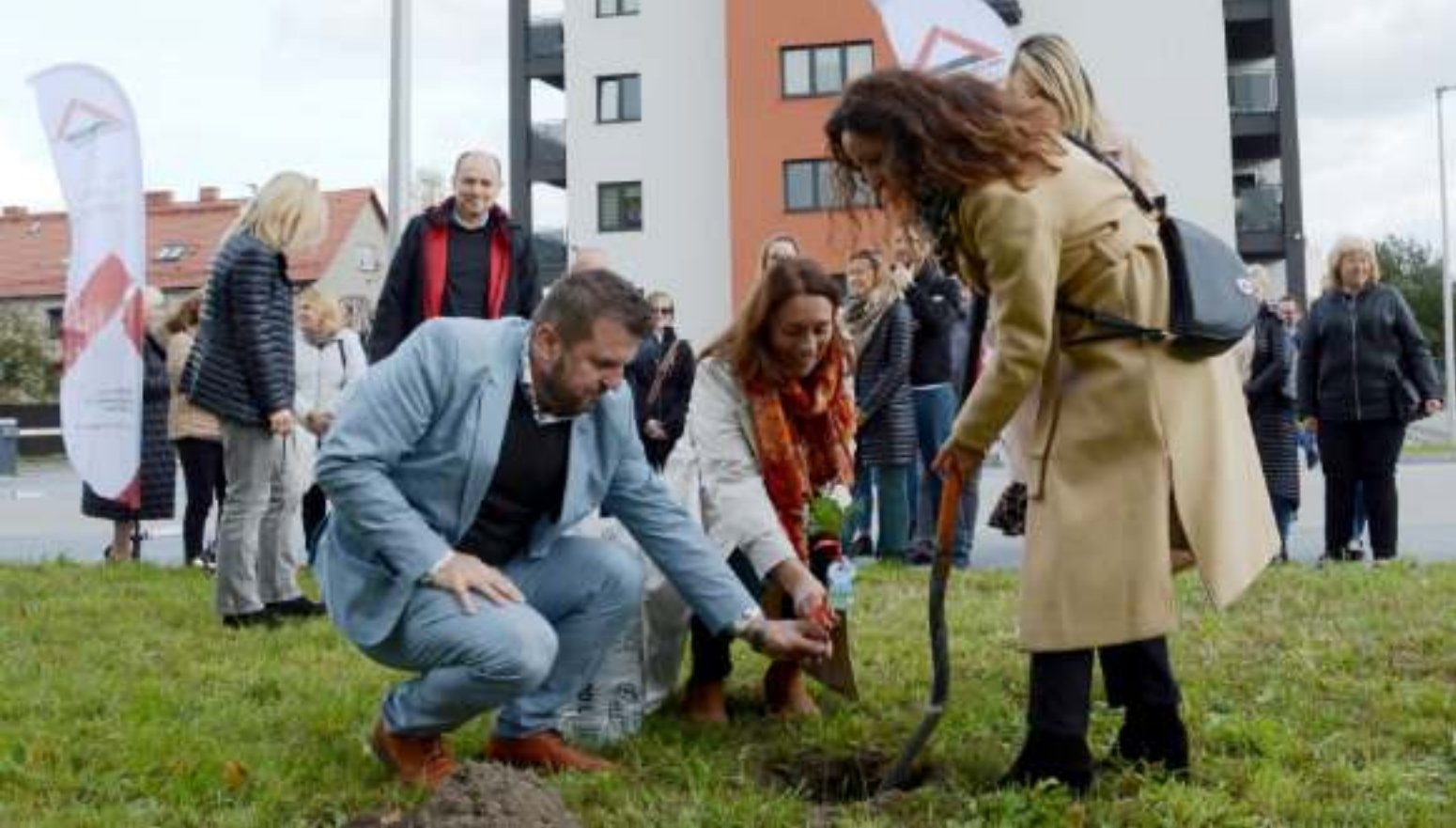
► Sadzenie drzew w okolicy nowego bloku ZBM-TBS przy ul. Żeromskiego