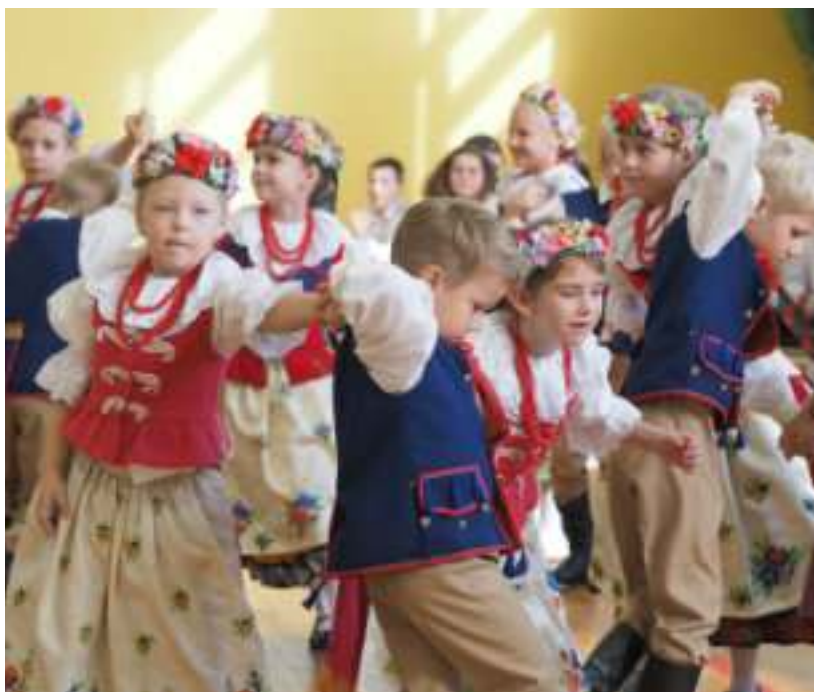
► Przygotowany przez uczniów program artystyczny