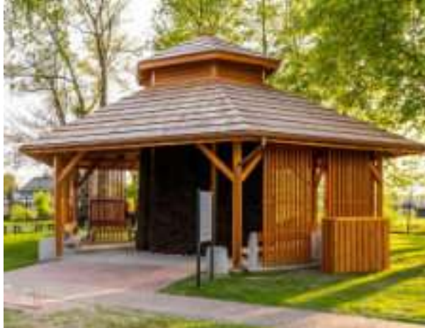
► Jedna z zabrzańskich tężni solankowych