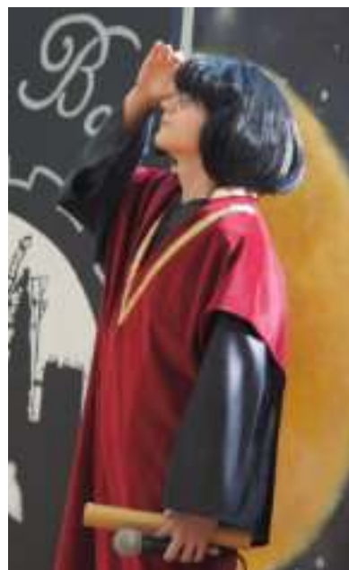
► Na obchodach nie zabrakło... Kopernika