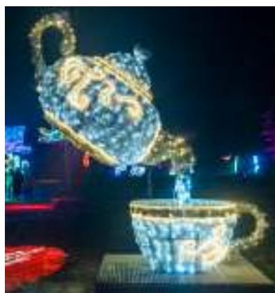
► Fot. UM Zabrze