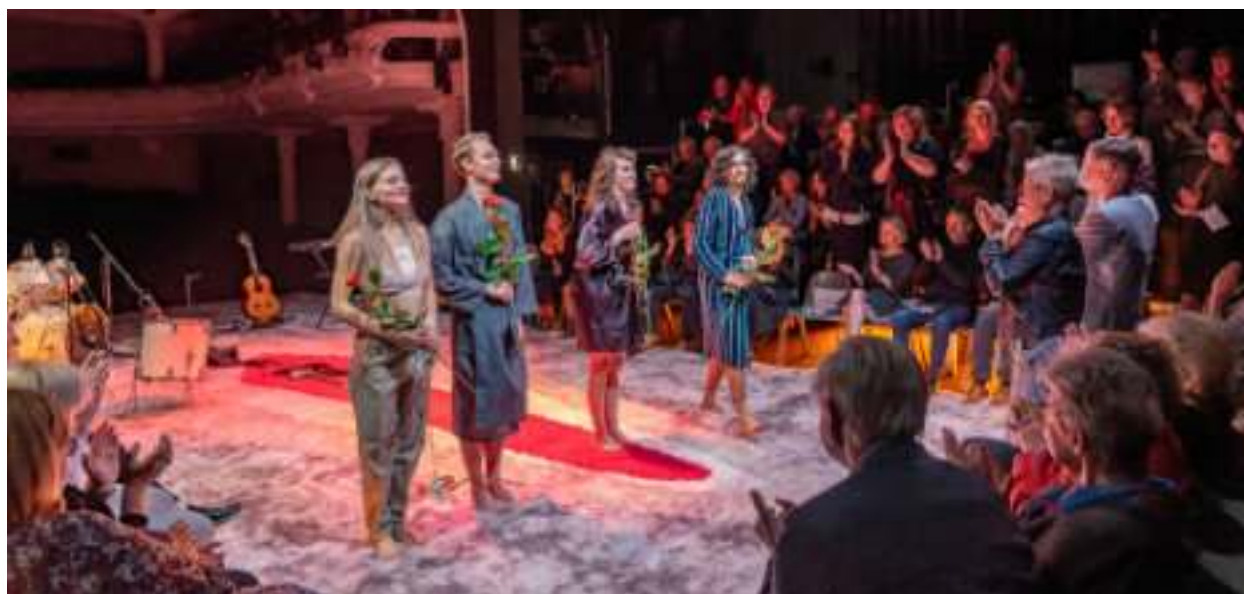
► XXII Festiwal Dramaturgii Współczesnej „Rzeczywistość przedstawiona” trwał od 15 do 22 października