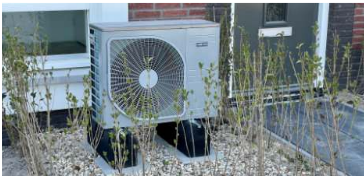
► Pompa ciepła

MOGĄ LICZYĆ NA WSPARCIE W RAMACH LICZNYCH PROJEKTÓW