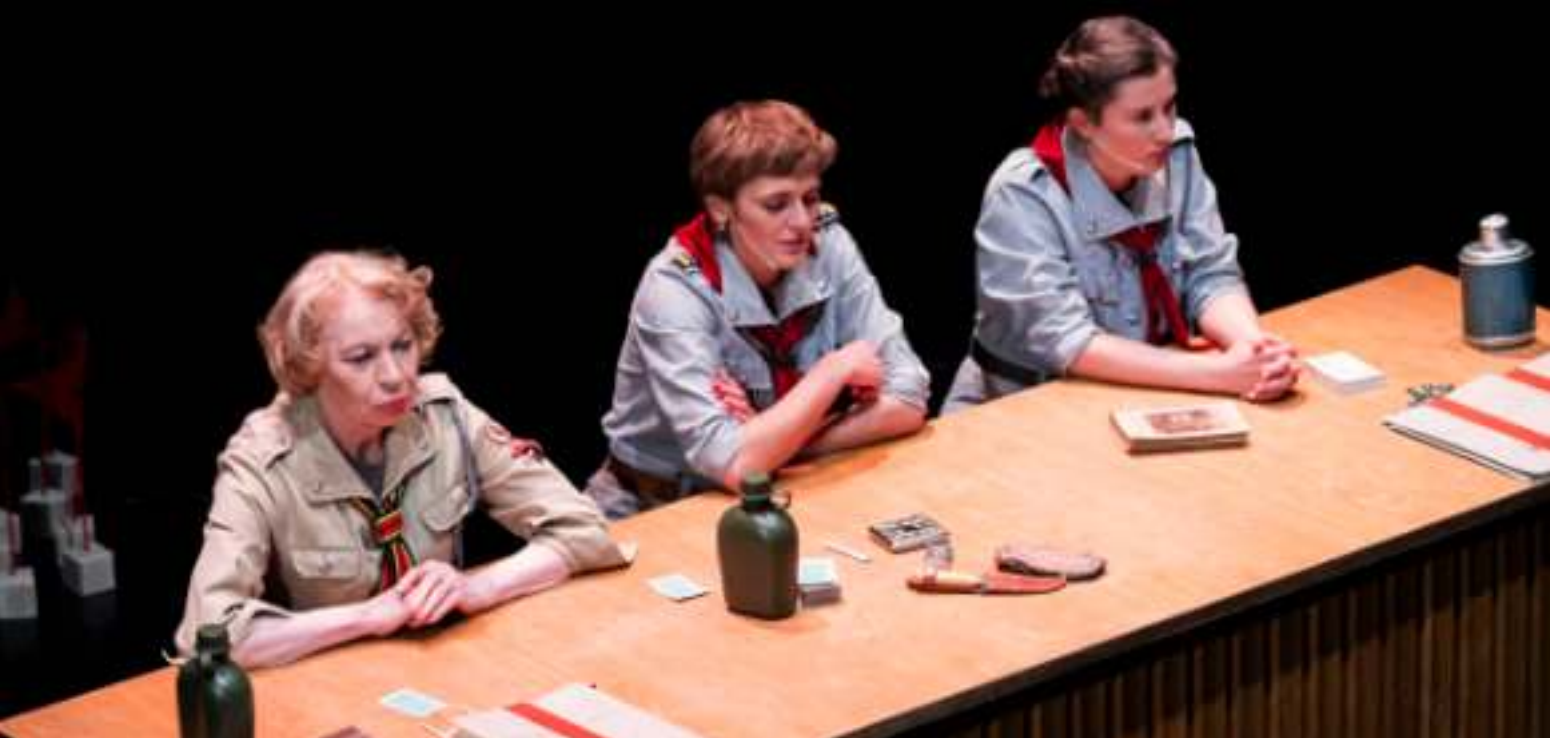
► Spektakl „Mała piętnastka. Legendy pomorskie”