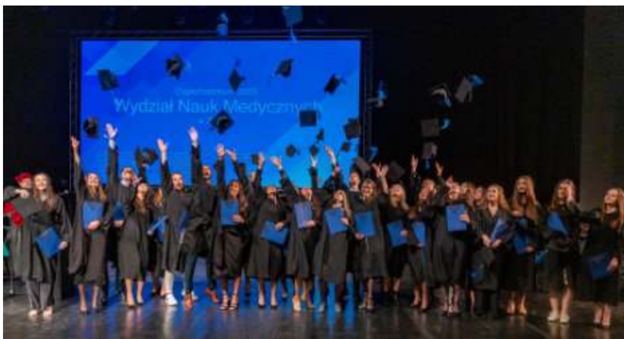
► Wyjątkowa chwila wieńcząca 6 lat niezwykle wymagających studiów

Podczas uroczystości tegoroczni absolwenci złożyli przyrzeczenie lekarskie. Wydarzenie uświetnił Akademicki Chór Śląskiego Uniwersytetu Medycznego. GOR