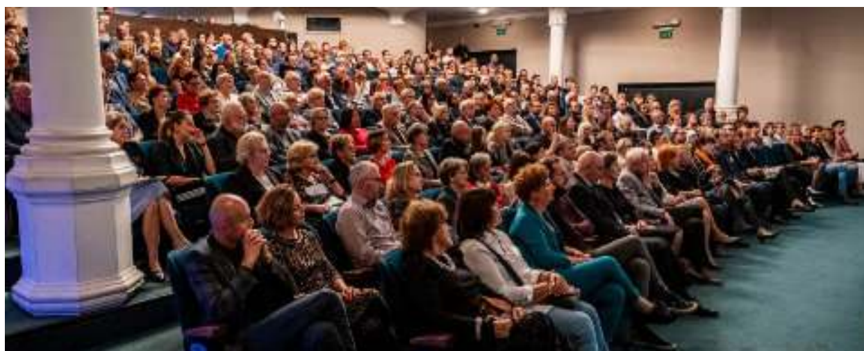
► Dopisała festiwalowa publiczność

Dziesięć spektakli, w tym siedem konkursowych, imprezy towarzyszące – w tym koncert i czytanie dramatów w wykonaniu młodzieżowych grup teatralnych – to tylko część atrakcji, jakie wpisały się w program XXII edycji Festiwalu Dramaturgii Współczesnej „Rzeczywistość przedstawiona”. Przez osiem dni nasze miasto gościło teatry z całej Polski, które w zaprezentowanych sztukach dotykały tematów trudnych, kontrowersyjnych, a często też stanowiących swoiste tabu, o którym łatwiej nam milczeć, niż o nich dyskutować.