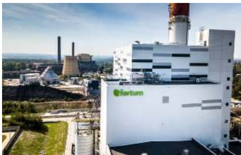
► Należąca do fińskiego koncernu Fortum Elektrociepłownia Zabrze