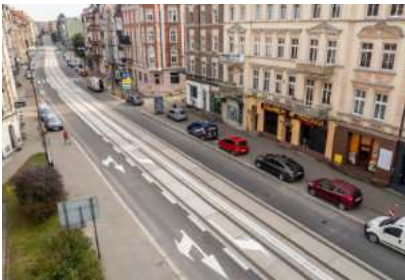
► Wyremontowany odcinek ul. Wolności w śródmieściu

- Zabrze przeżywa ostatnio wyjątkowy czas, jeśli chodzi o inwestycje drogowe. Dzieje się u nas naprawdę bardzo dużo, co cieszy, bo dzięki nim będzie się jeździło po naszym mieście wygodniej i bezpieczniej – stwierdziła podczas uroczystego podpisania umowy prezydent Zabrze Małgorzata Mańka-Szulik. – Wsłuchujemy się w głosy mieszkańców i realizujemy kolejne oczekiwane inwestycje. Jedną