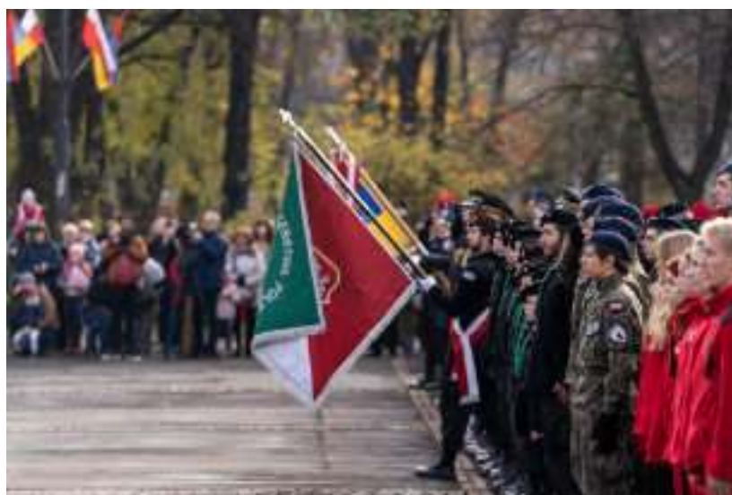
► Doroczne uroczystości na placu Warszawskim

Marzenia o wolności spełniły się wraz z klęską wszystkich trzech zaborców i zakończeniem I wojny światowej, w wyniku której Polska odzyskała niepodległość. Odbudowa państwowości, po 123 latach zaborów, była procesem złożonym. 10 listopada 1918 r. powrócił do Warszawy, zwolniony z więzienia w Magdeburgu, Józef Piłsudski. 11 listopa-