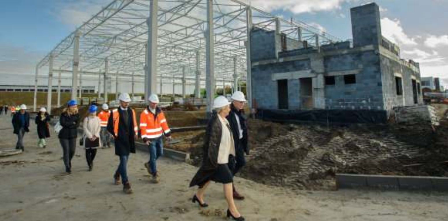
► Przedstawiciele inwestora i samorządu na placu budowy

W SPECJALNEJ STREFIE EKONOMICZNEJ WMUROWANO KAMIEŃ WĘGIELNY POD BUDOWĘ KOLEJNEGO ZAKŁADU