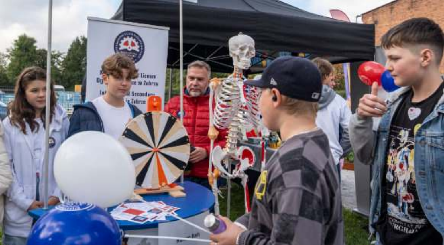
► Tegoroczna odsłona Dnia Nauki została przygotowana w przestrzeniach wokół odrestaurowanej wieży ciśnień przy ul. Zamoyskiego