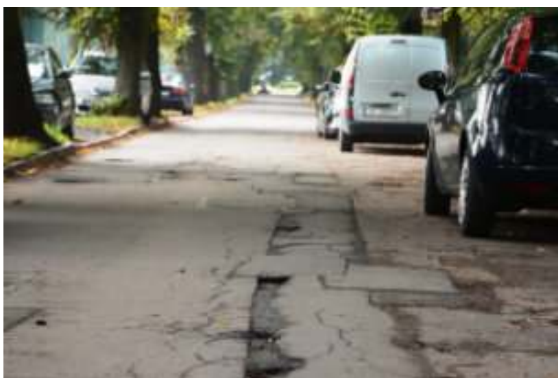
► Już niebawem takie widoki wzdłuż ul. Chłopskiej będą jedynie wspomnieniem

z nich będzie połączenie ul. Koszaka i ul. Drzymały, na wykonanie