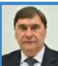
WOJCIECH SZARAMA (Prawo i Sprawiedliwość)