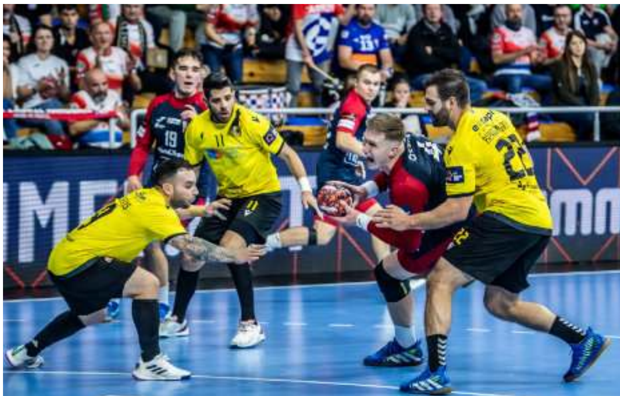
► Emocjonujące występy naszych szczypiornistów