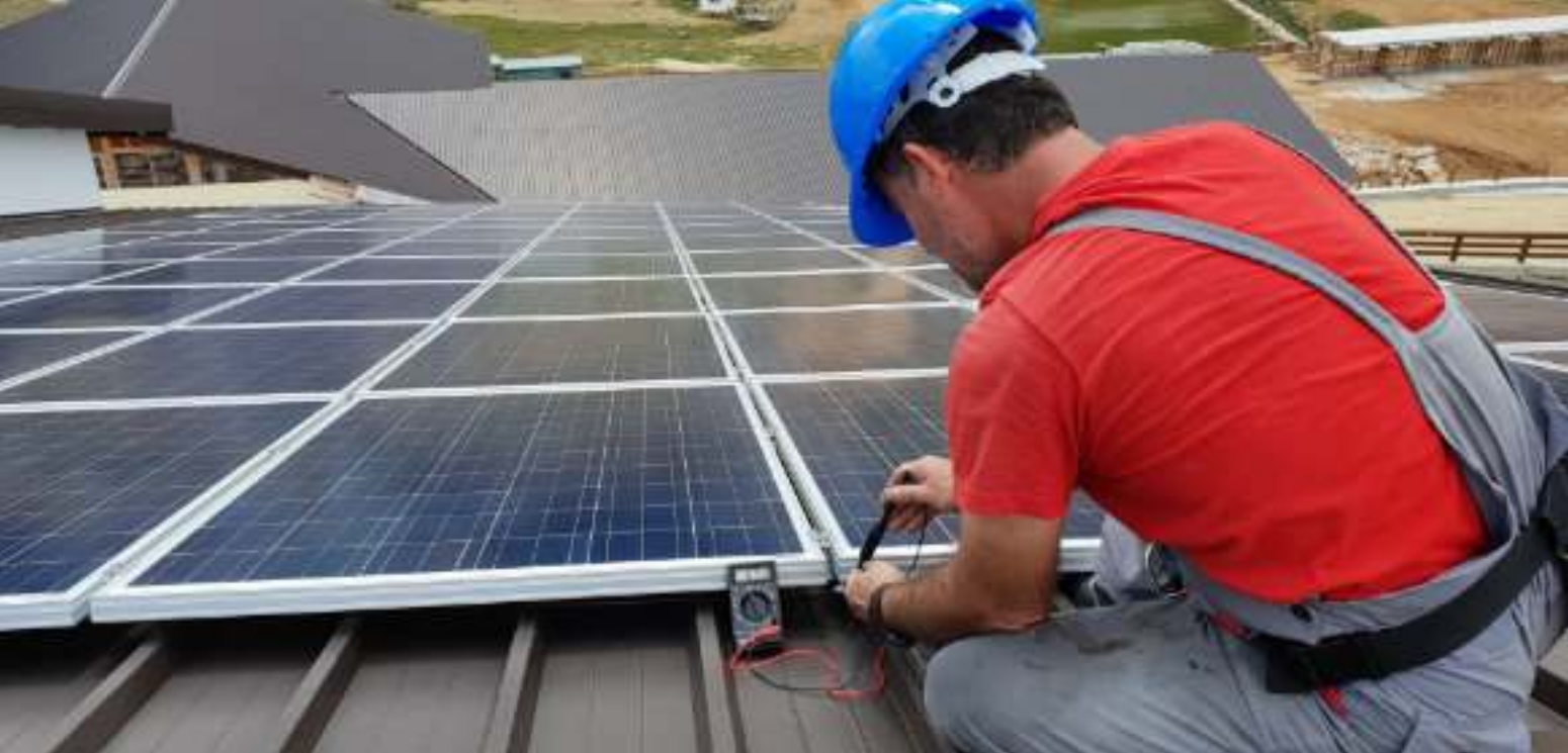
► Montaż instalacji fotowoltaicznej