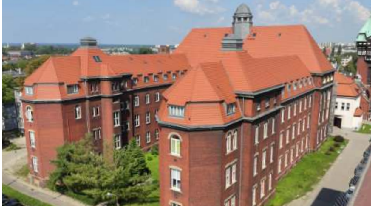
► Szpital Kliniczny nr 1 w Zabrzu