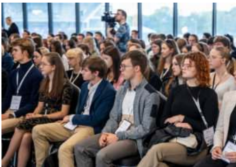
► Uczestnicy spotkania przygotowanego na Arenie Zabrze

Katarzyna Masarczyk z Zespołu Szkół nr 10 w Zabrzu zwraca uwagę, że uczestnicy konferencji mają do