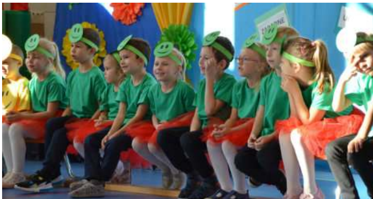
► W naszym mieście jest prawie 17 tysięcy uczniów i ponad 5 tysięcy przedszkolaków