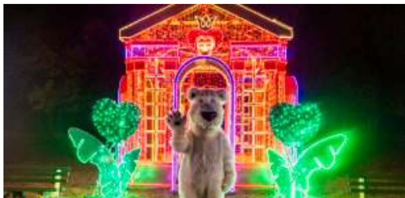
► Fot. UM Zabrze