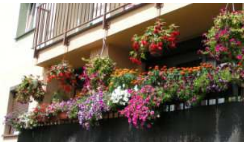
► W Zabrzu nie brakuje pasjonatów zieleni