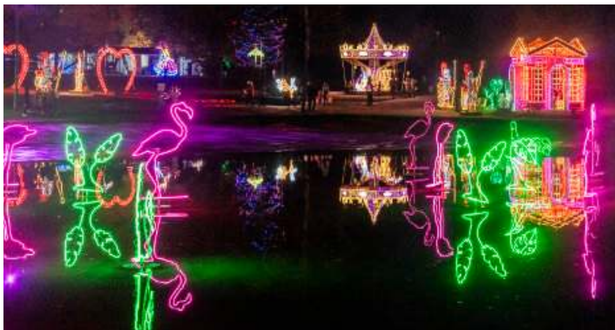
► Niezwykła gra świateł zapewnia niezapomniane wrażenia