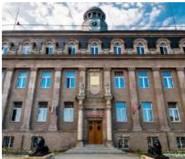
► Ratusz przy ul. Religi