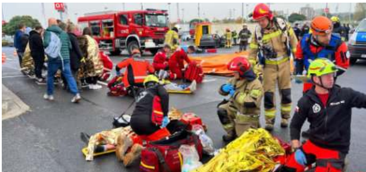
► Fot. UM Zabrze

Ćwiczenia „Karambol 2023” odbyły się w październiku na parkingu centrum handlowego M1. Sprawną współpracę trenowali strażacy, policjanci, strażnicy miejscy oraz ratownicy medyczni.