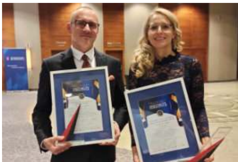
► Nagrody zostały przyznane przez miesięcznik „Przetargi Publiczne”