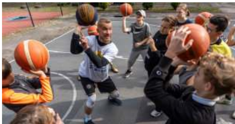
► Uczestnicy wydarzenia mogli również spróbować swoich sił w koszykówce