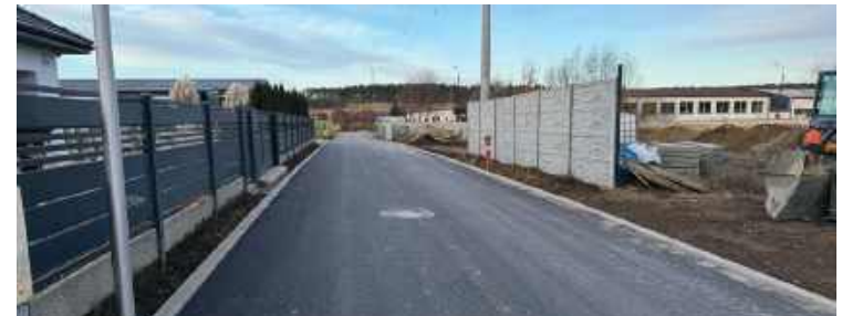
Ulica Zbożowa po remoncie.

Podobnie jak ulica Zbożowa, odcinek ten wkrótce zostanie zgłoszony do odbioru końcowego. Remont objął fragment o długości około 294 metrów, na którym ułożono nową masę