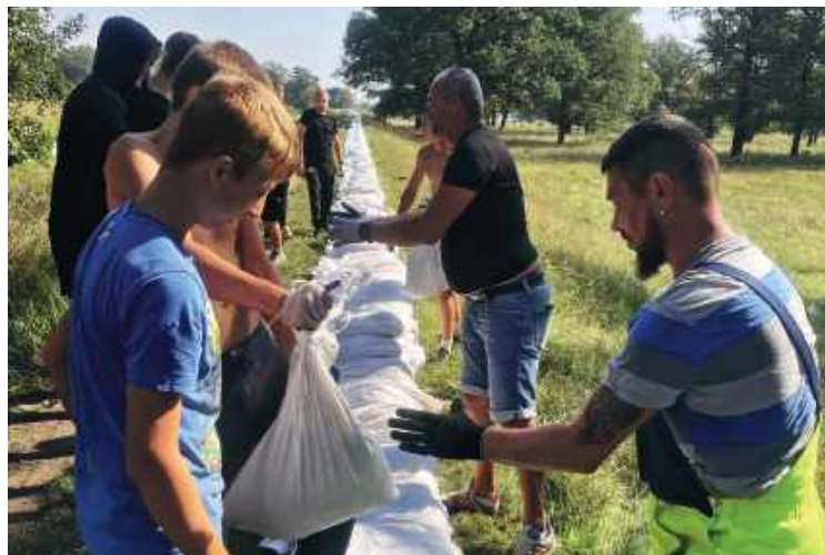
Rok temu mieszkańcy własnymi siłami budowali z worków wał przy Odrze.

Modernizacja obejmuje blisko cztery kilometry wałów. Obwałowania zostały podwyższone i poszerzone, a w ich wnętrzu zamontowano stalowe ścianki szczelne, które sięgają nawet dziewięciu metrów w głąb gruntu.