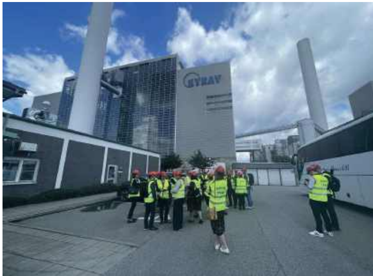
Samorządowcy z Dolnego Śląska jeżdżą oglądając spalarnie, ale nie ma zgody mieszkańców na ich budowę.