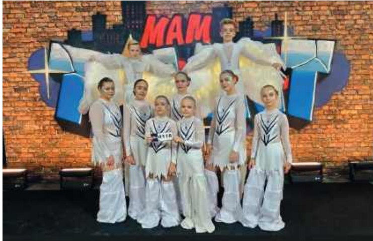
Grupa Cyrkowa Arena występująca w programie Mam Talent