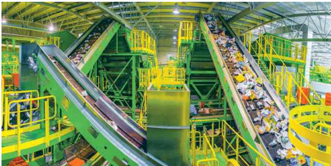
Mieszkańcy Wołowa protestowali przeciwko sortowni odpadów, a dziś sami nie chcą segregować i negują podwyżki.

W latach 2019-2024 koszty zagospodarowania odpadów wzrosły w Polsce o ponad 70%. Średni Polak płaci dziś około 366 zł rocznie. Na Dolnym Śląsku - aż