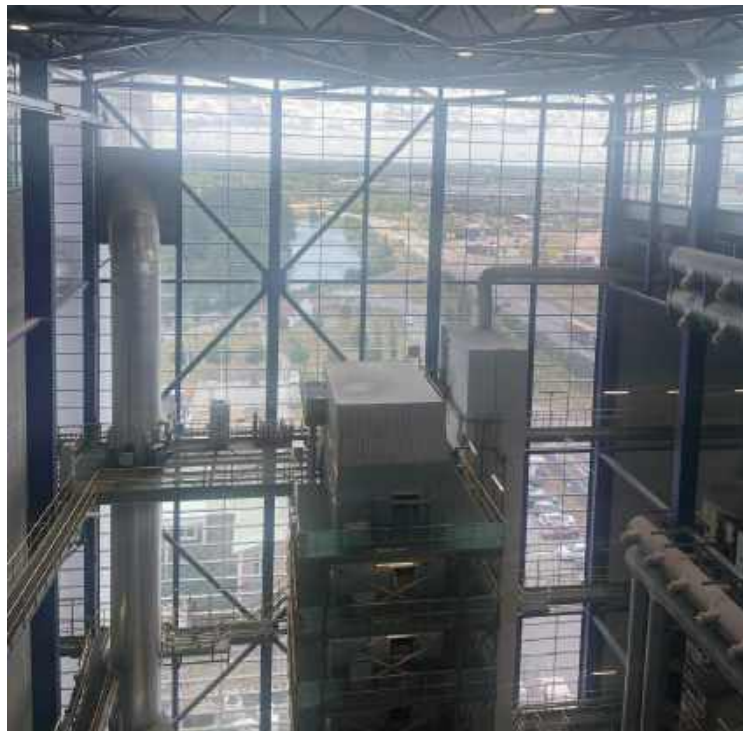
Spalarnia w Malmo w Szwecji.

Na czym miało to polegać? Sortownia to instalacja, w której odpady przechodzą przez ciąg urządzeń – przesiewaczy, separatorów, linii ręcznego