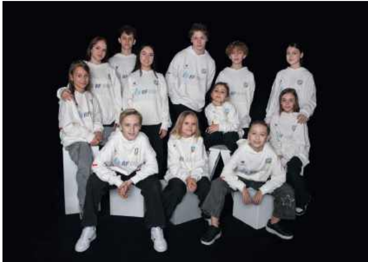
Grupa Cyrkowa Arena to miejsce dla każdego, kto chce się rozwijać

- Skąd pomysł na stworzenie dziecięcej grupy cyrkowej „ARENA” w Brzegu Dolnym?