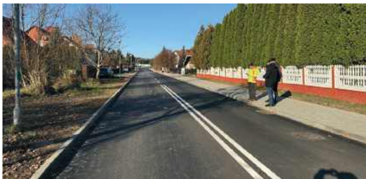
Ulica Wierzbowa wyremontowana.

Jak podkreślił burmistrz, to kolejna zakończona inwestycja drogowa w mieście, realizowana dzięki zaangażowaniu wielu osób. Podziękował również radzie miejskiej za poparcie projektu. - Ale to nie koniec! W naszym mieście znajduje się kilka inwestycji