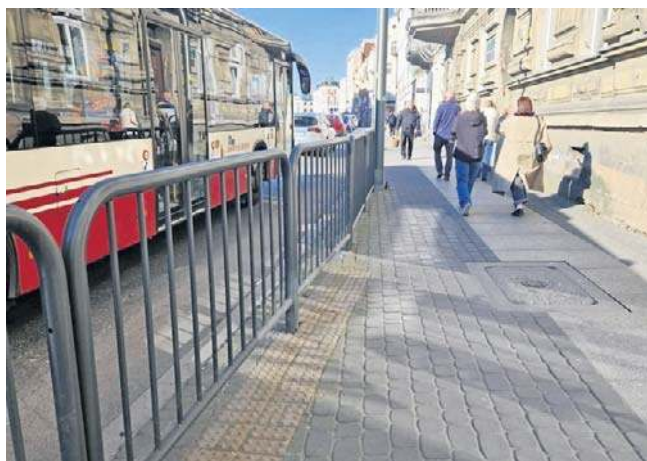
Zdaniem autorów wniosku o konsultacje, miasto podjęło decyzję bez wcześniejszego sprawdzenia jej skutków.

- Zebrałiśmy ponad 200 podpisów, czyli niemal dwukrotnie więcej niż wymagane minimum. To pokazuje, że temat jest ważny dla mieszkańców i budzi realne emocje. Odzew był bardzo pozytywny. Zarówno ze strony przechodniów, jak i przedsiębiorców z ulic Żeromskiego i Reymonta. Co istotne, część osób podpisywała się w trakcie przechodzenia przez jezdnię mimo ustawionych barier. To najlepiej