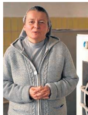
Zbiórka jest zarejestrowana na portalu: Siepomaga.pl

Obecny stan techniczny pralni jest fatalny. Stara instalacja elektryczna zagraża bezpieczeństwu użytkownika a rury wymagają natychmiastowej wymiany.