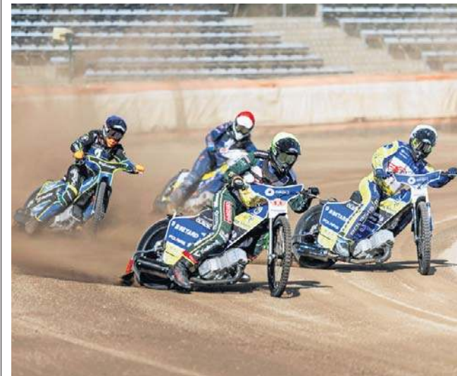
Potyczka Speedwaya z Kolejarzem trzymała w napięciu do samego końca. O wszystkim decydował ostatni bieg