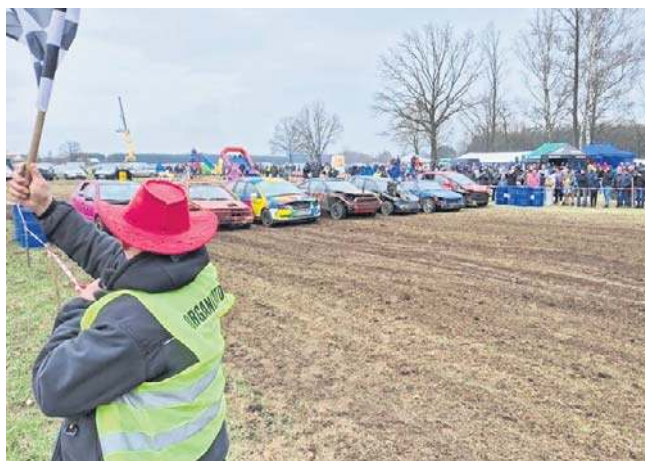
Tak wyglądały starty w pierwszym wyścigu samochodowych wraków pod Strzelcami Opolskimi.

Choć wyścigom wraków towarzyszy wszechobecny zapach spalin, ryk silników i gigantyczna dawka adrenaliny, to fundamentem tej motoryzacyjnej imprezy był znacnie