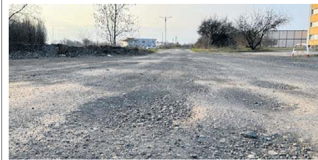
W obecnym stanie ulica przypomina tor przeszkód.

- Ze względu na dużą liczbę realizowanych obecnie zadań, procedury związane z inwestycją przy ulicy Firmowej rozpoczną się pod koniec roku - zapowiada Mariusz Chałupnik, rzecznik Miejskiego Zarządu Dróg w Opolu. ©©