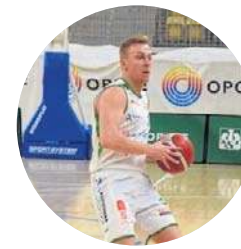
FOT. WIKTOR GUMIŃSKI