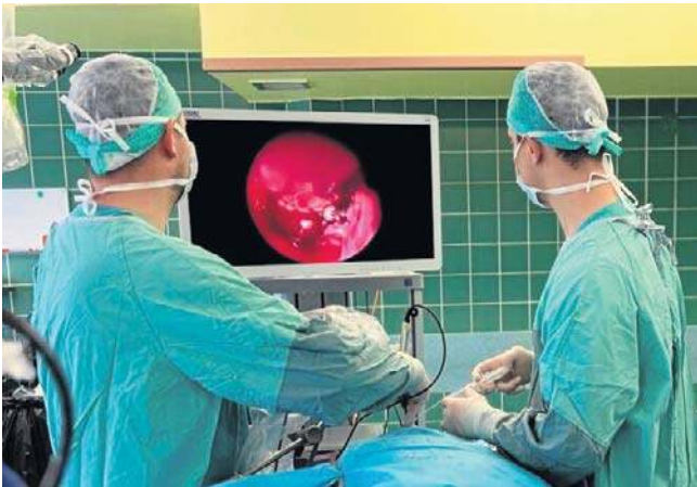
Nowy program leczenia stawia opolski szpital w medycznej czołówce w zakresie chirurgii podstawy czaszki.

Nowa Trybuna Opolska bok.prenumerata@polskapress.pl prenumerata.nto.pl