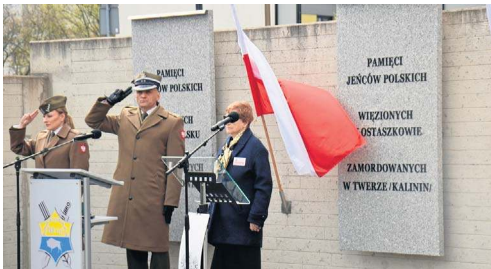
Wczoraj minęła 86. rocznica zamordowania polskich jeńców wojennych w Katyniu. Opole uczciło pamięć pomordowanych pod pomnikiem Ofiar Zbrodni Katyńskiej.

Część oficjalna przy pomniku rozpoczęła się od odśpiewania hymnu państwowego oraz podniesienia flagi na maszt. W wydarzeniu uczestniczyli przedstawiciele Stowarzyszenia Rodzin Katyńskich w Opolu, władze samorządowe, służby mundurowe, poczty sztandarowe oraz mieszkańcy.