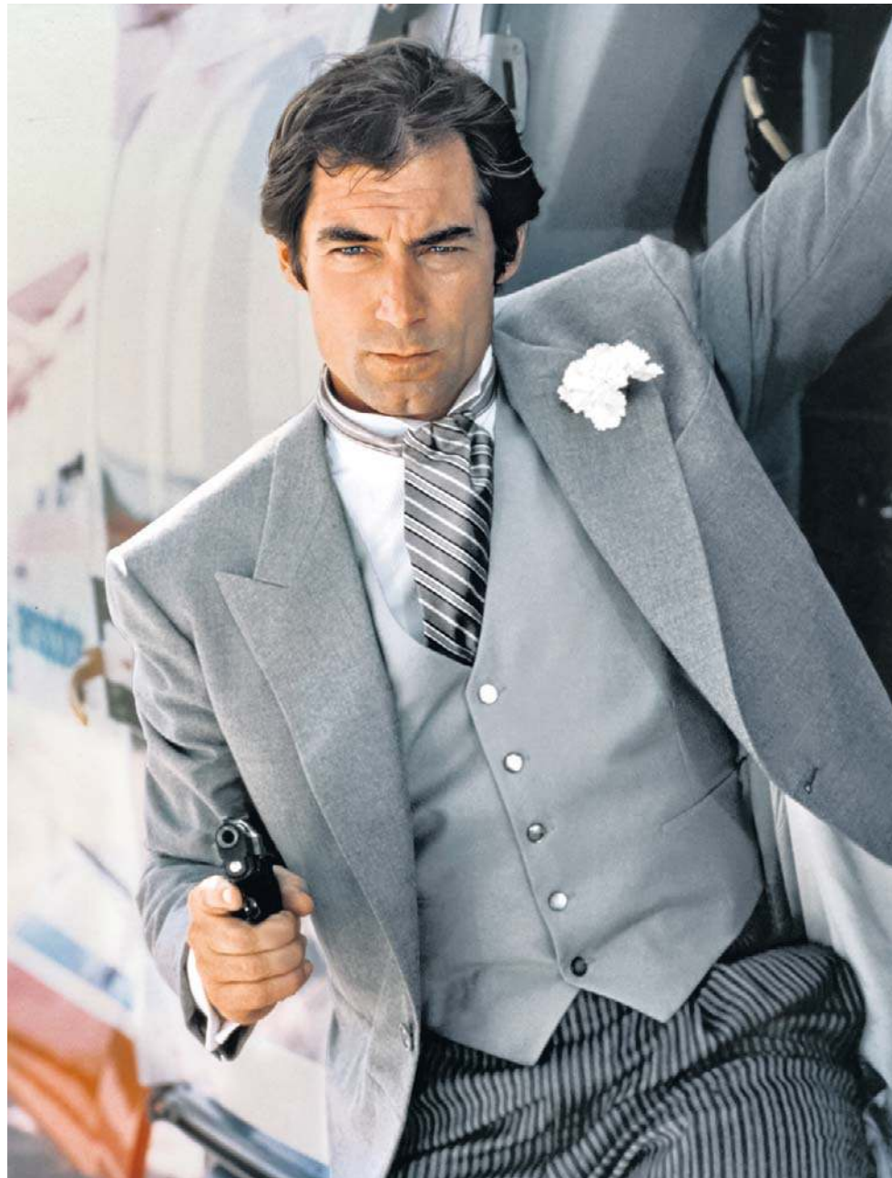
Timothy Dalton nie chciał grać Jamesa Bonda w latach 70. Poczekał ponad dekadę, wcześniej wcielając się w pana Rochesterą w serialu BBC „Jane Eyre”

Kariera Timothy'ego Daltona przed Bondem potoczyła się tak, że właściwie mało kto wiedział, jak naprawdę wygląda. Zadebiutował, mając dwadzieścia lat, a potem przez kolejne dwadzieścia grał role głównie w filmach historycznych czy kostiumowych. Ostatnio dużo mówiło się o „Wichrowych Wzgórzach” Emerald Fennell, a przecież