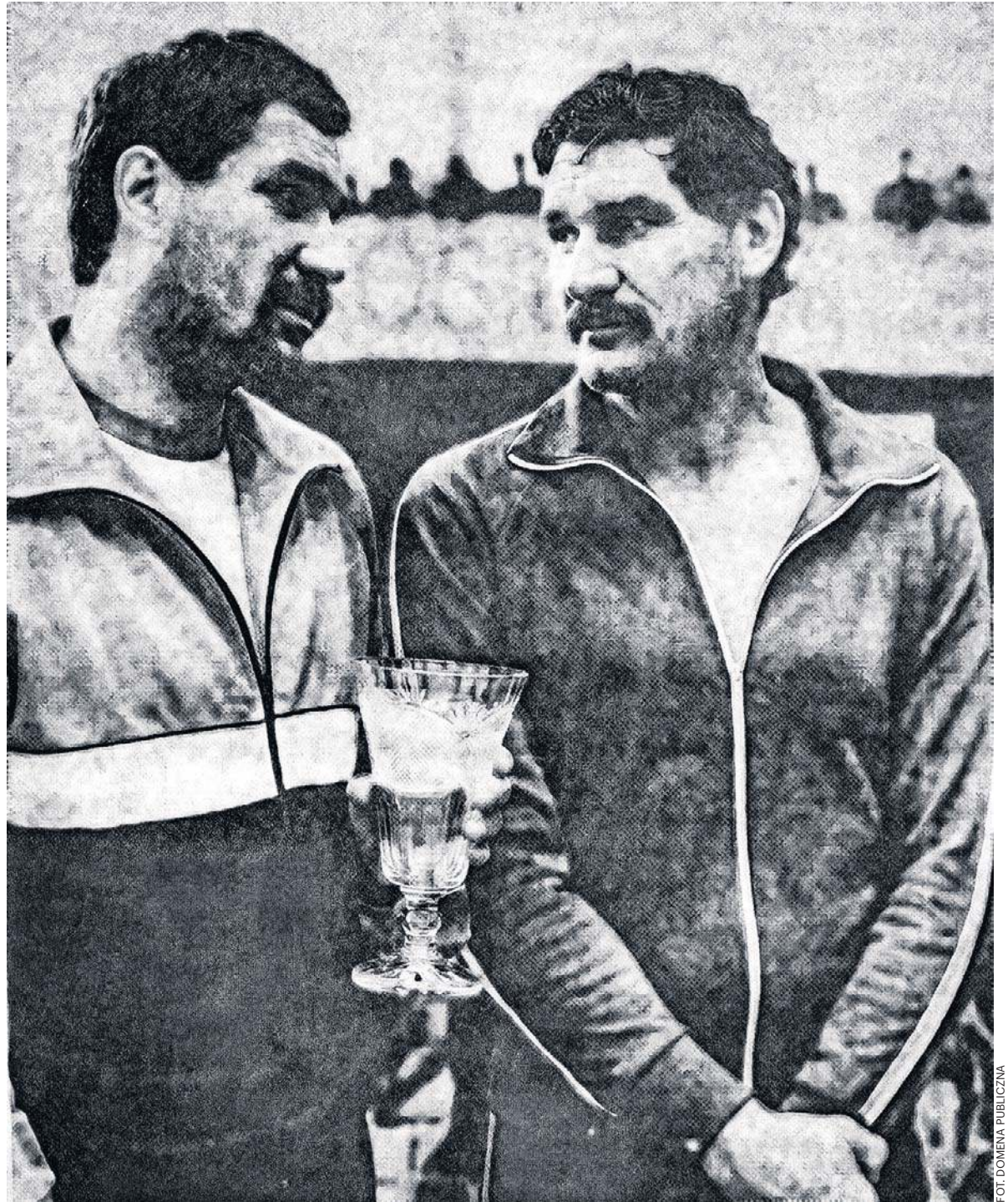
Pięściarstwo było ich pasją. Choć trafili do niego dość późno, szybko nadrobili zaległości i zaczęli dominować na krajowych ringach

Bliźniacy, jak to często w rodzinie bywa, poróżnili się o pienią-