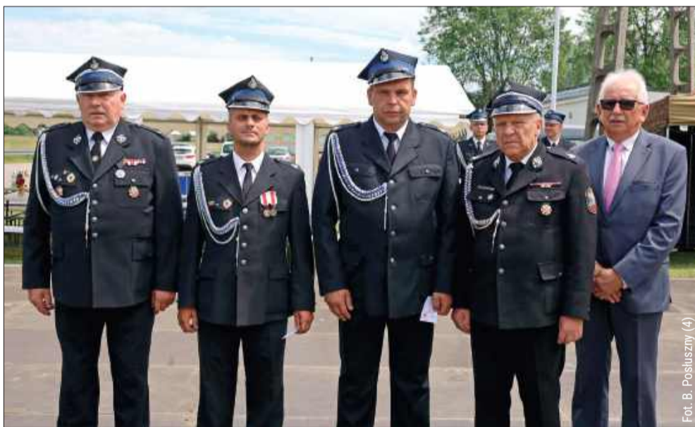
Fot. B. Posłuszny (4)