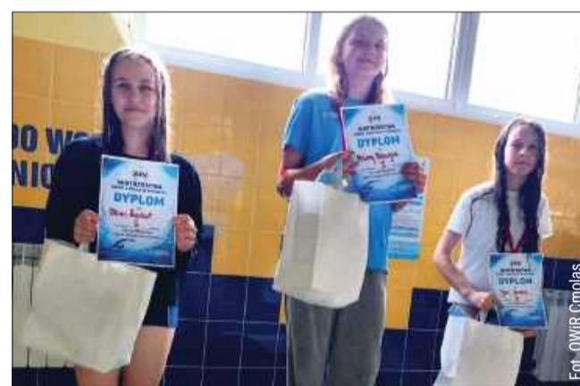
W Cmolasie odbyły się kolejne Mistrzostwa Gminy w Pływaniu.

Rywalizację najstarszych roczników na tym dystansie zdominowali reprezentanci klas