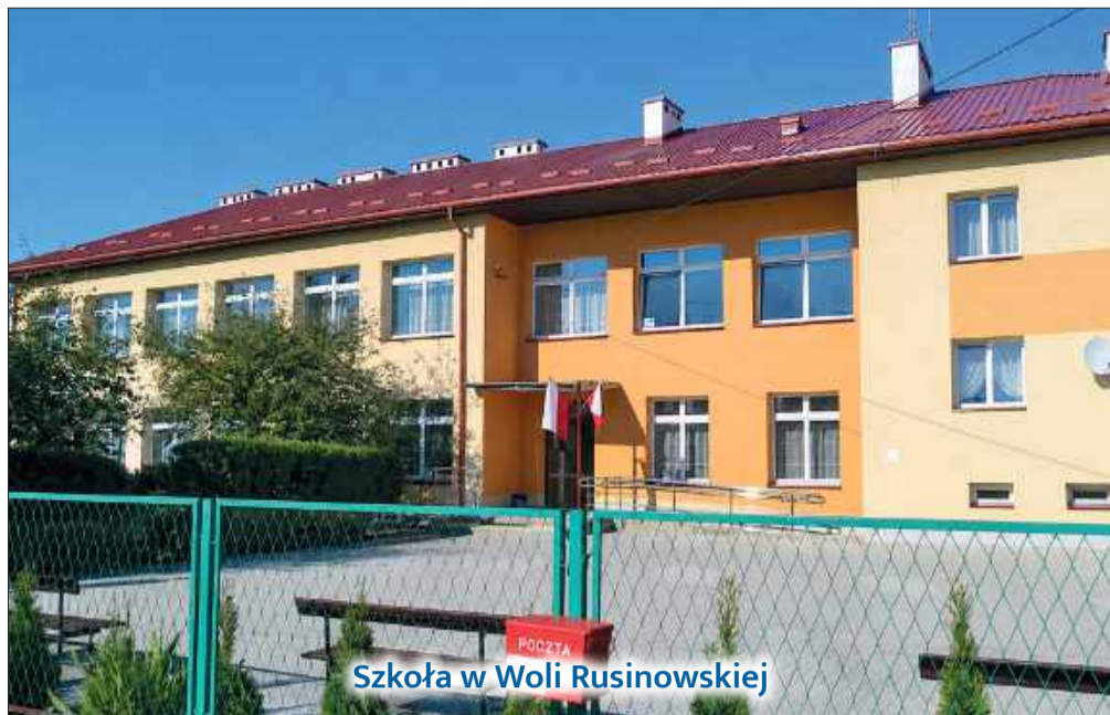
Szkoła w Woli Rusinowskiej