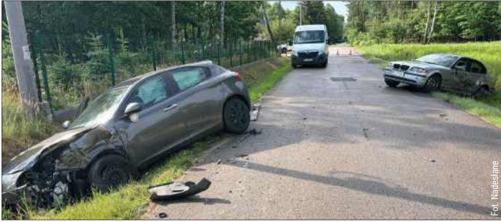
Oba pojazdy po zderzeniu wylądowały w rowie.