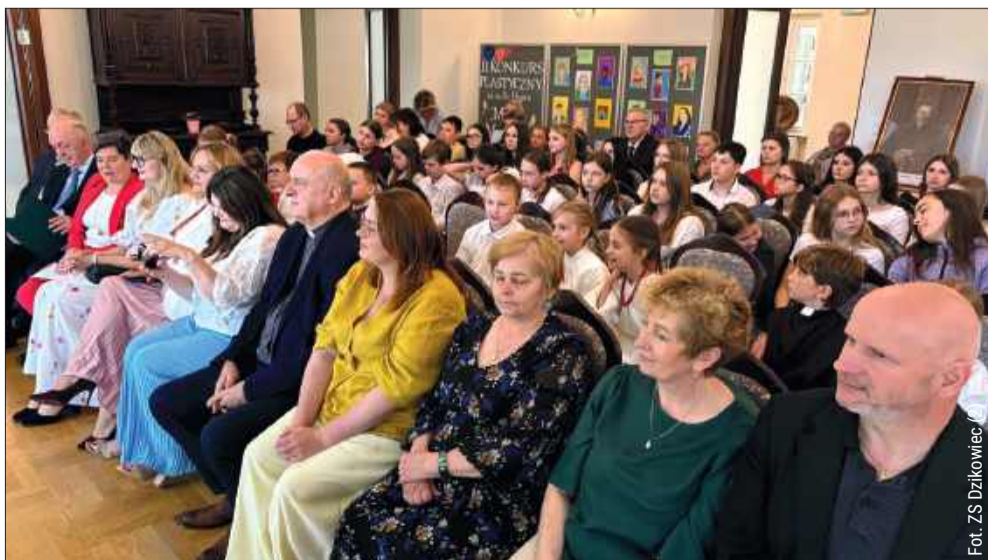
Na gali finałowej nie zabrakło widzów.