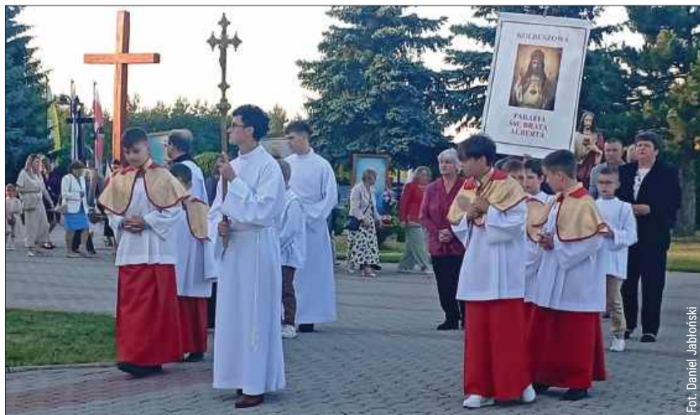
W uroczystościach licznie wzięli udział wierni.

Dla parafii św. Brata Alberta był to doskonały, pełen wzruszeń moment, by podsumować trzy dekady istnienia. Przez te 30 lat lokalna społeczność zbudowała nie tylko piękny, fizyczny budynek kościoła, ale przede wszystkim żywą, silną wspólnotę ludzi o wielkich sercach, którzy na co dzień – wzorem swojego patrona – starają się „być dobrzy jak chleb”. bp