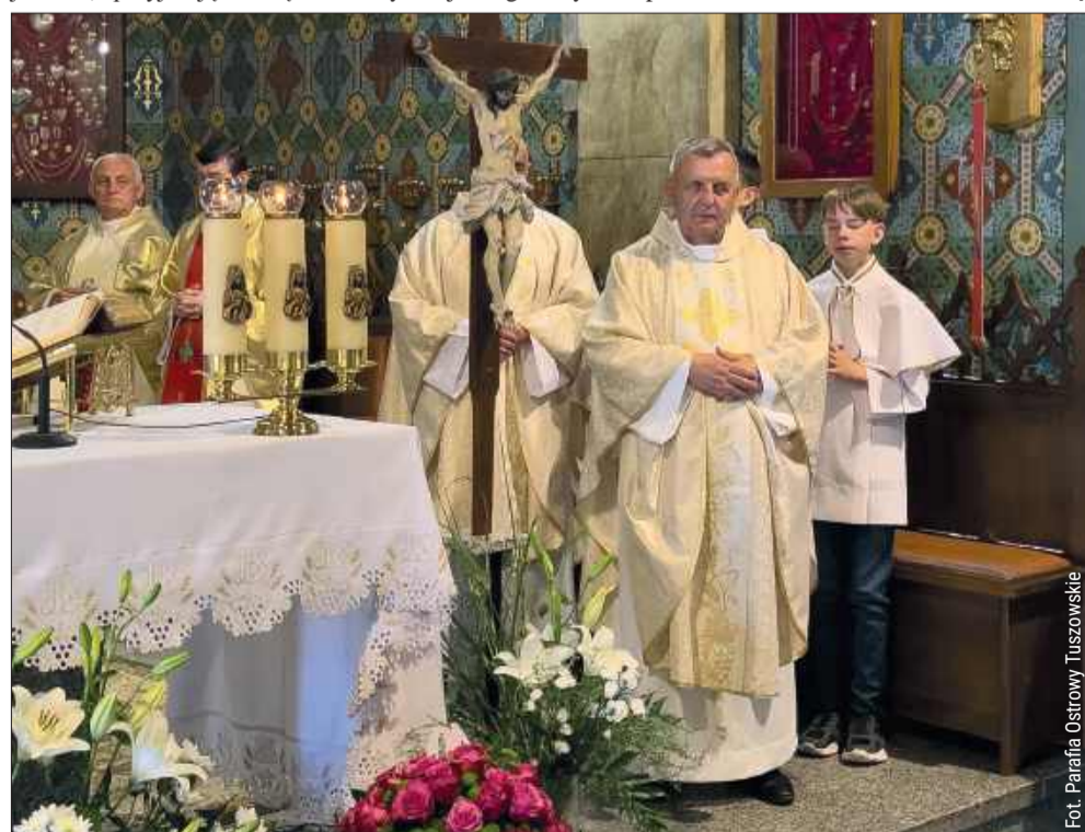
Proboszcz z Ostrow Tuszowskich świętował wyjątkowy jubileusz.

Niedzielną liturgia była przepelniona wdzięcznością. W imieniu całej wspólnoty parafialnej, przedstawiciele różnych grup, organizacji oraz najmłodszy mieszkańcy złożyli swojemu proboszczowi serdeczne podziękowania. W ciepłych słowach dziękowano za tysiące odprawionych mszy świętych, udzielone sakramenty, wygłoszone homilie, a przede wszystkim za ludzką życzliwość, duchowe wsparcie w trudnych chwilach i codzienne budowanie silnej wspólnoty. bp