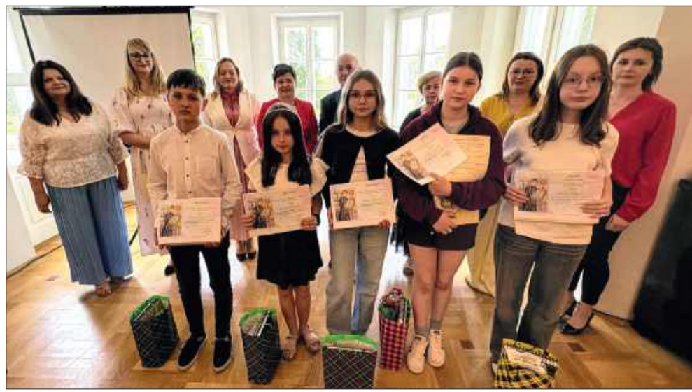
Najlepsi uczniowie zostali nagrodzeni.