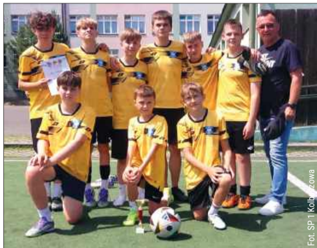
Reprezentanci Szkoły Podstawowej nr 1 w Kolbuszowej wygrali turniej piłkarski wśród klas szóstych i młodszych.

Najlepszą formę tego dnia zaprezentowali podopieczni Szkoły Podstawowej nr 1 w Kolbuszowej, którzy pewnie sięgnęli