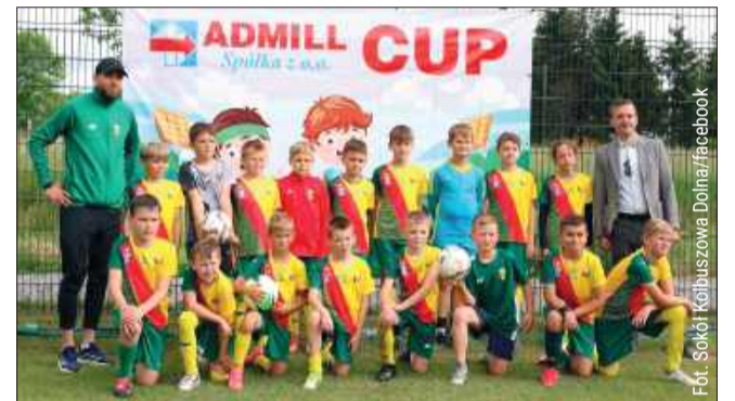
W Kolbuszowej Dolnej odbyła się kolejna edycja ADMILL CUP.