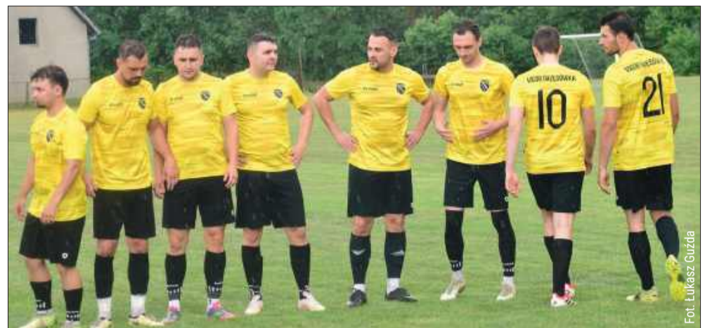
Pierwsze spotkanie barażowe o awans do A-klasy zakończyło się remisem.

- Z wyniku nie jestem zadowolony, bo uważam, że powinniśmy wygrać ten mecz. Mielśmy więcej sytuacji stuprocentowych. Dodatkowo bramkarz Złotniczanki miał niesamowity dzień, szczególnie w drugiej połowie kilkakrotnie uratował swój ze-