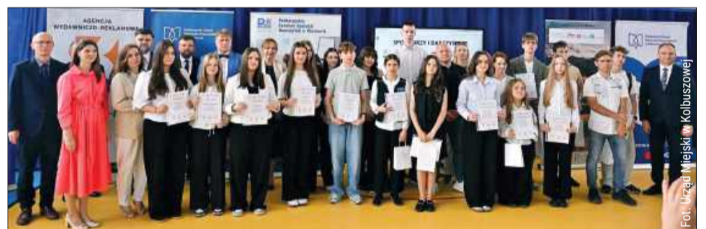
Uczniowie z całego Podkarpacia spotkali się w Weryni podczas uroczystej gali rozdania nagród.

SZKOŁY PODSTAWOWE Kategoria: Film promocyjny