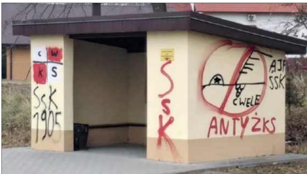
Przystanki szpecili okolicę przez bardzo długi czas. Teraz w końcu zostały odmalowane.

Zniszczenia odnotowano w kilku lokalizacjach, dlatego prace nie ograniczyły się do jednego miejsca. Część przystanków została już wyczyszczona, a tam, gdzie graffiti nie dało się usunąć w ten sposób, konieczne było odmalowanie elementów wiat.