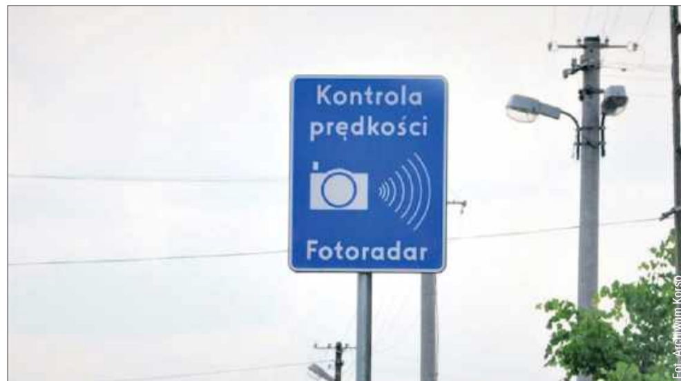
Można śmiało zaryzykować stwierdzenie, że DK9 została usiana wieloma urządzeniami kontrolującymi prędkość.

Zaledwie kilka kilometrów dalej, w Majdanie Królewskim, czeka kolejny tradycyjny fotoradar, który od lat pilnuje bez-