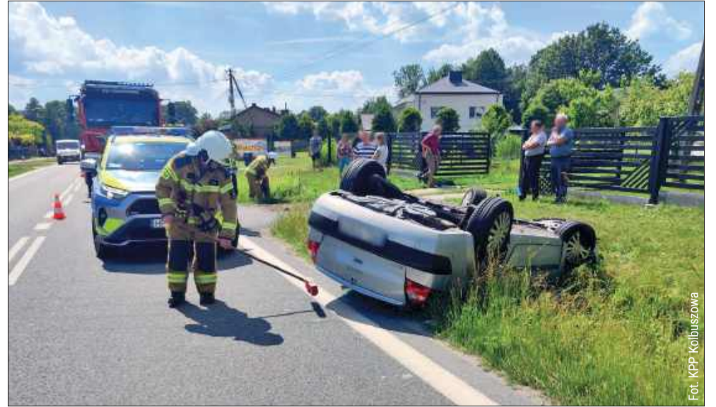
Na szczęście nikt nie odniósł obrażeń.

Z powodu nawalnego deszczu podczas zawodów sportowo-pożarniczych, odbywających się w niedzielę na stadionie miejskim w Kolbuszowej, odwołano jedną z konkurencji - sztafetę. Linie wyznaczone wapnem zostały zmyte przez ulewę. W trakcie zawodów niektóre jednostki OSP uczestniczące w rywalizacji wyjeżdżały także do zdarzeń na terenie gminy