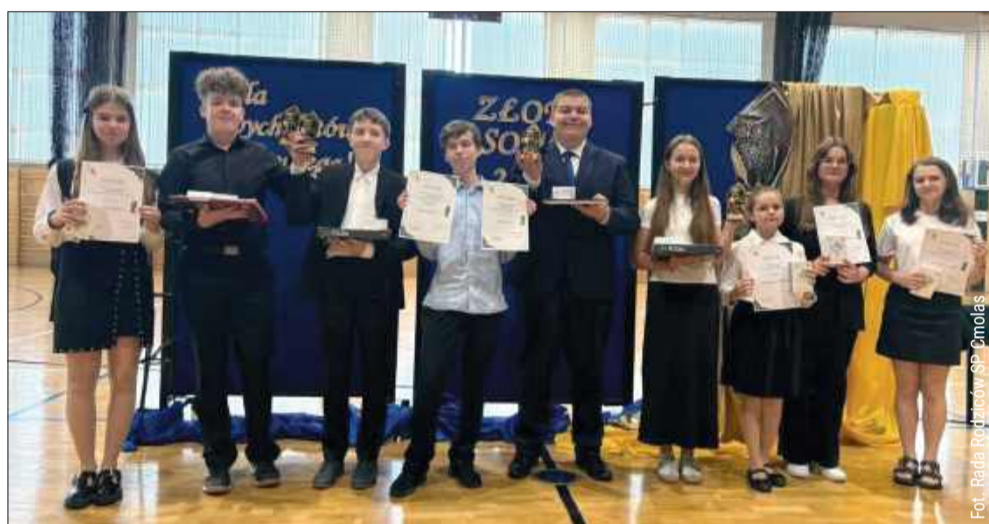
W szkole w Cmolasie rozdano wyjątkowe nagrody.