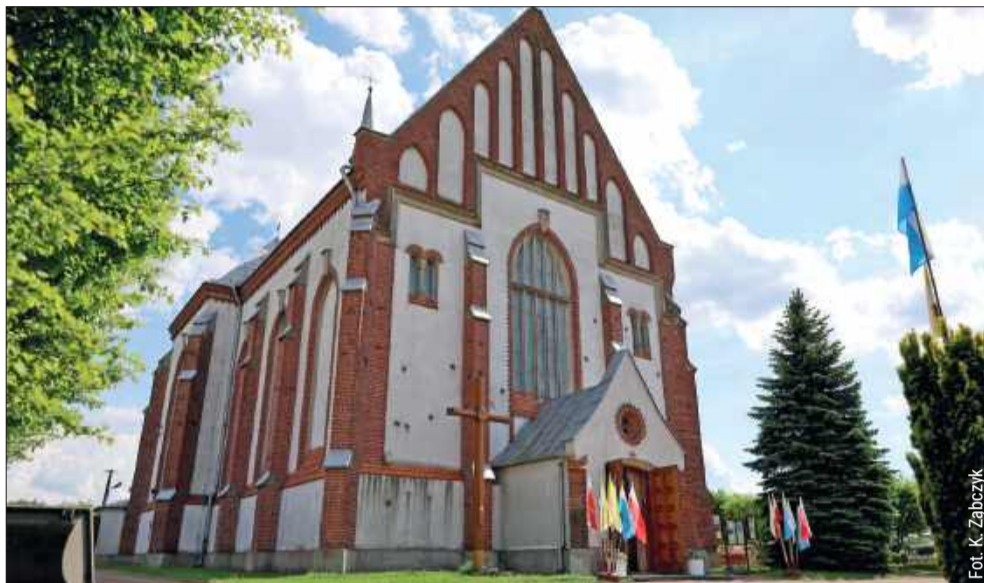
Misje Święte w parafii Kupno – to będzie czas odnowy i refleksji.

Organizatorzy proszą wierznych o dostosowanie codziennych obowiązków tak, by móc uczestniczyć w nabożeństwach oraz o modlitwę i umartwienia w intencji sukcesu misji. Zachęcają również do apostołstwa, aby każdy mógł