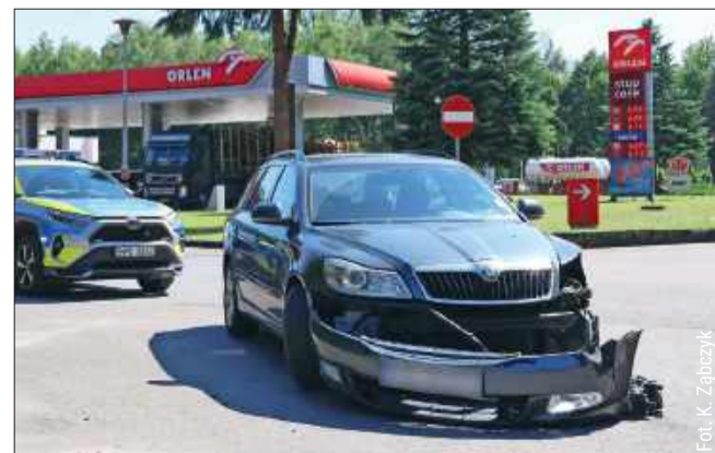
Przód osobówki został mocno uszkodzony.

Do kolizji najprawdopodobniej doszło w momencie włączania się do ruchu ze stacji paliw na drogę wojewódzka nr 875. kz