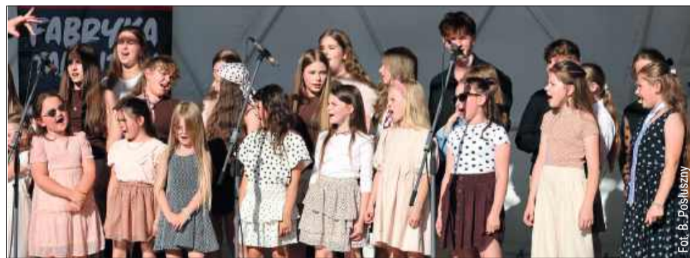
Kolbuszowskie bulwary tętniły życiem, tańcem, śpiewem i muzyką.

Partnerami tego wydarzenia byli: Fundacja na Rzecz Kultury Fizycznej i Sportu w Kolbuszowej, Miejski Dom Kultury w Kolbuszowej a także zarządy Osiedli nr 1,2 i 3. Patronat medialny nad tym wydarzeniem objęła nasza redakcja Korso Kolbuszowskie. bp