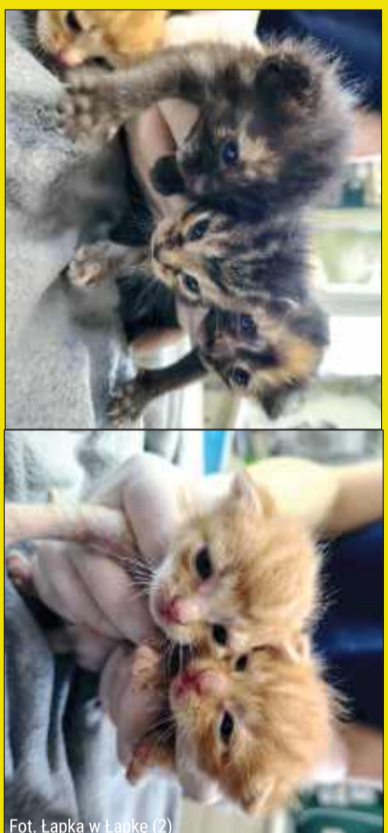
Fot. Łapka w Łapkę (2)

Malenistwa nie są jeszcze do adopcji, mają troskliwą mamusie, która jeszcze chętnie je powychowuje, ale powoli już możecie się psychicznie nastawić na adopcję. Kociaki przebywają w Kolbuszowej. Tel.: 727 167 727.