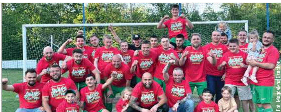
Zespół z Weryni jako jedyny na Podkarpaciu wygrał w poprzednim sezonie wszystkie mecze.