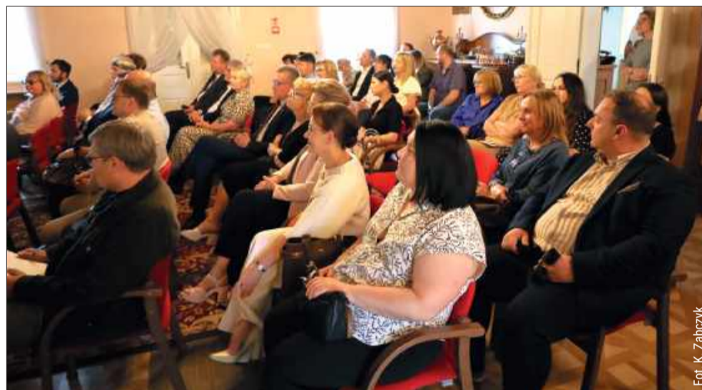
Miejscem spotkania był dwór z Brzezin.

Szpital planuje rozpoczęcie operacji robotycznych od sierpnia 2026 r., a pierwsze zabiegi mogą odbyć się już w lipcu. Poza robotem, placówka wzbogaciła się o tomograf 64-rzędowy, nowoczesną wieżę endoskopową, laser thulowy oraz systemy RTG i USG wspierane sztuczną inteligencją. Jak podkreślają przedstawiciele szpitala, nowoczesne technologie pozwolą rozwijać oddział i zapewnić pacjentom najwyższą jakość leczenia. kz