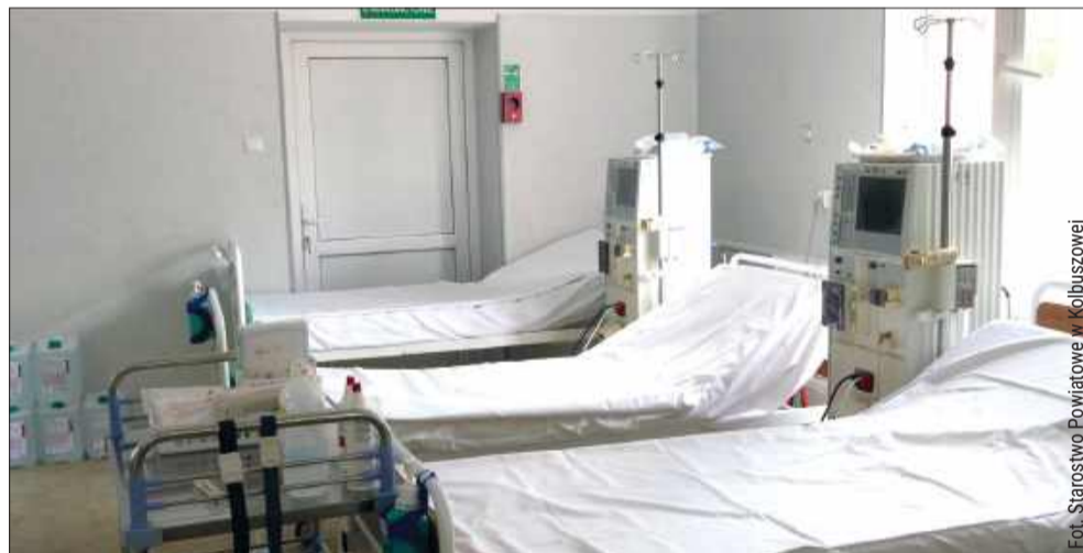
Miejsce codziennej opieki nad pacjentami wymagającymi leczenia nerkozastępczego.

Oddział mieści się w budynku przy ul. Kolejowej 3, gdzie funkcjonuje również Poradnia Nefrologiczna, udzielająca rocznie ponad 3 200 porad specjalistycznych i posiadająca własny punkt pobrania krwi. Dzięki temu pacjenci mogą kontynuować le-