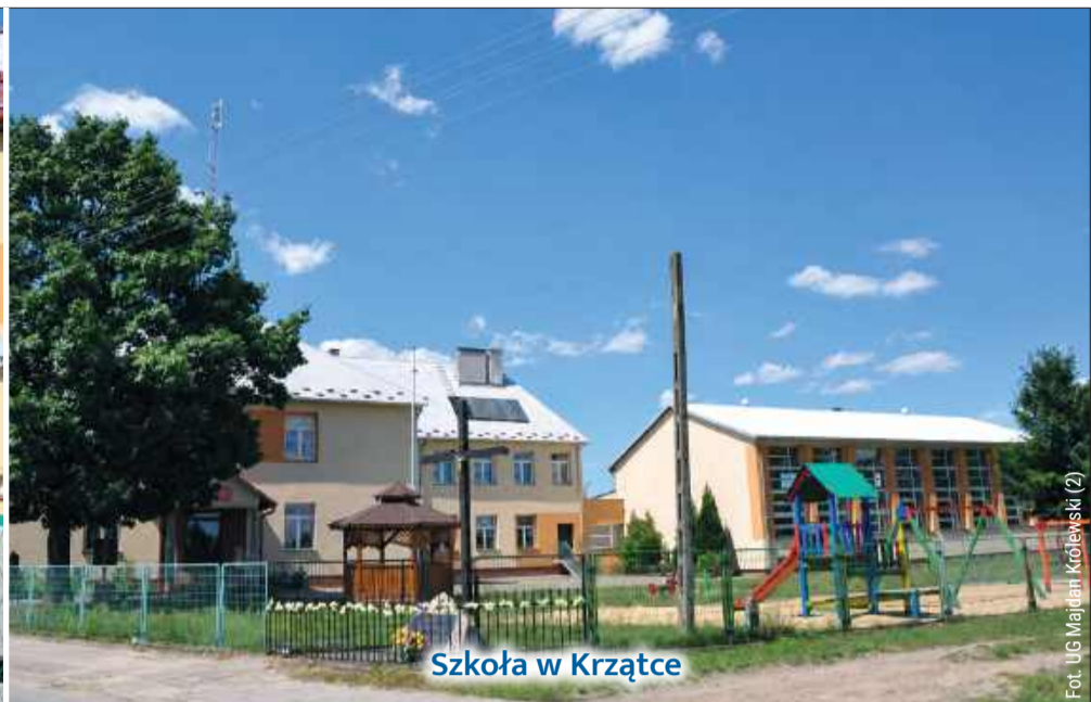
Szkoła w Krzątce