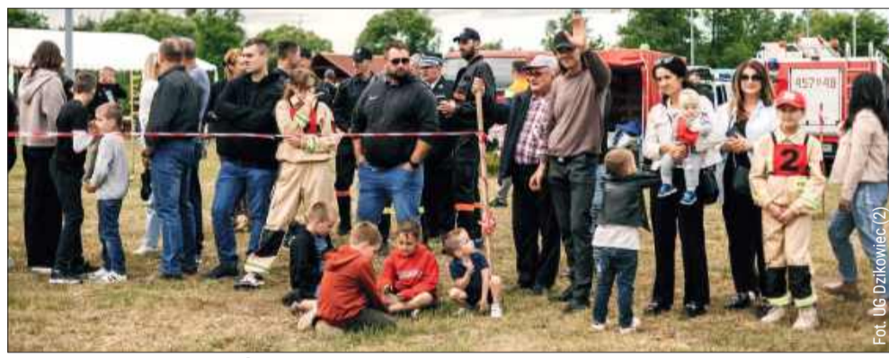
Fot. UG Dzikowiec (2)

Organizatorzy zadbali, aby dzieci nie nudziły się ani przez chwilę. Specjalna strefa dla najmłodszych obejmowała kolorowe tatuaże i fantazyjne warcokczyki, ogromne dmuchańce, a także słodkie gofry i orzeźwiający lody, które idealnie komponowały się z letnią aurą. kz