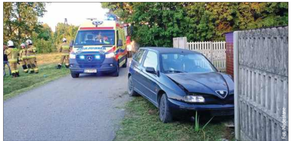
Kierowca zakończył podróż na betonowym ogrodzeniu.

Za spowodowanie kolizji mając ponad promil alkoholu (powyżej 0,5 promila) w organizmie, czyn ten traktowany jest jako przestępstwo z Kodeksu karnego. Grozi za to kara do trzech lat pozbawienia wolności, obligatoryjny zakaz prowadzenia pojazdów na minimum 3 lata oraz wysokie konsekwencje finansowe. kz