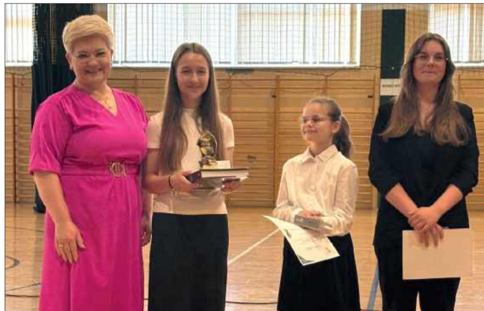
Najlepsi uczniowie zostali nagrodzeni.

Rada Rodziców oraz dyrekcja i grono pedagogiczne nie kryją dumy ze swoich podopiecznych. Czerwcową galą