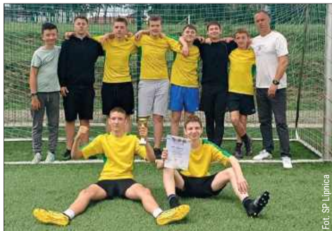
Szkoła Podstawowa w Lipnicy okazała się najlepsza wśród klas 7-8.

1. Szkoła Podstawowa w Lipnicy 2. Szkoła Podstawowa nr 2 w Kolbuszowej 3. Szkoła Podstawowa nr 1 w Kolbuszowej 4. Szkoła Podstawowa w Majdanie Królewskim 5. Szkoła Podstawowa w Woli Raniżowskiej