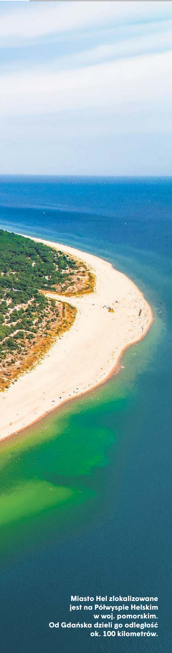
Miasto Hel zlokalizowane jest na Półwyspie Helskim w woj. pomorskim. Od Gdańska dzieli go odległość ok. 100 kilometrów.