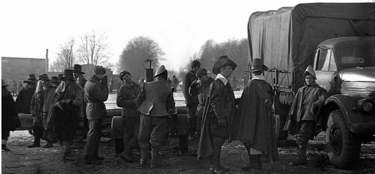
Na planie „Potopu” w Częstochowie, styczeń 1972 roku. Wielu mieszkańców do dziś pamięta tamte chwile

Również postawa Kordeckiego była bardziej pragmatyczna niż opisuje literatura. W początkowej fazie starał się unikać konfrontacji i zabezpieczyć najcenniejsze dobra klasztorne, wywożąc obraz Matki Boskiej i precjoza. Obrona była zorganizowanym przedsięwzięciem militarnym i logistycznym, nie heroiczno-romantycznym spektaklem. Potwierdza to wielu badaczy i popularyzatorów historii.