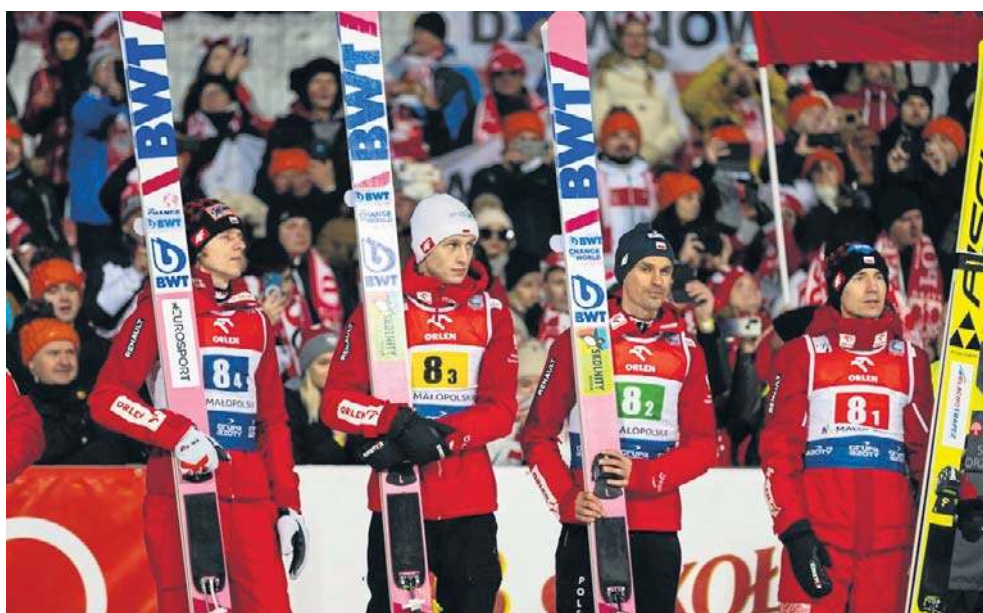
W sezonie 2025/2026 po raz ostatni zobaczymy na skoczni kończącego karierę Kamila Stocha. Trzykrotny mistrz olimpijski u progu sezonu jest liderem reprezentacji Polski