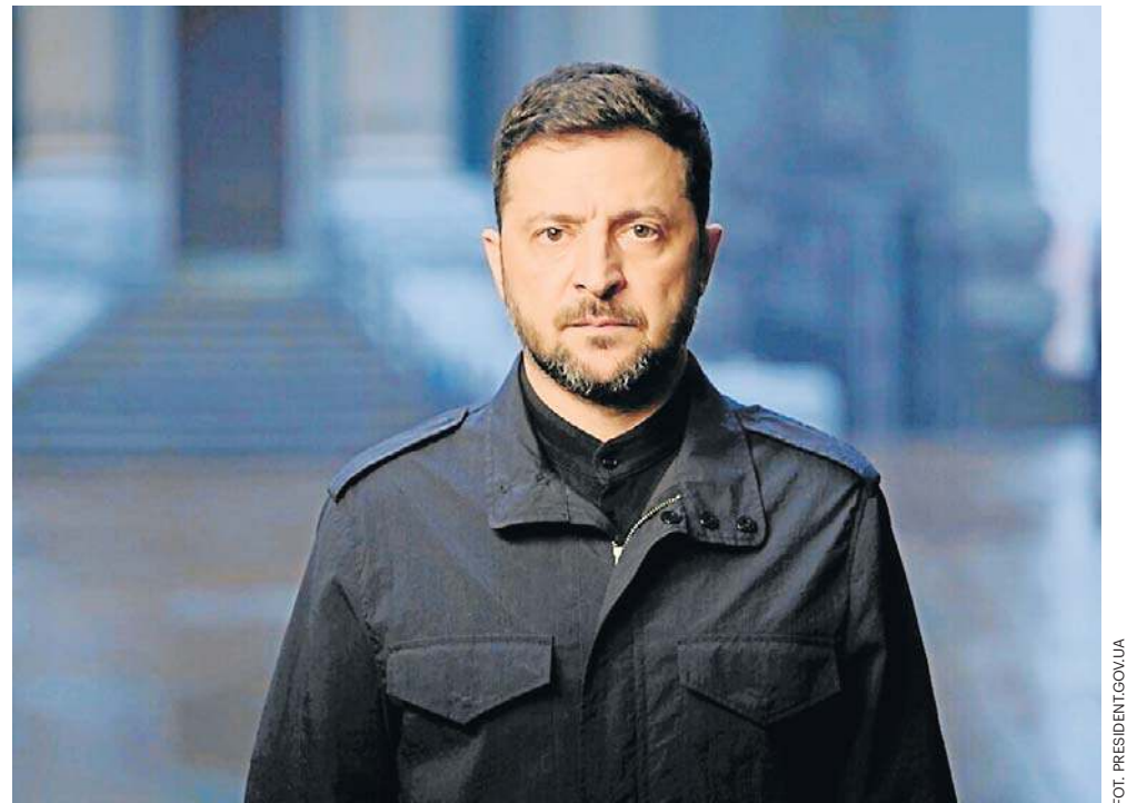
Prezydent Wołodymyr Zełenski oświadczył, że nie zdradzi Ukrainy teraz, tak jak nie zdradził jej w lutym 2022 roku

Zapewnił, że Ukraina spokojnie i odpowiedzialnie współpracuje z USA i partnerami europejskimi ws. zaproponowanego