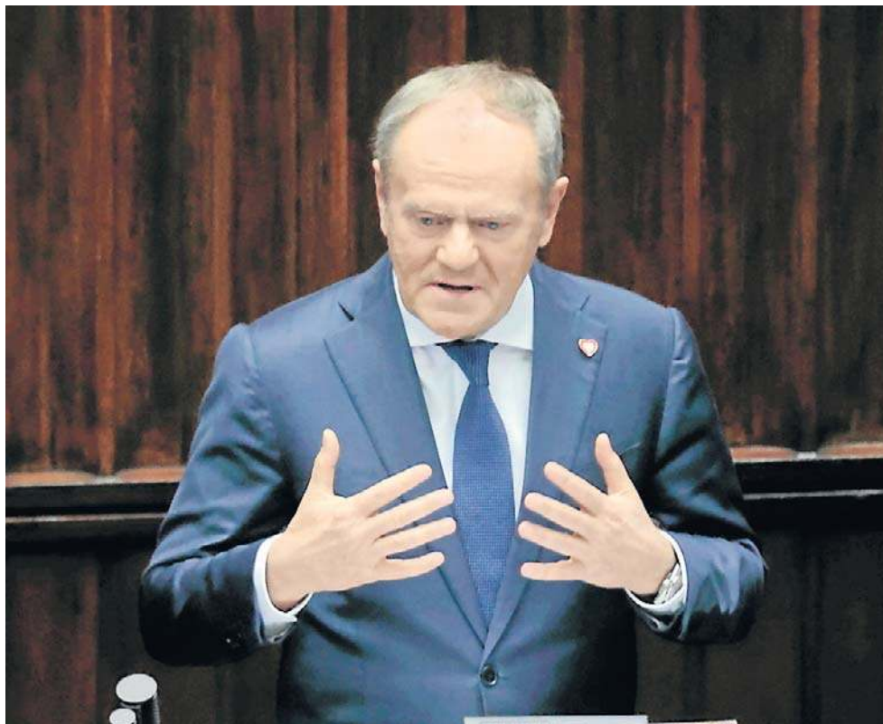
Premier Donald Tusk weźmie w tym tygodniu udział w nieformalnym posiedzeniu szefów państw i rządów UE ws. Ukrainy

Wcześniej premier odbył rozmowę telefoniczną z Zełenskim, w której prezydent Ukrainy „przedstawił swoje stanowisko wobec amerykańskiej propozycji pokojowej” i zaznaczył, że „Rosja nie może narzucić Ukrainie i Europie swoich warunków”.