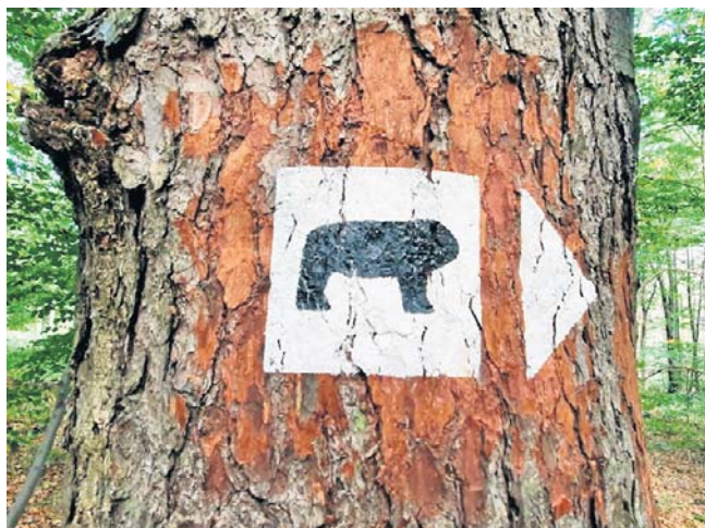
Celtycki Olimp. Szlak Archeologiczny