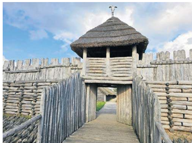
Biskupin, brama grodu

śle, że u Gotów mogło być podobnie. Mężczyźni ruszali na południe, kobiety zostawały w rodzinnych osadach, bogato wyposażone w dary z dalekich stron, wychowując dzieci. Jednak ta interpretacja to tylko próba rekonstrukcji, układanie opowieści z ledwie słyszalnych „szepców przeszłości”.