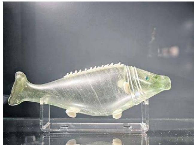
Szklana rybka, prawdopodobnie flakonik

Tego nigdy się nie dowiemy. Kiedy opowiadam o historii Gotów, lubię porównywać ją do fali emigracji zarobkowej z początku XXI wieku. Wiele osób, głównie mężczyzn, wyjechało wówczas do Holandii czy Wielkiej Brytanii w poszukiwaniu lepszego życia. Jedni wrócili po latach, budując domy z zarobionych za granicą pieniędzy, inni zostali na obczyźnie na zawsze, zakładając nowe rodziny. My-