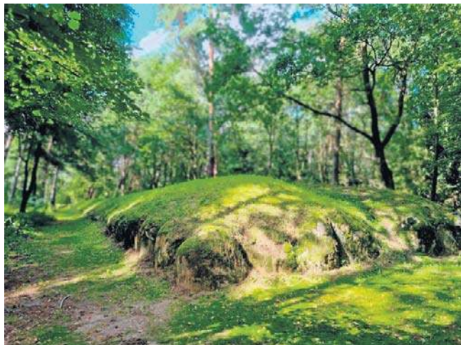
Grobowiec megalityczny w Wietrzychowicach