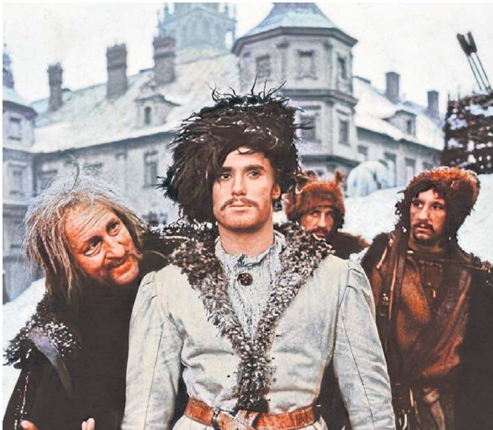
Kadr z filmu „Potop Redivivus” w reżyserii Jerzego Hoffmana