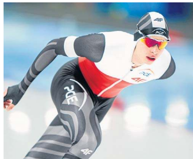
3000, 5000 i 10 000 metrów - na tych dystansach Władimir Semirunnij dzierży aktualne rekordy Polski

Pewnie, Lewandowski nie jest najłatwiejszym człowiekiem, dla trenerów też nie jest - delikatnie określając - bezproblemowy w prowadzeniu, ale zamiast porównywać go do innych zawodników, a zwłaszcza naszych reprezentantów, lepiej zastanowić się, czy ktokolwiek, osiągając jego sportową klasę i pozycję, a także materialny status, byłby trudny w obejściu w stopniu porównywalnym do RL9, czy może jednak odleciałby już do sąsiedniej galaktyki? Bo Robert przy swojej futbolowej wielkości i gigantycznym majątku, którego dorobił się na największych piłkarskich arenach Europy i nieuniknionej przy tym kalibrze osiągnięć ekscentryczności, ma regularny