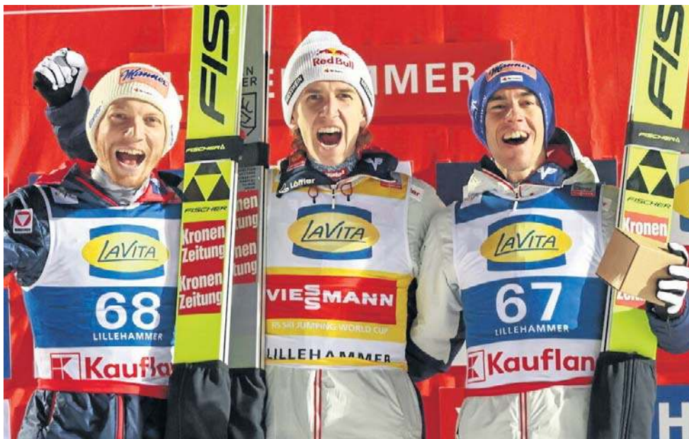
W sobotę dominowali Austriacy. Od lewej: Jan Hoerl, Daniel Tschofenig i Stefan Kraft