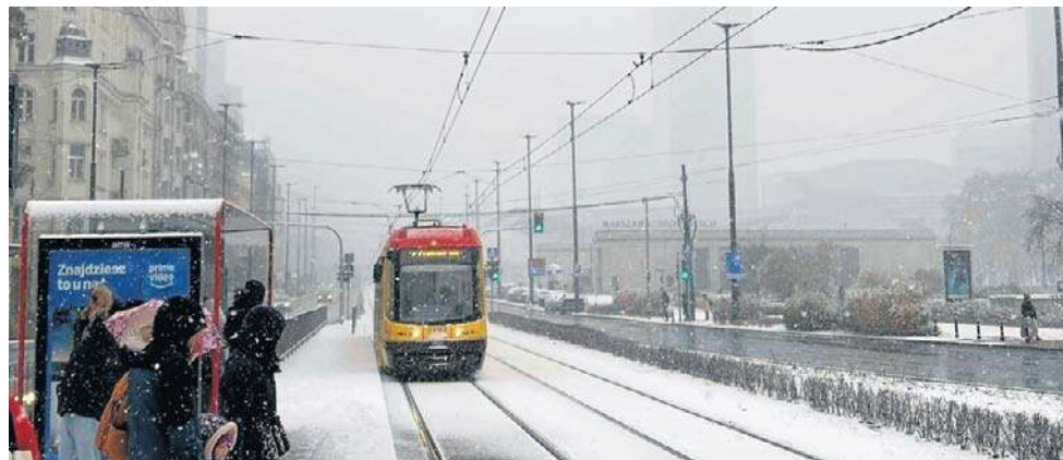
Ulice w nocy zasypało, ale drogowcy działali – dość szybko stały się czarne

Do jednego z bardziej charakterystycznych zdarzeń doszło