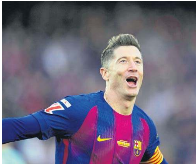
Robert Lewandowski otworzył Camp Nou po remoncie golem przeciwko Athletic Bilbao już w 4. minucie

Trener Hansi Flick dokonał diametralnej zmiany składu z powodu nieobecności Fren-