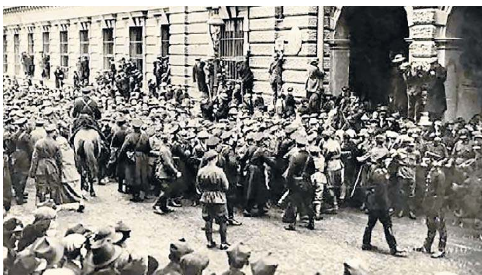
W wydarzeniach krakowskich łącznie zginęło 15 robotników, trzech cywilów niebiorących udziału w walkach oraz 14 żołnierzy. Zginęło też 37 koni

Tego nie wytrzymał jednak dowódca kompanii i pragnąc przywrócić dyscyplinę, goto-