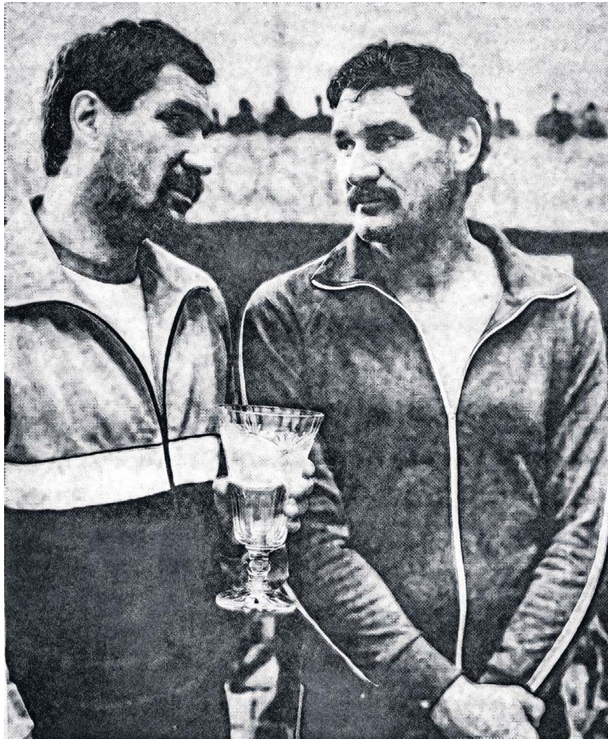
Pięściarstwo było ich pasją. Choć trafili do niego dość późno, szybko nadrobili zaległości i zaczęli dominować na krajowych ringach

Bliźniacy, jak to często w rodzinie bywa, poróżnili się o pienią-