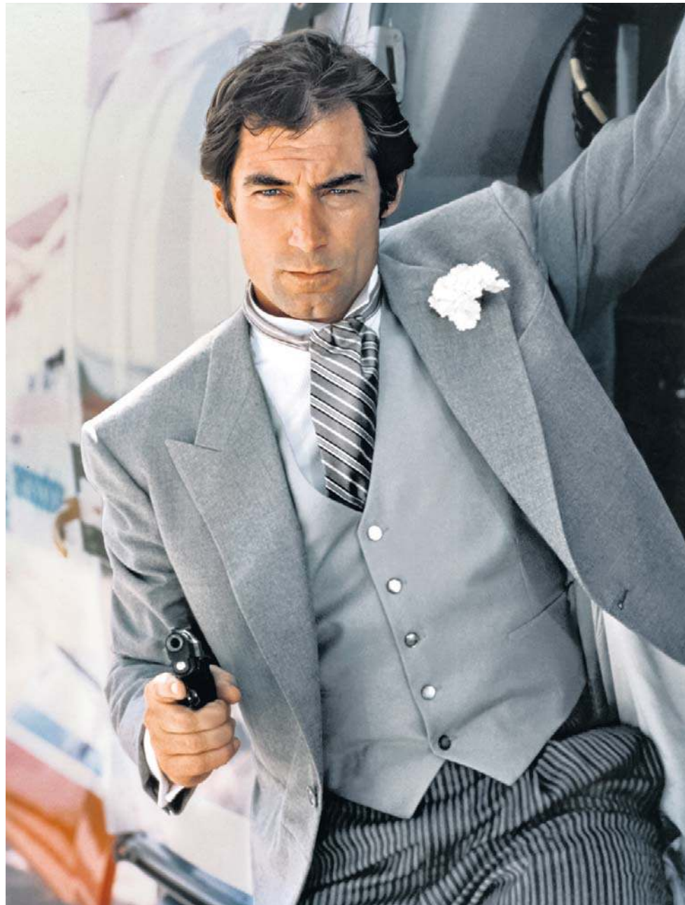
Timothy Dalton nie chciał grać Jamesa Bonda w latach 70. Począł ponad dekadę, wcześniej wcielając się w pana Rochesterę w serialu BBC „Jane Eyre”

Kariera Timothy'ego Daltona przed Bondem potoczyła się tak, że właściwie mało kto wiedział, jak naprawdę wygląda. Zadebiutował, mając dwadzieścia lat, a potem przez kolejne dwadzieścia grał role głównie w filmach historycznych czy kostiumowych. Ostatnio dużo mówiło się o „Wichrowych Wzgórzach” Emerald Fennell, a przecież