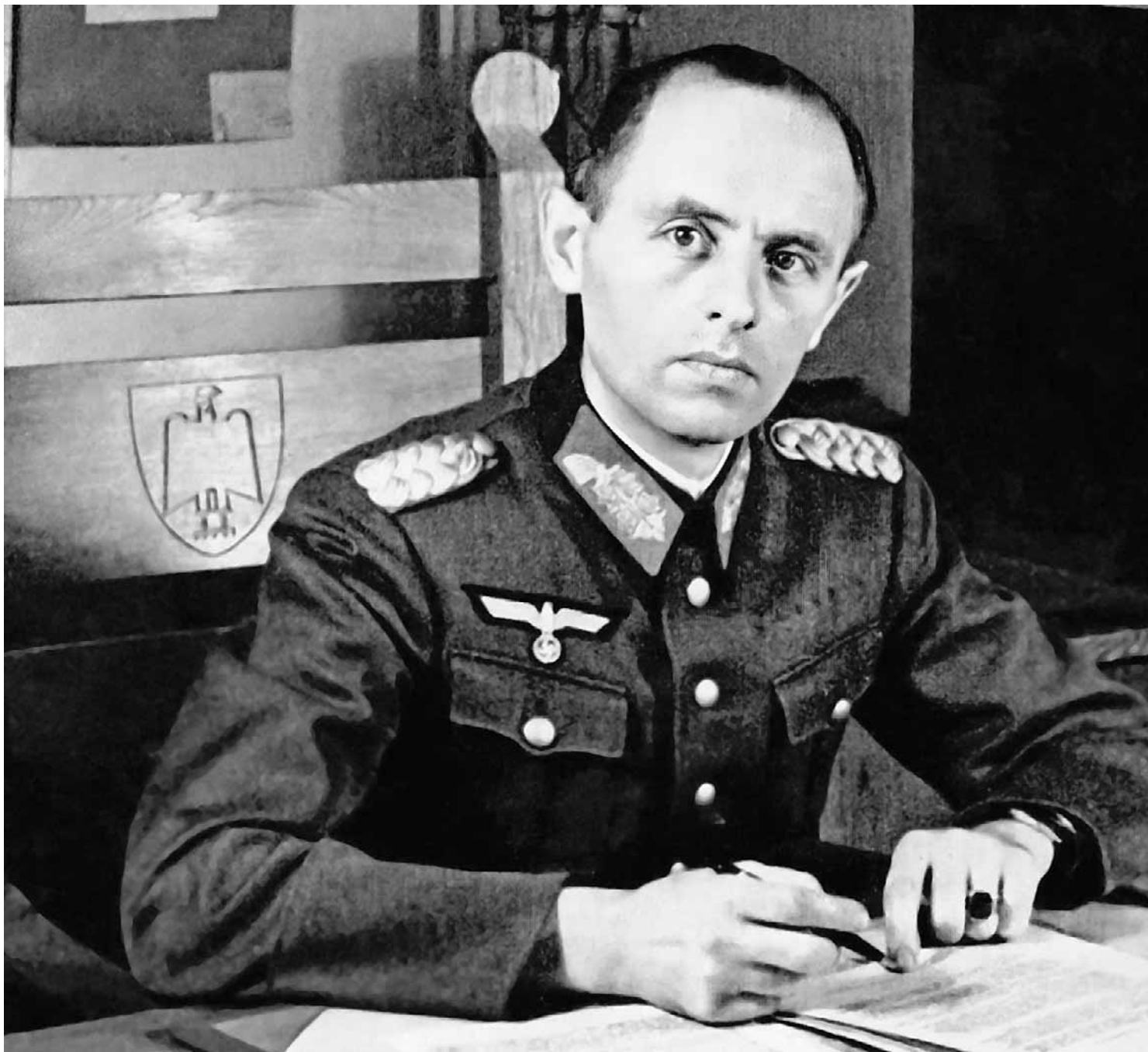
Reinhard Gehlen w czasie służby w sztabie generalnym Wehrmachtu

● Byli szpiedzy Hitlera przeszli po wojnie na usługi USA ● Na początku lat pięćdziesiątych organizowali swoje siatki wywiadowcze na terenie PRL ● W ten sposób przygotowywali się do wybuchu trzeciej wojny światowej