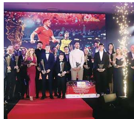
65 lat pasji i emocji – jubileuszowy Bal Sportu i Biznesu w Olsztynie |2-3