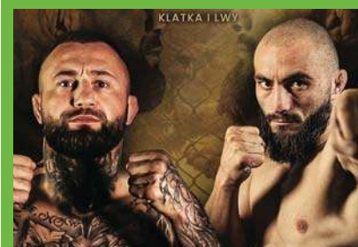
Kłątka i lwy, czyli sobota w Uranii |39