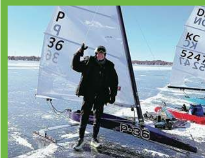
Amerykański sukces Jabłońskiego |37