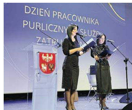
Obchody Dnia Pracownika Publicznych Służb Zatrudnienia |38