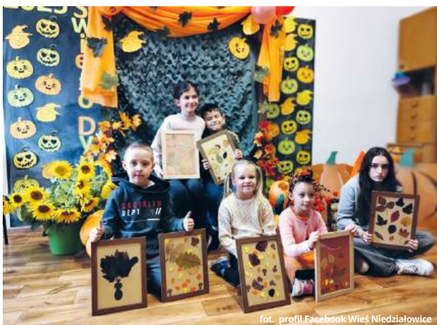
fol. profil Facebook Wieś Niedziałowice

Spolecznicy przyznają, że organizacja tego niezwykle oryginalnego święta jesieni wymagała mnóstwa czasu i zaangażowania. Pot i ciężka praca nie są im jednak obce. Niedziałowice słyną z hartu ducha i walecznego serca. Jeśli już coś robią, to na 100%.