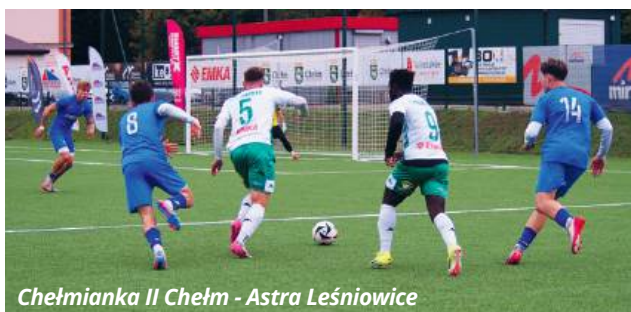
Chełmianka II Chełm - Astra Leśniowice

● PIŁKA NOŻNA Po dziewięciu kolejkach zmagani w chełmskiej klasie okręgowej na fotelu lidera rozgościła się Eko Różanka, która od dłuższego czasu kontynuuje passę zwycięstw.