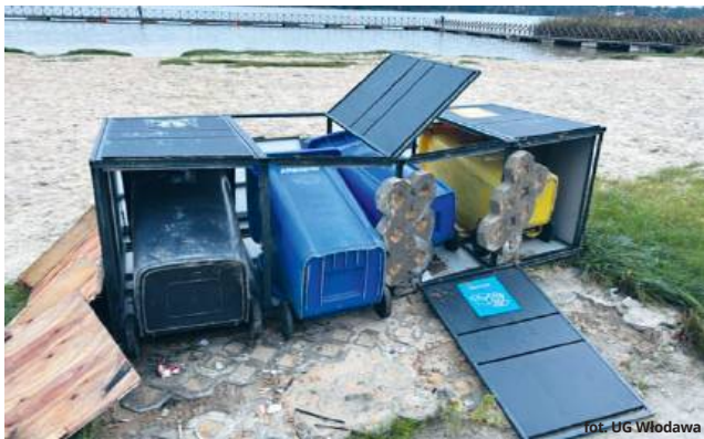
Przewrócone śmietniki to nie są jedyne akty wandalizmu w Okunince w ostatnich tygodniach

Sprawa została zgłoszona odpowiednim organom. Ustaleniem sprawców dewastacji zajmują się funkcjonariusze z Komendy Powiatowej Policji we Włodawie. Jednocześnie urząd gminy apeluje do mieszkańców i przedsiębiorców o wspólną troskę o estetykę Okuninki oraz o zgłaszanie służbom wszelkich przypadków niszczenia mienia publicznego. PG