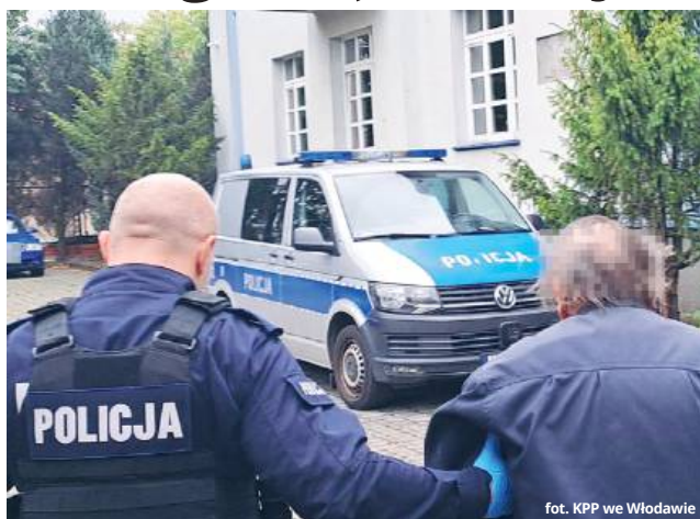
fol. KPP we Włodawie

Zatrzymany trafił do policyjnego aresztu. Usłyszał zarzut znęcania się psychicznego i fizycznego nad rodziną. Na wniosek policji i prokuratury, Sąd Rejonowy we Włodawie zasto-