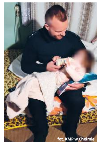
fol. KMP w Chełmie

Policjanci zatrzymali rodziców. Kobieta z obrażeniami ciała została karetką pogotowia przewieziona do szpitala, gdzie udzielono jej pomocy medycznej. Sąd Rodzinny i Nieletnich