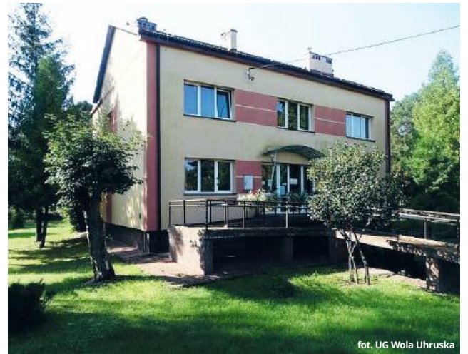
fol. UG Wola Uhruska

Włodarz gminy Wola Uhruska zapewnił, że problem jest znany Narodowemu Funduszu Zdrowia, któremu dwukrot-