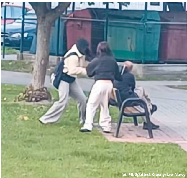
fol. FB: Spotted: Krasnystaw Nowy

W sieci pojawiło się szokujące nagranie sytuacji, która zdarzyła się na jednym z osiedli w centrum Krasnegostawu. Widać na nim, jak dwie nastolatki uderzają mężczyznę jakimś przedmiotem w głowę. Kilkusekundowy film wywołał falę oburzenia wśród mieszkańców powiatu krasnostawskiego, a także wśród internautów. Policja natychmiast rozpoczęła działania w celu ustalenia uczestników zdarzenia, choć formalnego zgłoszenia nie otrzymała.