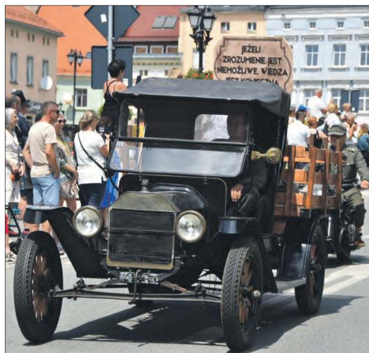
Zmotoryzowana część pochodu