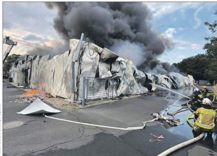
W akcji brało udział blisko 50 zastępów straży pożarnej

W akcji brało udział około 250 strażaków z niemal pół setki zastępów. 7 lipca siły ratunkowe wsparli strażacy z Kompanii Gaśniczej „Prudnik”, w skład której wchodzi po pięć jednostek OSP Krajowego Systemu Ratowniczo-Gaśniczego z powiatów prudnickiego i głubczyckiego. (d) ■