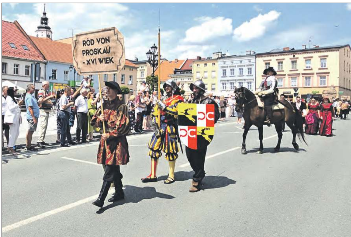
Okres największej świetności Białej – panowanie Prószkowskich.