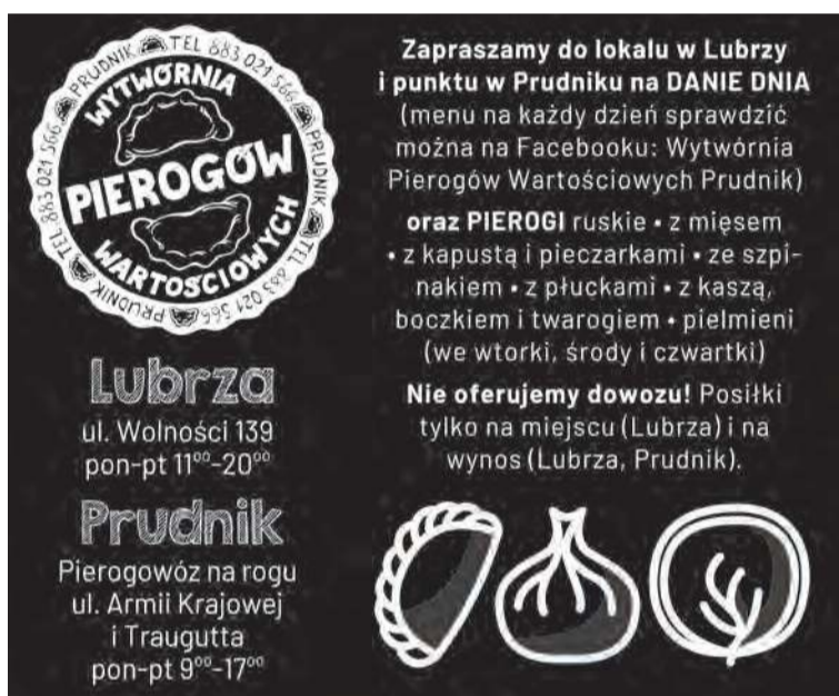
MENU/DANIE DNIA FACEBOOK: Wytwórnia Pierogów Wartościowych

77 436 28 77 | 601 268 421 REKLAMA W „TP” reklama@tygodnikprudnicki.pl