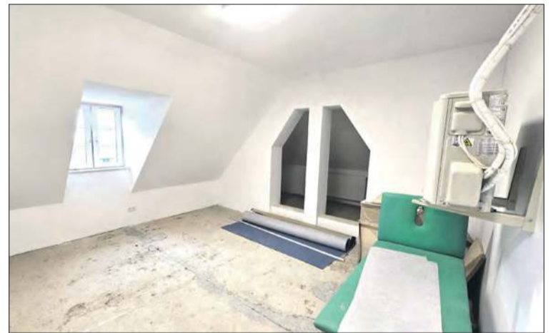
Nowe pomieszczenia dla pacjentów znajdują się na poddaszu budynku

Investycje w ramach projektu dofinansowane zostały z Funduszy Unijnych Krajowego Planu Odbudowy. ■