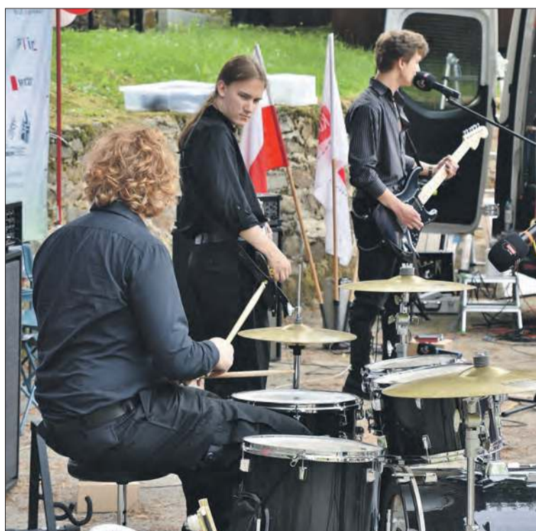
Gościem muzycznym Przystanku był zespół Neustadt z Prudnika

Głuchołaski Przystanek TdK nie podejmował tematów politycznych. Podczas wypowiedzi dyskutantów i publiczności ani razu nie pojawiła się nazwa jakiegokolwiek partii, czy nazwiska działaczy politycznych. ■