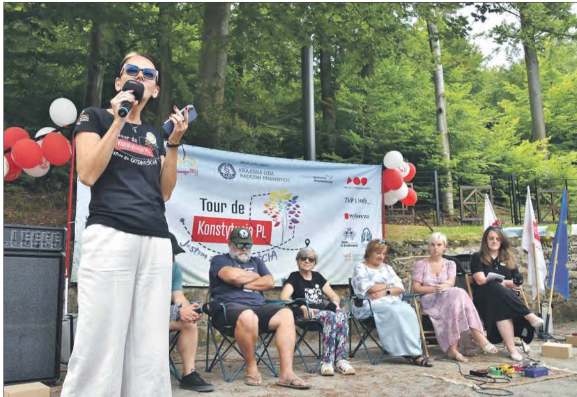
Główną częścią spotkania była debata z udziałem mieszkańców

Hojda mówiąc o idei TdK wspominał o przychodzącym zmęczeniu organizacją trasy, bo przecież podczas wakacji można więcej czasu wolnego poświęcić choćby rodzinie. Jednak nie poddają się: – To wynika z tego, że nam zależy, czujemy się osobami, które nie usiedzą w domu, jeśli widzimy, że nie dzieje się najlepiej, tak, jak byśmy chcieli, mówiąc o państwie demokratycznym, otwartym na obywateli, dla obywateli, ceniącym ich pracę i wkład w to, co państwo uzyskuje dzięki temu, że ci obywatele są, mieszkają w Polsce i