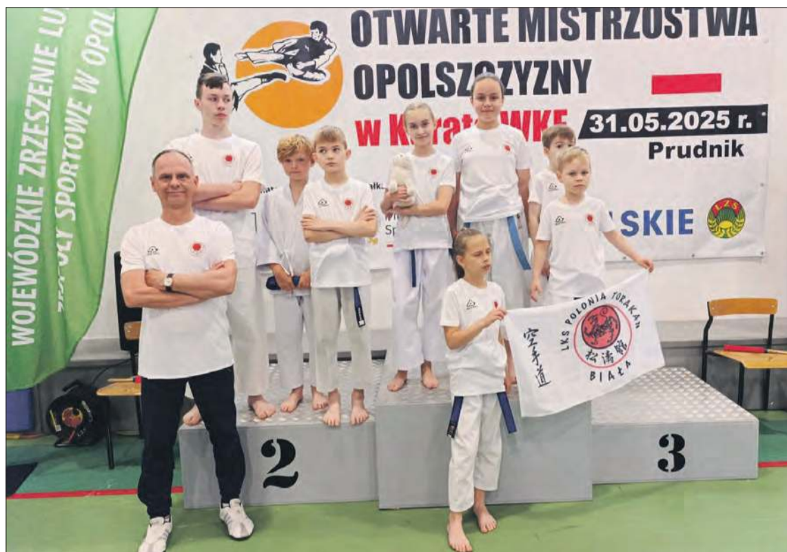
Białscy karatecy z trenerem