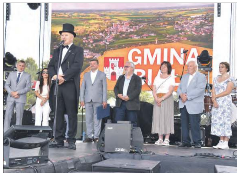
Bez gości oficjalnych nie ma ważniejszej imprezy. Na niedzielne uroczystości przybyli goście również z Niemiec i Rep. Czeskiej.