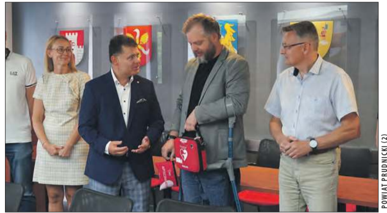
Oficjalne przekazanie nowego sprzętu

Defibrylatory zostały sfinansowane ze środków własnych Powiatu Prudnickiego. Koszt zakupu urządzeń to 13 251,60 zł. ■