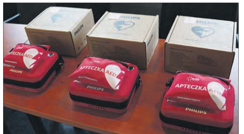
Defibrylatory mogą uratować życie

Defibrylator AED to urządzenie medyczne, które analizuje rytm serca osoby z zatrzymaniem krążenia i w razie potrzeby dostarcza impuls elektryczny, aby przywrócić prawidłowy rytm serca. AED jest zaprojektowany tak, aby mogła go używać nawet osoba bez przeszkolenia medycznego, ponieważ prowadzi użytkownika przez proces defibrylacji za pomocą komend głosowych i wizualnych.