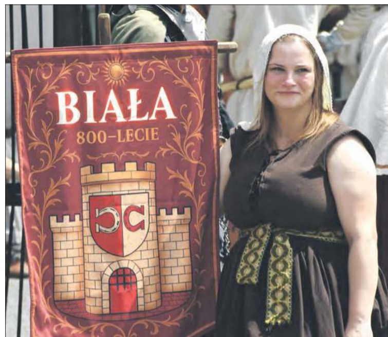
Bielszczanie dumni są ze swojej historii