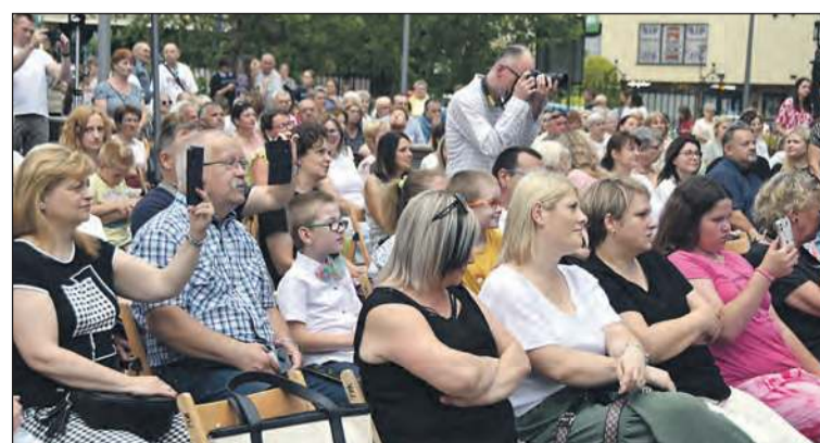
Koncert zgromadził bardzo dużą publiczność