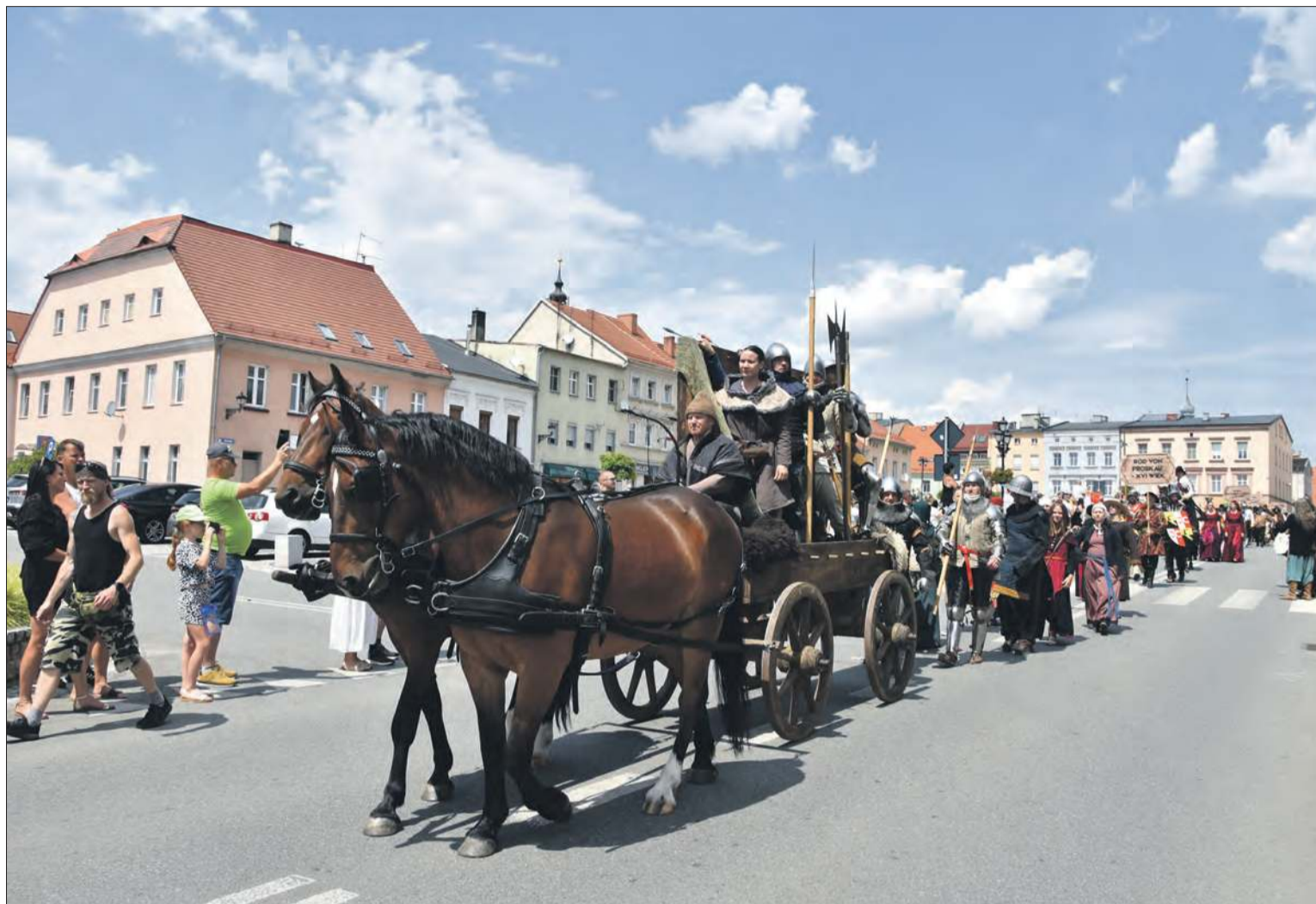
Wojska kacerzy z Czech przypominają husycki epizod w dziejach Białej. Miasto znajdowało się w księstwie Bolka V, który wsparł „bożych wojowników”.

Tak jak to było 100 lat temu, 6 lipca 2025 roku, przez Białą przemaszerował pochód postaci związanych z kilkusetletnią historią miejscowości. Kolejne takie wydarzenie może się powtórzyć za następne 100 lat.