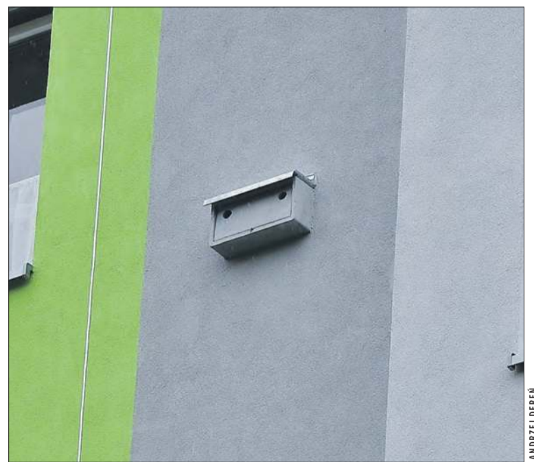
Jedna z ptasich budek

N a bloku przy ul. ks. Koziółka w Prudniku pojawiły się dwie budki lęgowe dla ptaków, o czym poinformował nas pan Marcin. Dla jakich ptaków, to już szanowni czytelnicy będą wiedzieli lepiej. To dobre rozwiązanie, bo modernizację budynków skutecznie ograniczają populacje ptaków w miastach. Gniazda we wnękach okiennych, czy pod dachami, likwiduje się, ponieważ ptaki brudzą odchodami parapety i elewacje. Tymczasem większość ptaków spełnia pożyteczną rolę, choćby w ograniczeniu liczebności komarów i kleszczy (większe również gryzonie). Tak więc gratulacje za inicjatywę i więcej takich działań! (d) ■