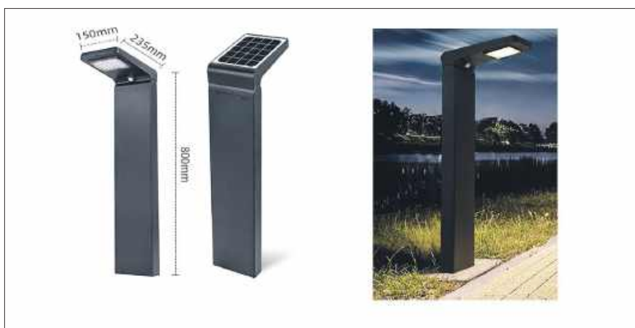
Oświetlenie – wariant 2.