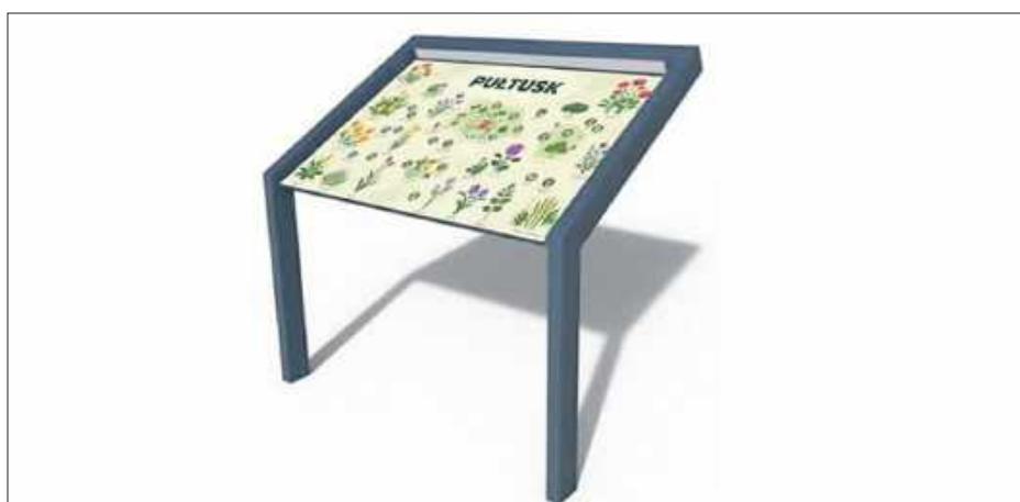
Tablice informacyjne – wariant 2 tj. forma pulpitu,