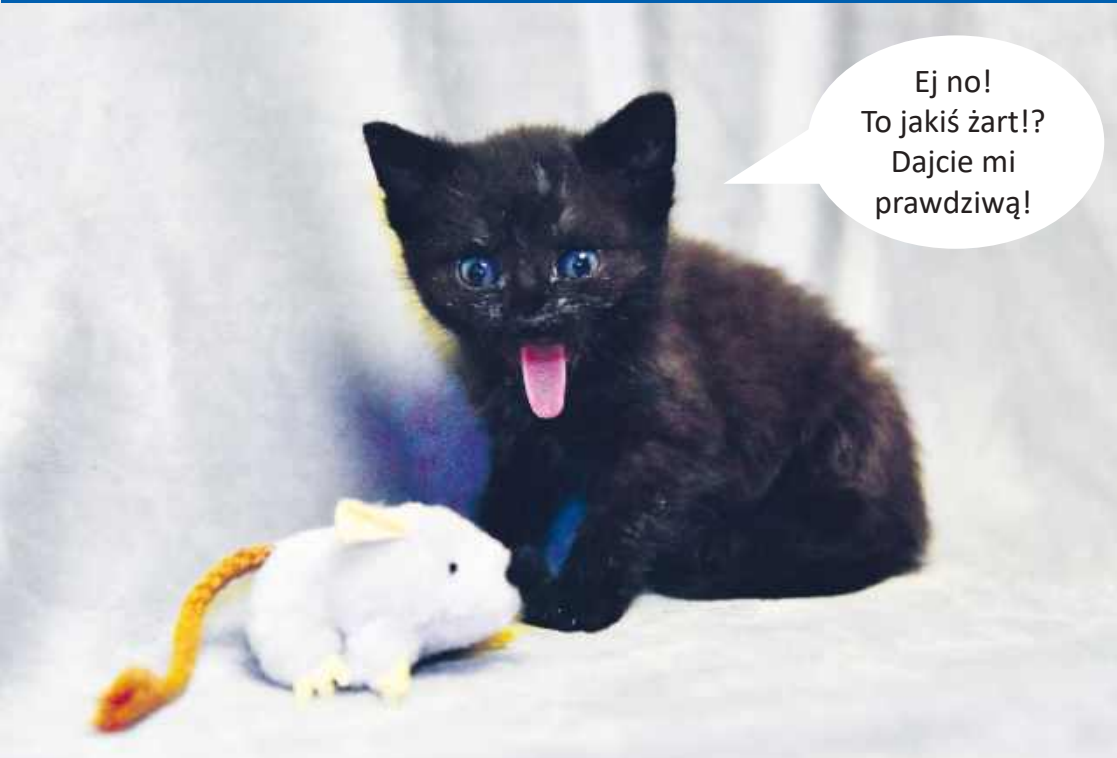
FOTO NA WESOŁO