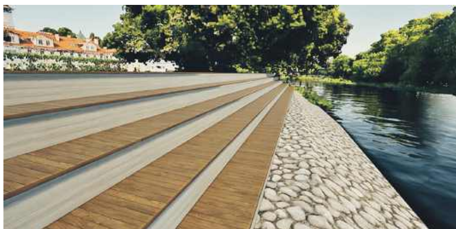
Ławki skarpowe – wariant 1, z uwzględnieniem schodów z wykończeniem z kompozytu,