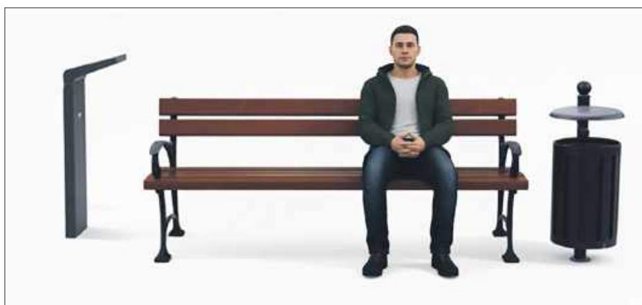
Ławki – wariant 2,