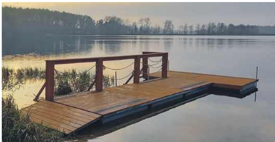
Pomosty – wariant 2, pływające, płytke.