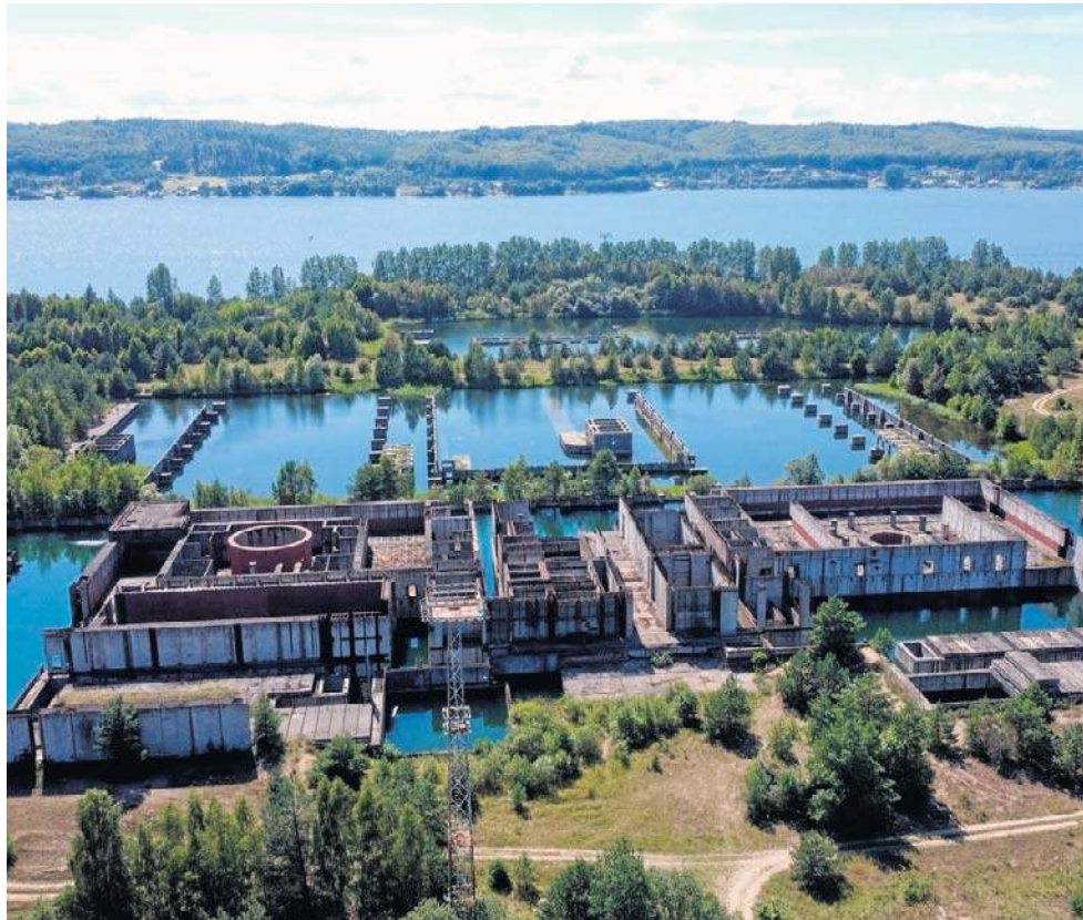
17 grudnia 1990 r. rząd Tadeusza Mazowieckiego podjął uchwałę o postawieniu inwestycji „Elektrownia Jądrowa Żarnowiec w budowie” w stan likwidacji

Gdy uchwalano prawo „atomowe”, budowa w Żarnowcu trwała już ponad trzy lata. W 1982 r. wysiedlono część mieszkańców przydzielając im, w ramach rekompensaty, ziemię i domy w niedalekim Odargowie. Na 70 hektarach przeznaczonych pod elektrownię gruntów ruszyły prace budowlane. Budynków miało powstać