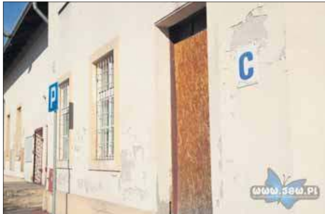
Budynek dworca w Szczakowej zamknięto w grudniu 2011 roku. Od tego czasu nie jest użytkowany

„Głównym czynnikiem decydującym o zakwalifikowaniu (bądź nie) danego dworca do programu jest średnia liczba podróżnych korzystających z danej sta-