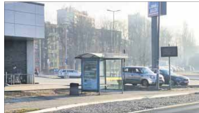
Przystanek Osiedle Stałe Kalinowa

To właśnie w zatokach autobusowych nawierzchnia niszczy się szczególnie szybko. Pojazdy wielokrotnie hamują i zatrzymują się w tych samych miejscach. Po czasie