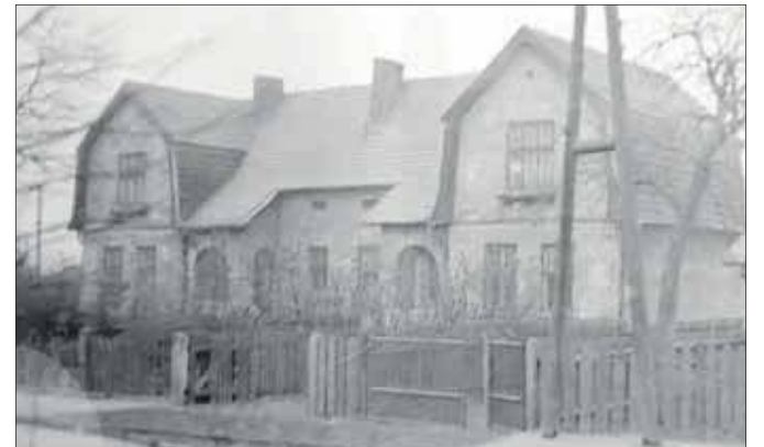
Dom na Chrustach, w którym moi dziadkowie mieszkali przez wiele lat, do początku lat 80. XX wieku (MMJ)

Faszerowana papryka w pomidorowym sosie nie jest już dziś czymś nadzwyczajnym, stanowiąc dość powszechny substytut takiego czy innego menu. Ale dawniej... Cóż, dawniej. Danie to w naszej rodzinie było prawdziwym rarytatem. Ja osobiście uwielbiałem je od dzieciństwa.