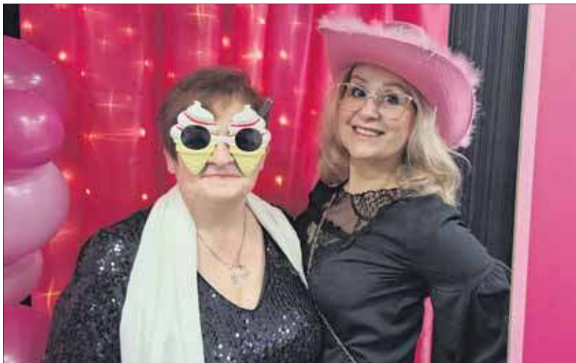
Zdjęcie na ścianie

Świętowanie tegorocznego Dnia Kobiet trwało w najlepsze parę dni. Był to czas niekończących się najserdeczniejszych życzeń, arcoryginalnych prezentów i niczym wisienka na torcie miejskiej potańcówki. Tę przygotowało MCKiS w swojej hali. Bawiono się w piątek 6 marca od 20.00 do 2 w nocy. I choć nie była to zabawa do białego rana, a i strzeżeniowego nie podano, to potańcówka wyszła świetna. Wprawdzie pan pojawił się bodaj jeden, a więc do białego walca nie było kogo prosić, to i tak Jaworzniarki ubawiły się setnie.