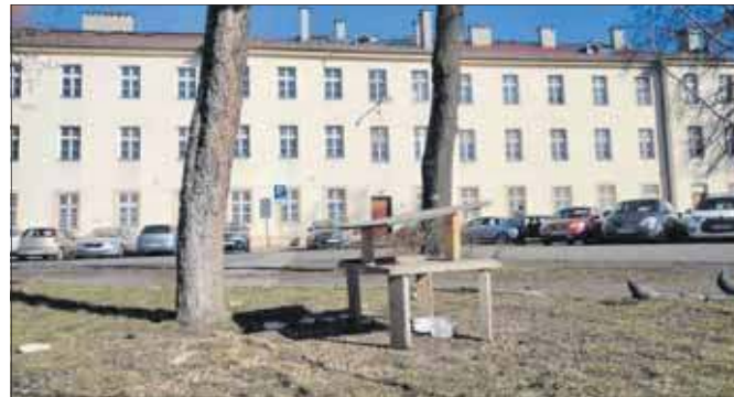
Rozrzucony chleb

Generalnej Dyrekcji Ochrony Środowiska, dokarmianie ptaków powinno mieć miejsce wyłącznie w okresie późnej jesieni i zimy. Dopiero wtedy, gdy występują trwałe mrozy, zalega śnieg, a zbiorniki wodne są skute lodem.