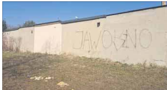
Chleb rozrzucony obok garaży na Osiedlu Podłęże