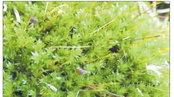
Mech z rodziny płoniowcowatych

Zanim doszliśmy do właściwego punktu startu, zauważyliśmy, że tym razem Kozi Bród tutaj płynie. Poza tym natrafiliśmy na fenologiczną oznakę nadchodzącego przedwiosnia pod postacią pyłającej leszczyny. Na krzewie były również widoczne słupki kwiatów żeńskich. Lewy brzeg Białej Przemszy na znacznej długości jest stromy. To wrażenie potęguje mniejszy poziom wody po tym, jak utraciła ona swoje wielkie dolewki, w tym z Sztoły. Blisko rzeki z drzew dominują olsze czarne. Pojawiają się jesion wyniosły, klon zwyczajny oraz czeremcha zwyczajna. Na mniej lub bardziej rozległych równinach dominują sosny zwyczajne. Pomiędzy nimi trafiają się brzozy brodawkowate, topole osiki, dęby czerwone oraz