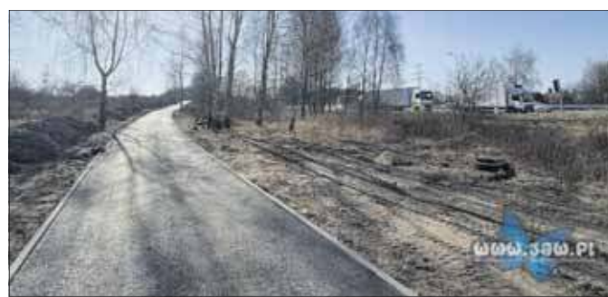
Budowa drogi rowerowej w Byczynie

Inwestycja zaczęła nabierać wyraźnych kształtów, a już pod koniec ubiegłego roku widać było przebieg przyszłej drogi rowerowej. Pojawiły się gotowe krawężniki, podbudowa, a także pierwsze fragmenty asfaltu. Trasa biegnie przez pola wzdłuż