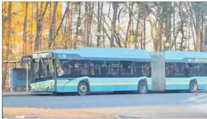
Autobus 370 w kierunku Wysokiego Brzegu

Chodzi o dwie linie, które kursują na elektrownię. Autobus 328 jeździ na odcinku Szczakowa Dworzec PKP – Elektrownia Parking, a 370 jeździ na trasie Krakowska Pętla – Wysoki Brzeg Pętla i zatrzymuje się m.in. na przystankach: Elektrow-