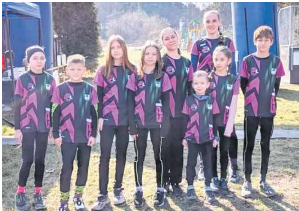
Zawodnicy SPL Jaworzno w biegu Tropem Wilczym