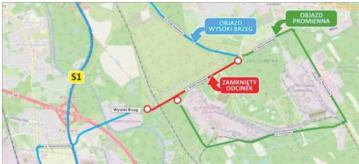
Zmiana organizacji ruchu

Wykonawcą zadania w formule „zaprojektuj i zbuduj” jest konsorcjum Mirbud SA oraz Kobylarnia SA. Miasto podaje, że inwestycja dostała 222,6 mln zł dofinansowania z rzą-