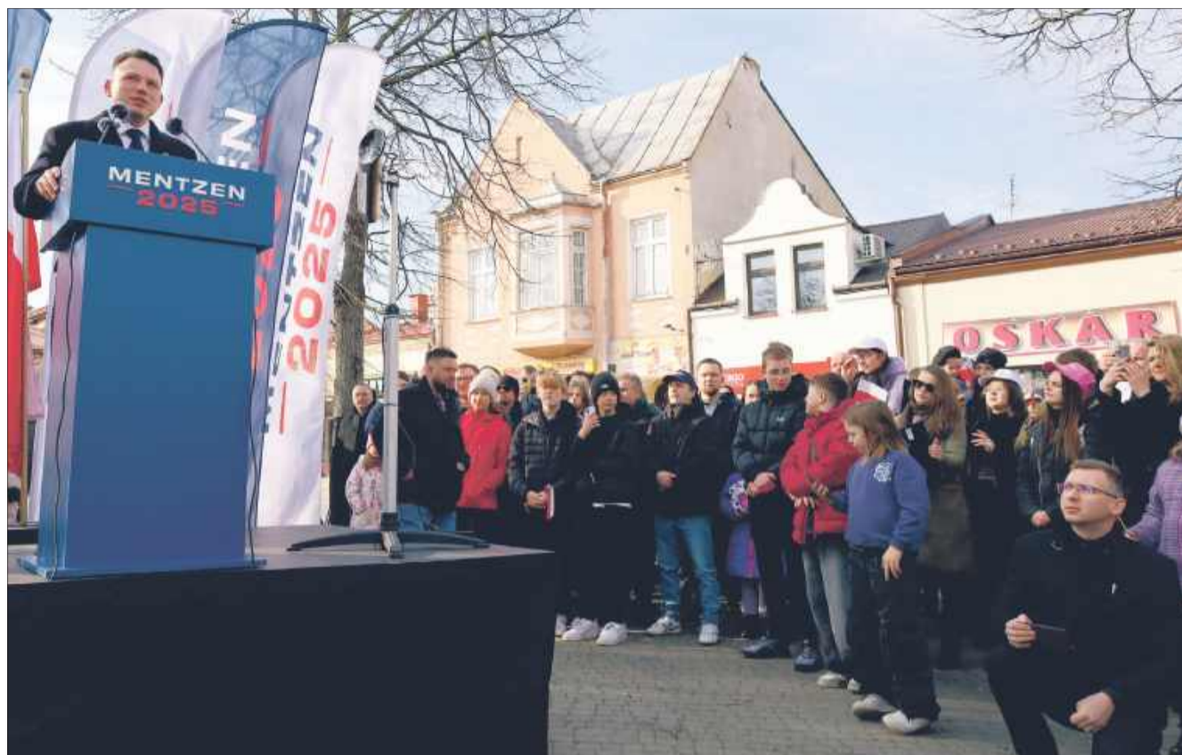
Kolbuszowa była jednym z kilku miejsc na Podkarpaciu, które odwiedził Sławomir Mentzen.

W niedzielę, 23 lutego, o godz. 14 kolbuszowski rynek stał się miejscem gorącej politycznej debaty. Sławomir Mentzen, kandydat na Prezydenta RP z ramienia Konfederacji, przyciągnął tłumy mieszkańców Kolbuszowej i okolic, którzy przyszli wysłuchać jego wystąpienia.