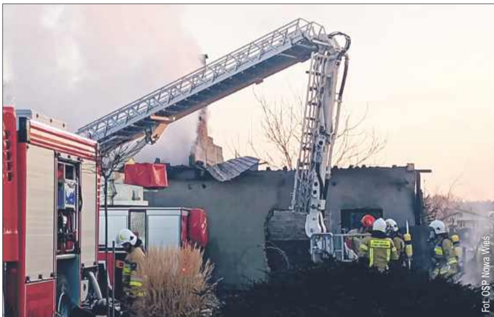
Zgłoszenie wpłynęło po godzinie czwartej rano.