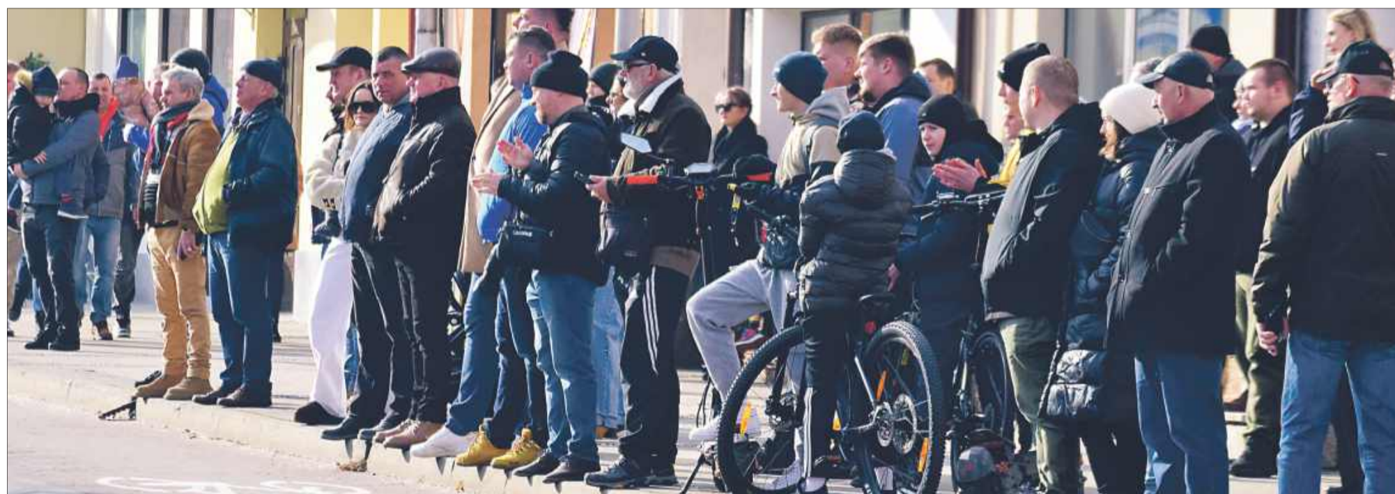
Wysłuchać wystąpienia Sławomira Mentzena było bardzo wielu.

Wybory prezydenckie w Polsce odbędą się 18 maja 2025 roku. Decyzję tę ogłosił marszałek Sejmu, Szymon Hołownia, 15 stycznia 2025 roku. bp