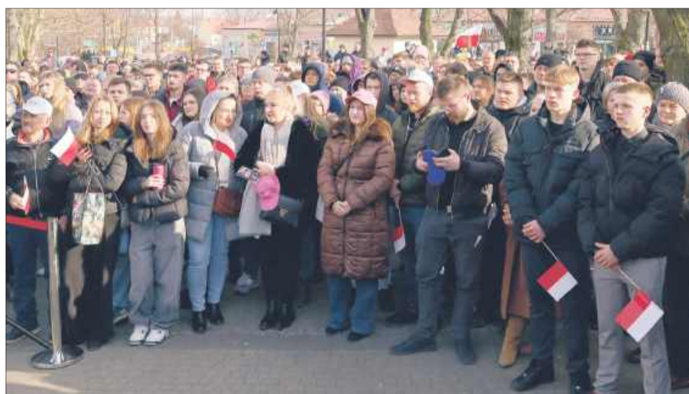
Wśród tłumów zauważalną częścią byli młodzi ludzie.