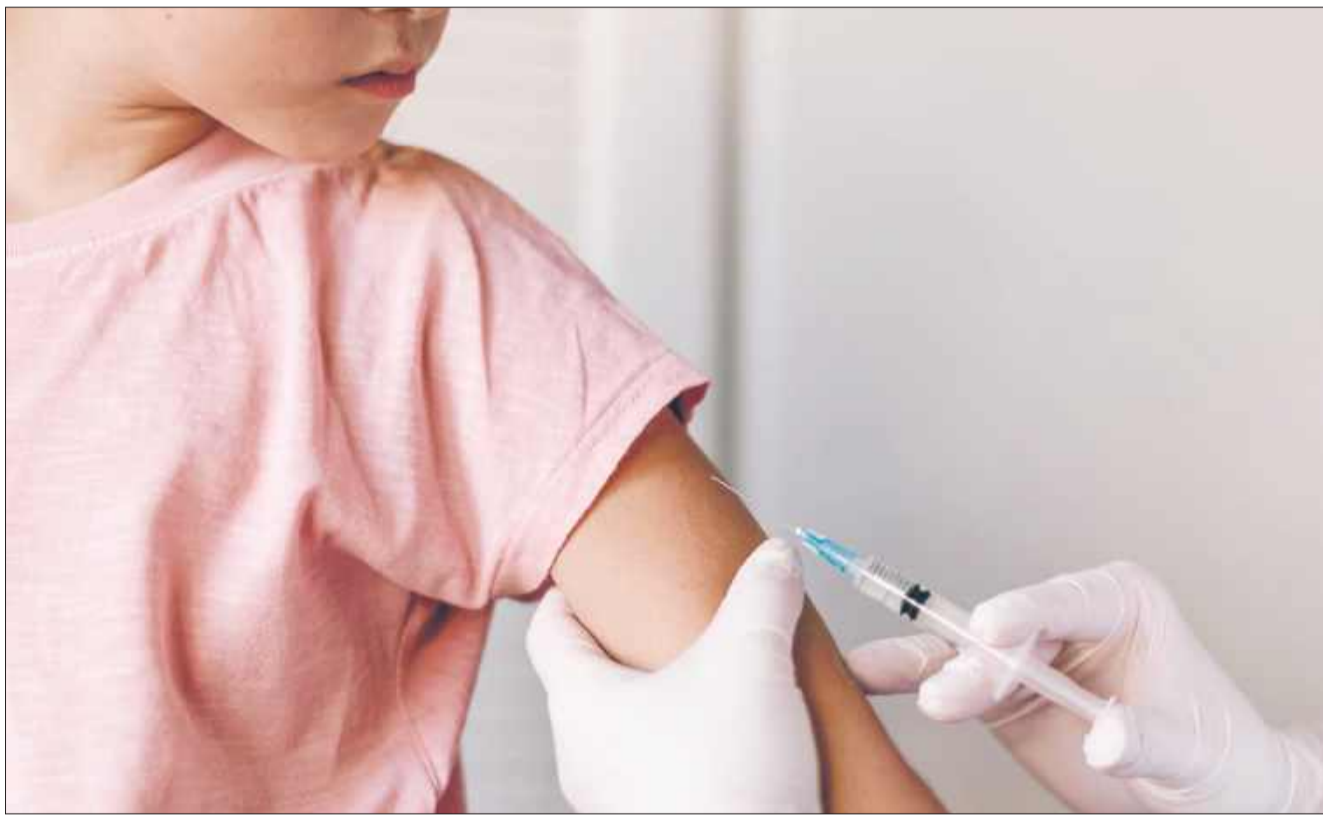
Główny Inspektorat Sanitarny (GIS) rozpoczyna szeroko zakrojoną kontrolę stanu wyszczepienia dzieci w Polsce.

- Przygotowanie do wdrożenia elektronicznej karty szczepień – obecnie dane o szczepieniach są prowadzone w formie papierowej, co utrudnia ich ana-