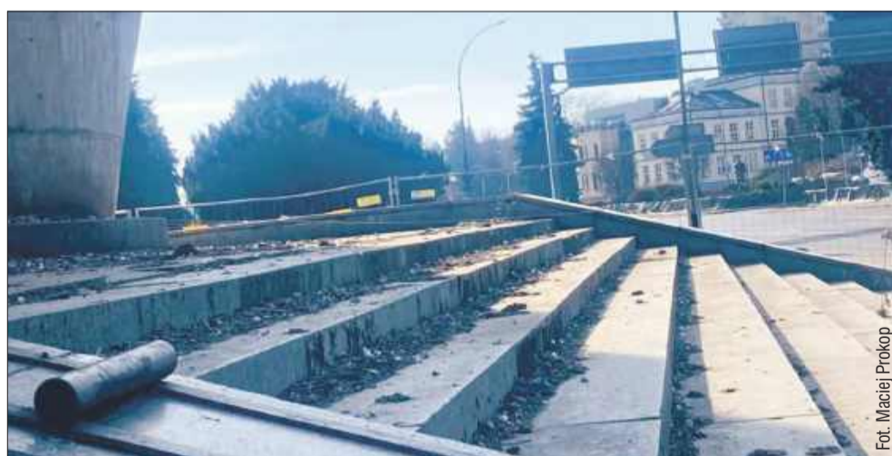
Symbol Rzeszowa tonie w ptasich odchodach.

Pomnik Czynu Rewolucyjnego w Rzeszowie to jeden z najbardziej charakterystycznych i rozpoznawalnych obiektów w mieście. Choć dla wielu mieszkańców jest symbolem Rzeszowa, od lat budzi liczne kontrowersje – zarówno ze względu na swoją historię, jak i obecny stan techniczny. Niedawna zmiana właściciela obiektu rozbudziła nadzieje na jego remont lub zagospodarowanie terenu wokół niego. Tymczasem zamiast poprawy, mieszkańcy zwracają uwagę na coraz bardziej zaniedbany wygląd pomnika. Szczególnie odrażający jest problem zalega-