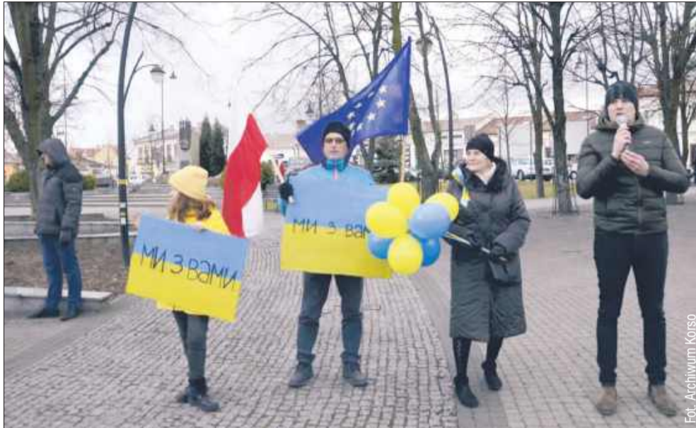
24 lutego 2022 roku wybuchła wojna w Ukrainie.

Władimir Putin ogłosił 24 lutego 2022 roku rozpoczęcie operacji wojskowej w Donbasie. - Ci, którzy będą próbowali nam przeszkodzić, spotkają się z odpowiedzialnością militarną, która doprowadzi do konsekwencji, z jakimi się nie spotkaliście. Jesteśmy gotowi na wszystko - powiedział. Pierwsze strzały padły kilkadziesiąt minut po rozkazie Putina. Do eksplozji doszło m.in.