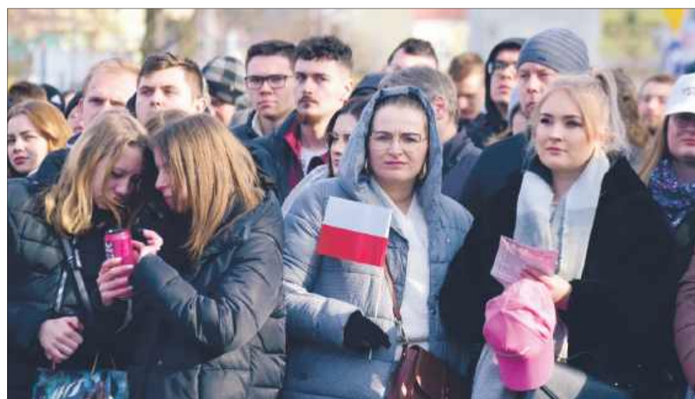
Na spotkanie z kandydatem na prezydenta bardzo licznie przybyli mieszkańcy.