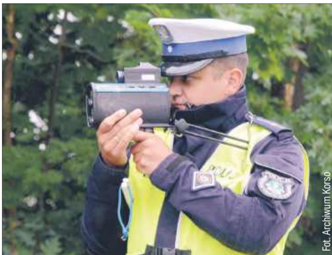
Kierowca został zatrzymany w Kamionce.

Za swoje nieodpowiedzialne zachowanie 55-latek z powiatu kolbuszowskiego zapłaci wysoką cenę. Policjanci ukarali go mandatem w wysokości 2000