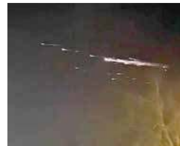
Kosmiczny spektakl nad Goleniowem

W lutym ubiegłego roku ogłoszony został przetarg na dzierżawę miejsc pod budowę ogólnodostępnych, szybkich stacji ładowania pojazdów elektrycznych i pełnienie roli operatora oraz dostawcy usług ładowania na trzydziesty jednej Miejscach Obsługi Podróżnych w całej Polsce. W powiecie goleniowskim planowana jest budowa dwóch takich miejsc – Przybiernów Zachód oraz Wschód. GDD-KiA na oferty czekał do 1 kwietnia 2025 roku. Okres dzierżawy to 20 lat z możliwością przedłużenia o kolejne 5 lat.