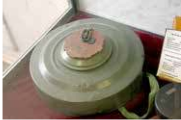
Materiały wybuchowe jeździły po całej Polsce

Na początku stycznia roku 2025 nowogardzcy Błękitni Rycerze pokazali prawdziwie rycerskiego ducha w Goleniowie. Pomogli oni starszej mieszkance Goleniowa, która znalazła się w trudnej sytuacji. Jedną z członkiń Klubu przekazała jej drewno na opał, tak konieczne w zimowych chłodach. Pozostali zaś Rycerze szybko i sprawnie zorganizowali transport drewna. Porąbali je w wygodne kawałki, gotowe do posłużenia jako opał oraz wnieśli to wszystko do mieszkania kobiety. Udało się więc zadbać o ciepło w domu potrzebującej osoby. Klub ten regularnie angażuje się w pomoc charytatywną oraz wolontariat. To był pozornie prosty gest pomocy – ot kilku znajomych skrzyknęło się aby pomóc potrzebującej. Jednak takie właśnie proste gesty pokazują dobroć i wielkie serca.