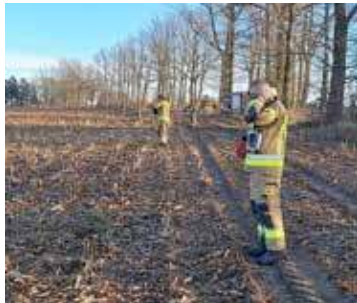
Strażacy z Goleniowa i Przybiernowa zlikwidowali fermę indyjską