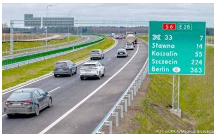
Pierwsze pojazdy na drodze S6

leniowa do końca obwodnicy Słupska. Nowa trasa połączyła województwa skracając czas przejazdu i wyprowadziła ruch tranzytowy z szeregu miejscowości położonych przy dotychczasowej DK6.