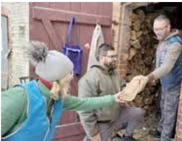
Rycerska pomoc z Nowogardu