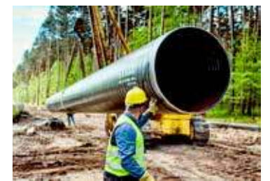
Gazociąg Goleniów-Police został ukończony

właśnie ów obiekt, spalany przez tarcie atmosferyczne, był widziany na niebie. Jego fragmenty dotarły do powierzchni ziemi i zostały znalezione m.in. w okolicach Poznania. Trajektoria jego lotu była znana Polskiej Agencji Kosmicznej oraz europejskim służbom odpowiedzialnym za monitorowanie ryzyka wejścia w atmosferę Ziemi sztucznych obiektów kosmicznych. Co nie oznacza, że nie doszło jednak do pewnej żenującej wpadki. Otóż informacja o tym ryzyku została wysłana z Polskiej Agencji Kosmicznej do Ministerstwa Obrony Narodowej... pod nieaktualny adres e-mail. Cóż, dobrze że stało się to przy incydencie w którym nikt nie został poszkodowany. Ten kosmiczny spektakl widziany był nie tylko z Goleniowa, ale również z innych miejsc w Polsce oraz poza nią.